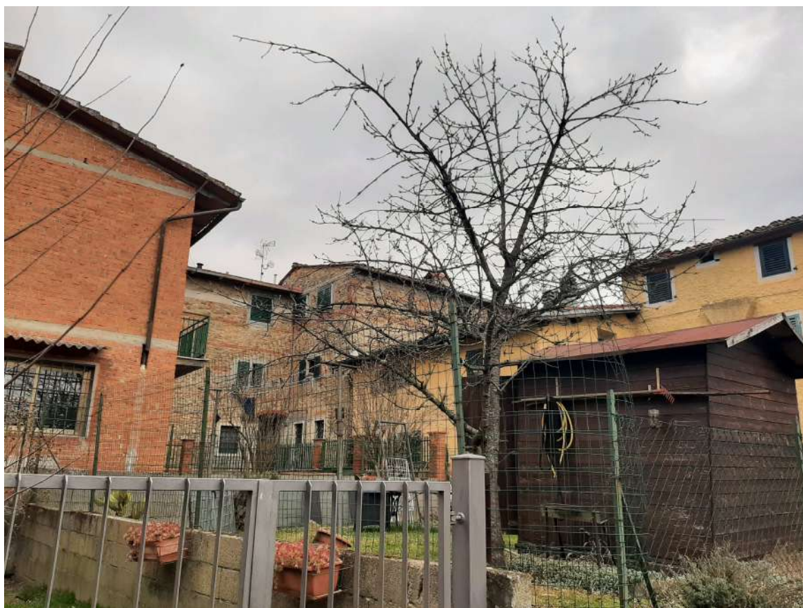
VISTA DALLA STRADA PUBBLICA