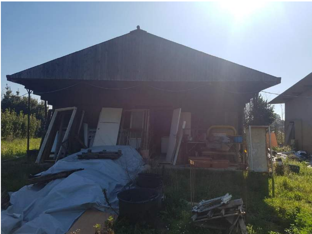
Foto 12- Immobile attualmente utilizzato a deposito sub. 4 (immobile n. 6 del progetto divisionale)