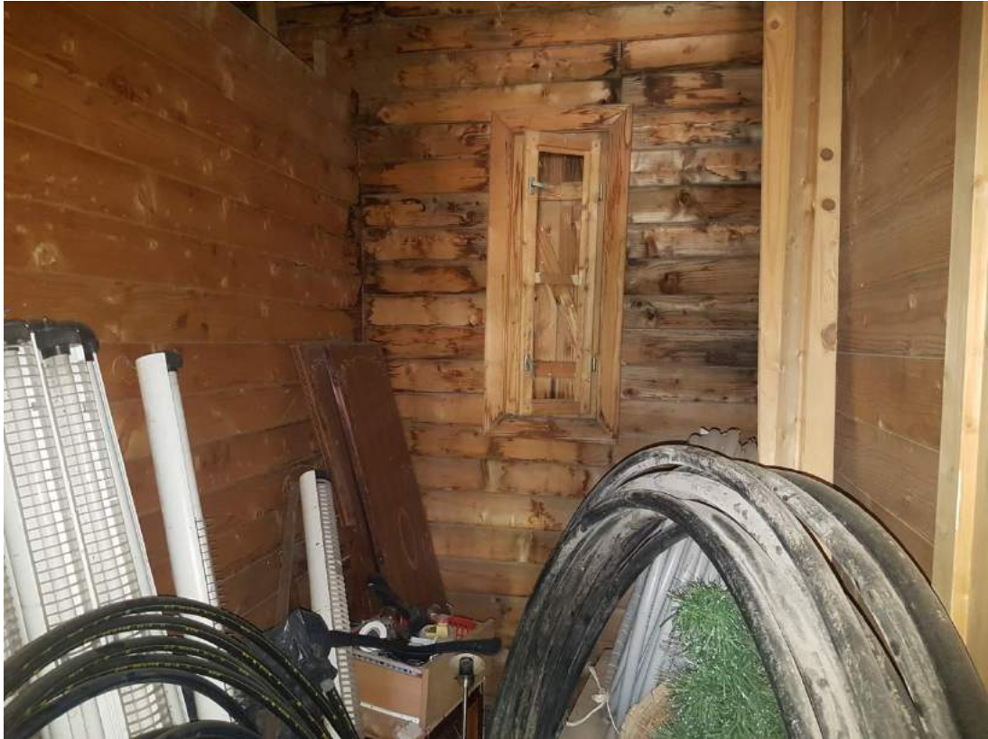
Foto 17- Immobile attualmente utilizzato a deposito sub. 4 (immobile n. 6 del progetto divisionale)