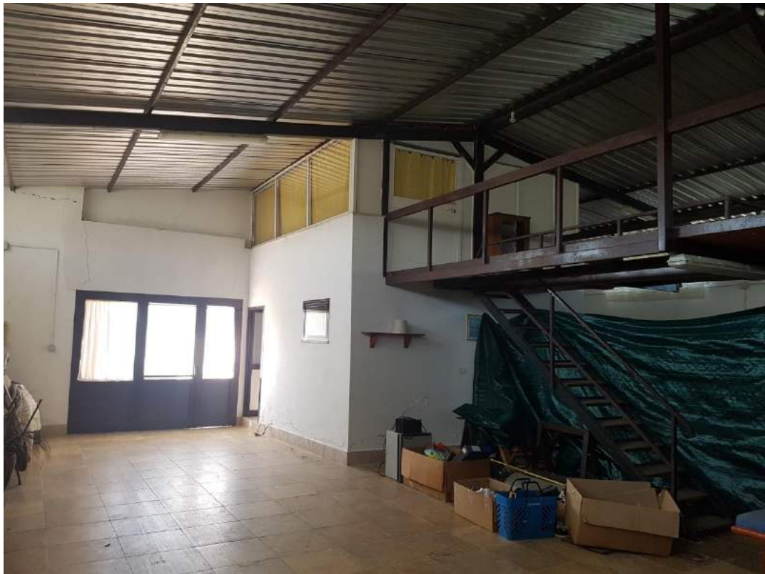
Foto 9- Fabbricato uso deposito sub. 3 (capannone n. 4 del progetto divisionale)