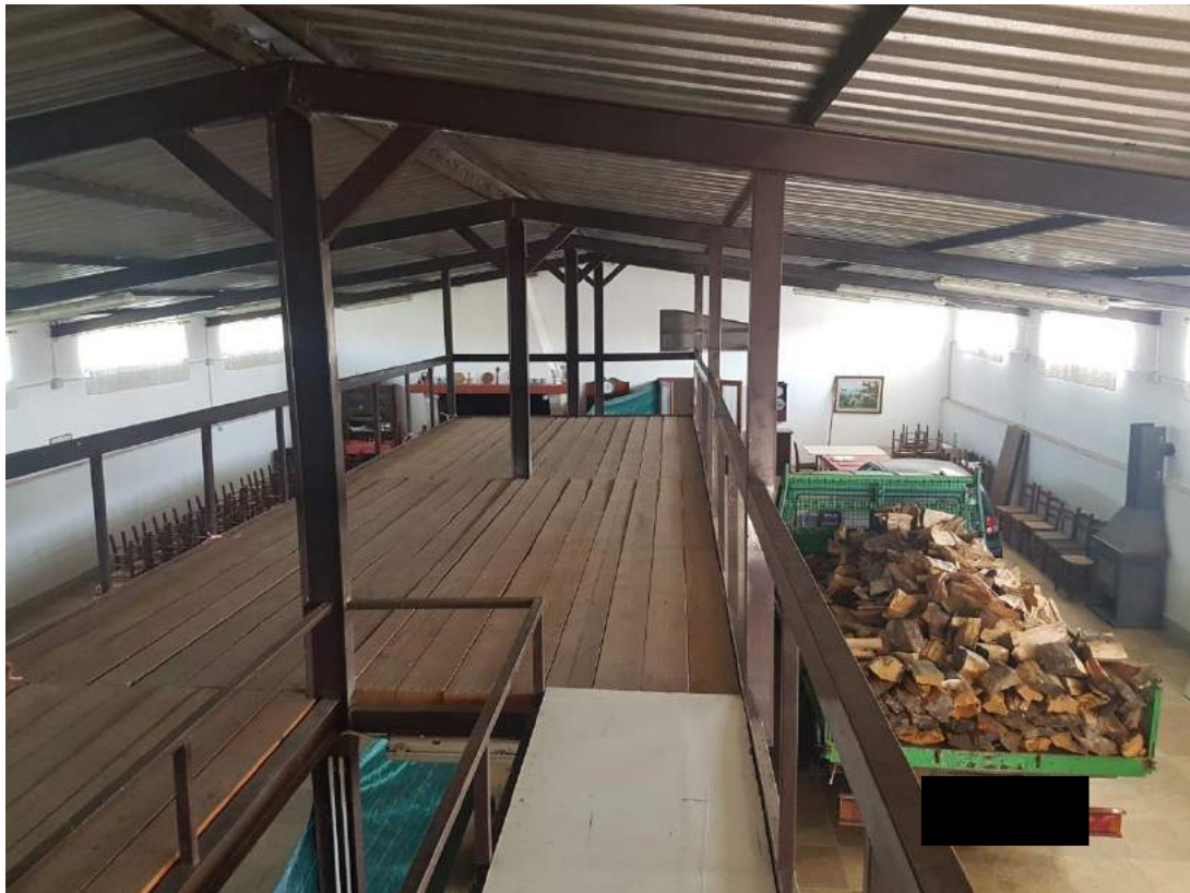
Foto 10- Fabbricato uso deposito sub. 3 (capannone n. 4 del progetto divisionale)