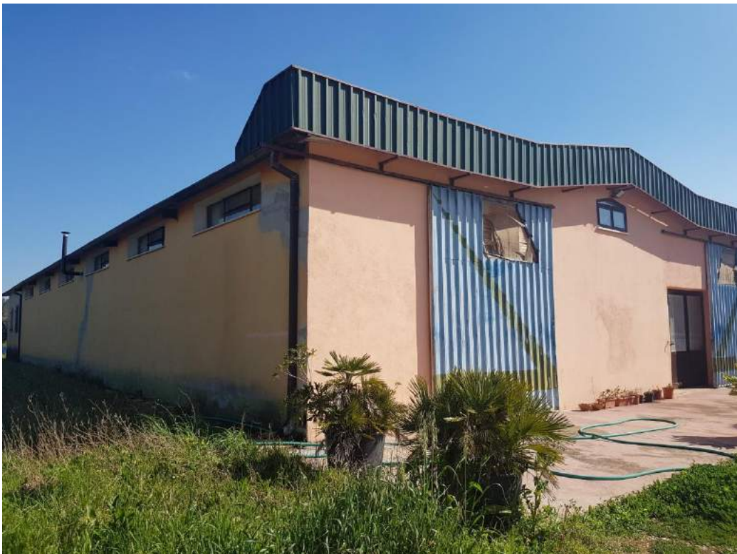
Foto 4- Fabbricato uso deposito sub. 3 (capannone n. 4 del progetto divisionale)