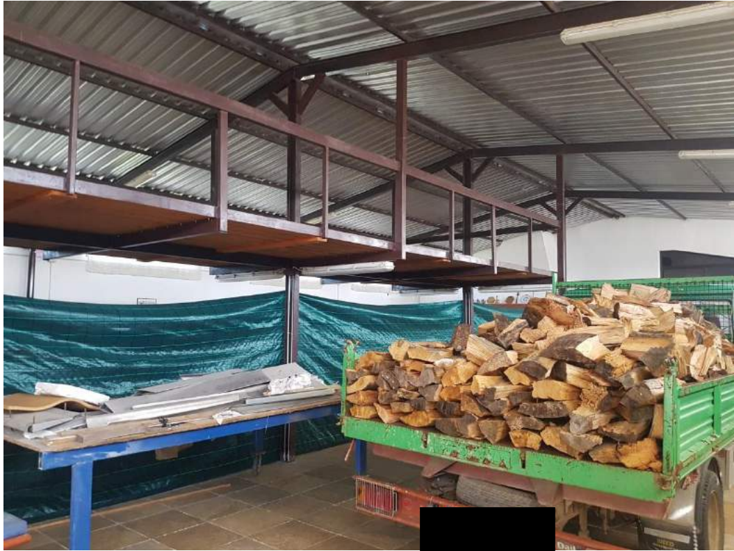
Foto 7- Fabbricato uso deposito sub. 3 (capannone n. 4 del progetto divisionale)