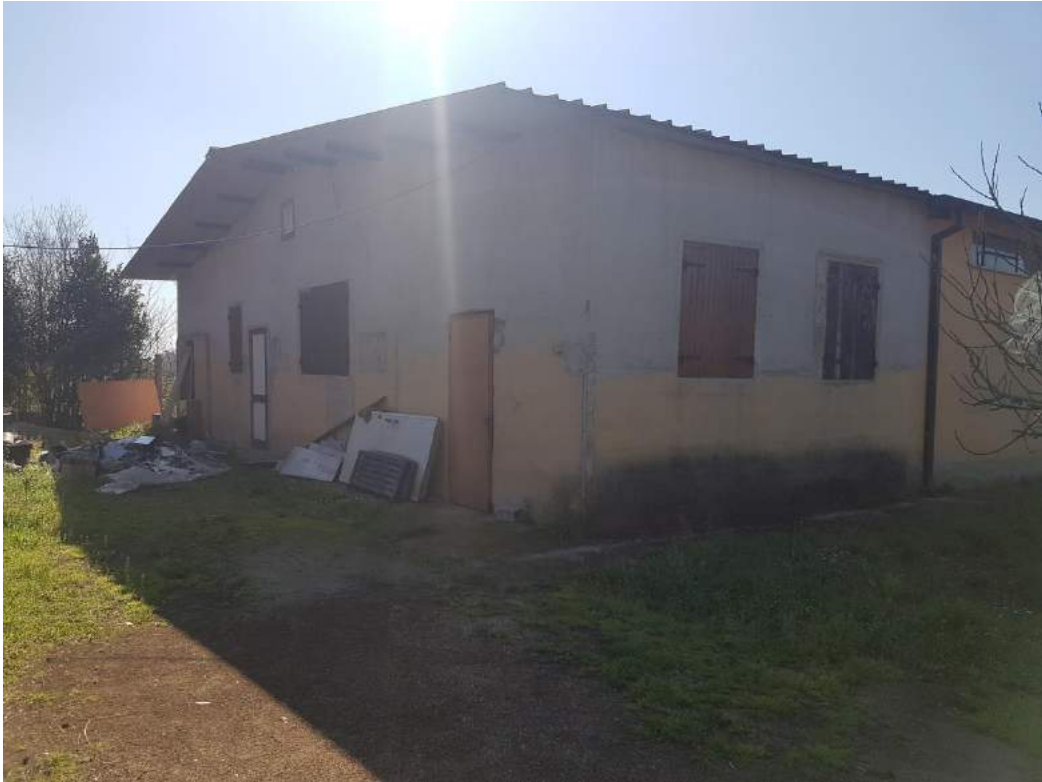
Foto 5- Fabbricato uso deposito sub. 3 (capannone n. 4 del progetto divisionale)