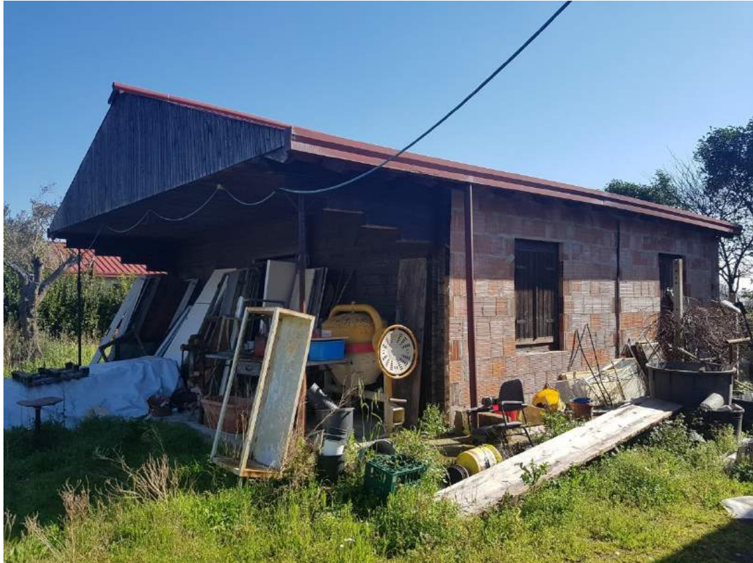
Foto 11- Immobile attualmente utilizzato a deposito sub. 4 (immobile n. 6 del progetto divisionale)