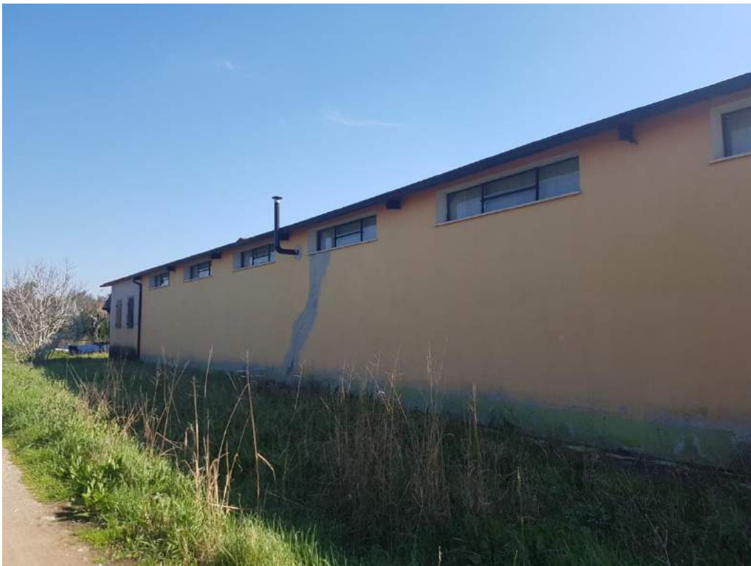
Foto 6- Fabbricato uso deposito sub. 3 (capannone n. 4 del progetto divisionale)