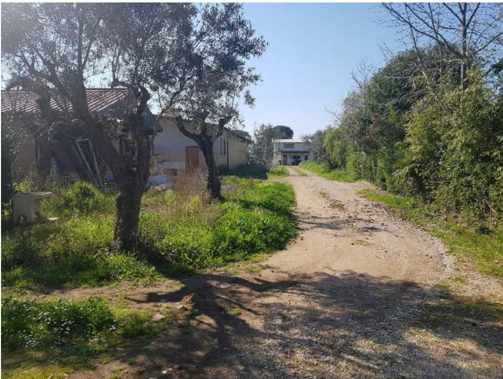
Foto 2- Corte comune