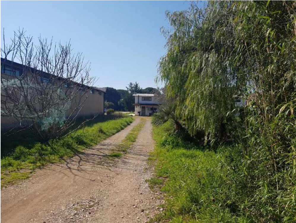
Foto 1- Corte comune