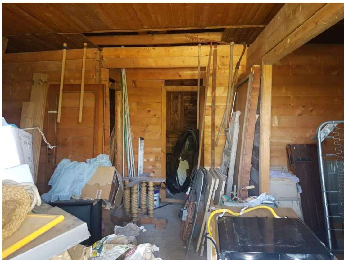
Foto 14- Immobile attualmente utilizzato a deposito sub. 4 (immobile n. 6 del progetto divisionale)