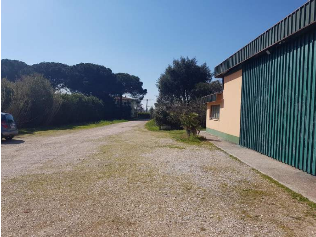
Foto 3- Corte comune