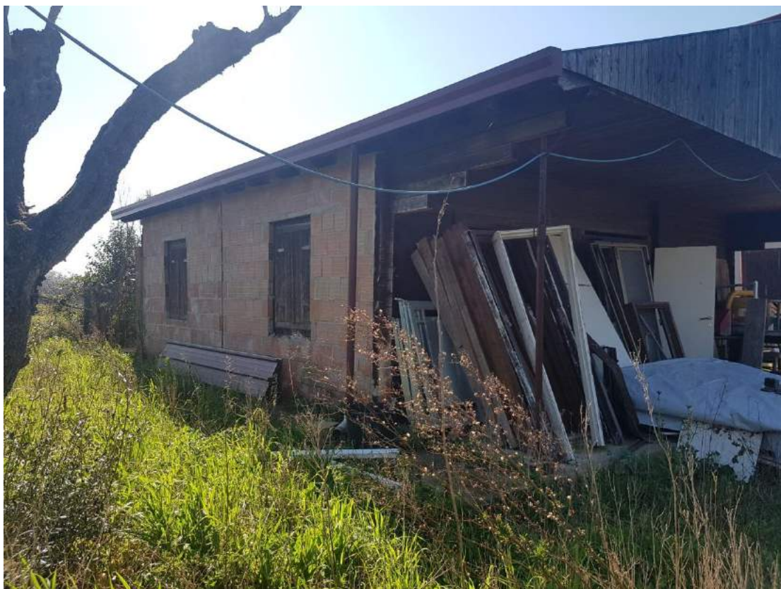
Foto 13- Immobile attualmente utilizzato a deposito sub. 4 (immobile n. 6 del progetto divisionale)