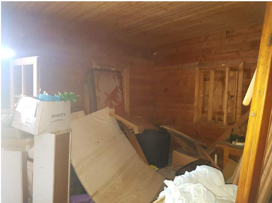
Foto 18- Immobile attualmente utilizzato a deposito sub. 4 (immobile n. 6 del progetto divisionale)