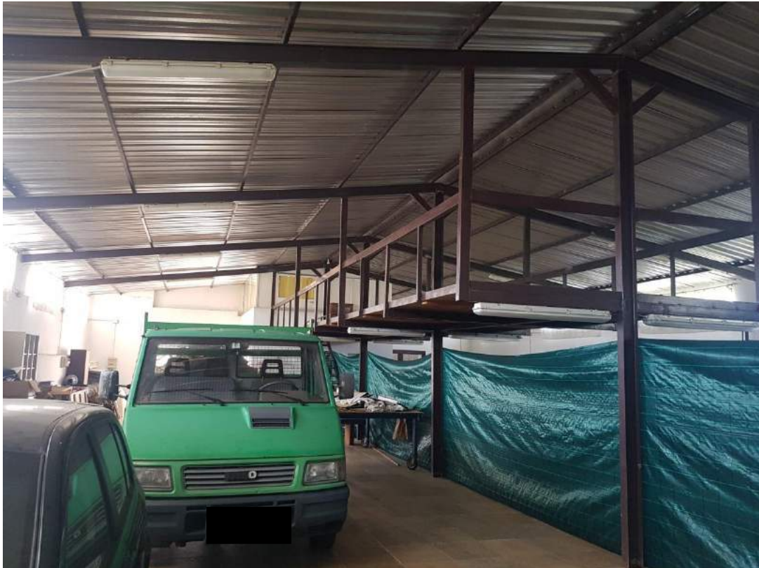
Foto 8- Fabbricato uso deposito sub. 3 (capannone n. 4 del progetto divisionale)