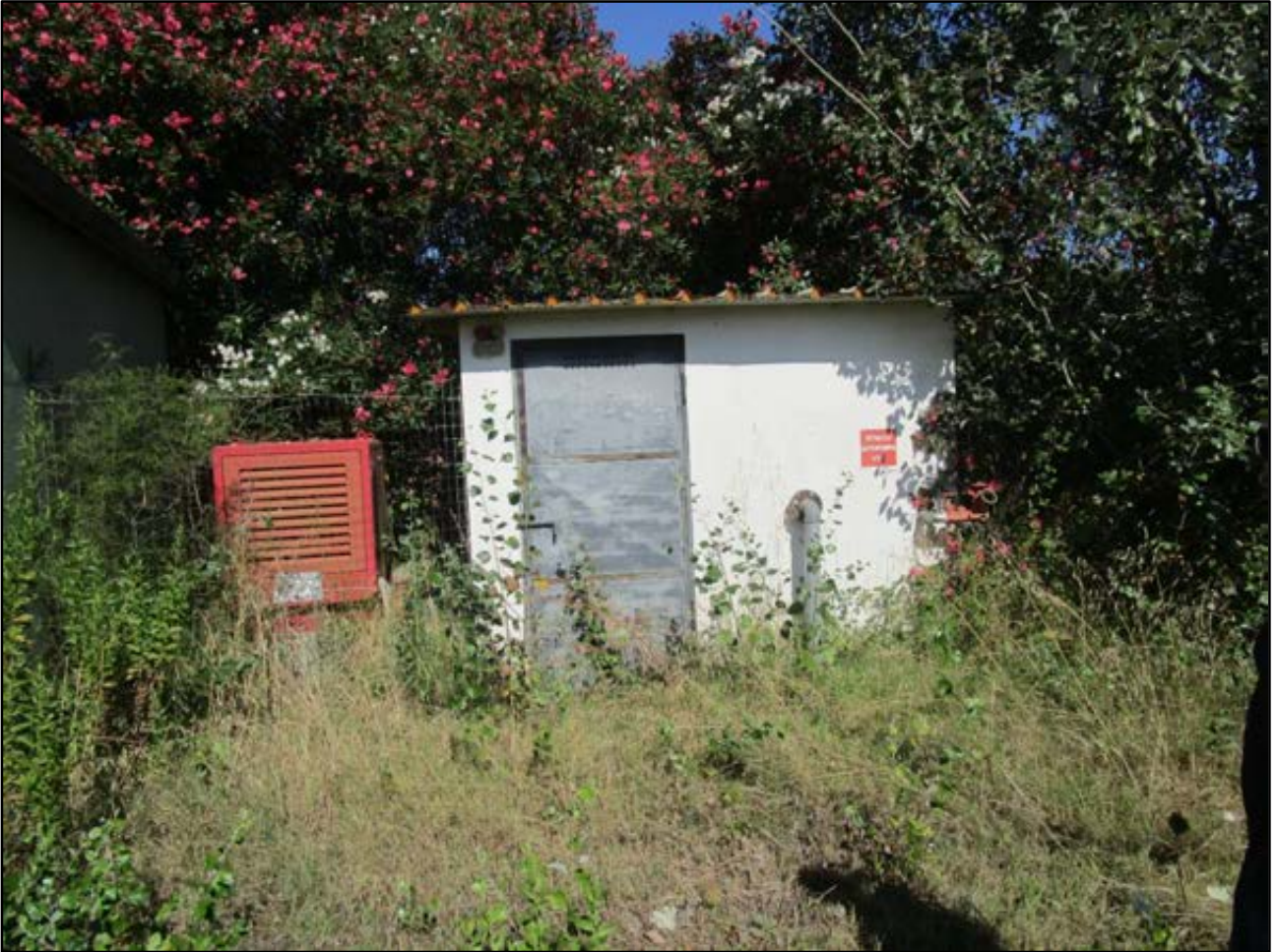
Foto 48: locale esterno pompe VVF con gruppo elettrogeno di emergenza