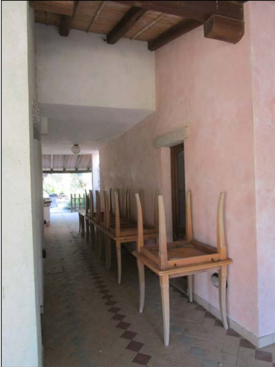
Foto 32: andito di separazione tra sala ristorante e casa custode