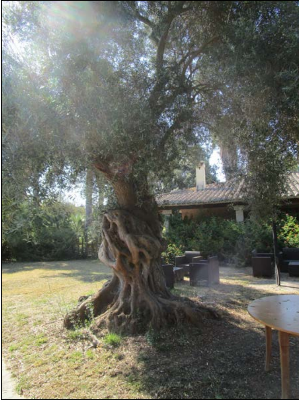
Foto 41 altro ulivo secolare presente in giardino