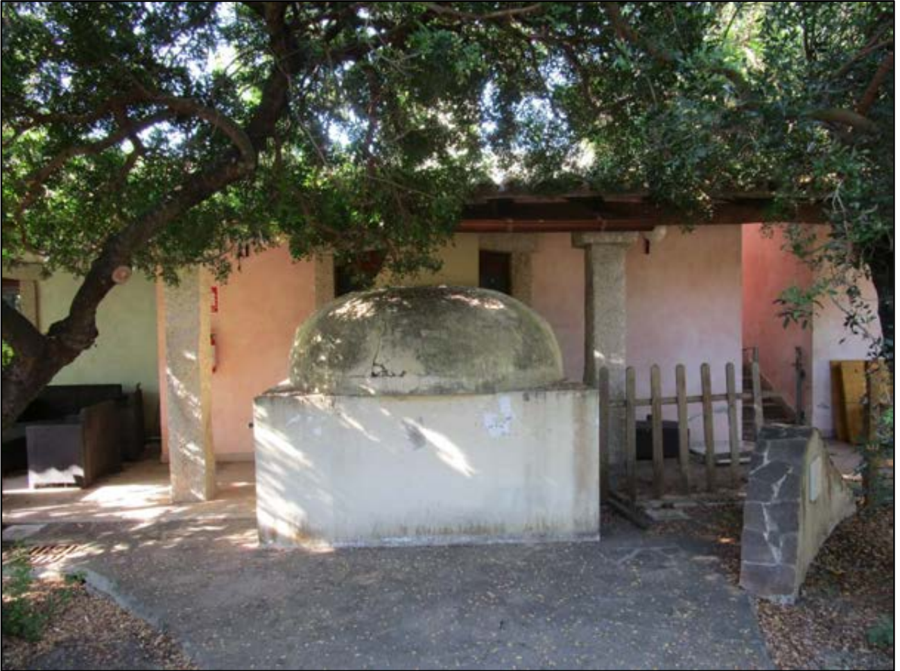
F Foto 35: forno del pane