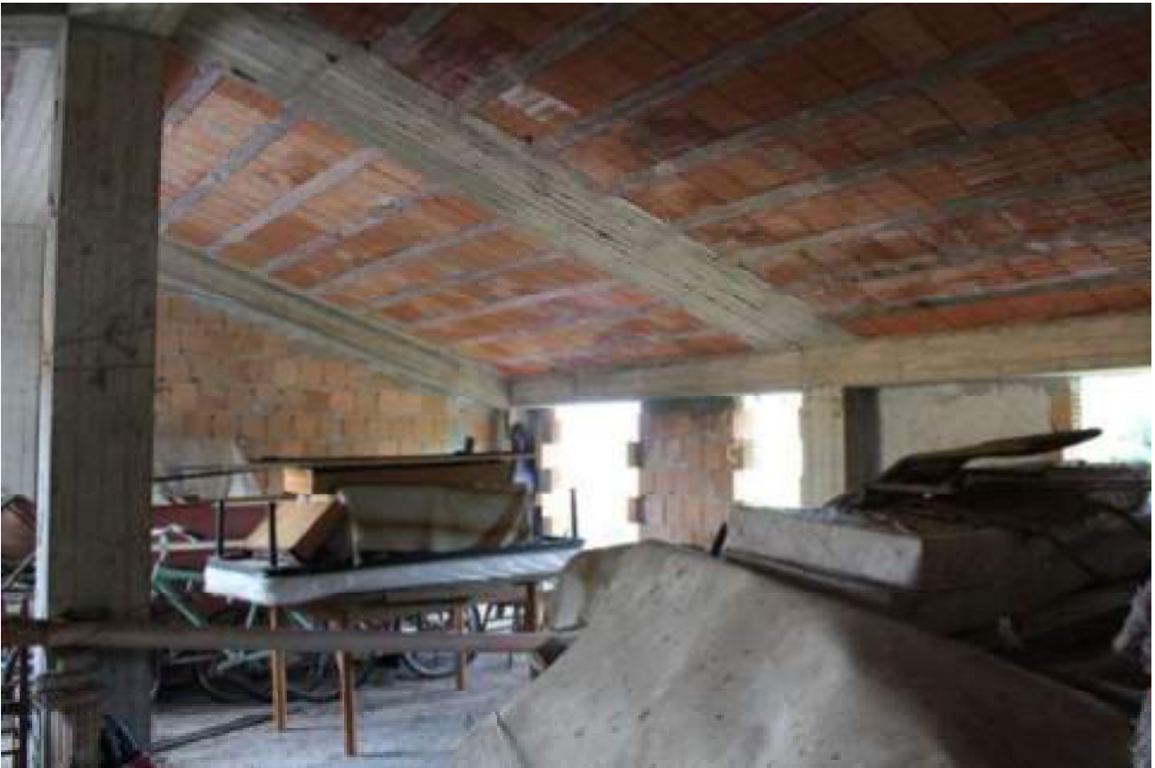
vista stato piano primo