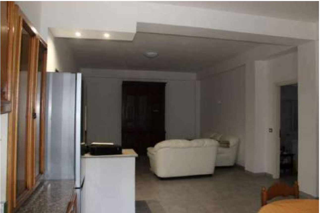
zona soggiorno ex magazzino