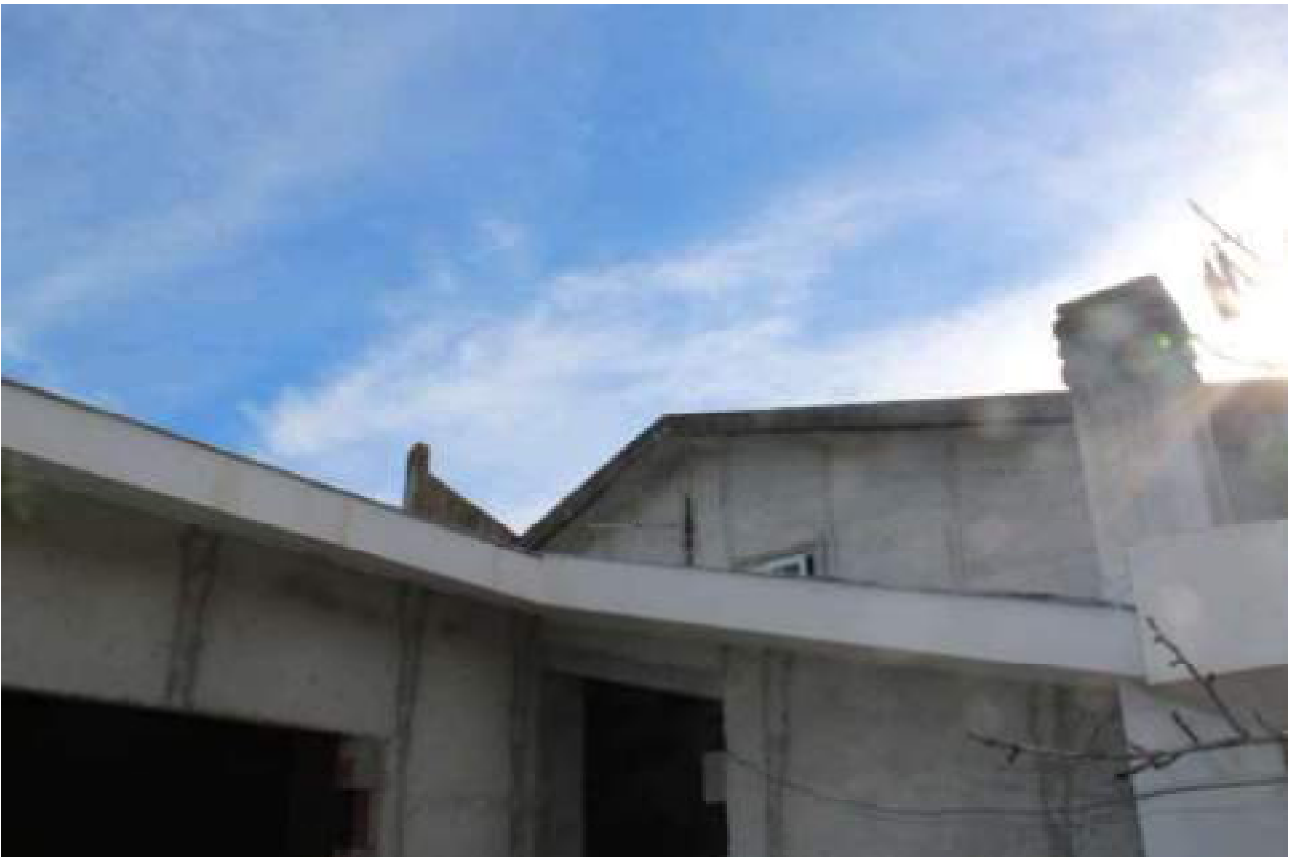
vista stato piano primo