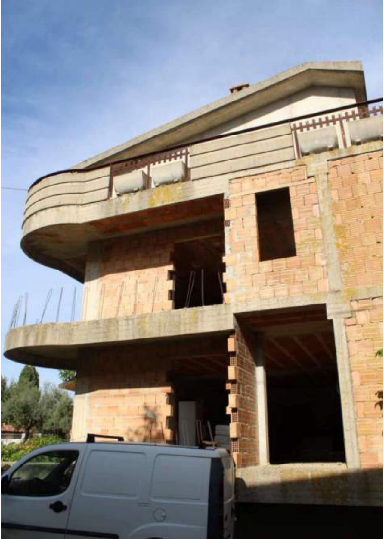
STATO DEI PROSPETTI