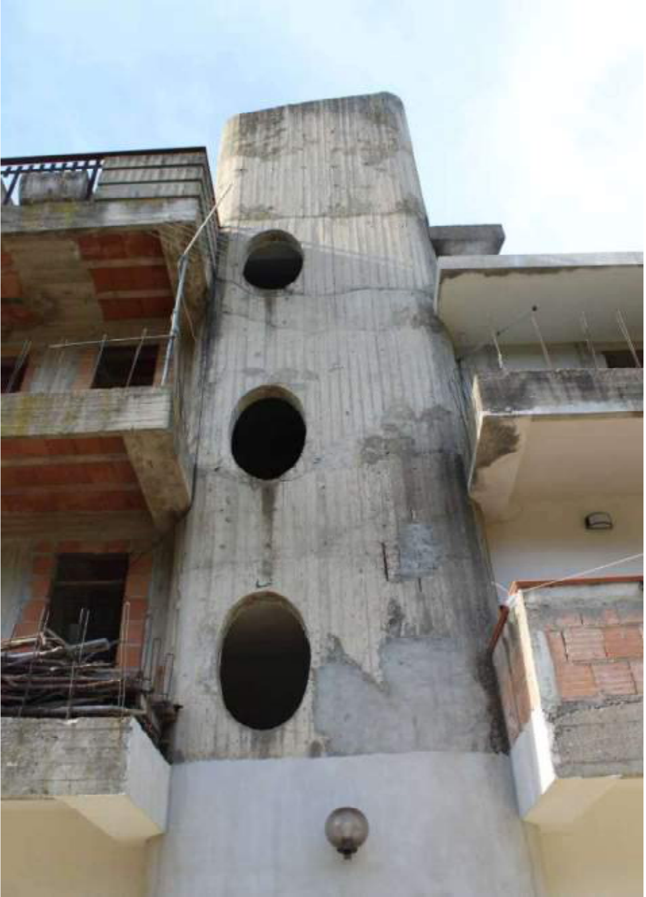
vista corpo scala