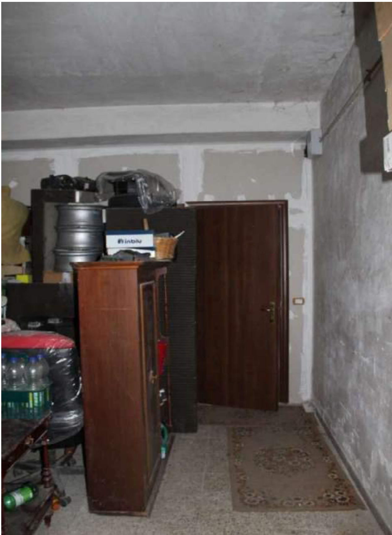
parete e posta ingresso al piano seminterrato dell'attuale alloggio del sig Cariatì Carlo (da rimuovere)