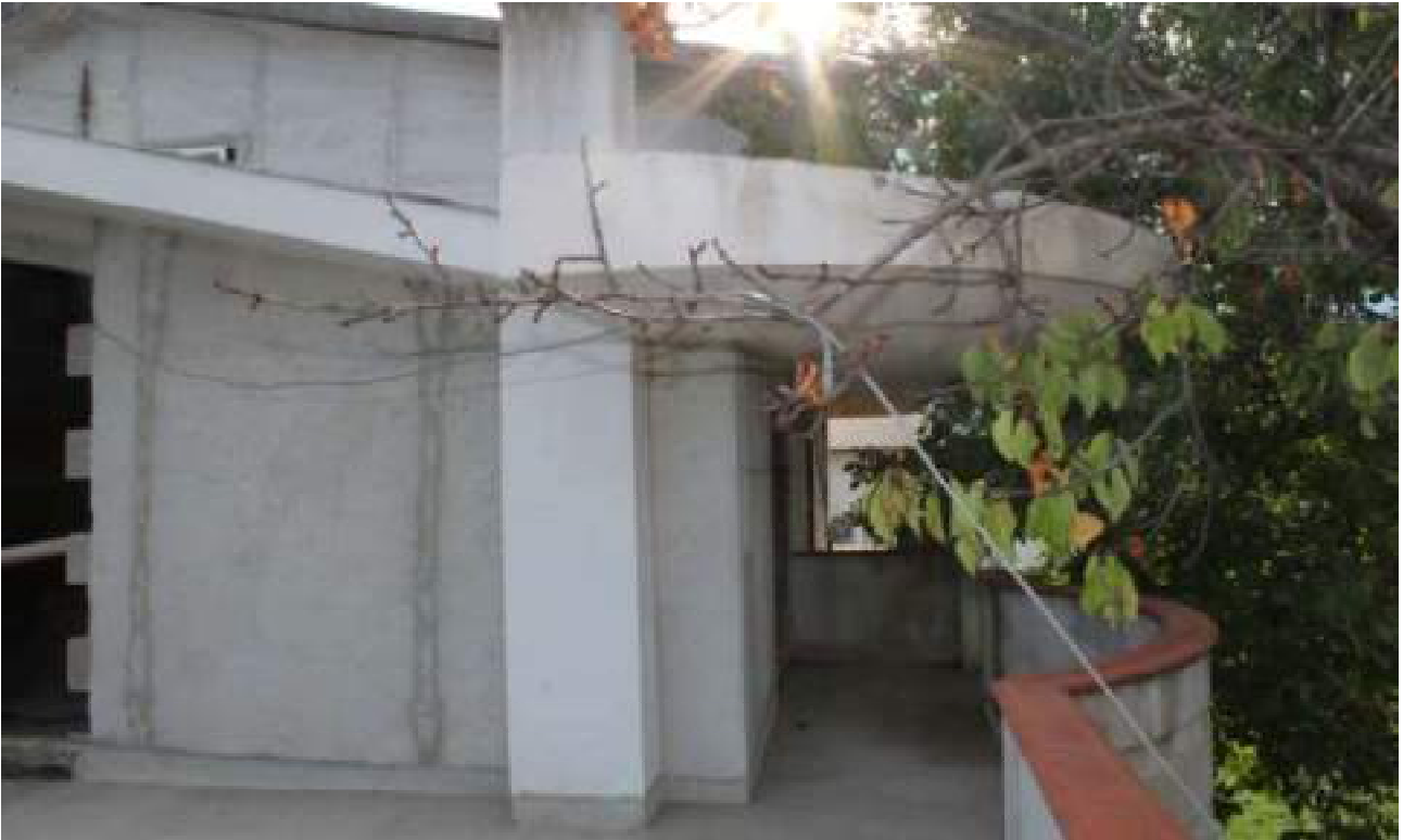
vista stato piano primo