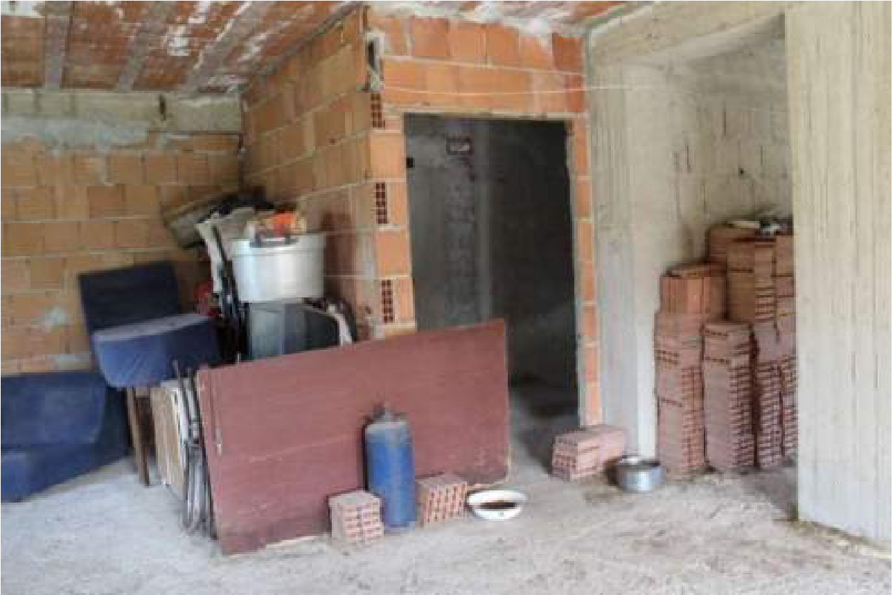
vista stato piano primo