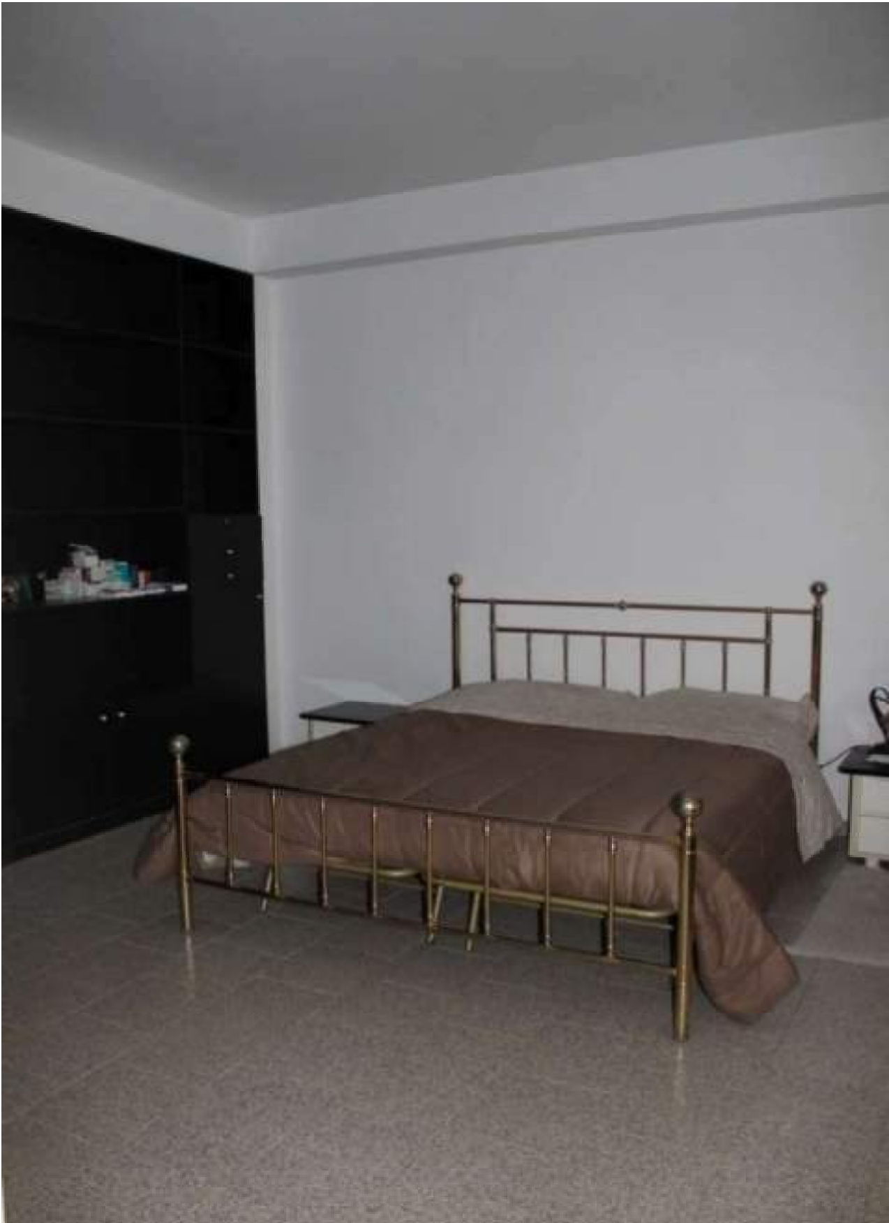
zona letto ex magazzino