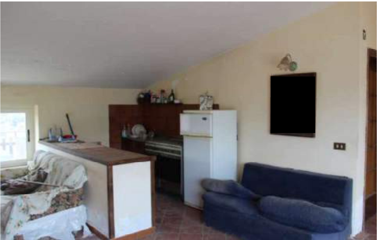
vista stato piano sottotetto