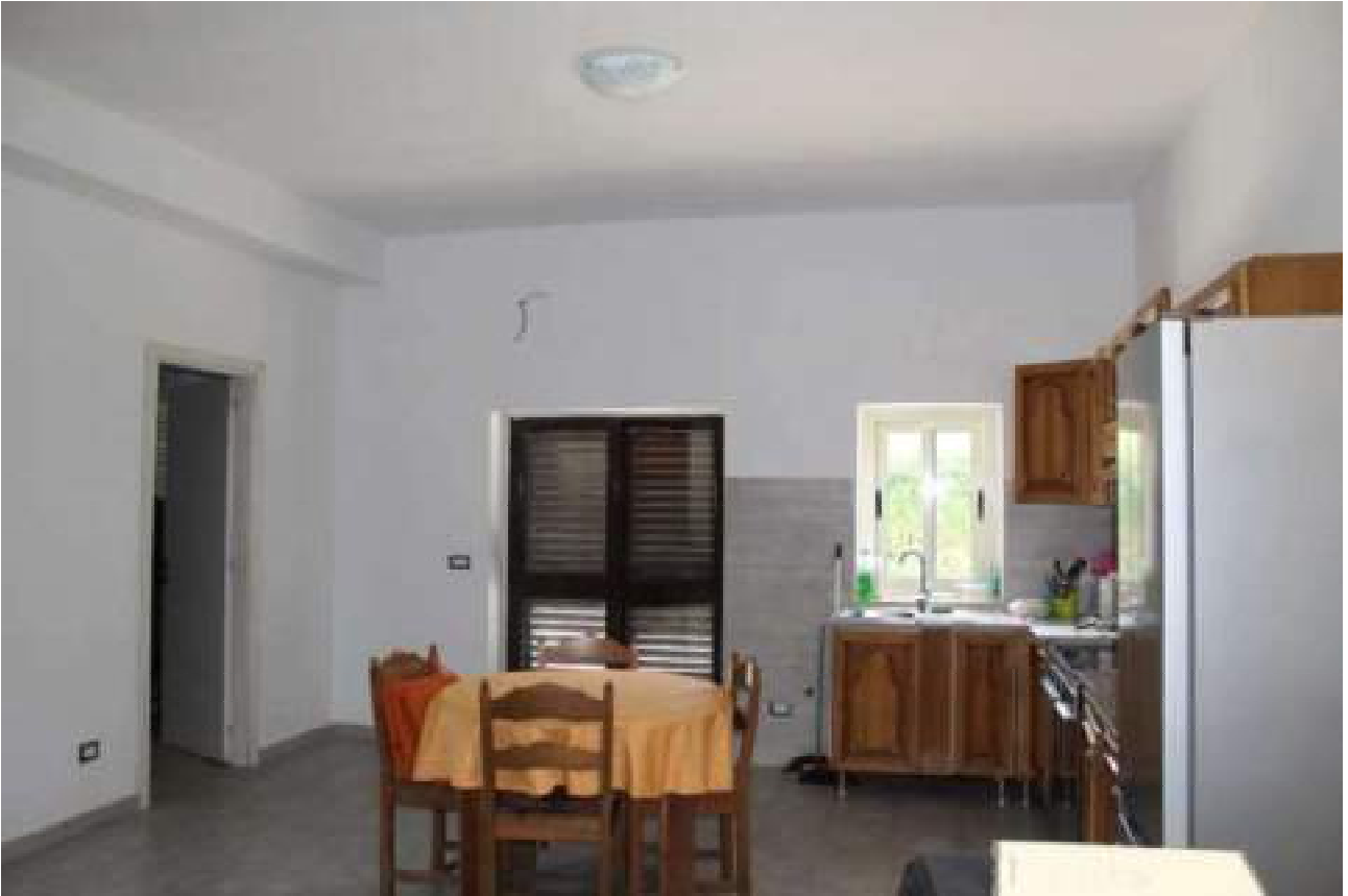
zona cucina ex magazzino