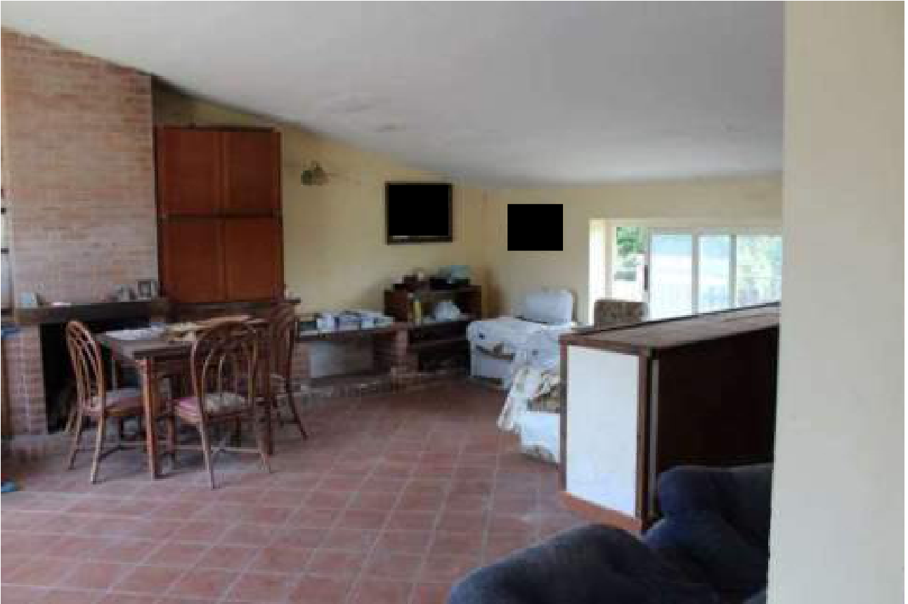
vista stato piano sottotetto