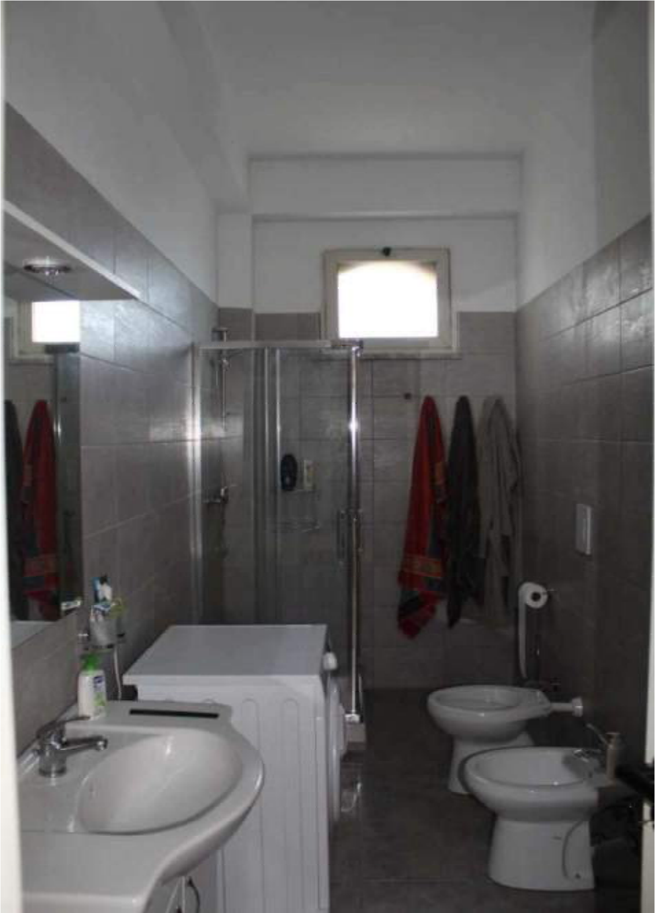
zona servizio ex magazzino