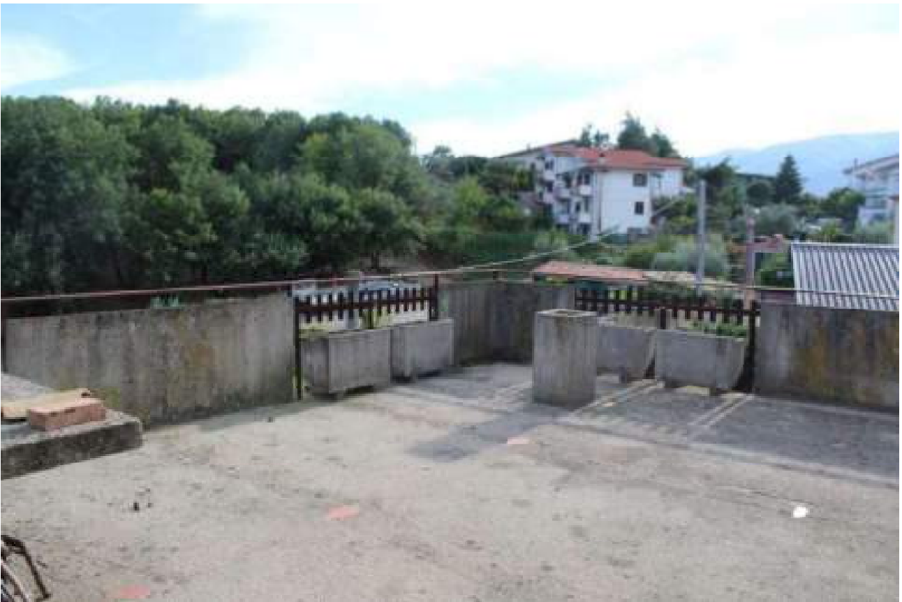
vista terrazzo piano sottotetto