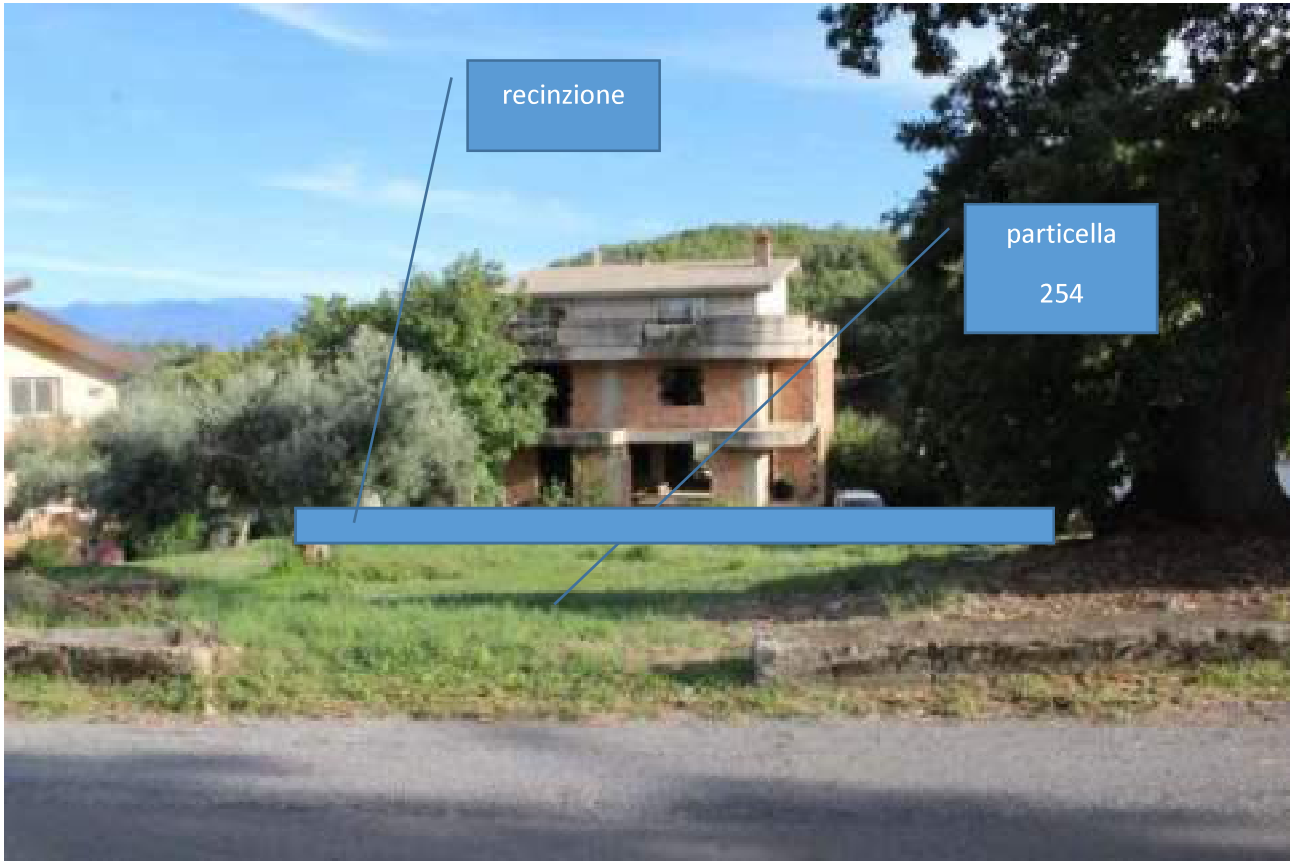
vista dalla strada comunale