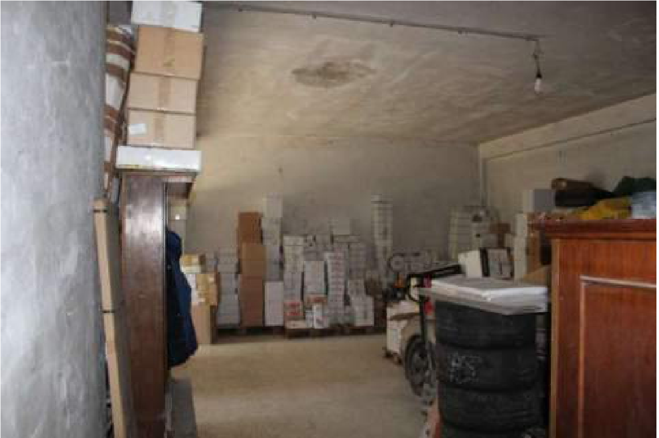
zona rimanente magazzino