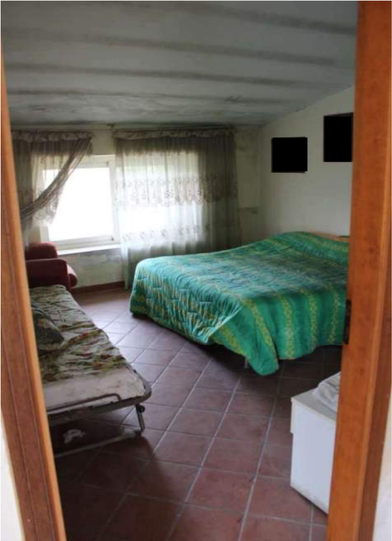
vista stato piano sottotetto