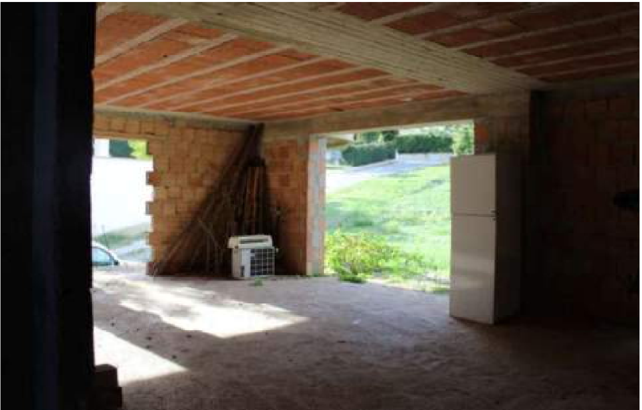
vista stato piano terra