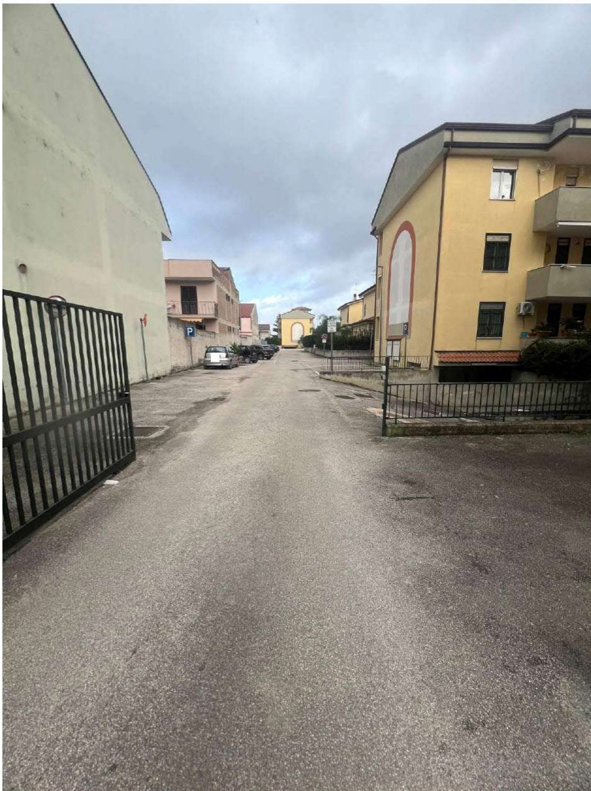
Foto Viale di accesso da Via XXIV Maggio