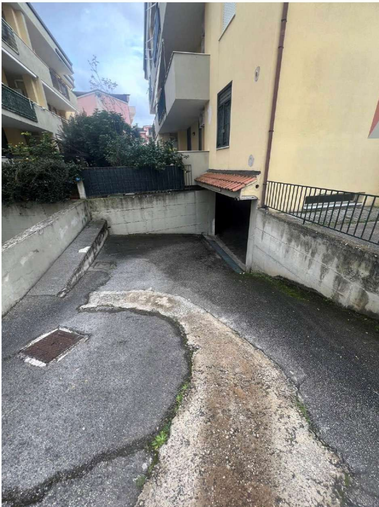
Foto viale di accesso al piano S1