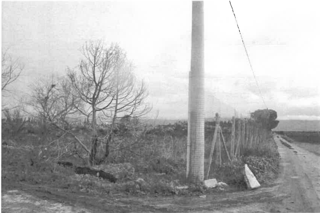
confine sud visto da ovest