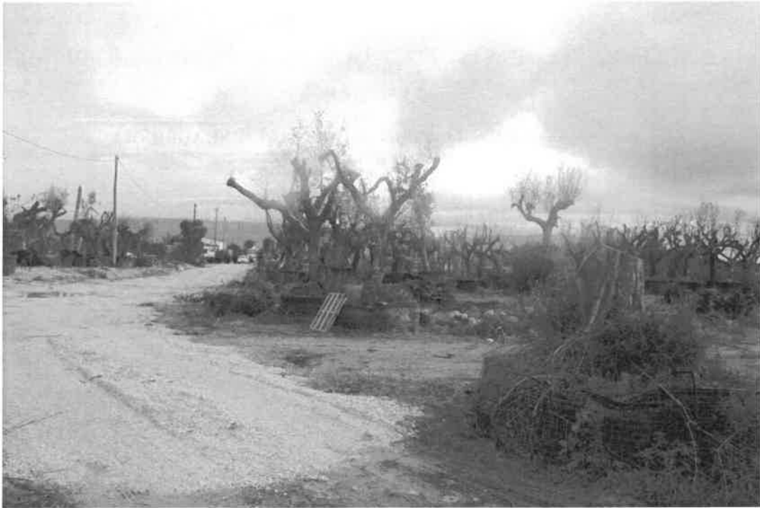
vista dal vertice nord ovest