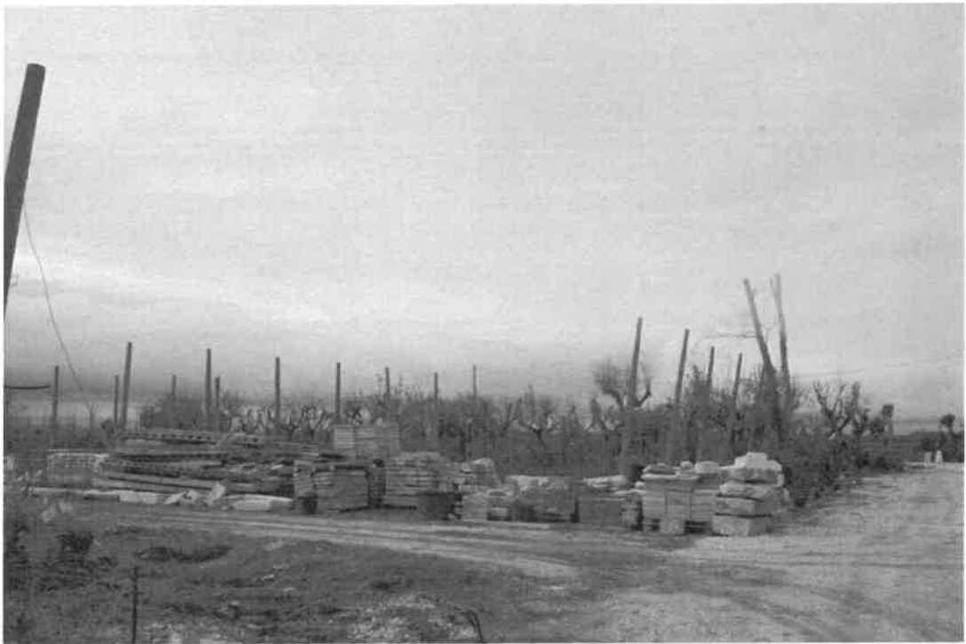
vista del confine nord