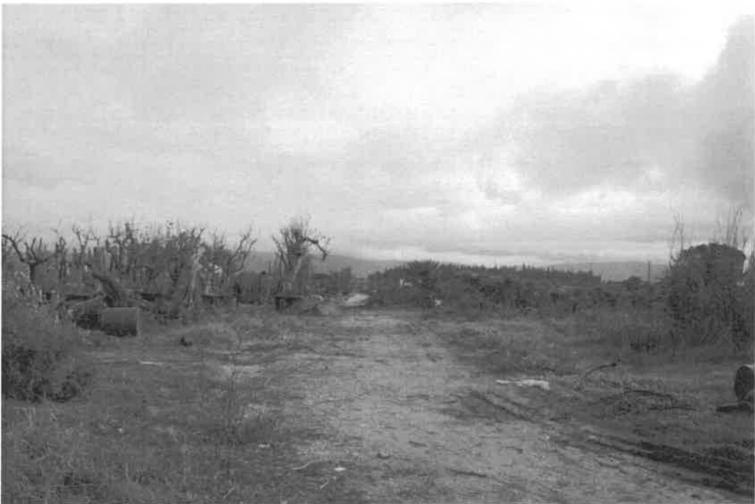
confine nord ovest