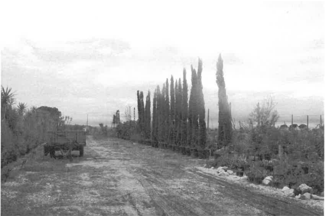
particolare del materiale vivaistico presente ma di proprietà dell'affittuario