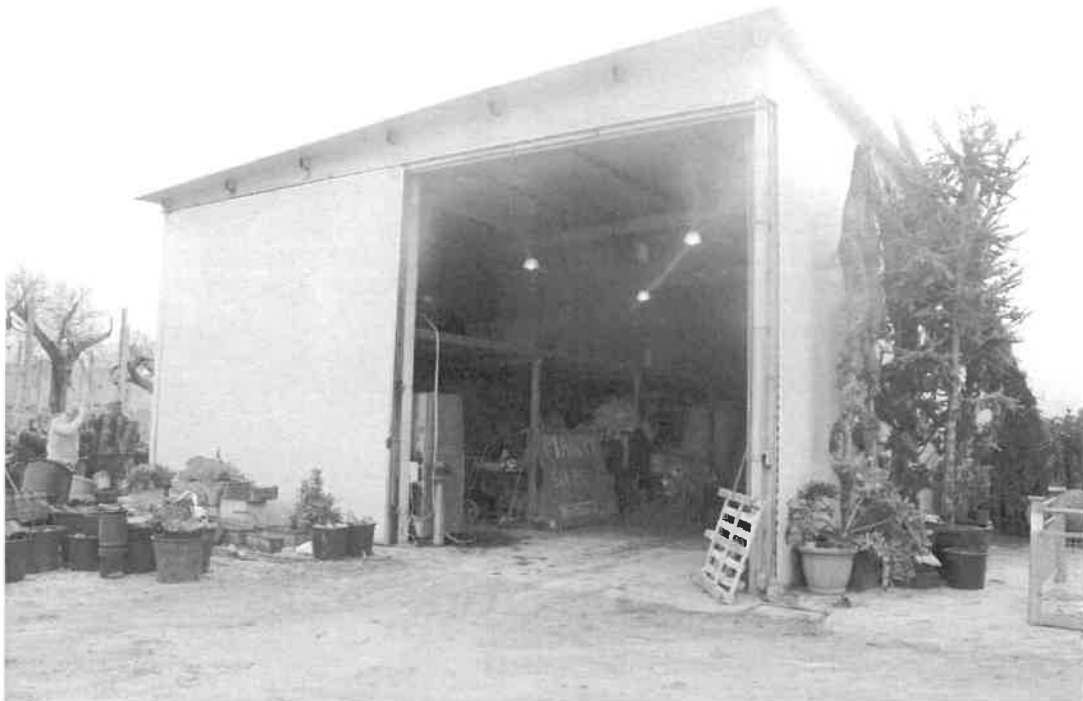
particolare del manufatto abusivo di proprietà dell'affittuario