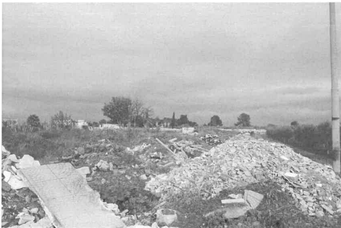
confine sud, particolare dei materiali sversati