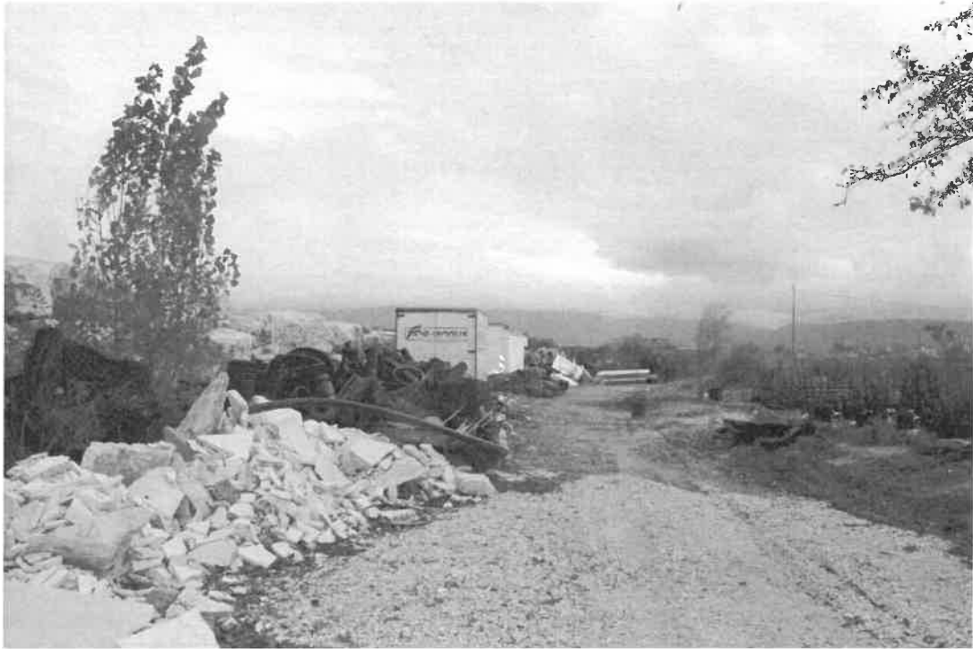
particolare dei materiali sversati lungo il confine nord