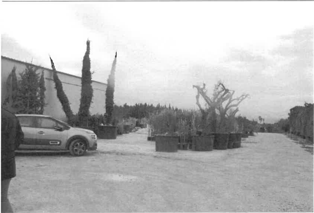
vista del confine nord e manufatto abusivo