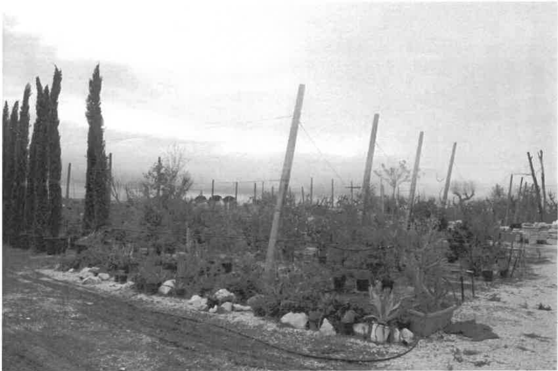
particolare del materiale vivaistico presente ma di proprietà dell'affittuario