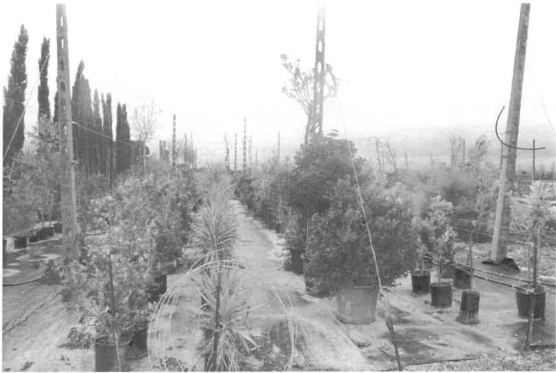
particolare del materiale vivaistico presente ma di proprietà dell'affittuario