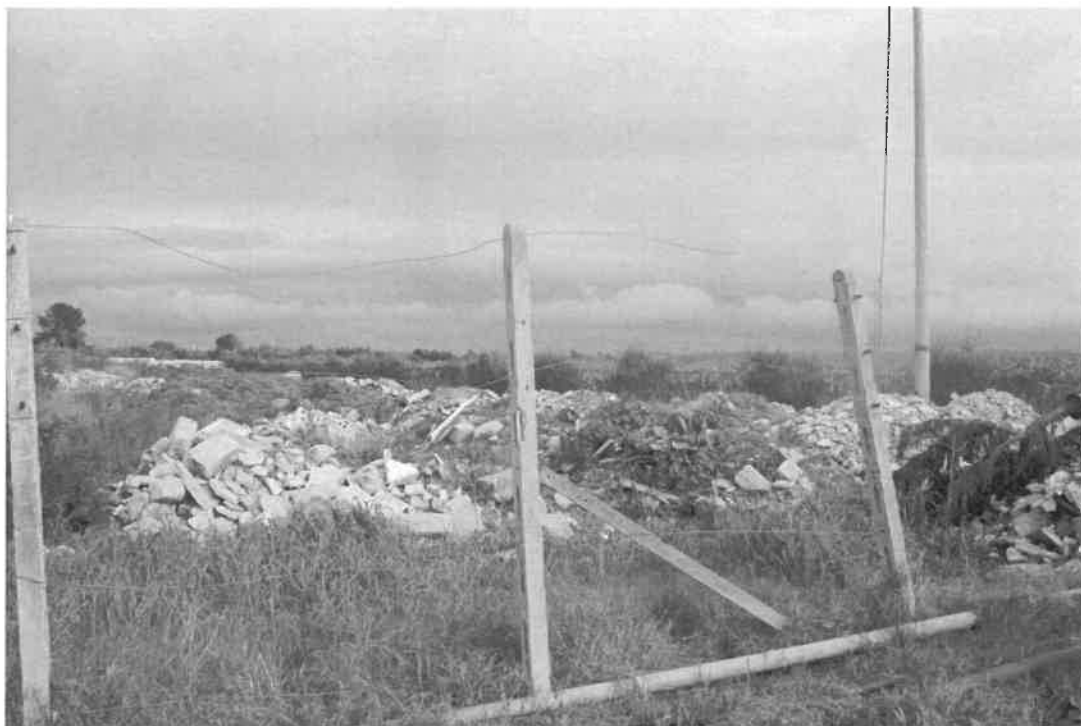
confine sud, particolare dei materiali sversati