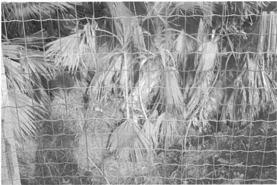
particolare di piante piantumate e non più adatte alla commercializzazione