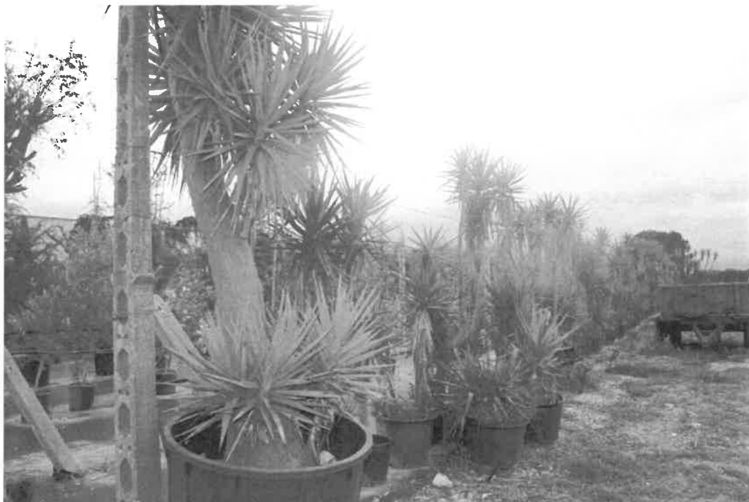
particolare del materiale vivaistico presente ma di proprietà dell'affittuario