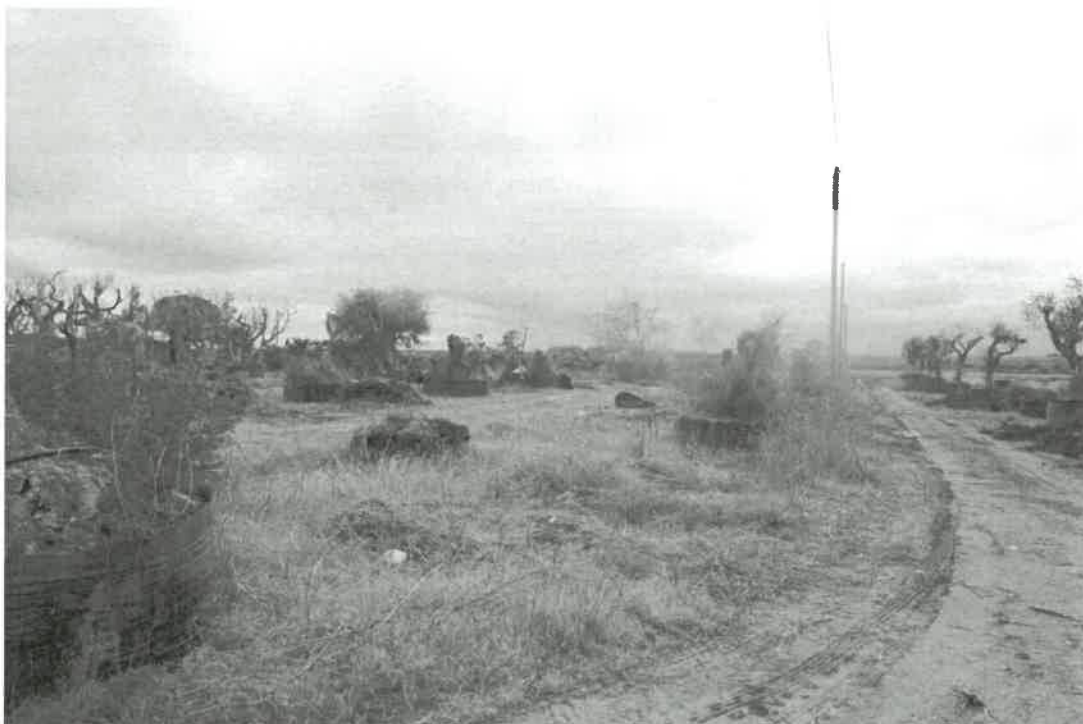
Vista del confine nord ovest