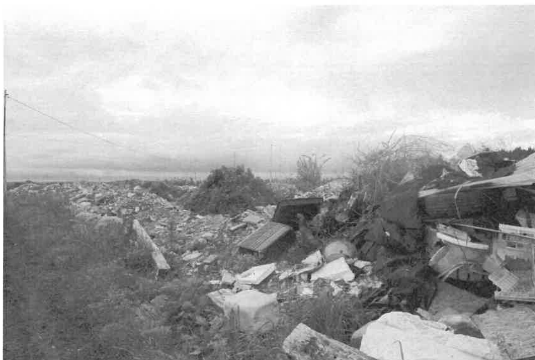
particolare dei materiali sversati lungo il confine est