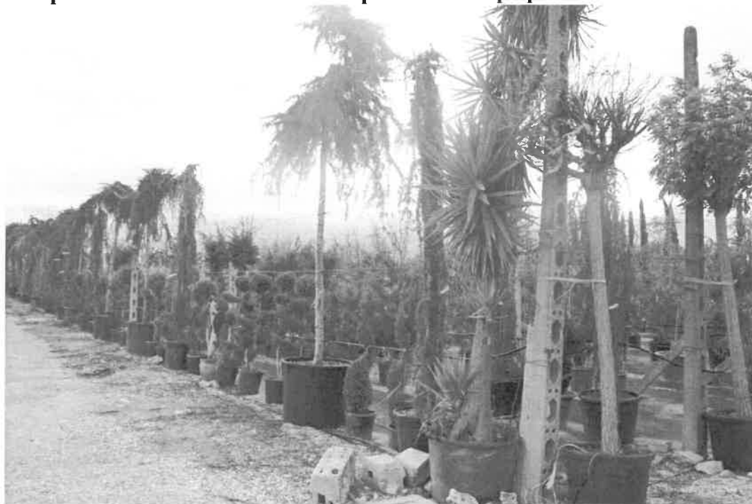
particolare del materiale vivaistico presente ma di proprietà dell'affittuario