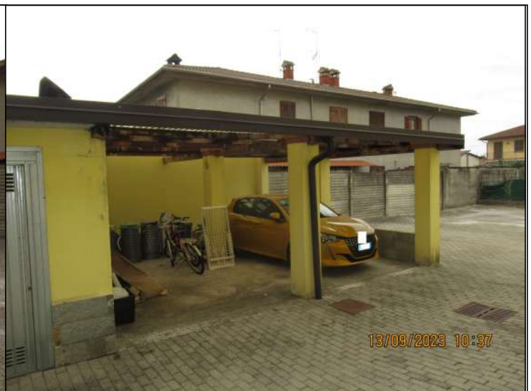
RIPRESA FOTOGRAFICA 2