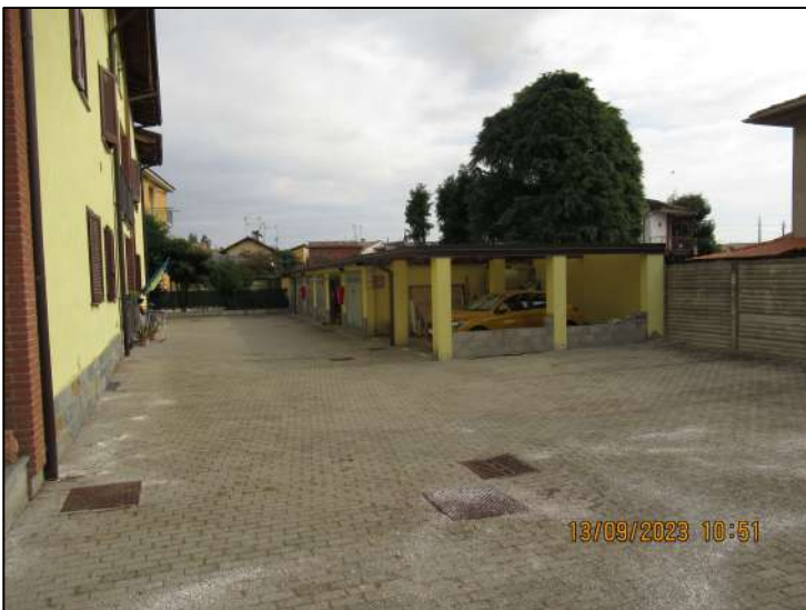
RIPRESA FOTOGRAFICA 1