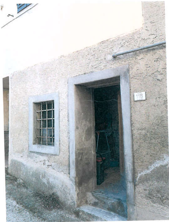
PORTONCINO INGRESSO LOCALE AUTONOMO 11