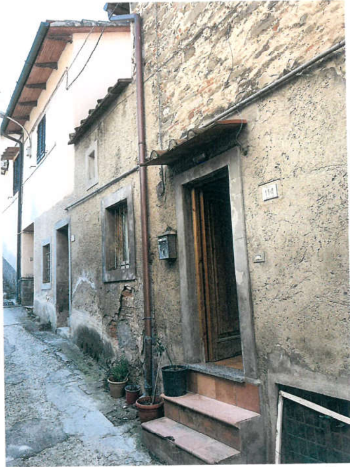
PORTONCINO INGRESSO 1