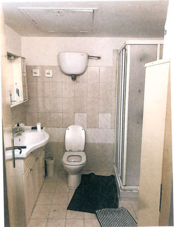
BAGNO WC 4