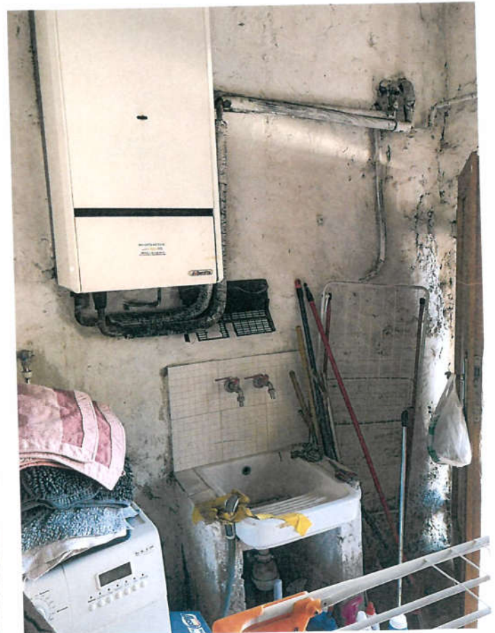
INTERNO LOCALE AUTONOMO 12