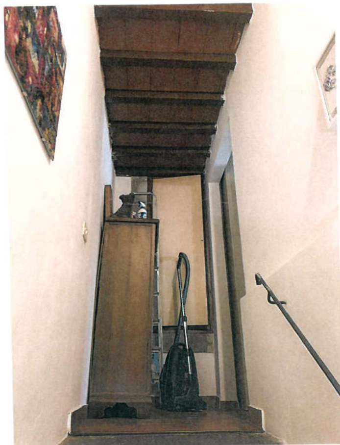
PIANEROTTOLO PIANO 1°