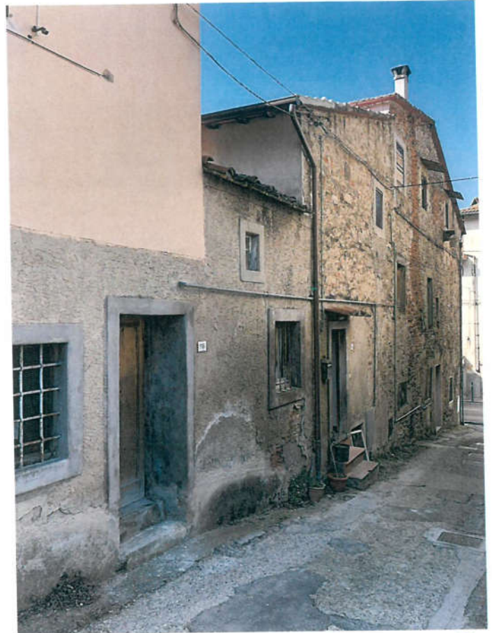
FACCIATA LATO INGRESSO 2