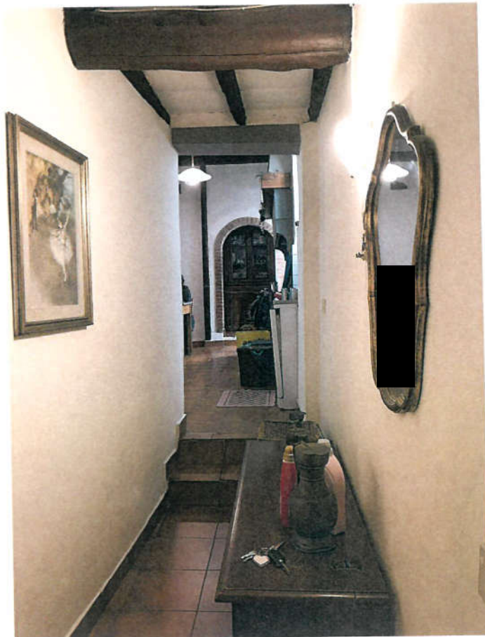
INTERNI (INGRESSO) 3