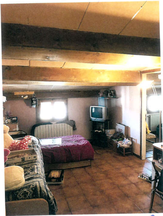
CAMERA P.1° 9