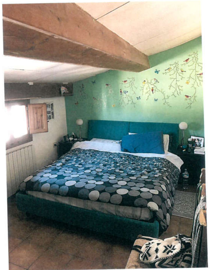
LOCALE ACCESSORIO P.1° 10