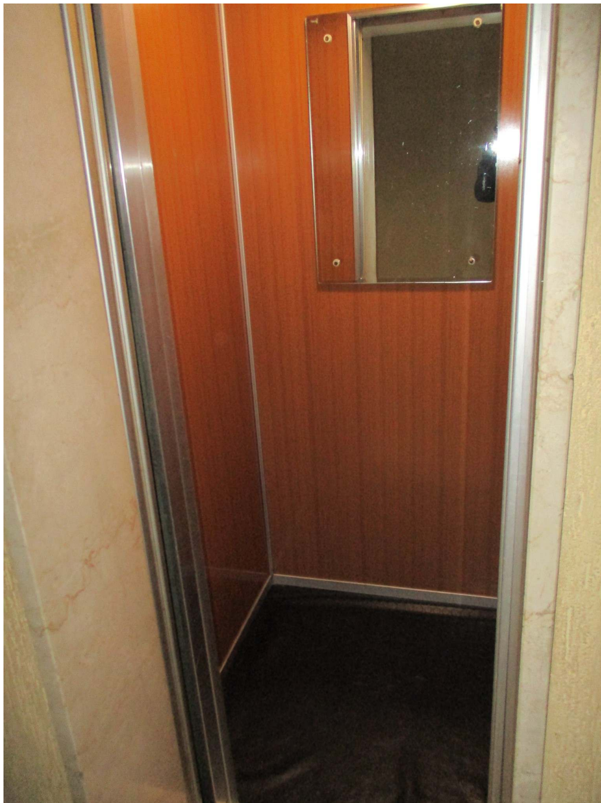
Fig. 15 – Vista dell'ascensore della palazzina B in cui si trova l'alloggio oggetto di stima