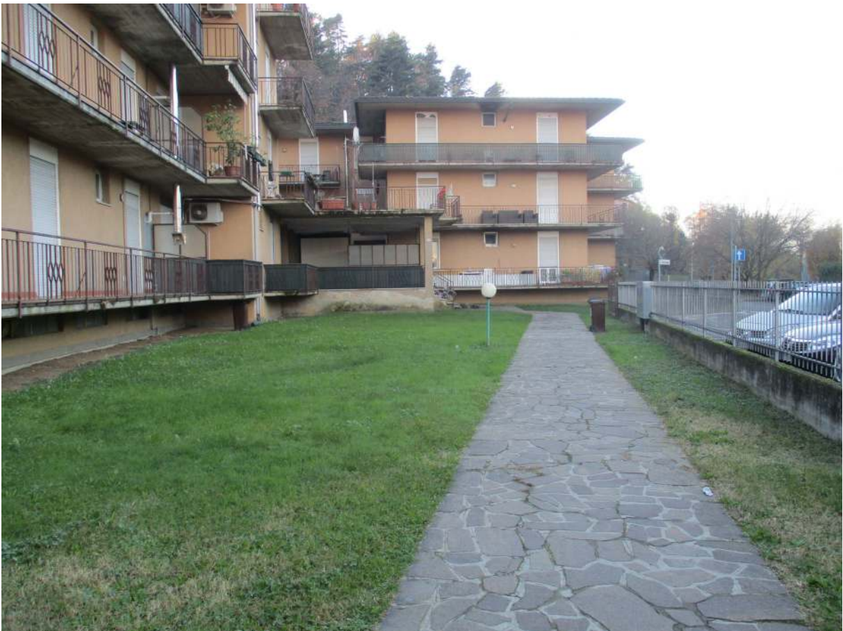
Fig. 8 – Vista del giardino condominiale lungo Via Fosio