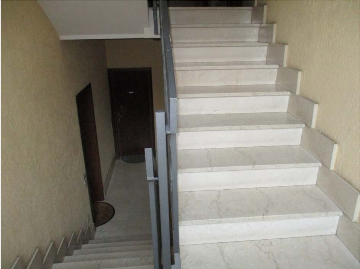
Fig. 16 – Vista del vano scala della palazzina B in cui si trova l'alloggio oggetto di stima