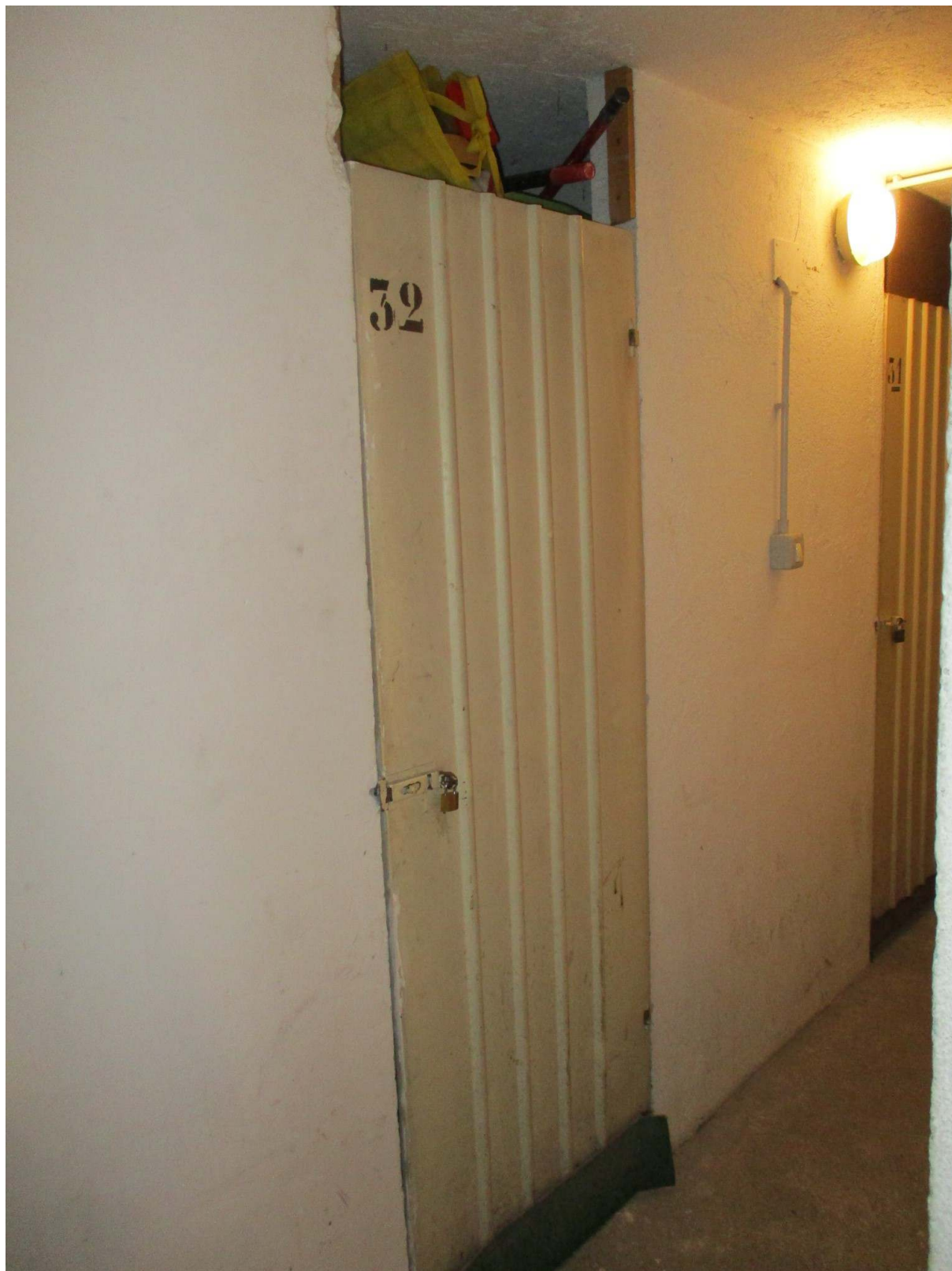
Fig. 39 – Vista della porta della cantina pertinenziale all'alloggio oggetto di stima