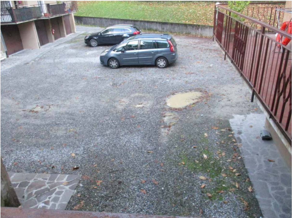
Fig. 12 – Vista del cortile comune posto sul retro del complesso (lato ovest)