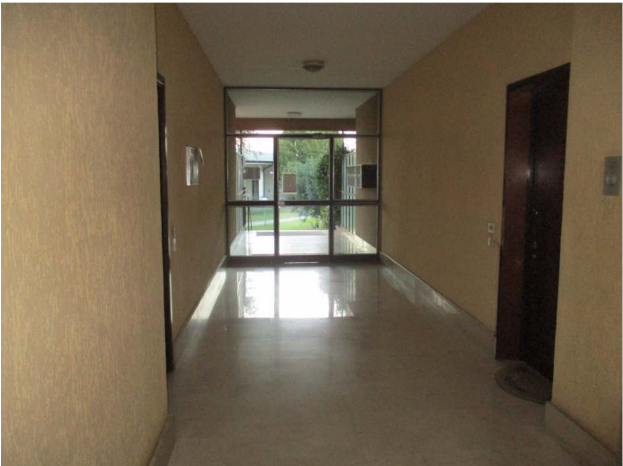
Fig. 14 – Vista dell'androne d'ingresso della palazzina B in cui si trova l'alloggio oggetto di stima