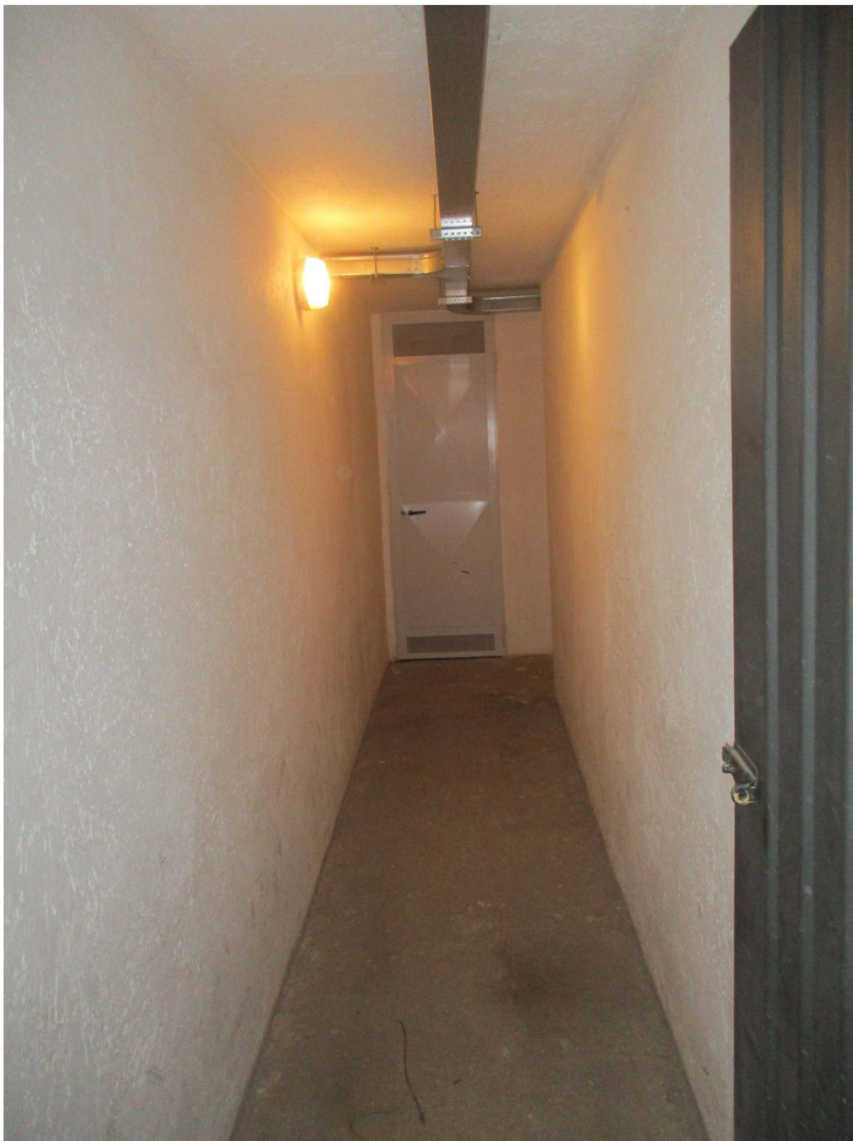
Fig. 38 – Vista del corridoio comune che conduce alle cantine di pertinenza al P. seminterrato