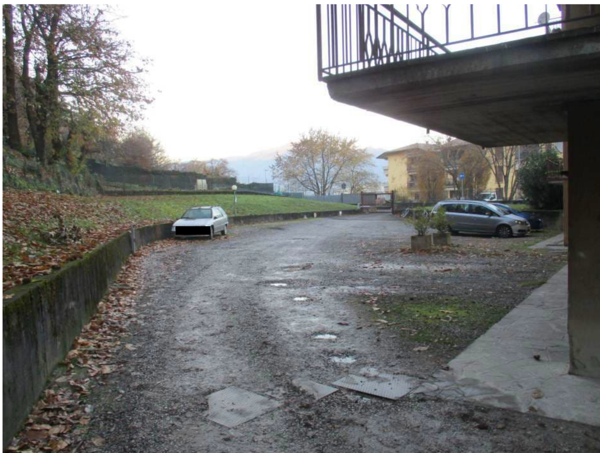
Fig. 10 – Vista del vialetto carrale condominiale