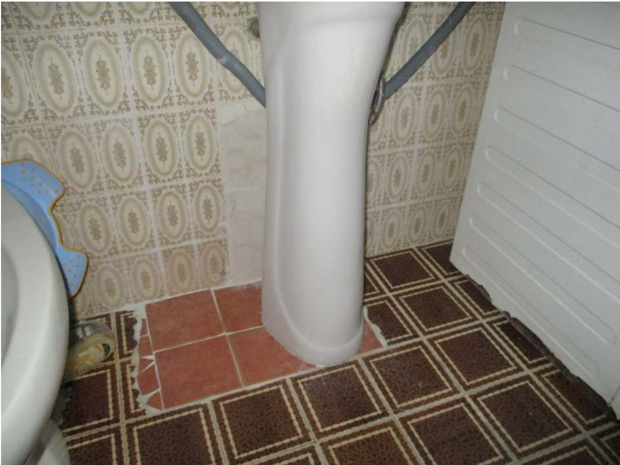
Fig. 35 – Vista delle piastrelle sostituite nel bagno