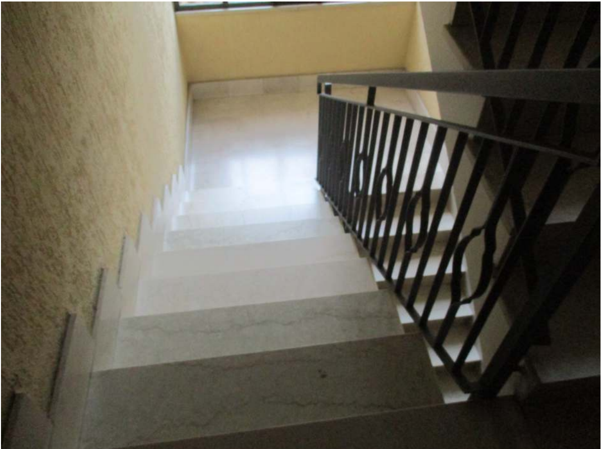
Fig. 17 – Vista del vano scala della palazzina B in cui si trova l'alloggio oggetto di stima