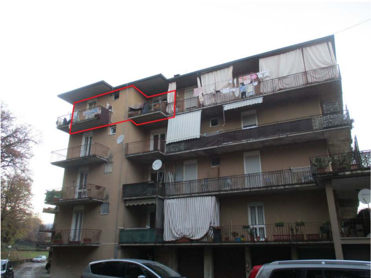
Fig. 4 – Vista d'insieme della palazzina B (lato sud) con l'alloggio al P. 3° riquadrato in rosso