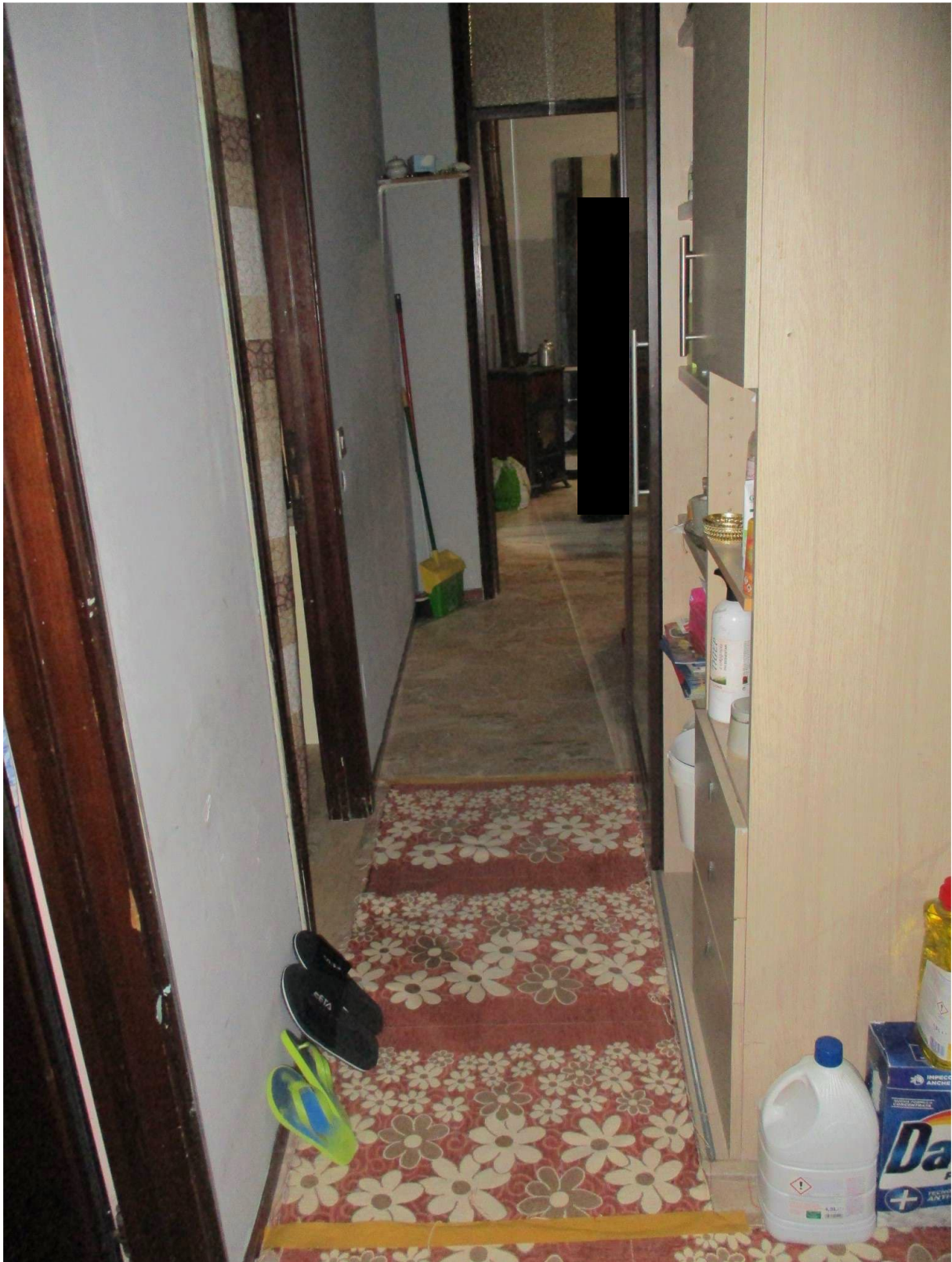
Fig. 28 – Vista d'insieme del corridoio