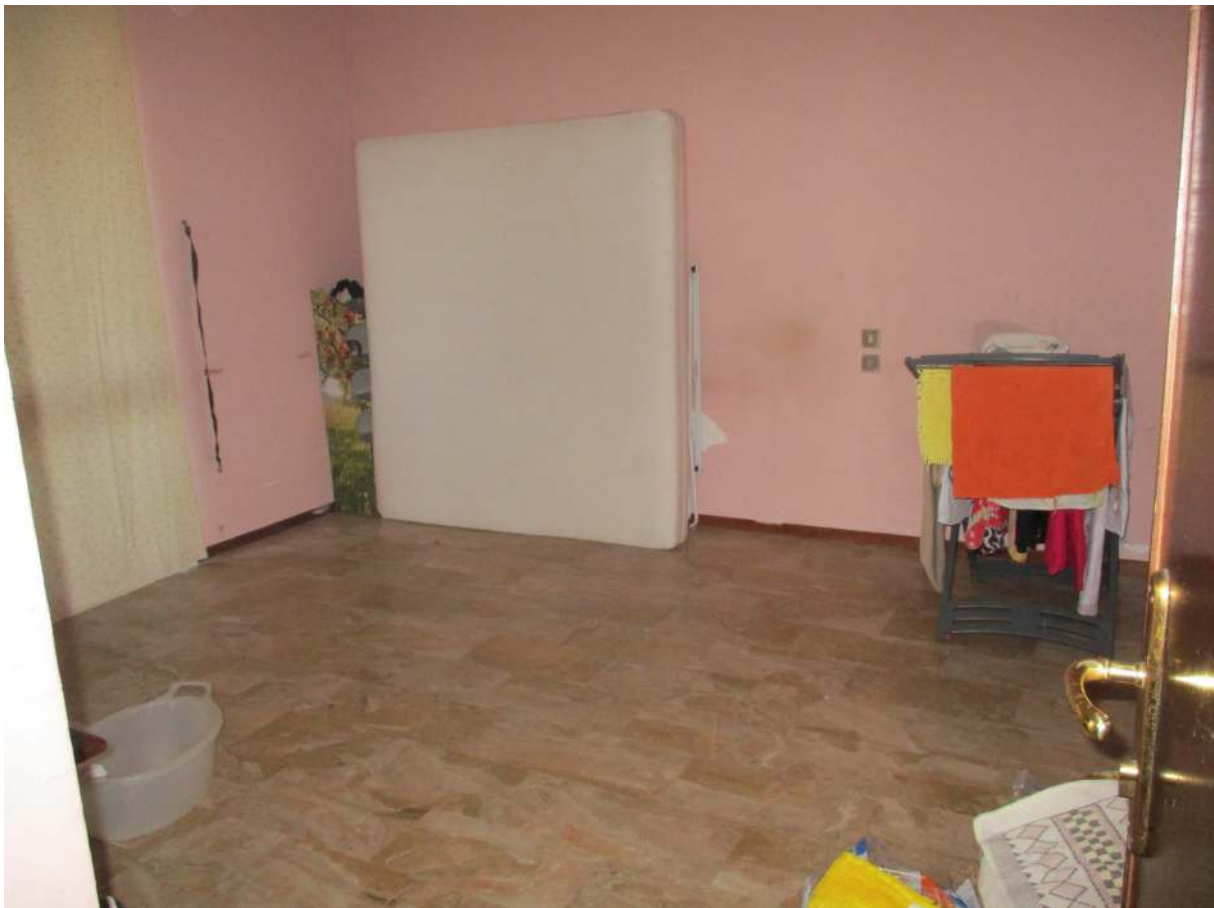
Fig. 30 – Vista d'insieme della seconda camera