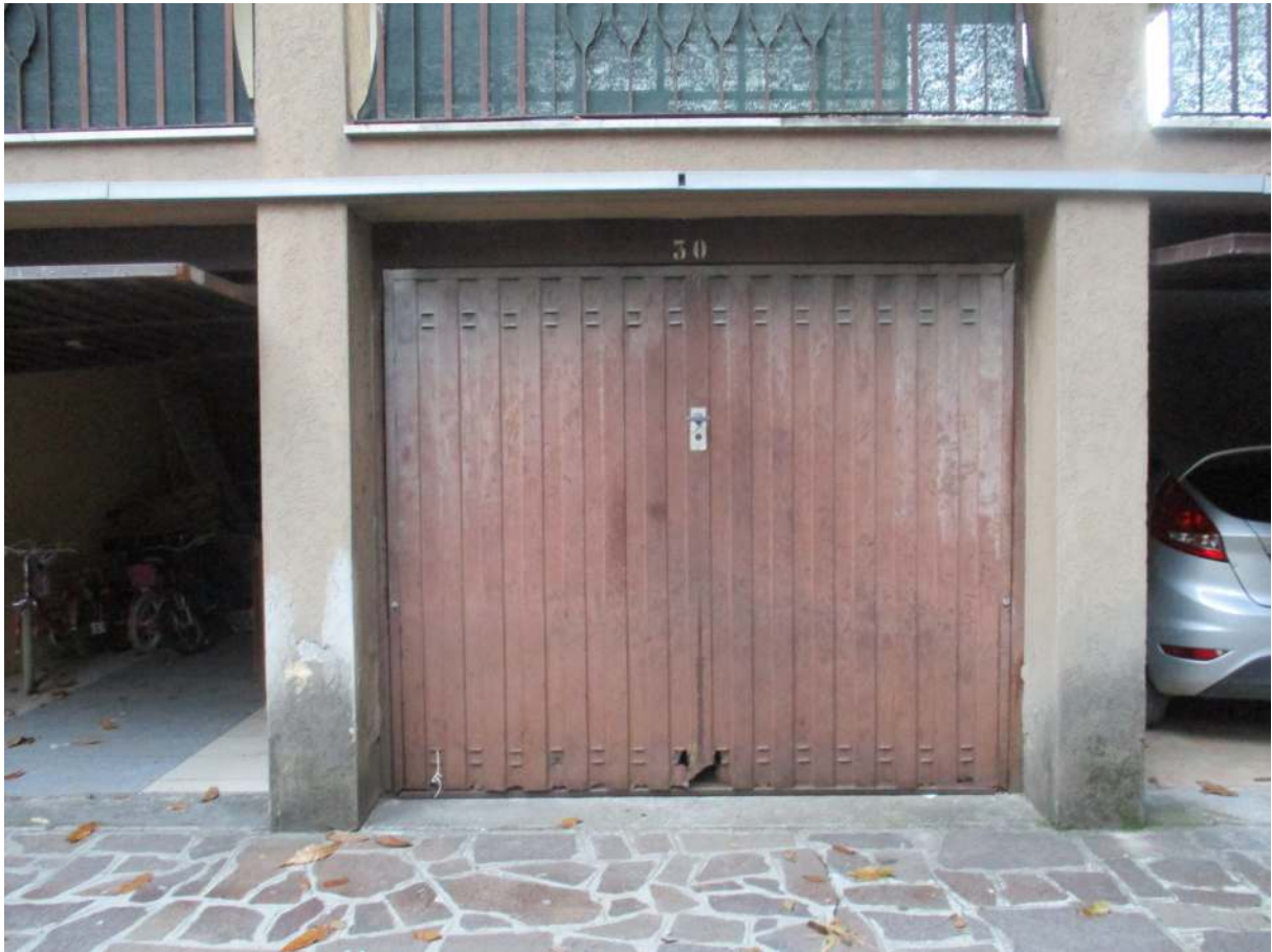
Fig. 41 – Vista della basculante del box pertinenziale all'alloggio oggetto di stima