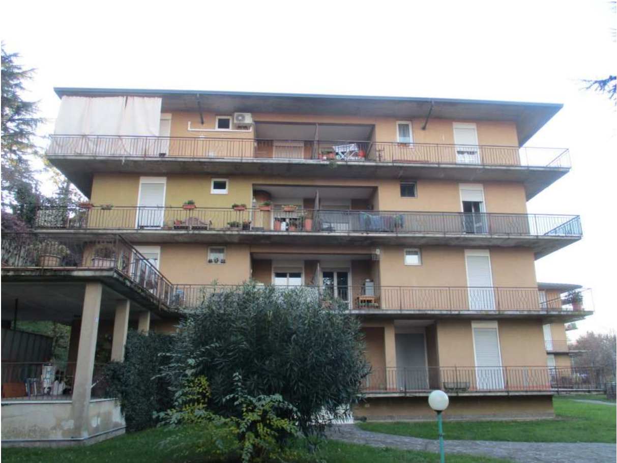
Fig. 3 – Vista d'insieme della palazzina B (prospetto est) dal cortile condominiale