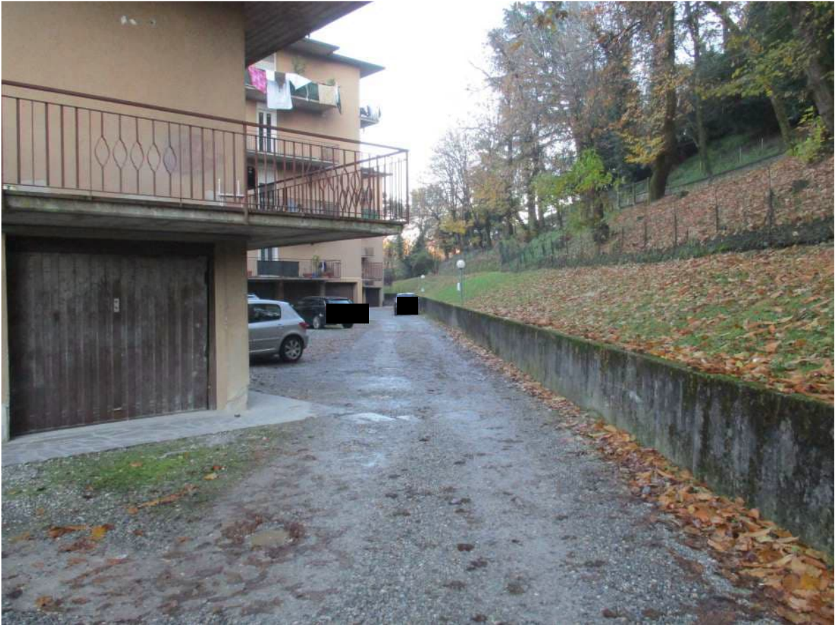
Fig. 11 – Vista del cortile comune posto sul retro del complesso (lato ovest)