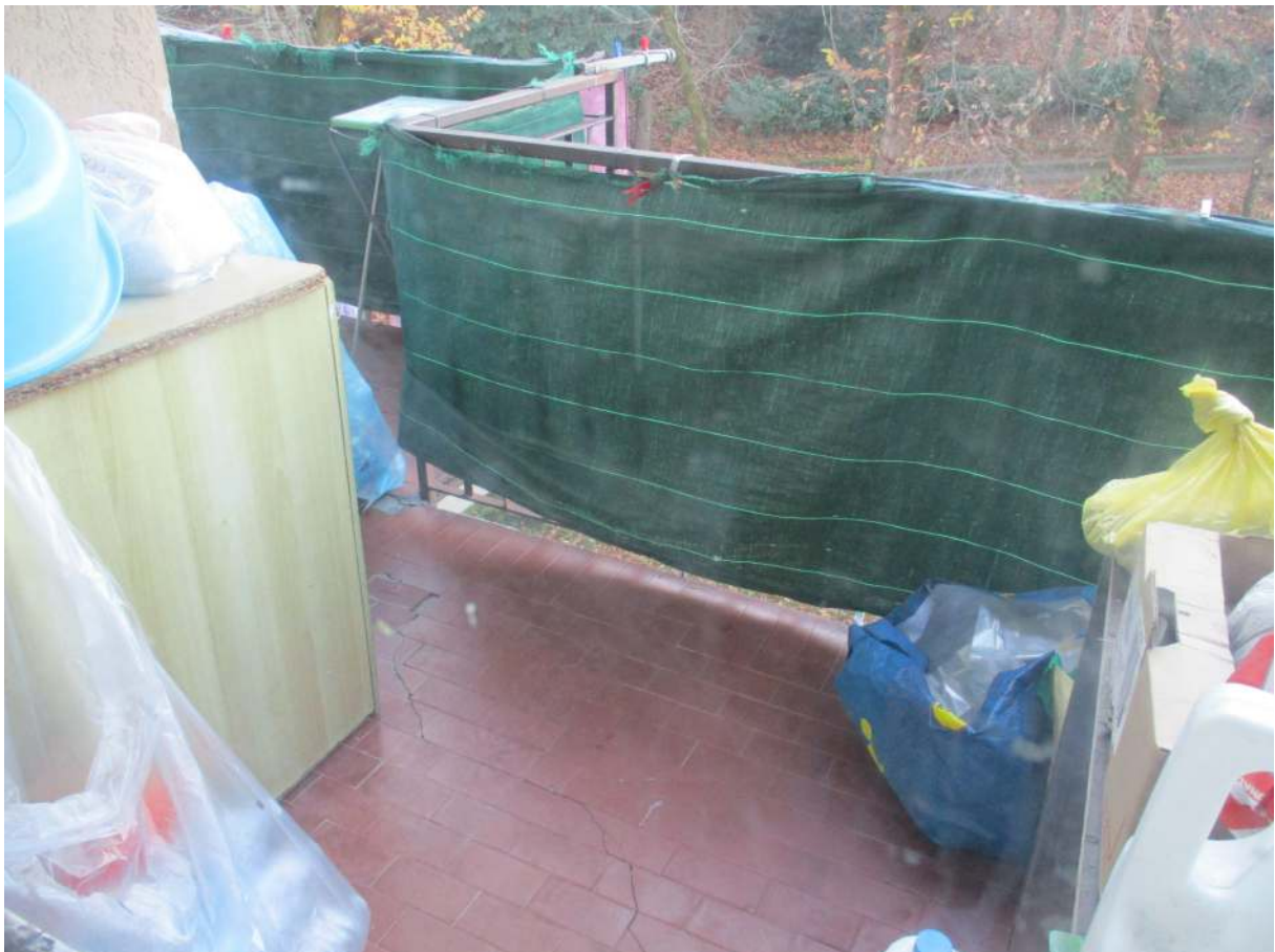
Fig. 23 – Vista del balcone con accesso dalla cucina