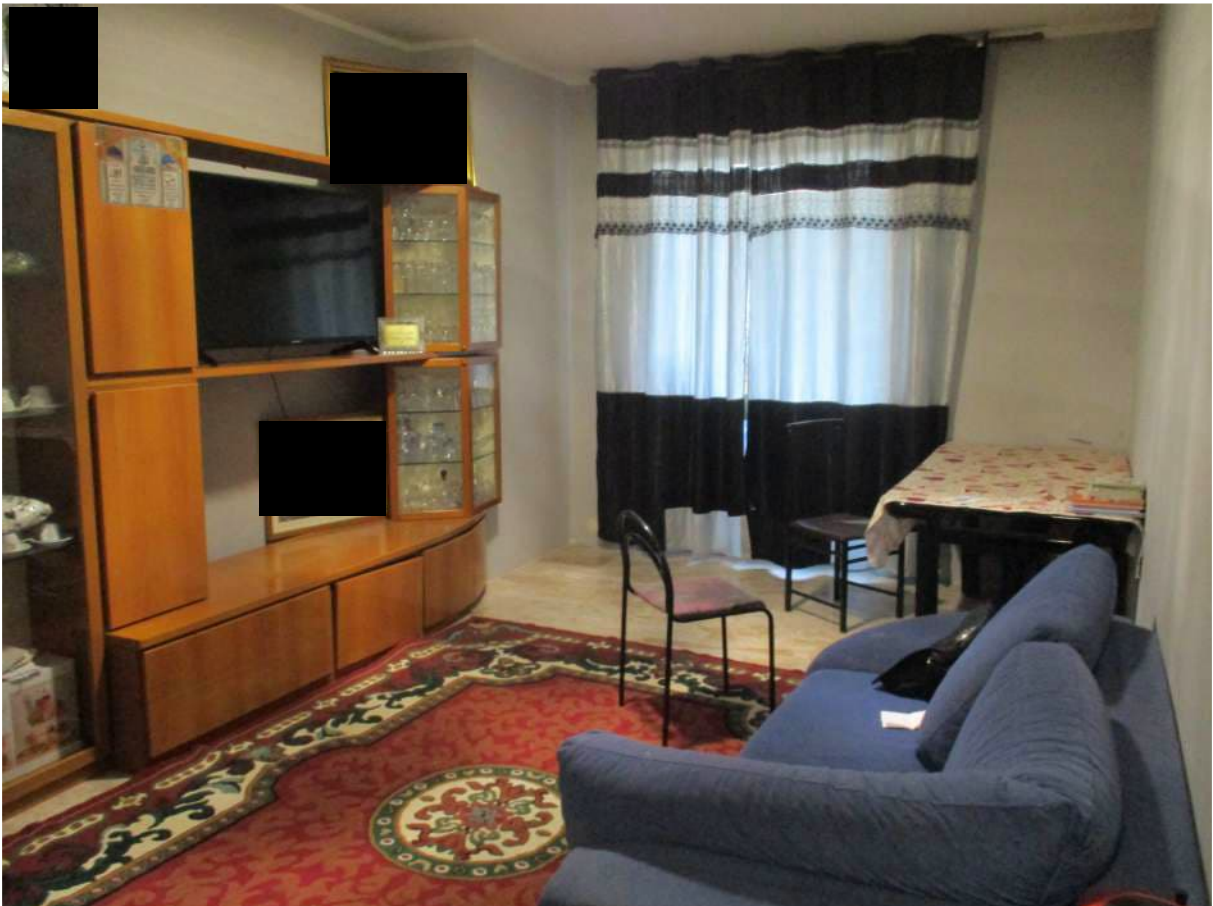
Fig. 26 – Vista d'insieme del soggiorno