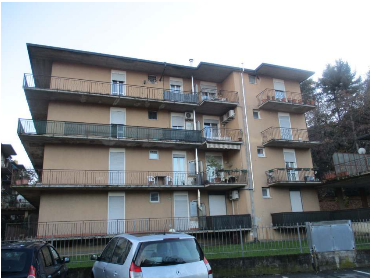
Fig. 2 – Vista d'insieme della palazzina B da Via Fosio (prospetto nord)