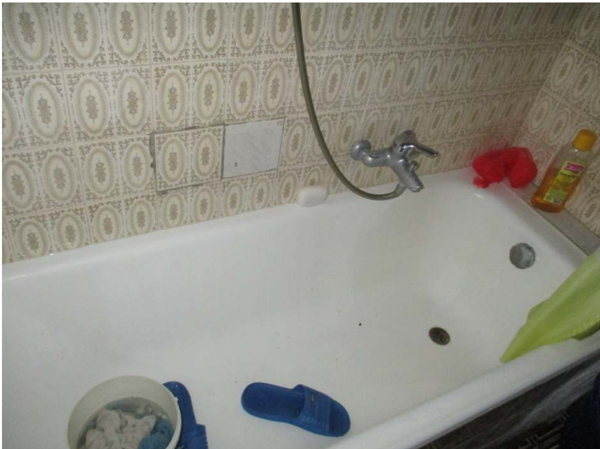
Fig. 34 – Vista del bagno (zona vasca)