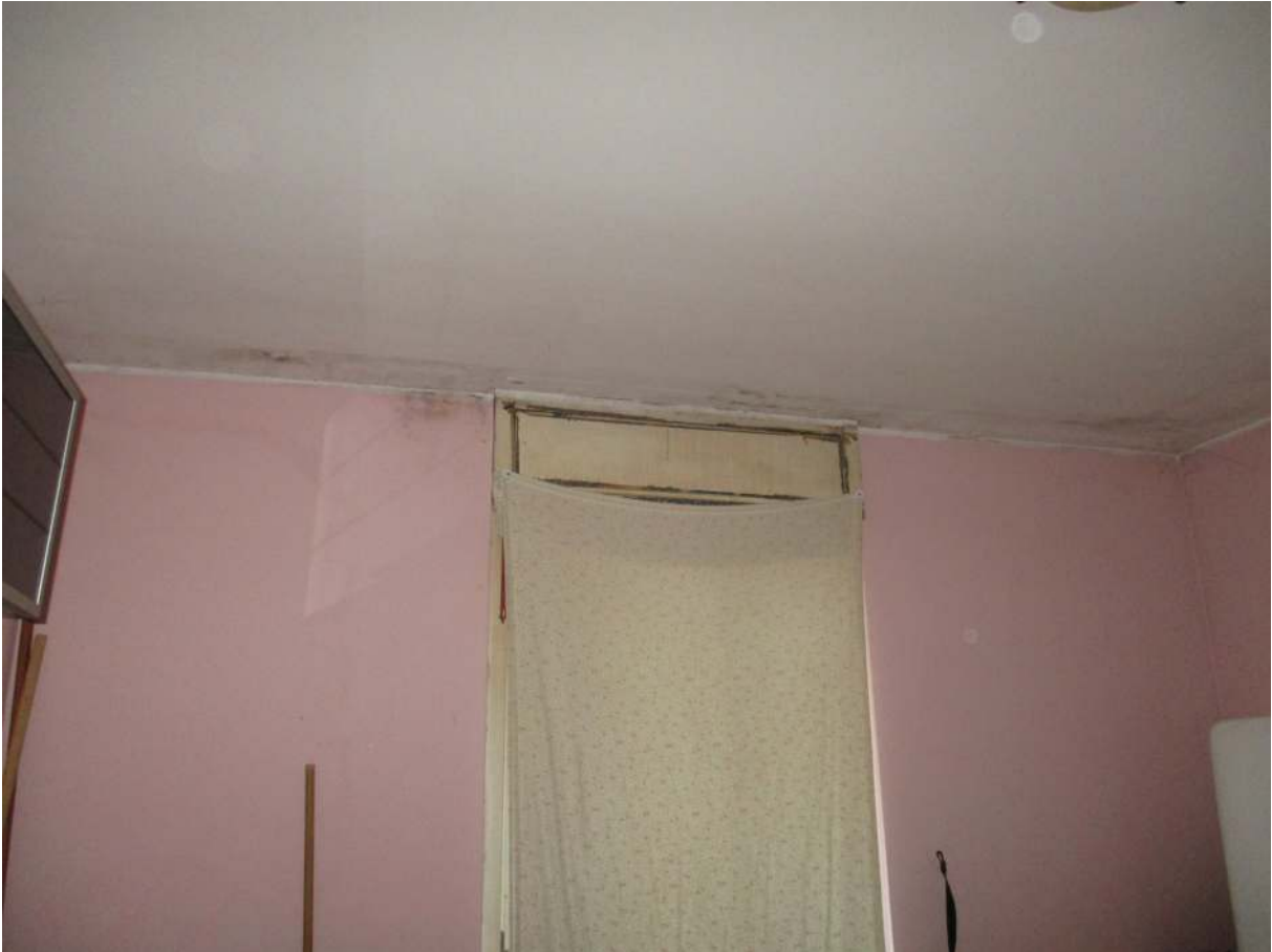
Fig. 31 – Vista di tracce di umidità/muffa sul soffitto/parete della seconda camera