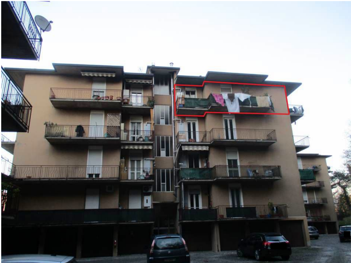
Fig. 5 – Vista d'insieme della palazzina B (lato ovest) con l'alloggio al P. 3° riquadrato in rosso