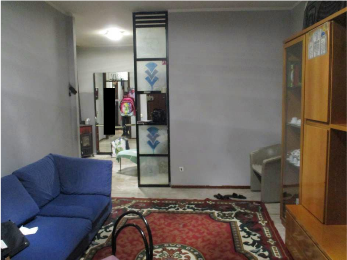
Fig. 25 – Vista d'insieme del soggiorno con sullo sfondo la zona ingresso