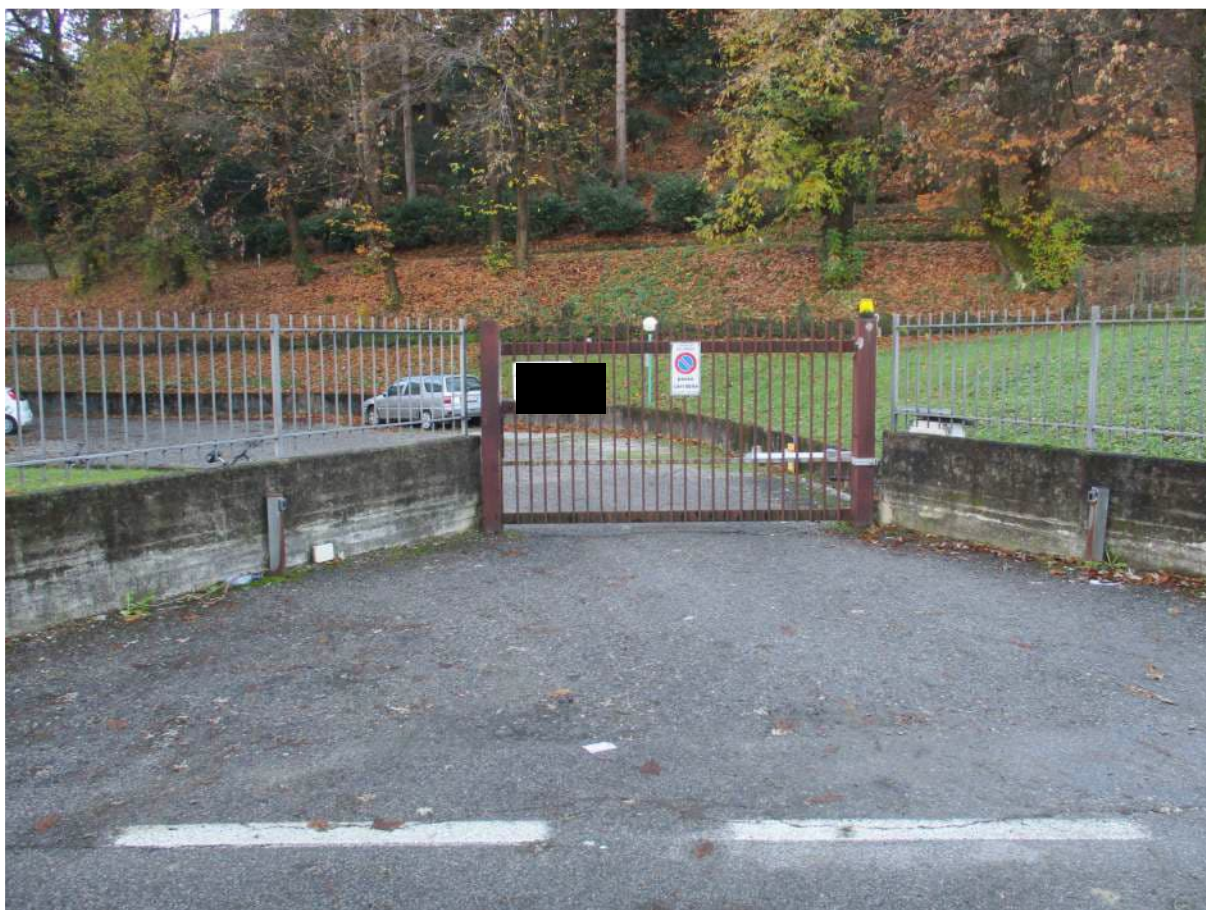
Fig. 9 – Vista dell'accesso carrale al complesso posto su Via Napoleonica