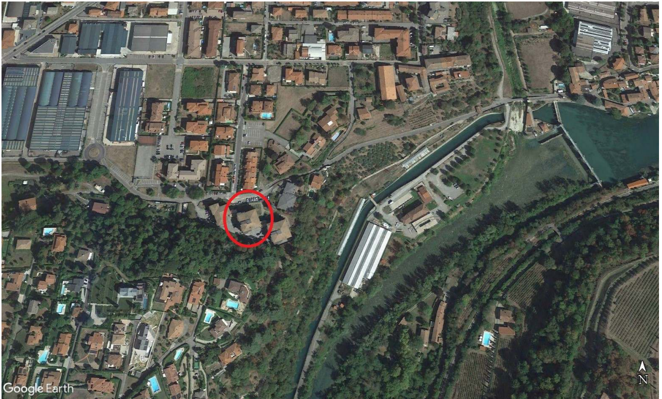
Fig. 1 – Immagine satellitare con il condominio in cui è inserito l'appartamento cerchiato in rosso