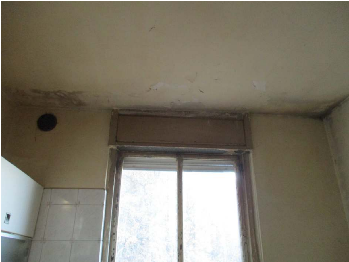
Fig. 22 – Vista di tracce di umidità/muffa sul soffitto della cucina