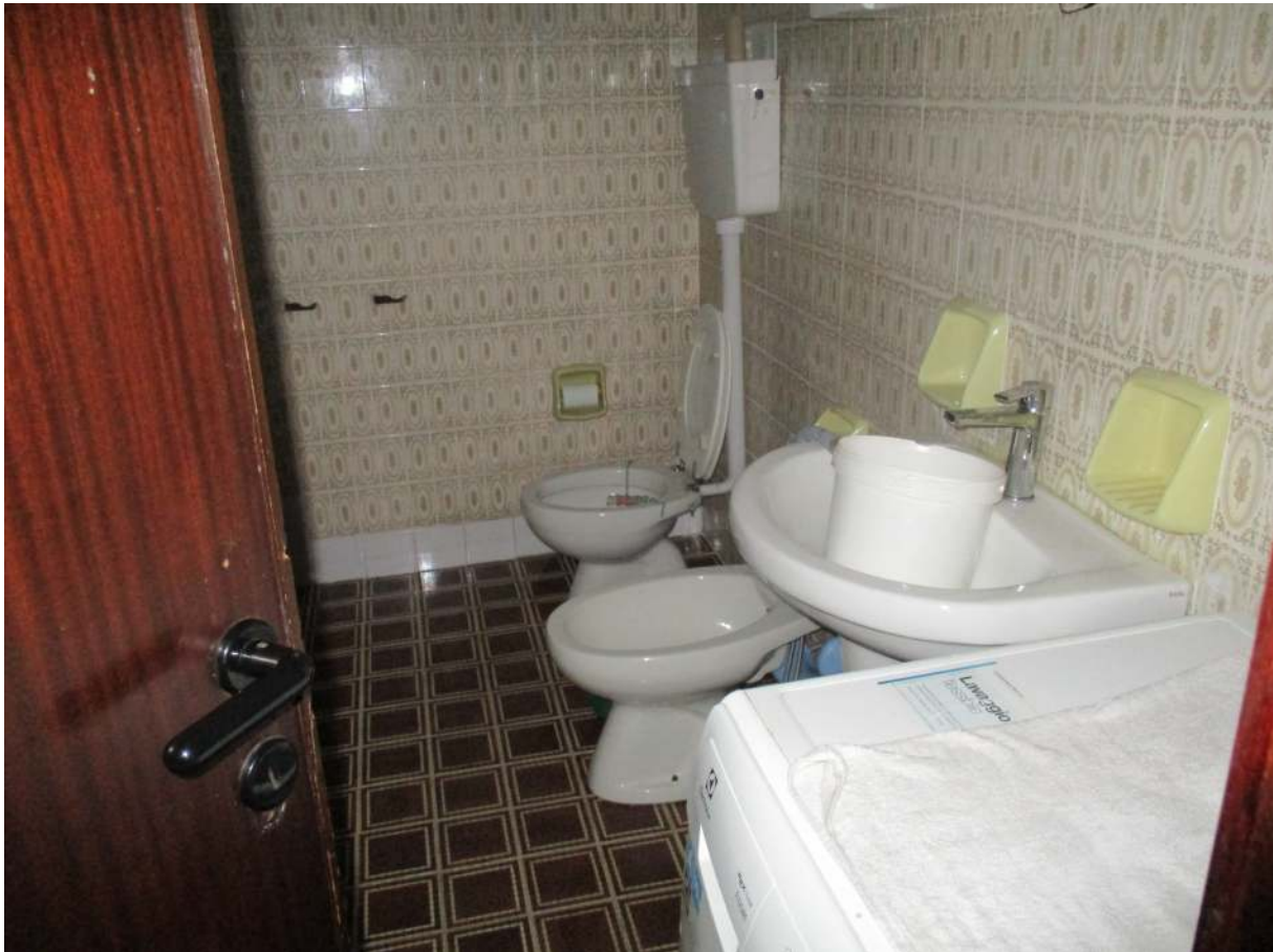
Fig. 33 – Vista del bagno (zona sanitari e lavabo)