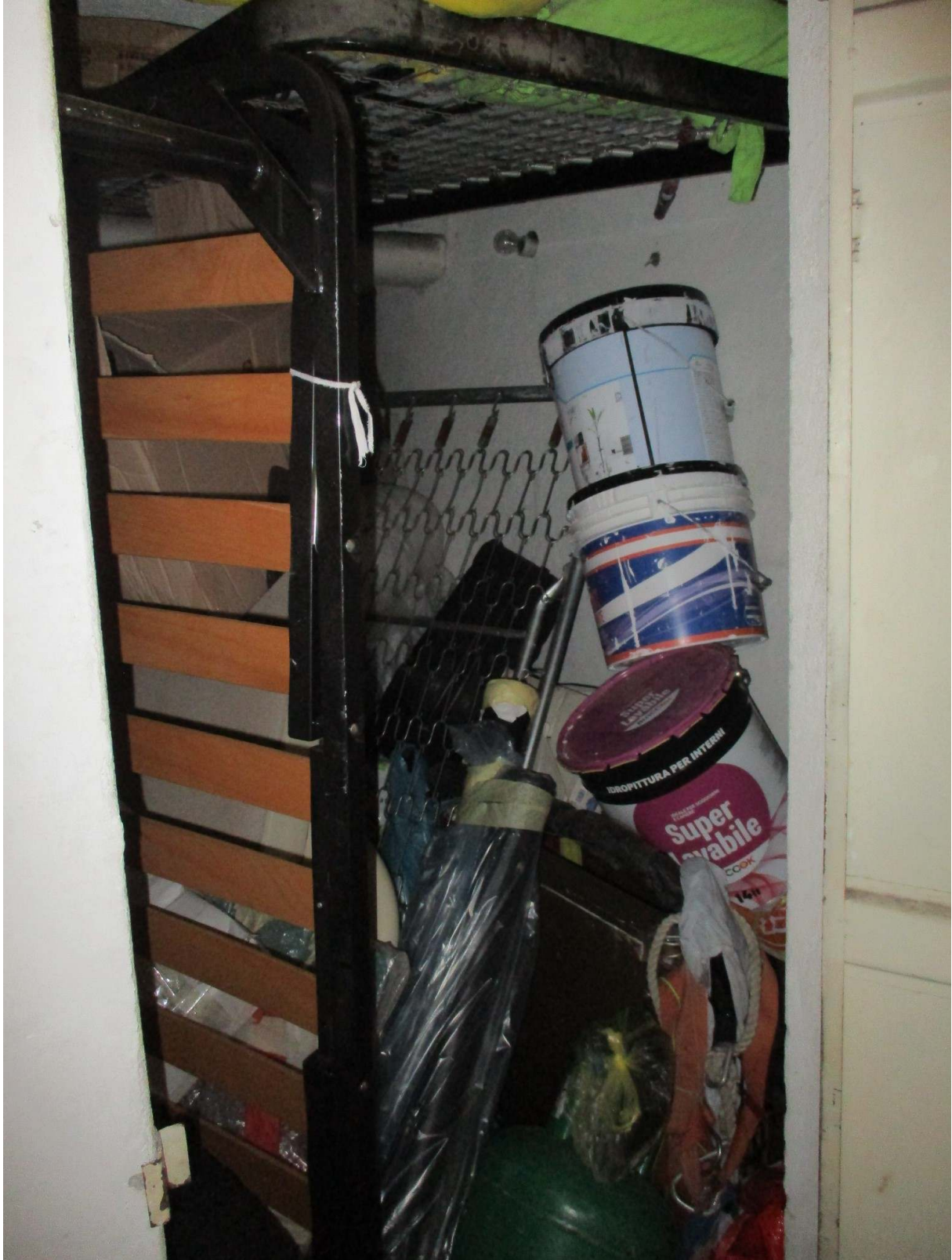
Fig. 40 – Vista interna della cantina pertinenziale