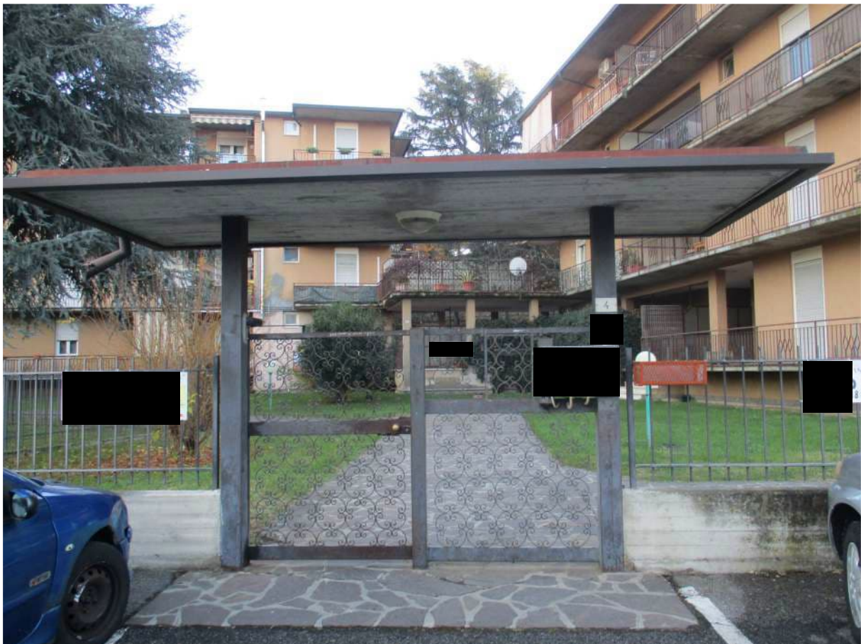
Fig. 6 – Vista dell'accesso pedonale al complesso posto su Via Fosio