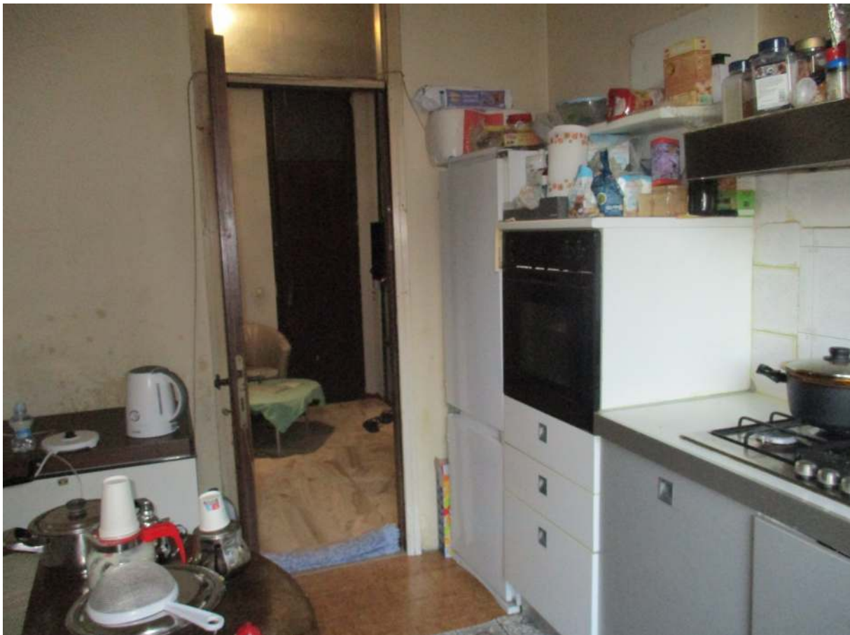
Fig. 20 – Vista d'insieme della cucina