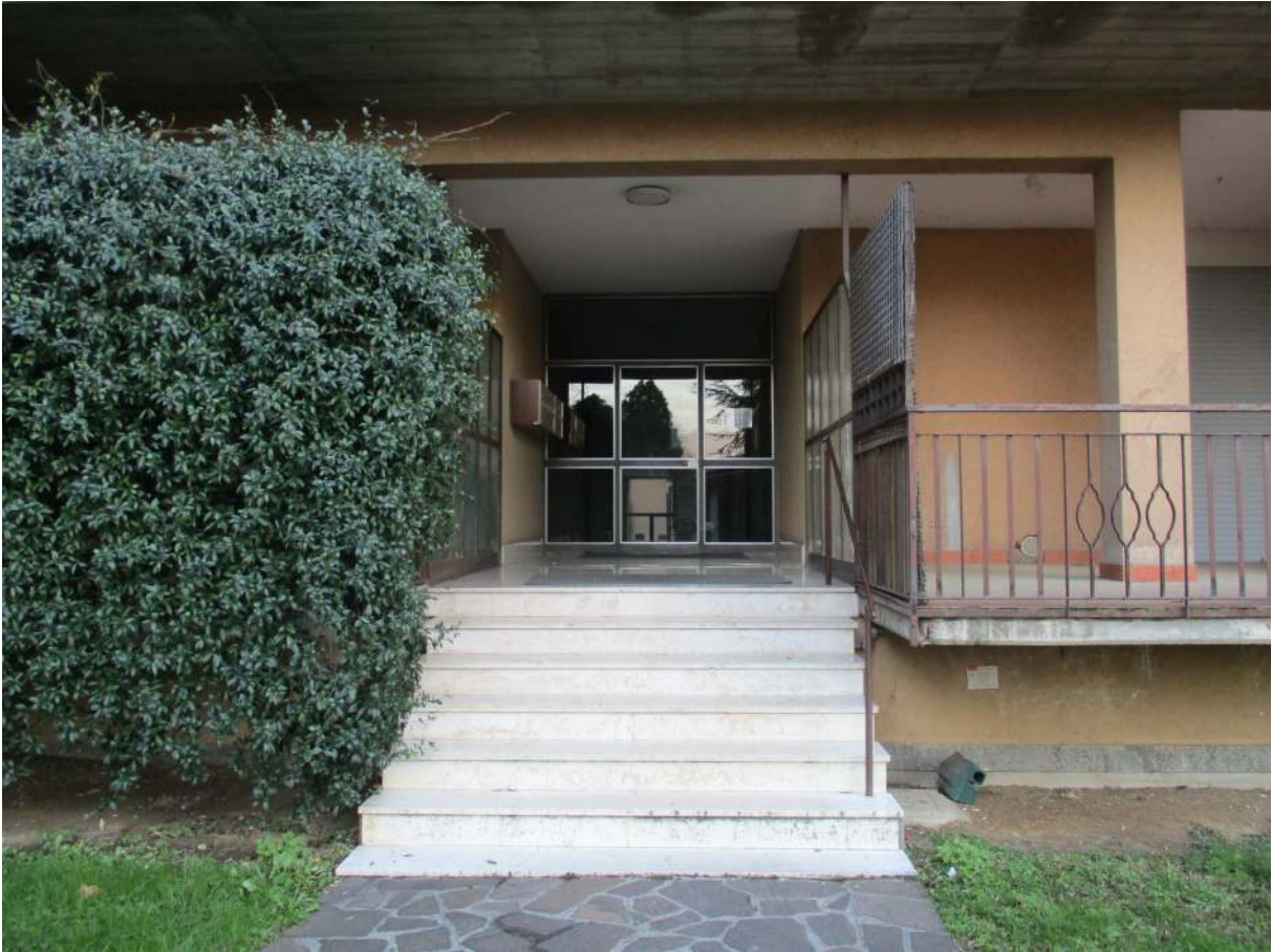
Fig. 13 – Vista dell'ingresso alla scala della palazzina B in cui si trova l'alloggio oggetto di stima