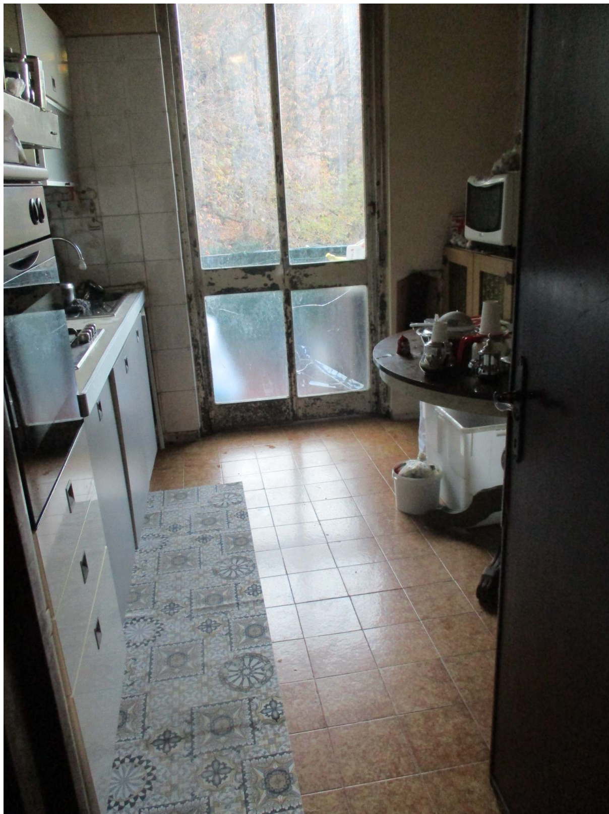
Fig. 21 – Vista d'insieme della cucina