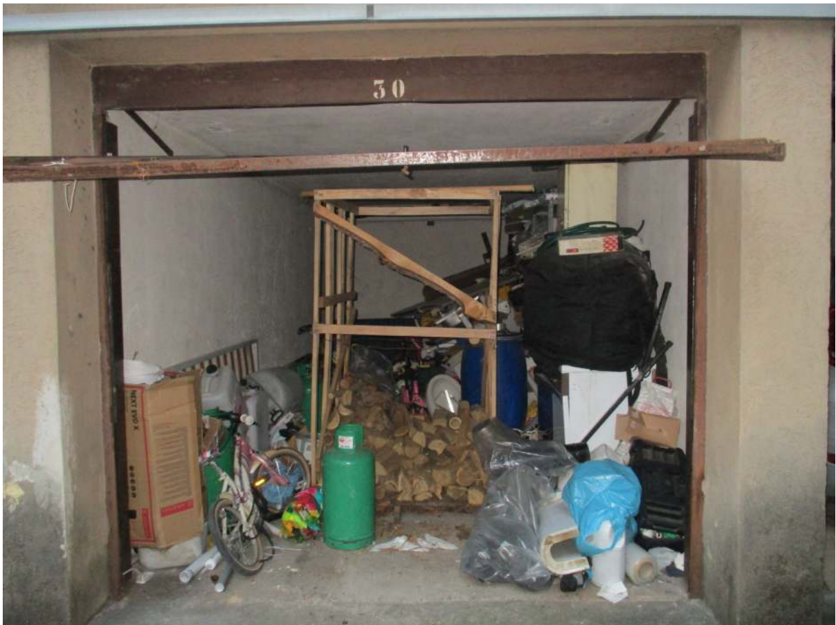
Fig. 42 – Vista interna del box pertinenziale