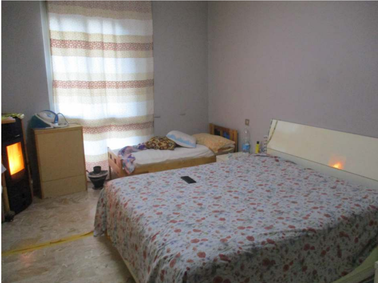
Fig. 29 – Vista d'insieme della camera matrimoniale adiacente alla cucina