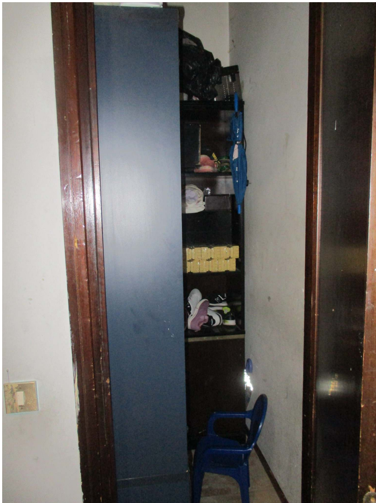
Fig. 24 – Vista del ripostiglio nella zona dell'ingresso