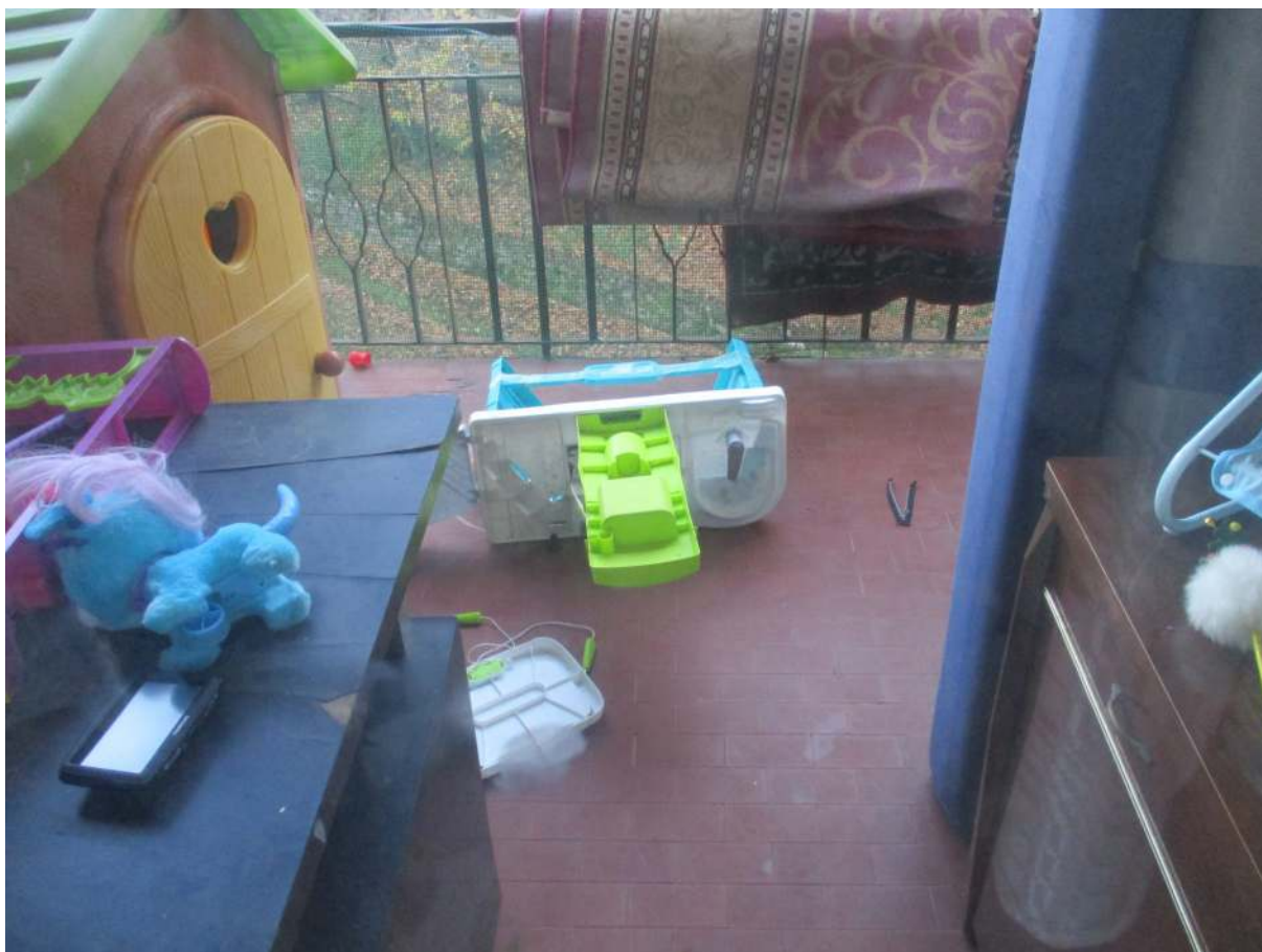
Fig. 27 – Vista del balcone con accesso dal soggiorno