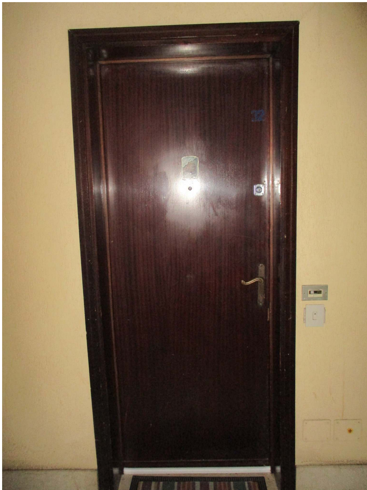
Fig. 18 – Vista del portoncino d'ingresso dell'appartamento al P.3° oggetto di stima