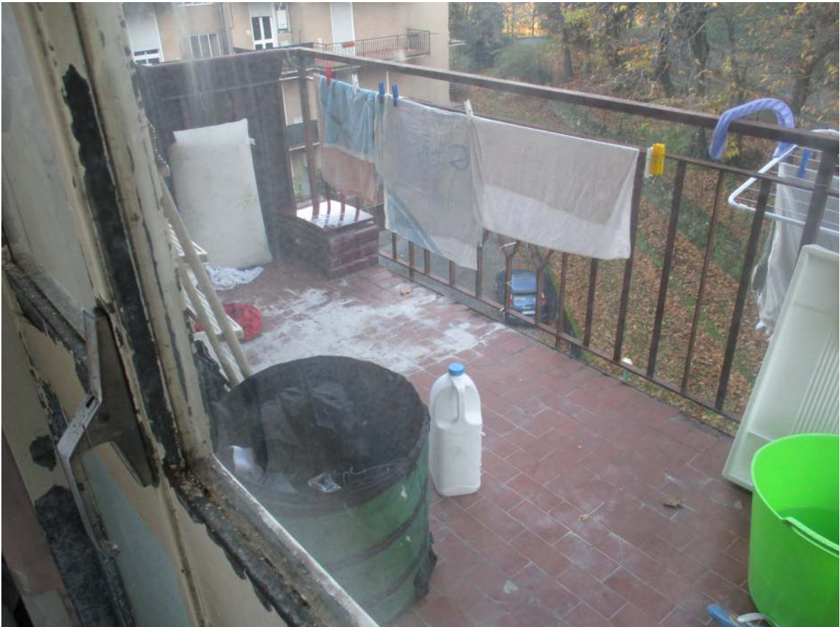
Fig. 32 – Vista del balcone con accesso dalla seconda camera