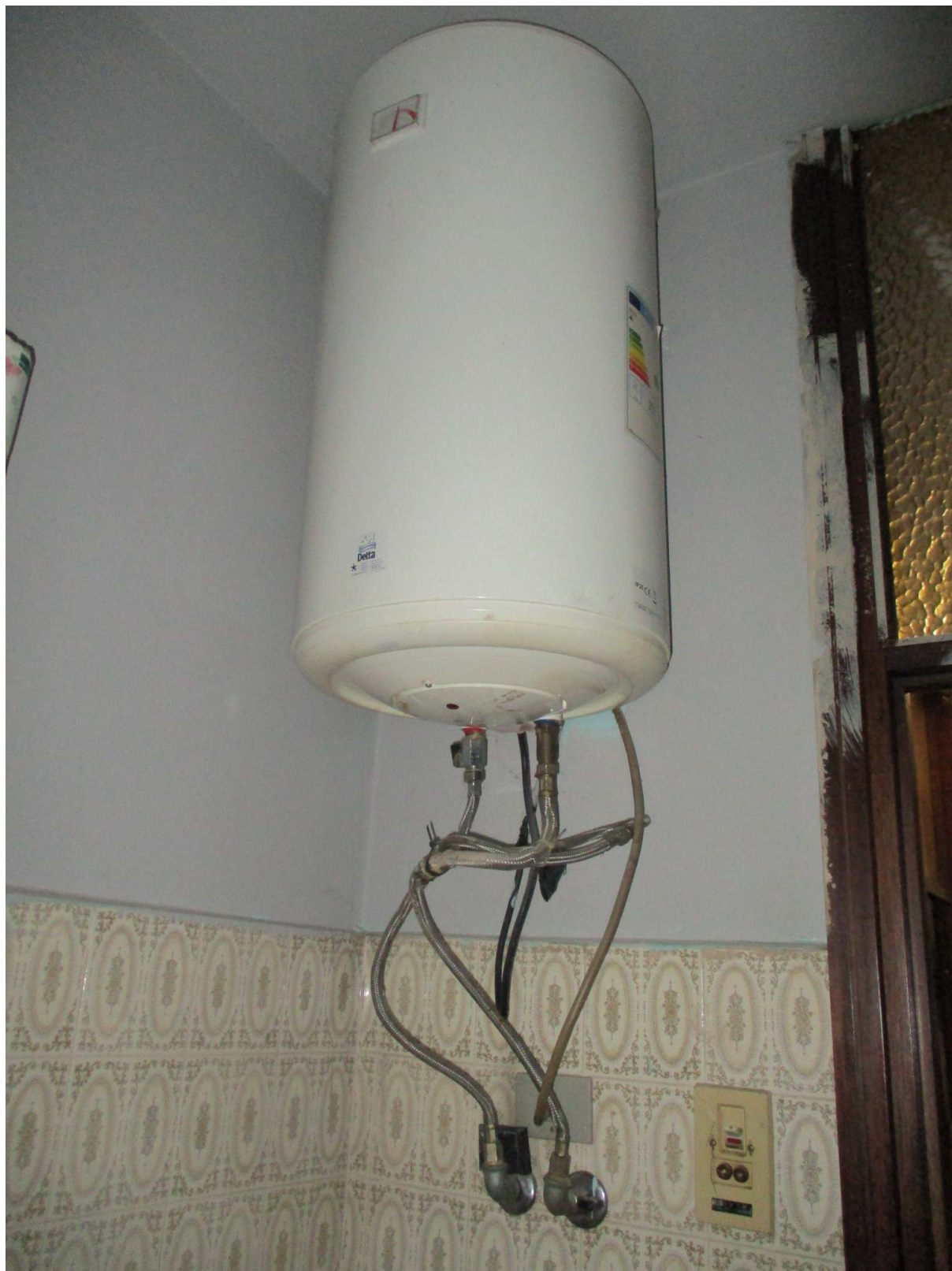
Fig. 37 – Vista dello scaldabagno elettrico installato nel bagno