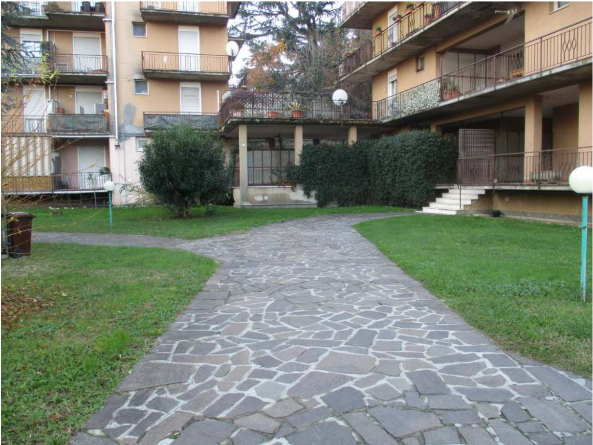
Fig. 7 – Vista del vialetto pedonale interno alla proprietà condominiale