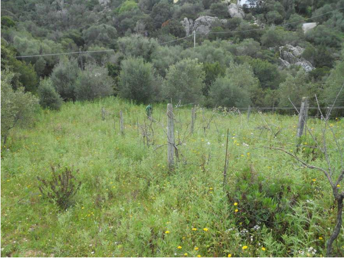
Foto 25: scorci dei terreni verso sud-est. Si vedono alcuni filari di vigna.