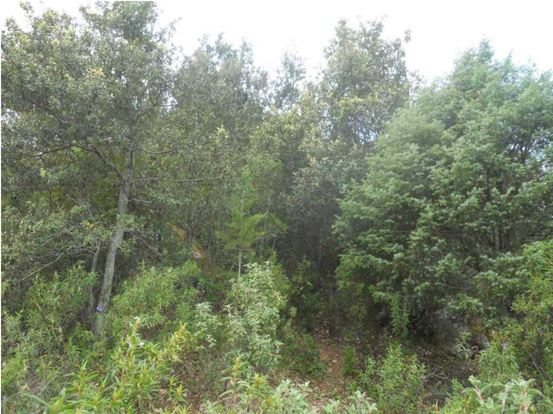
Foto 26: presenza di alberature e piante tipiche della macchia mediterranea.