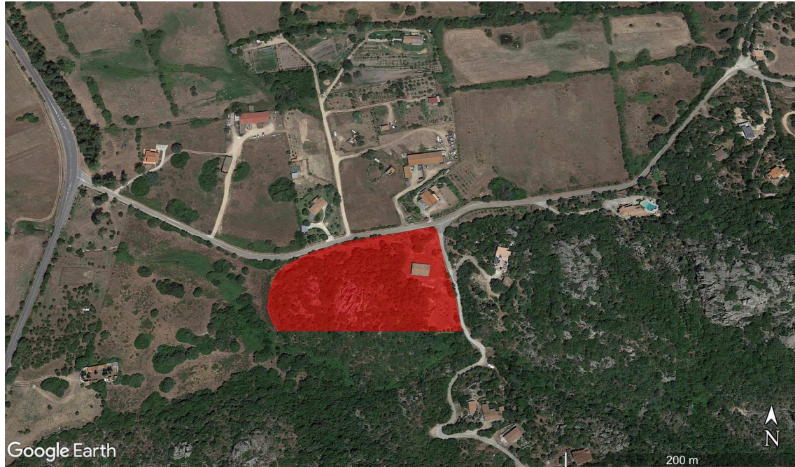
Ortofoto. Ubicazione bene oggetto in riferimento al contesto immediato. Con la campitura rossa sono indicati i mappali 1050, 824 e 825 del Foglio 44 ascritto al Catasto Terreni. In mezzo il fabbricato distinto al NCEU al Foglio 44 particella 1051.