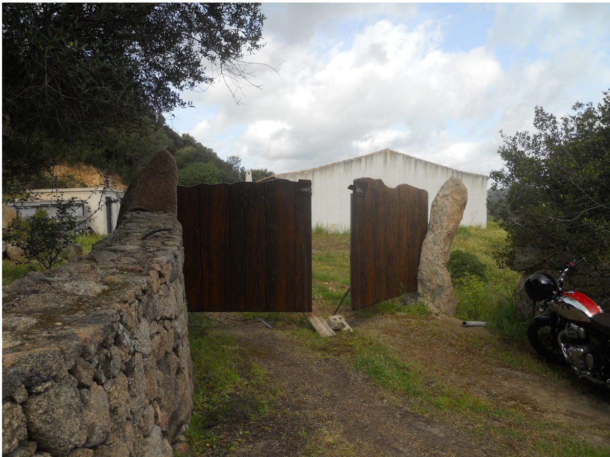
Scatto dalla strada di penetrazione agraria, cancello di ingresso al compendio immobiliare.