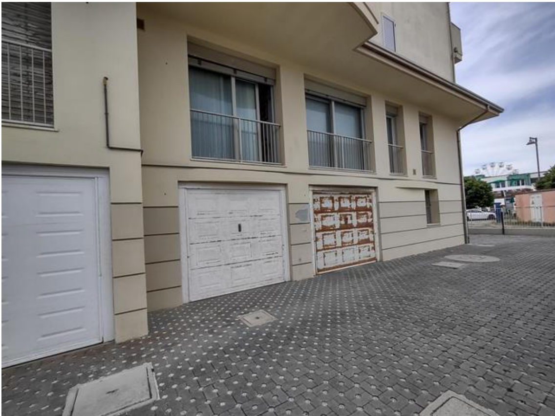
FOTO 18. Garage sub 35: portone basculante con evidenti segni di ruggine