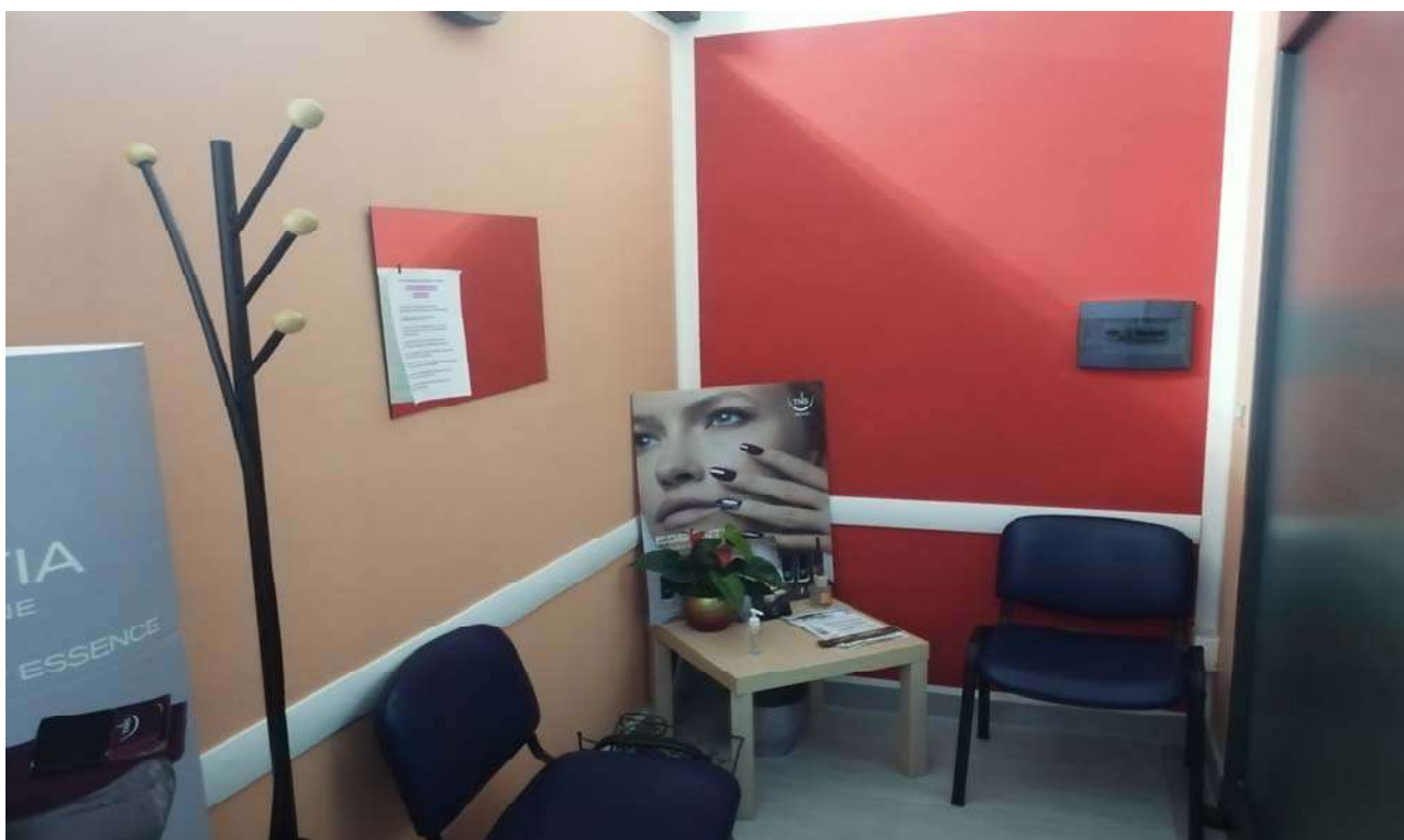
Foto 8: Particolare degli interni laboratorio per arti e mestieri dell'unità sub. 5 – ingresso/sala d'attesa.