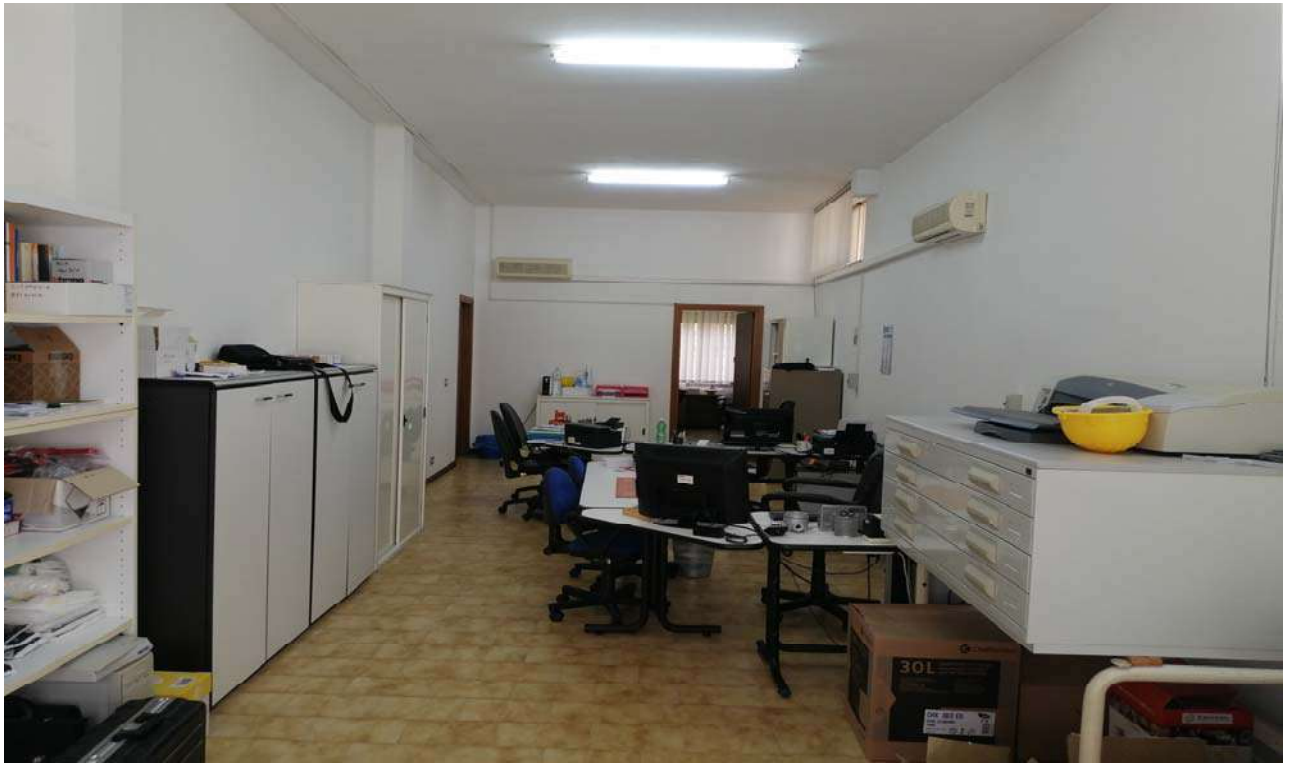
Foto 3: Vista dei locali adibiti a laboratorio per arti e mestieri unità sub. 4.