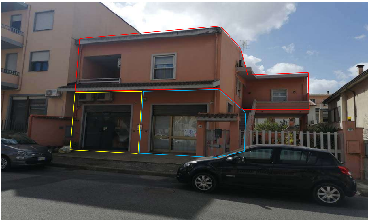
Foto 1: Vista d'insieme dell'immobile oggetto di pignoramento. Al piano terra i due locali adibiti laboratorio per arti e mestieri, ed al piano primo l'unità immobiliare ad uso abitativo.