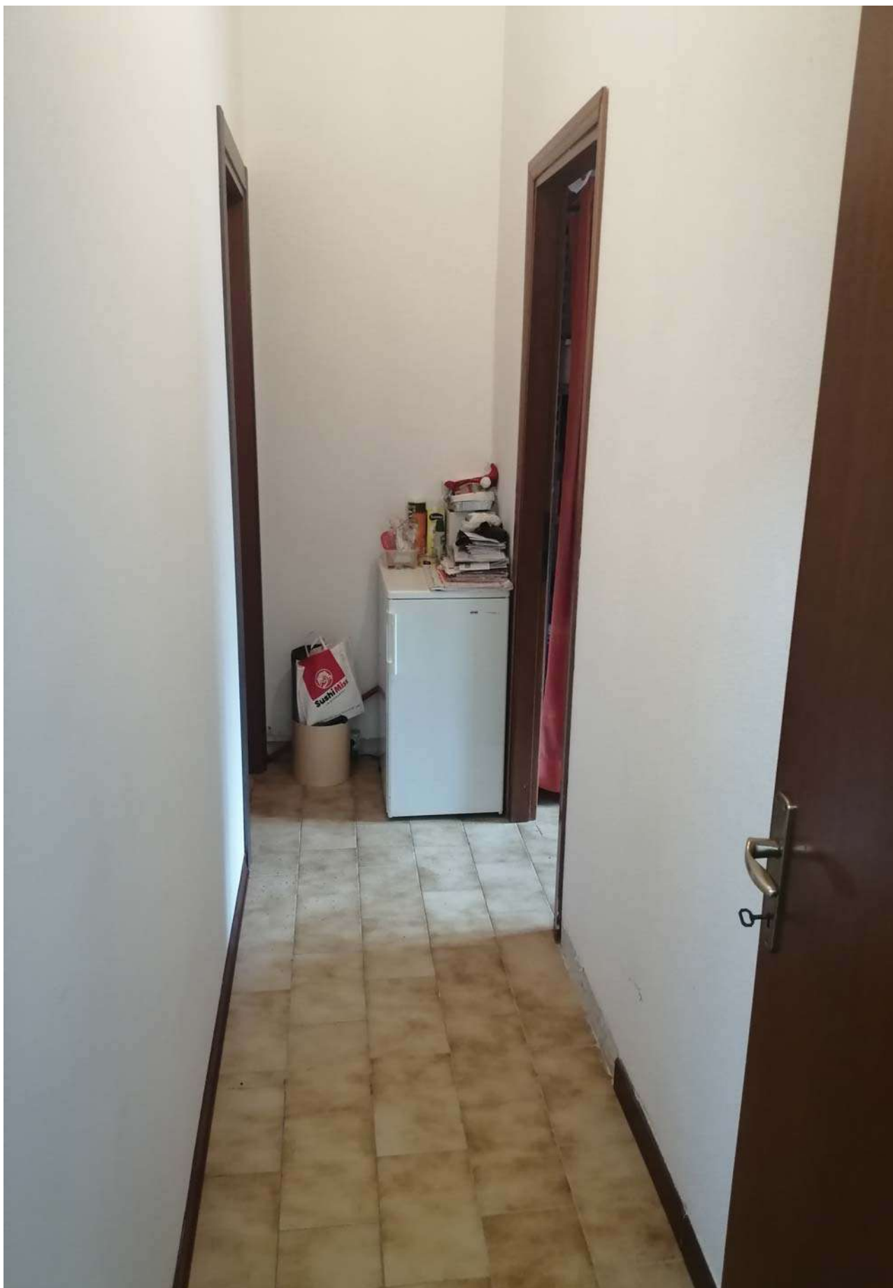
Foto 17: Particolare sul corridoio che disimpegna sui servizi igienici dell'unità sub 5.