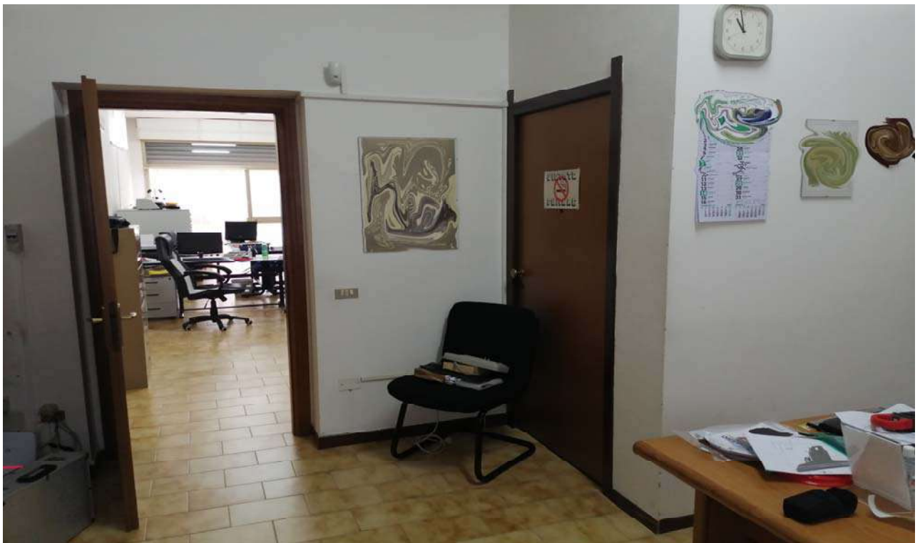
Foto 6: Vista complementare alla precedente; sulla destra la porta del locale archivi al quale non è stato possibile accedere.