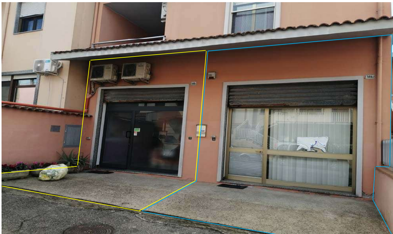
Foto 2: Particolare sull'accesso ai due locali ad uso laboratori per arti e mestieri a dx l'unità sub. 4 e a sx l'unità sub. 5.