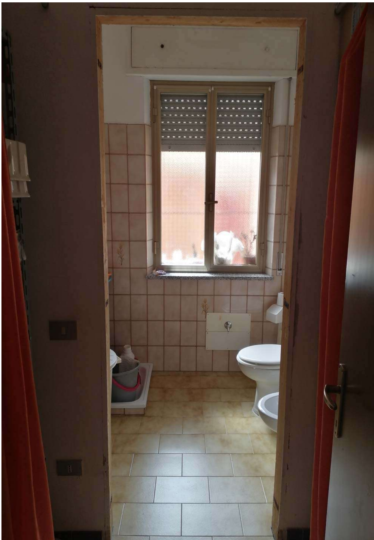
Foto 18: Vista sui servizi igienici bagno e antibagno dell'unità sub. 5.