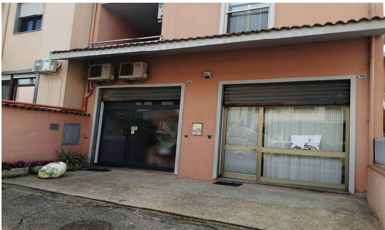
Foto 7: Particolare sull'accesso ai due locali ad uso laboratori per arti e mestieri a dx l'unità sub. 4 e a sx l'unità sub. 5.