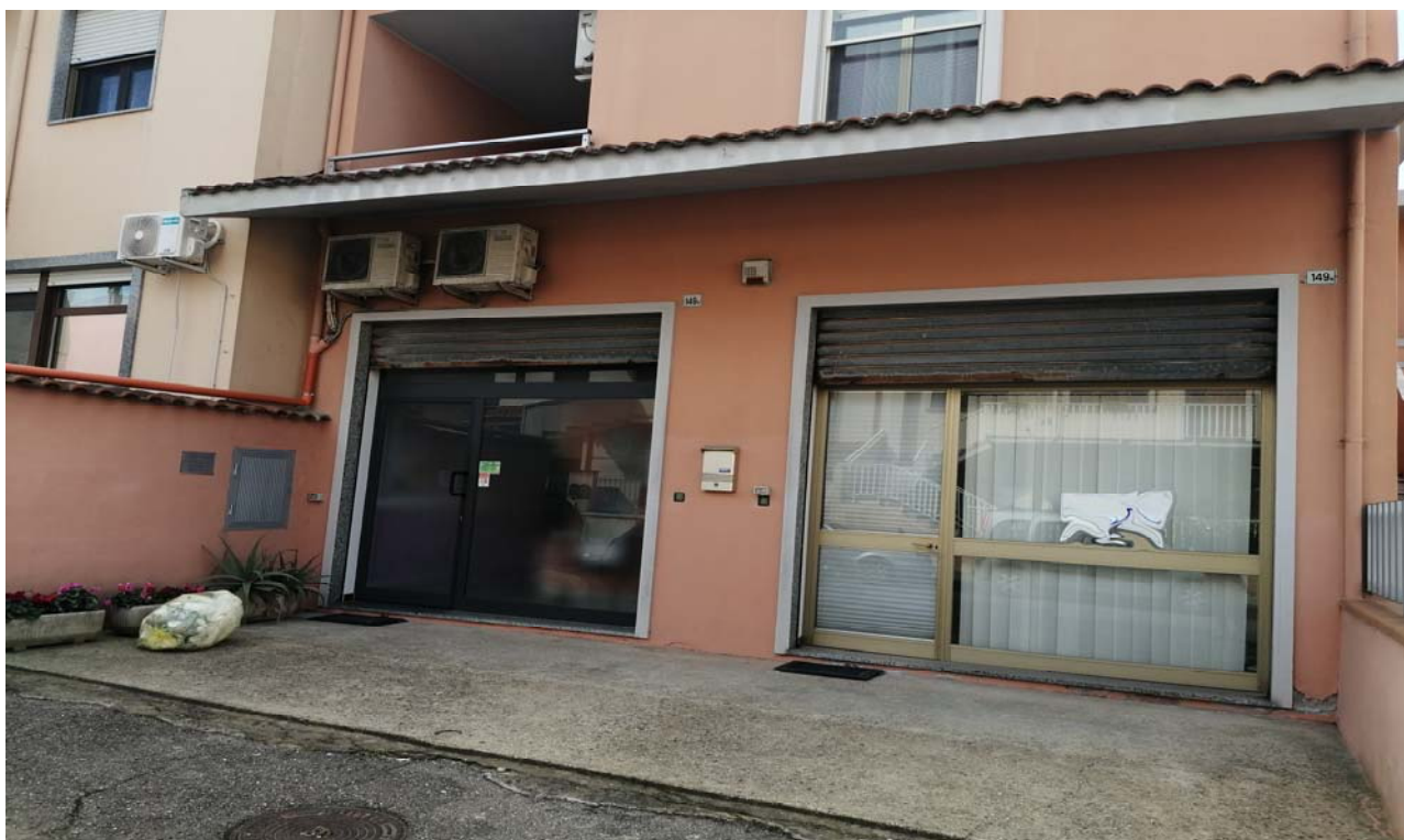
Foto 7: Particolare sull'accesso ai due locali ad uso laboratori per arti e mestieri a dx l'unità sub. 4 e a sx l'unità sub. 5.