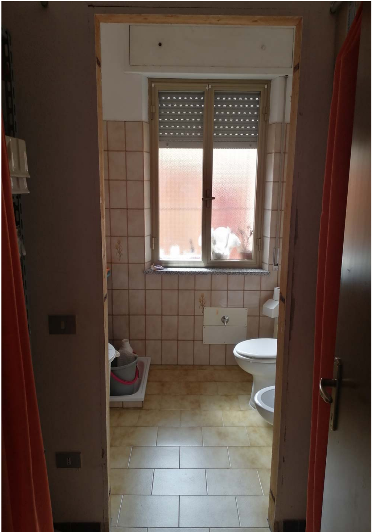
Foto 18: Vista sui servizi igienici bagno e antibagno dell'unità sub. 5.