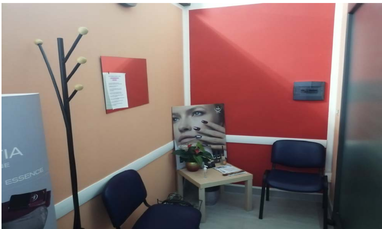
Foto 8: Particolare degli interni laboratorio per arti e mestieri dell'unità sub. 5 – ingresso/sala d'attesa.