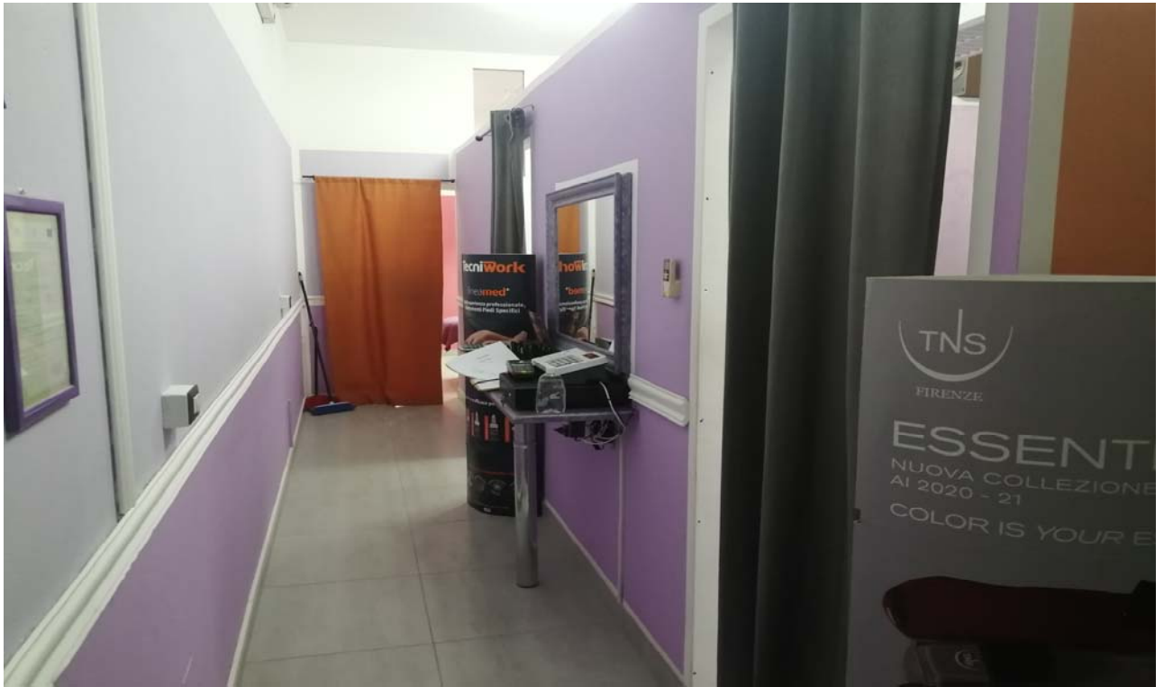
Foto 9: Particolare del corridoio dell'unità immobiliare adibita a d arti e mestieri sub. 5.