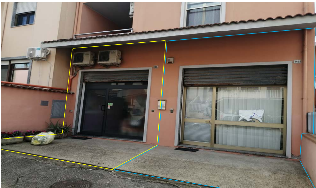
Foto 2: Particolare sull'accesso ai due locali ad uso laboratori per arti e mestieri a dx l'unità sub. 4 e a sx l'unità sub. 5.