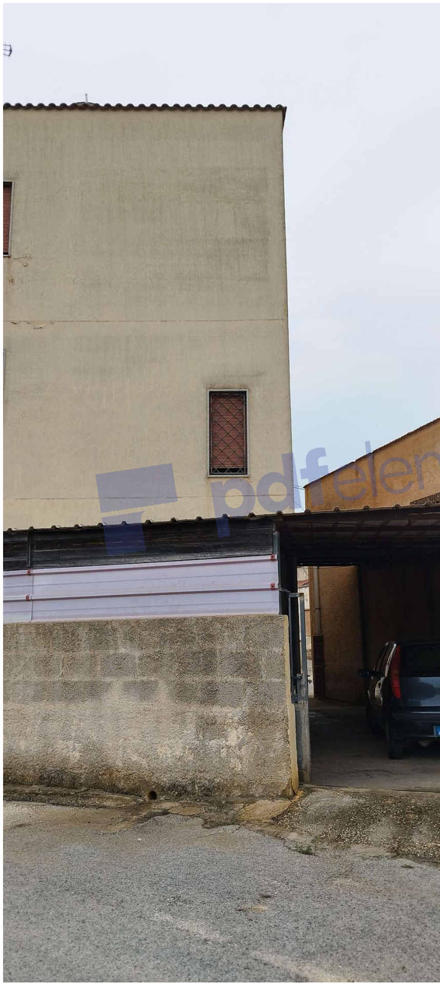
FOTO 3 - PROSPETTO SECONDARIO