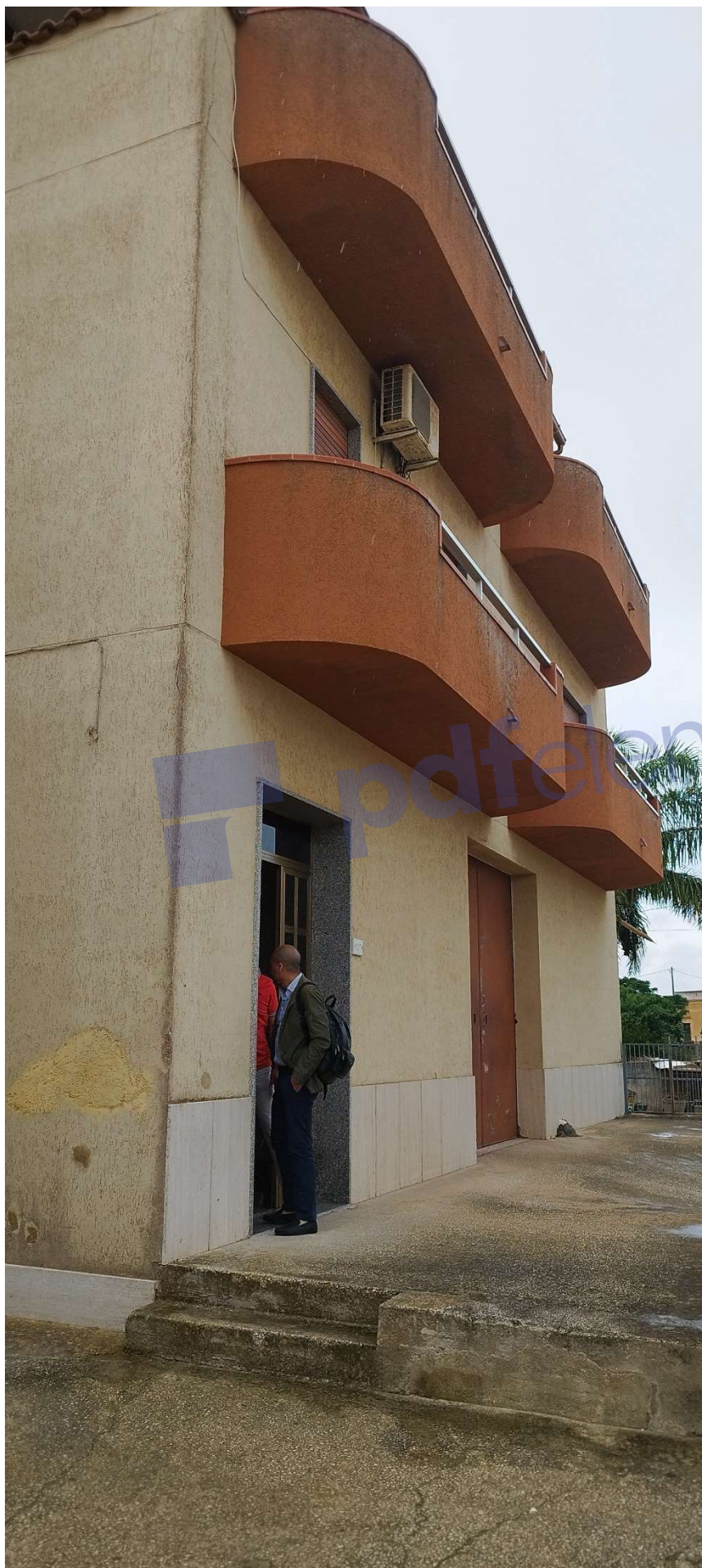
FOTO 4 - PROSPETTO PRINCIPALE