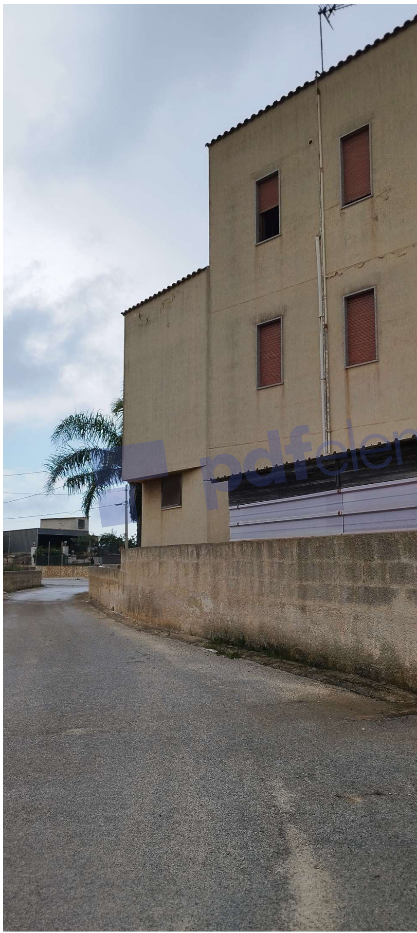
FOTO 2 - PROSPETTO SECONDARIO