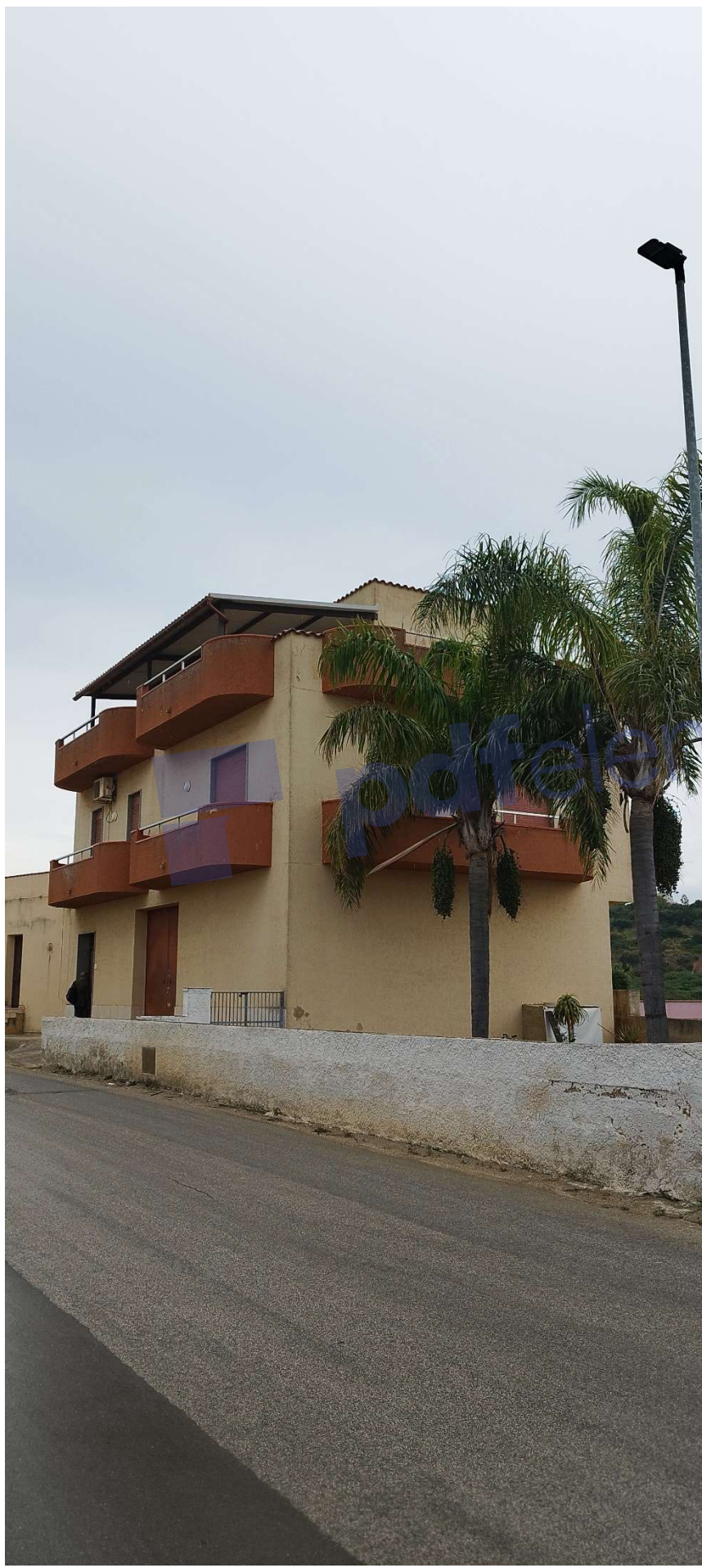
FOTO 1 - PROSPETTO PRINCIPALE