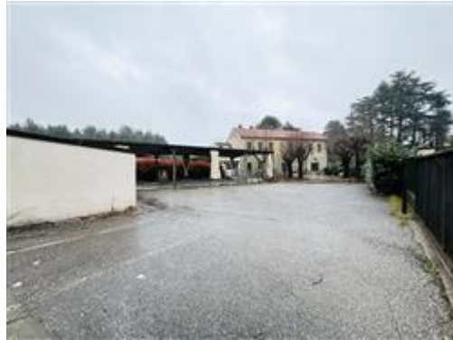
Vista su cortile interno