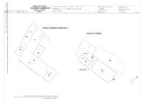
Particella 1119, sub.1. Planimetria Scheda 2.