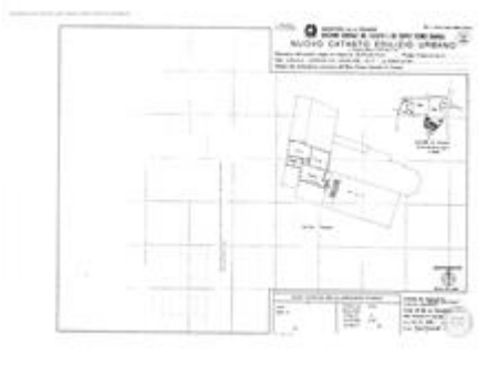
Particella 1119, sub.2. Planimetria.