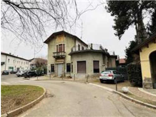
Vista su Piazza Madonnina

L'intero edificio sviluppa 2 piani fuori terra, 1 piano interrato.