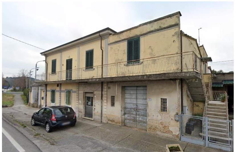
Fig. 2 – Individuazione del fabbricato comprendente l'immobile oggetto di stima