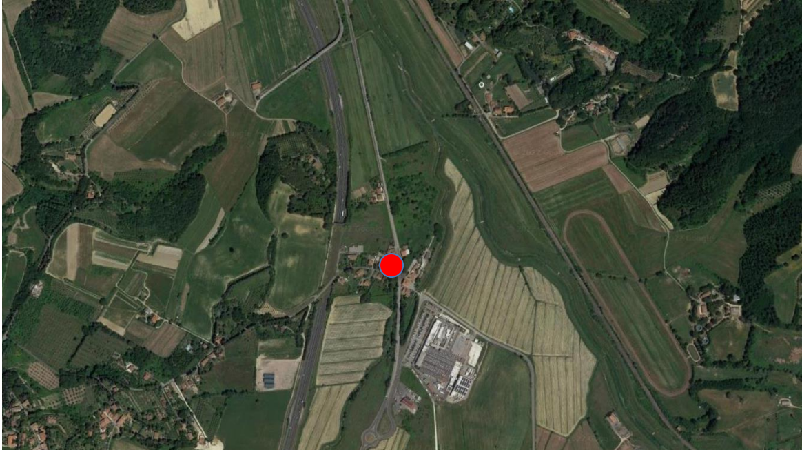
Fig. 1 – Localizzazione del bene immobile oggetto di stima

all'agricoltura, con pochi esercizi di vicinato e scarsamente servita dai mezzi pubblici.