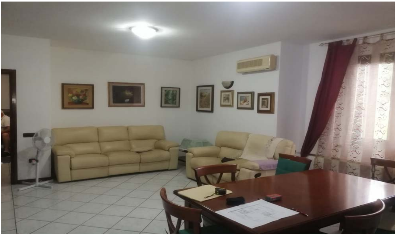
Foto 6: Immagine complementare della precedente; vista dell'ambiente soggiorno - pranzo.