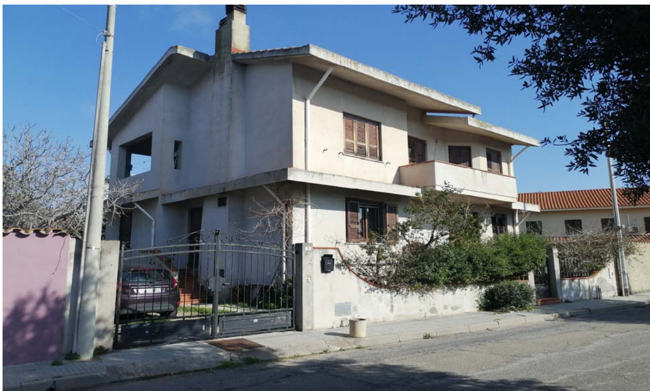
Foto 2: Altra vista d'insieme dell'immobile oggetto della perizia