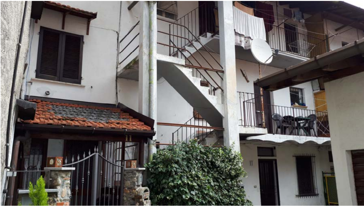
COMPENDIO 3 CUVIO VIA PRETORIO PROSPETTO SUD MAPP. 198