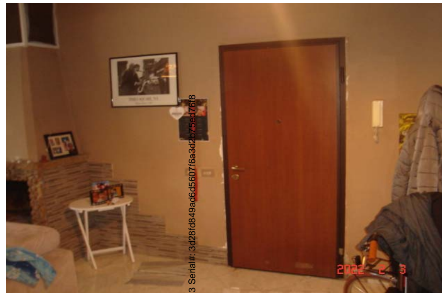
Vista porta di ingresso