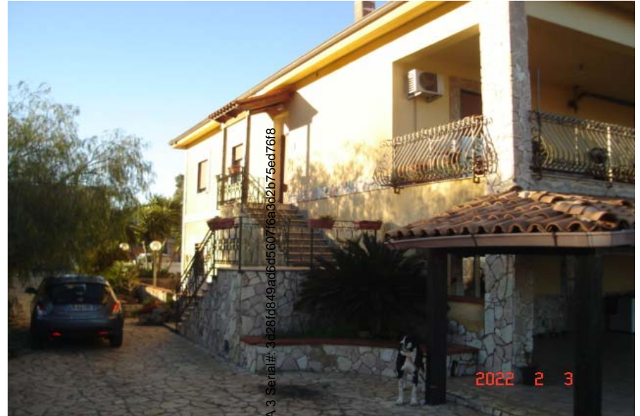
Vista esterna villino