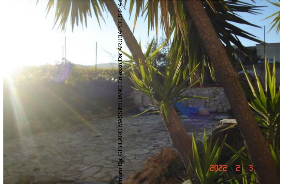
Vista corte comune