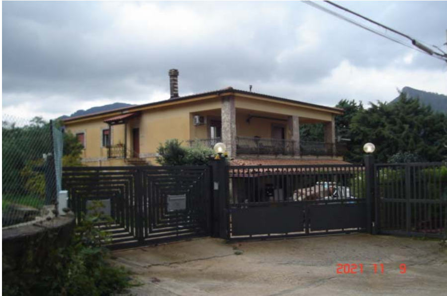
Vista esterna villino

PIENA ED INTERA PROPRIETA' DI ABITAZIONE IN VILLINO SITA IN MONREALE, C.DA CACULLA, TRAZZERA CANNAVERA N. 12, PIANO PRIMO, CENSITA AL C.F. AL FG. 51, P.LLA 1726 SUB. 3, CON LA QUOTA DI 1/2 INDIVISO DELLA CORTE COMUNE DI SUPERFICIE CATASTALE COMPLESSIVA, COMPRESO IL SEDIME DEL FABBRICATO, DI 1.055 MQ, IDENTIFICATA AL C.F. AL FG. 51, P.LLA 1726 SUB. 1 (B.C.N.C.)