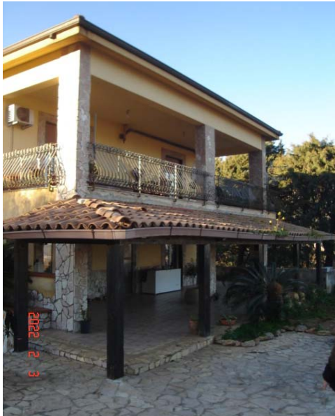
Vista esterna villino