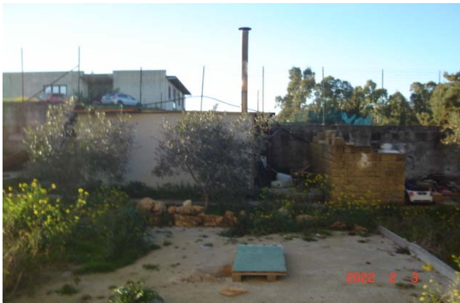
Vista corte comune

PIENA ED INTERA PROPRIETA' DI ABITAZIONE IN VILLINO SITA IN MONREALE, C.DA CACULLA, TRAZZERA CANNAVERA N. 12, PIANO PRIMO, CENSITA AL C.F. AL FG. 51, P.LLA 1726 SUB. 3, CON LA QUOTA DI 1/2 INDIVISO DELLA CORTE COMUNE DI SUPERFICIE CATASTALE COMPLESSIVA, COMPRESO IL SEDIME DEL FABBRICATO, DI 1.055 MQ, IDENTIFICATA AL C.F. AL FG. 51, P.LLA 1726 SUB. 1 (B.C.N.C.)