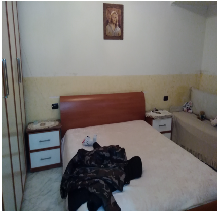
Foto n° 5 – Altra veduta interna del 2° vano dell'abitazione adibito a camera da letto.