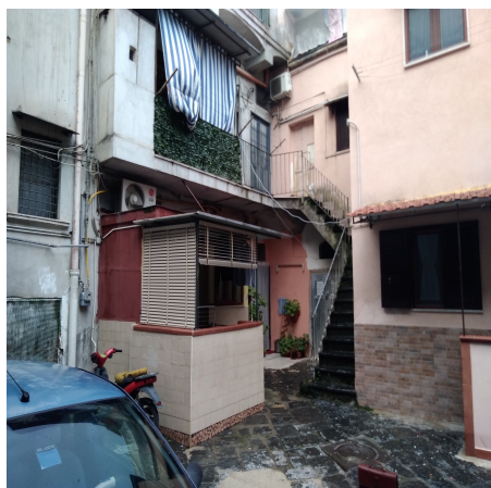
Foto n° 1 - Piano terra veduta rampe scale che portano al primo piano del fabbricato dove è situata l'abitazione.