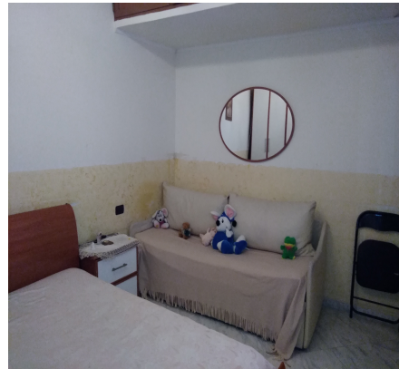
Foto n° 6 – Altra veduta interna del 2° vano adibito a camera da letto.