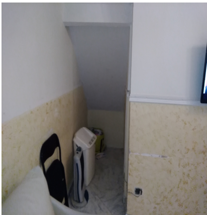
Foto n° 7 – Altra veduta interna del secondo vano adibito a camera da letto.