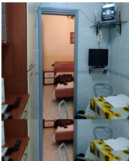
Foto n° 3 – Piano primo veduta interna del 1° vano dell'abitazione adibito a cucina.