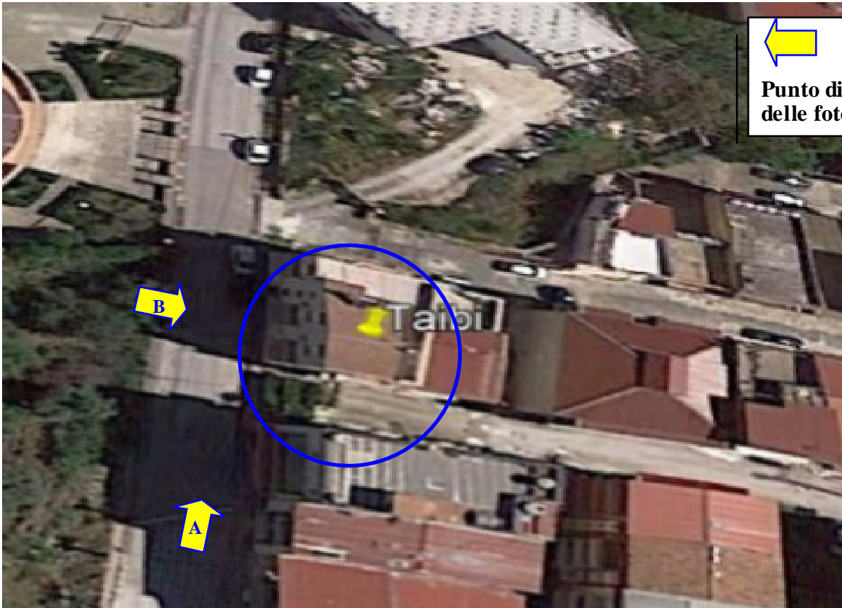
Contesto urbanistico nelle vicinanze dell'Appartamento di via A. De Gasperi, n. 52 a Favara