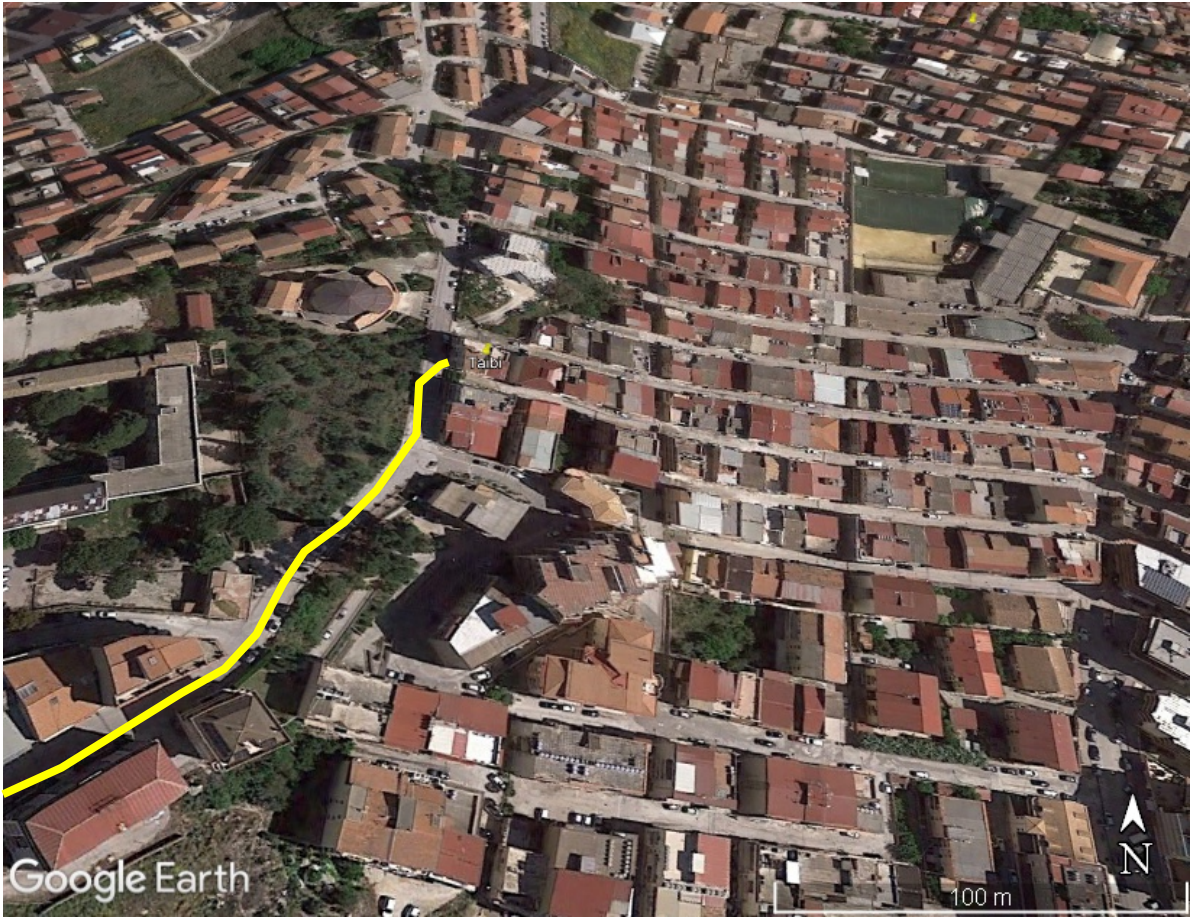
Percorso stradale per raggiungere l'Immobile di via A. De Gasperi, n. 52 a Favara