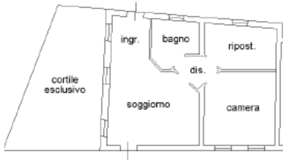
PIANO TERRA H=2,70

La planimetria catastale urbana dell'immobile residenziale non e' conforme allo stato di fatto. A mezzo sanatoria e ripristini la medesima planimetria catastale ritornera' ad essere conforme.