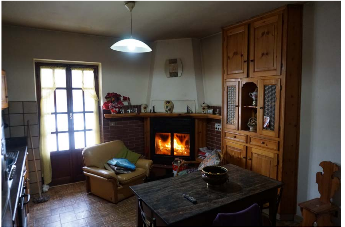
Foto n. 2 Soggiorno Piano Primo