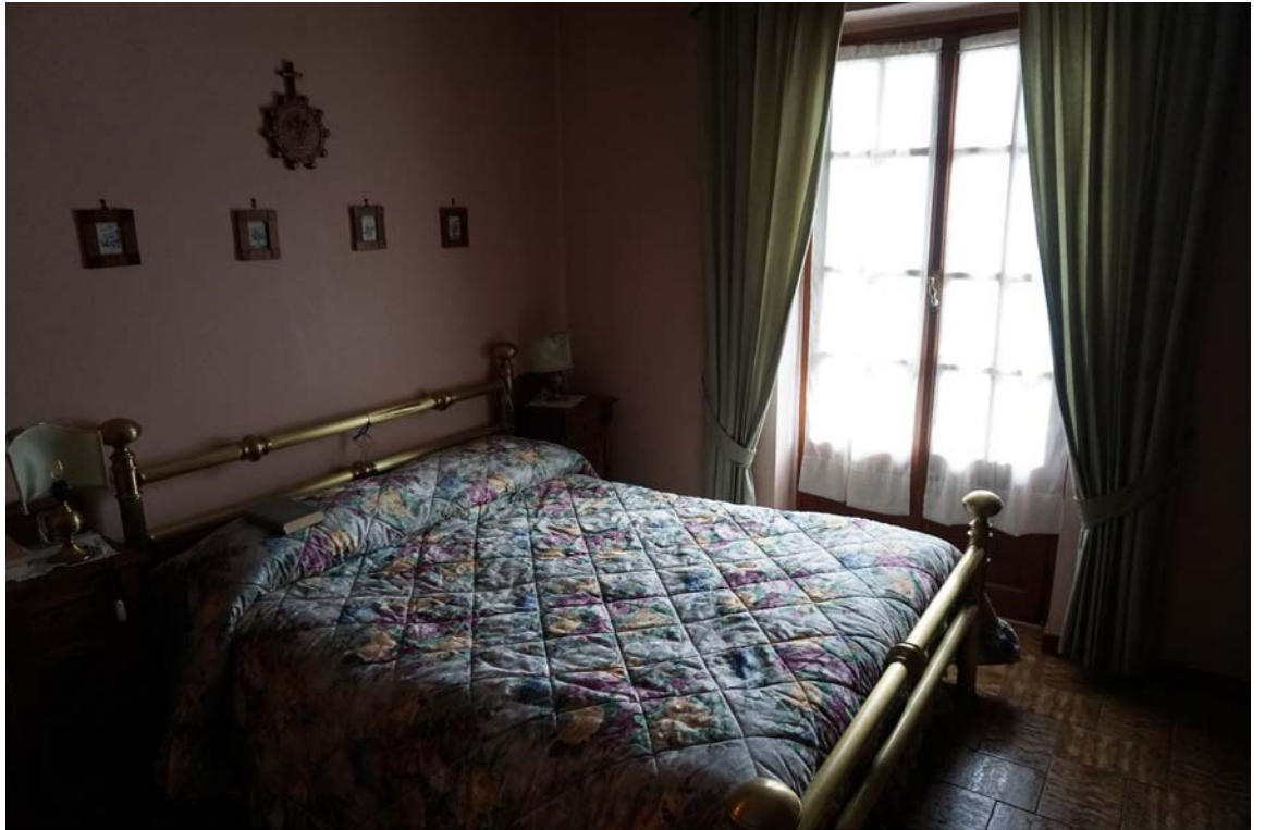
Foto n. 4 Camera 2 Piano Primo