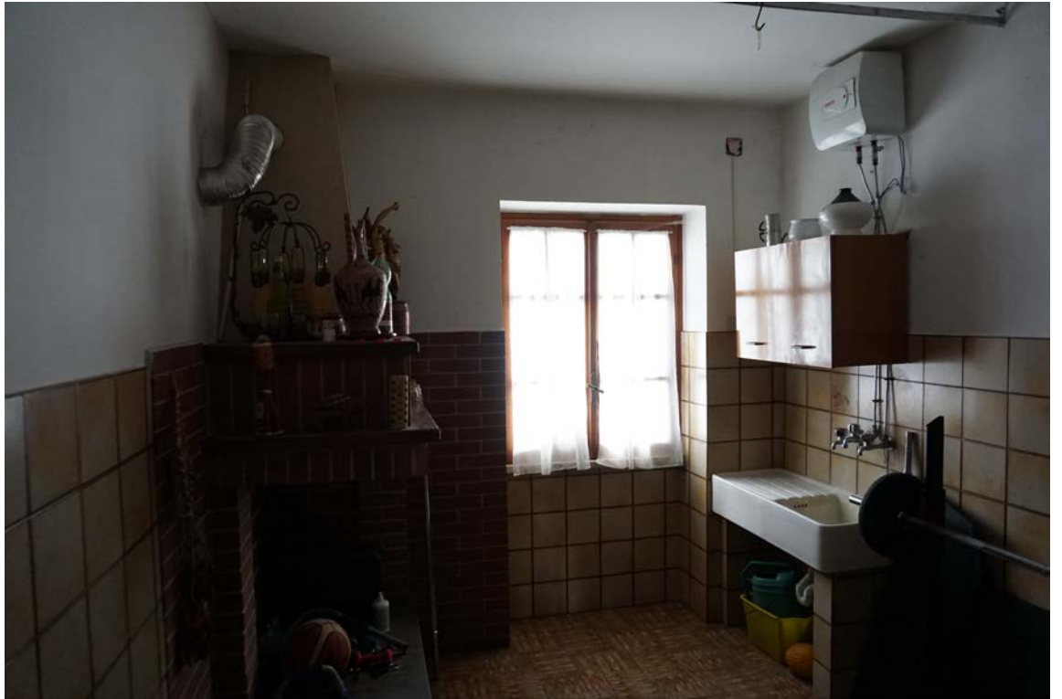
Foto n. 2 Cucina 1 Piano Terra