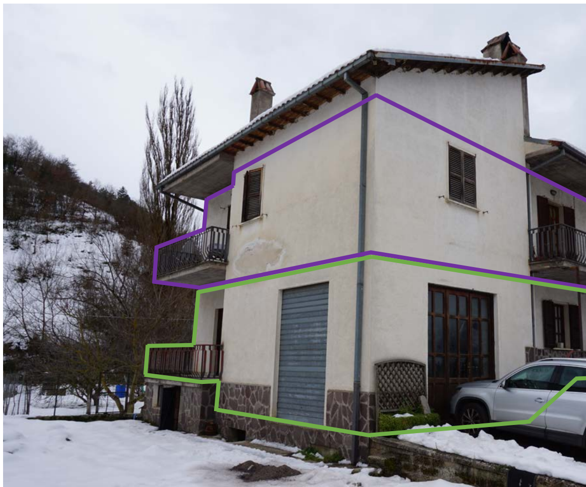
Foto n. 4 Esterno del Fabbricato Prospetto Nord - Est Lotto 001 - 002 - 003 - 004