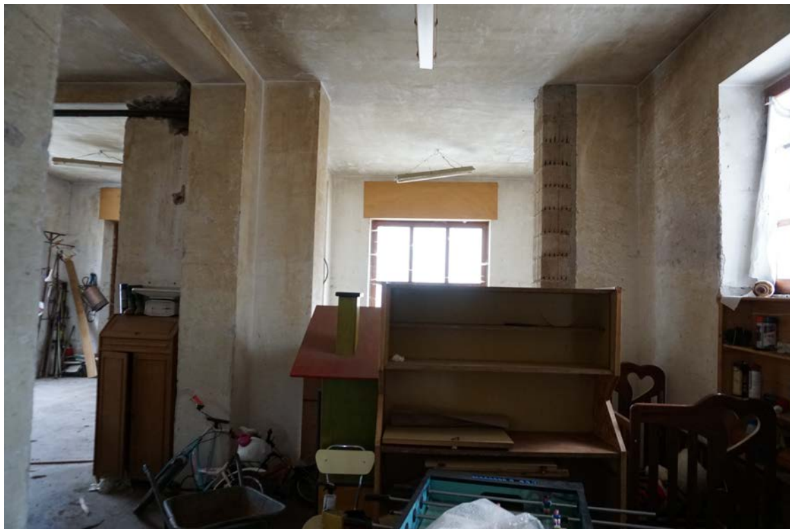
Foto n. 4 Lab. artigianale 4 Piano terra