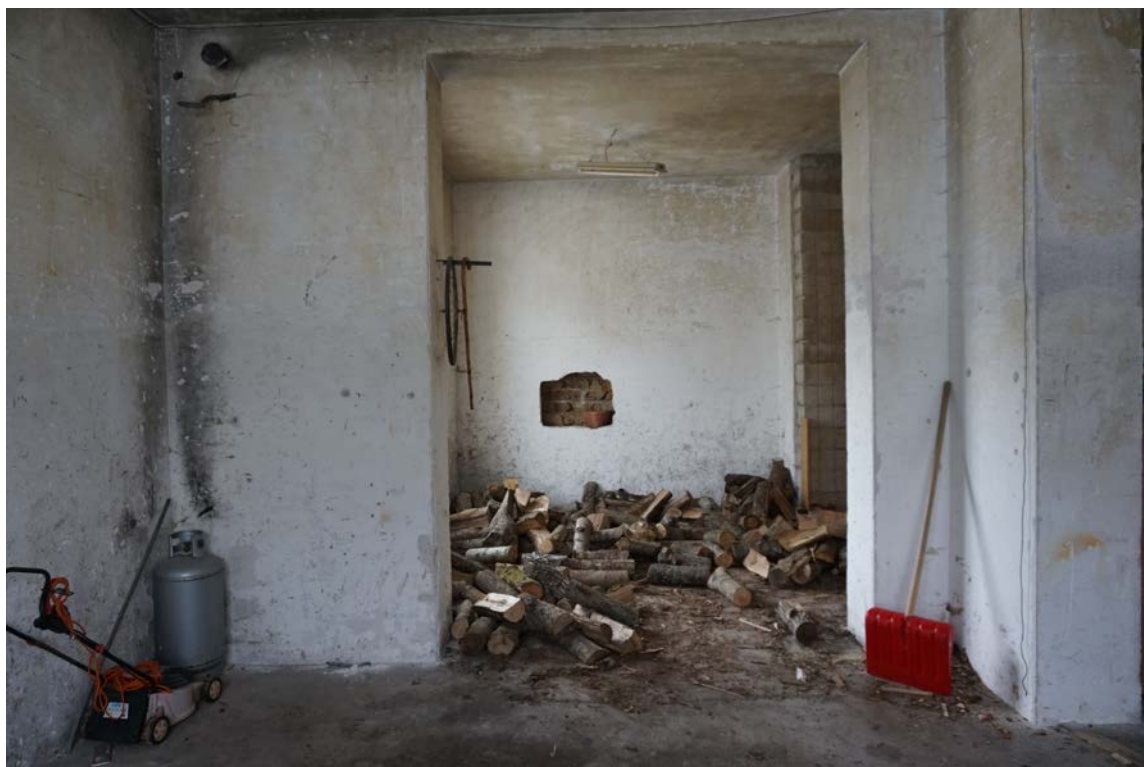
Foto n. 2 Lab. artigianale 2 Piano Terra