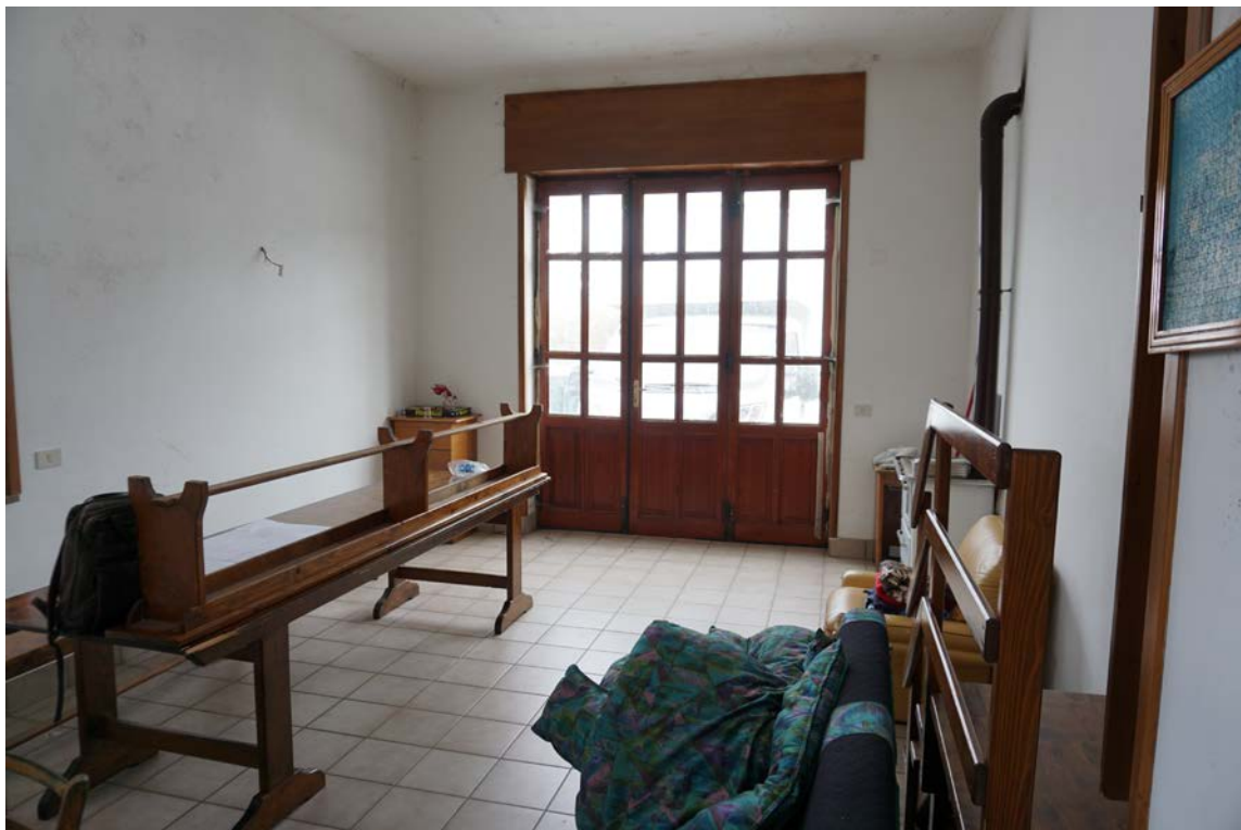
Foto n. 4 Gazebo Piano Terra