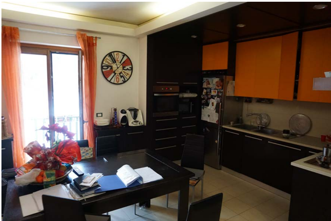
Foto n. 2 Camera 3 Piano Primo