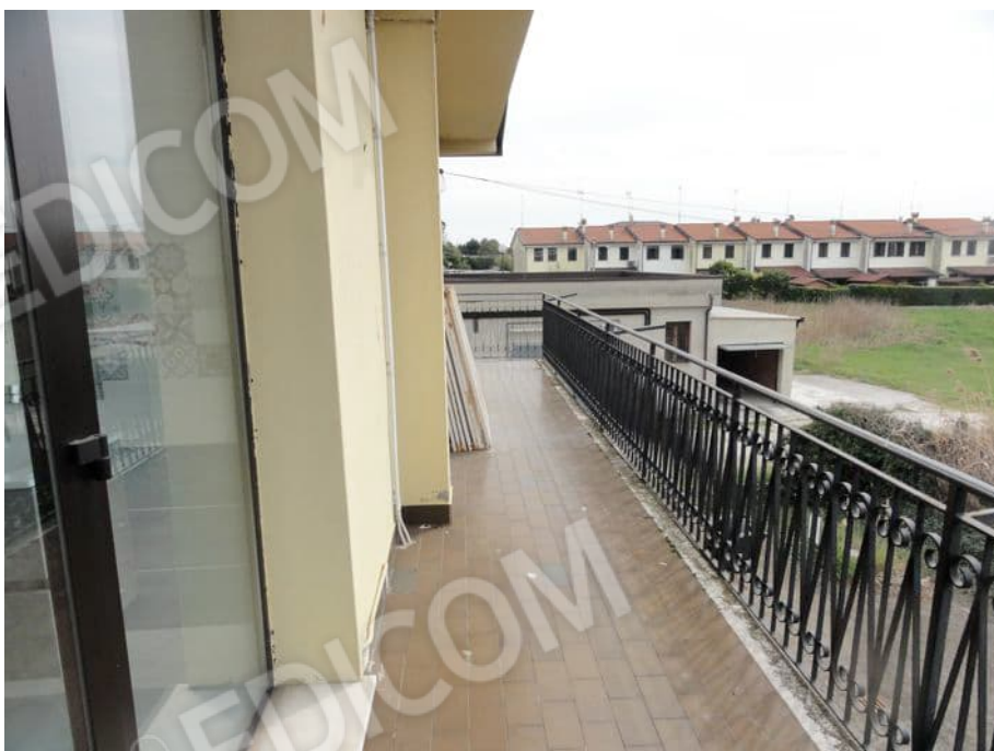
POGGIOLO A SUD