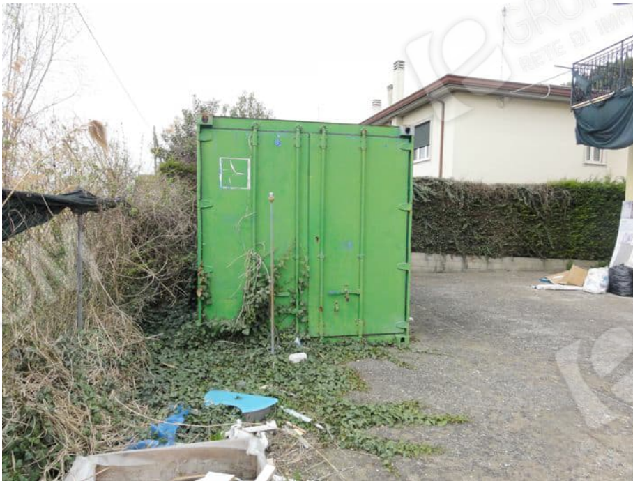
CONTAINER NON AUTORIZZATO