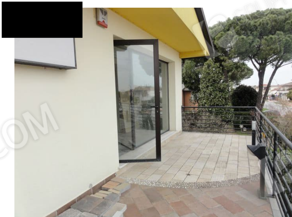
TERRAZZA A NORD