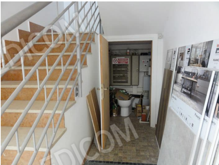
VANO SCALA E SOTTOSCALA