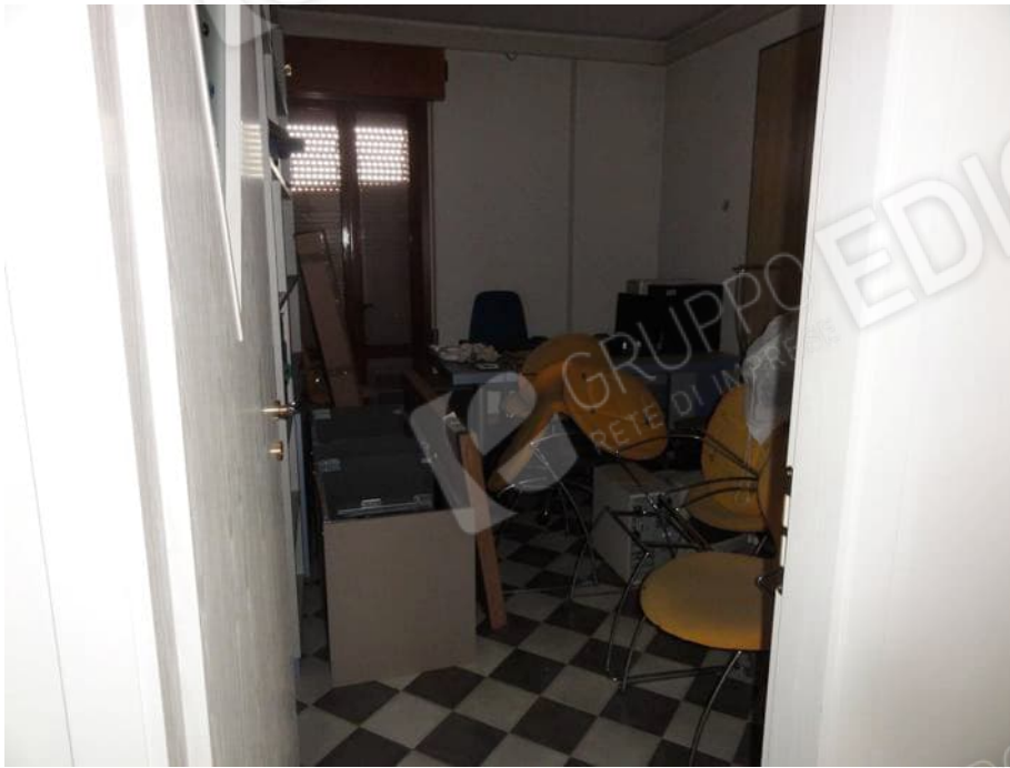
UFFICIO P. PRIMO