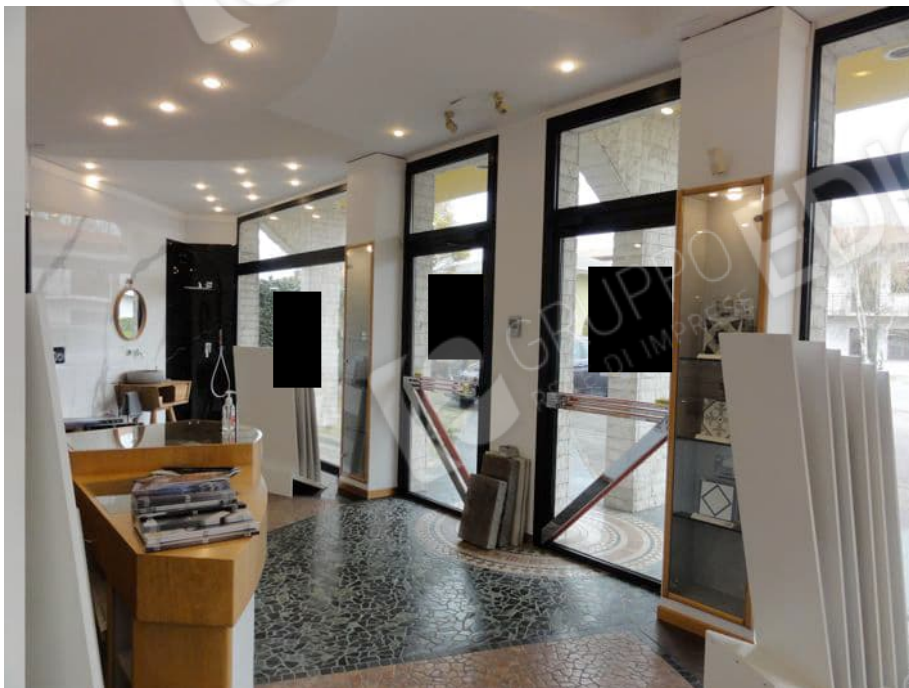
INTERNO NEGOZIO AL PIANO TERRA