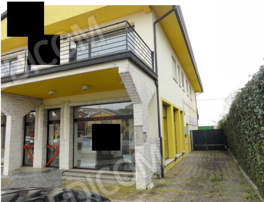
VISTA OVEST ACCESSO CARRAIO E PEDONALE