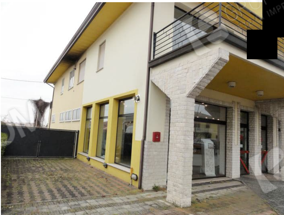
VISTA EST E ACCESSO CARRAIO