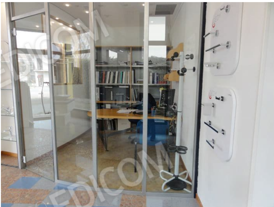
BOX UFFICIO AL PIANO TERRA