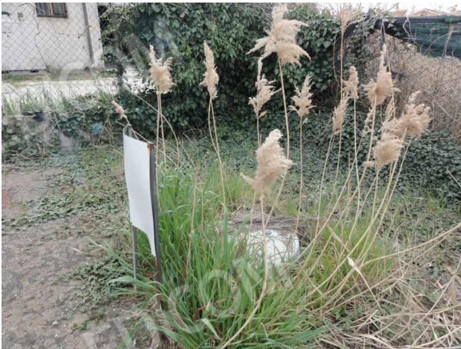
SERBATOIO GPL DISMESSO