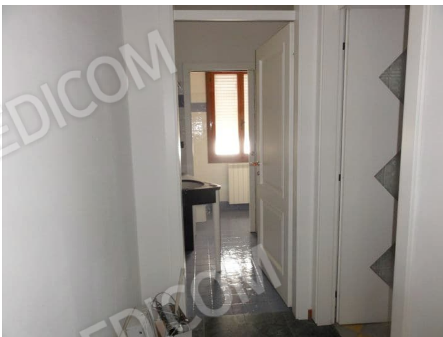
ANTI BAGNO P.PRIMO