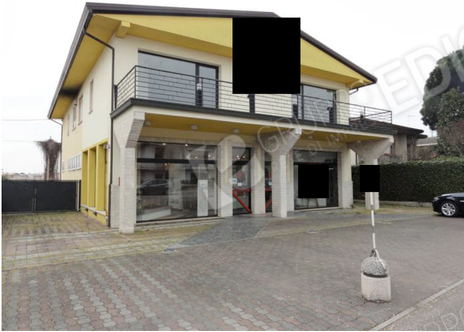
VISTA NORD DA VIA G. MAZZINI