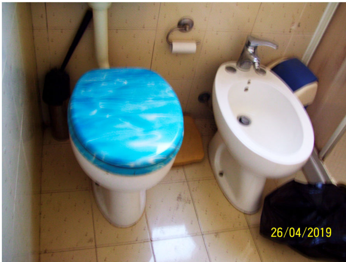
FOTO N. 27 BAGNO