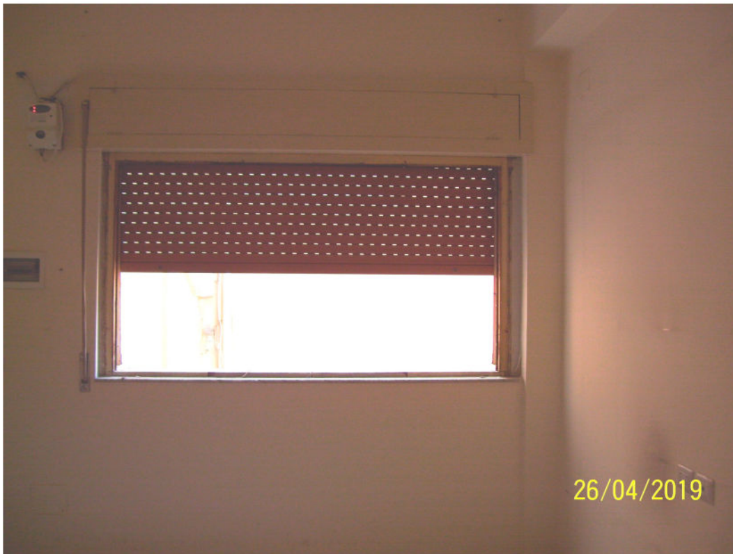
FOTO N. 6 FINESTRA SOLO CON AVVOLGIBILE MANCA INFISSO