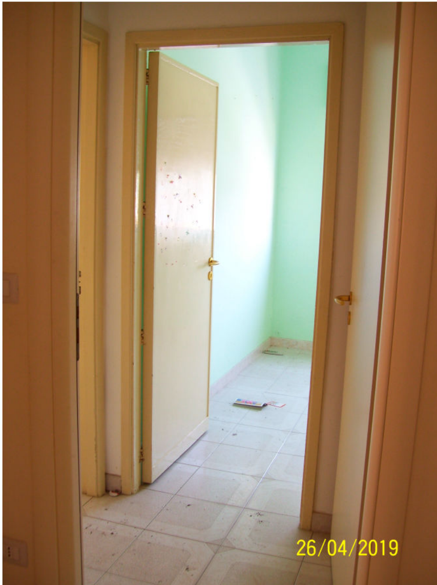
FOTO N. 32 CORRIDOO INGRESSO CAMERE