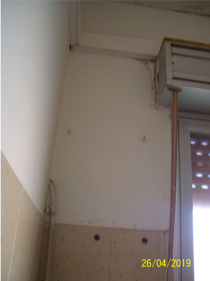
FOTO N. 24 BAGNO