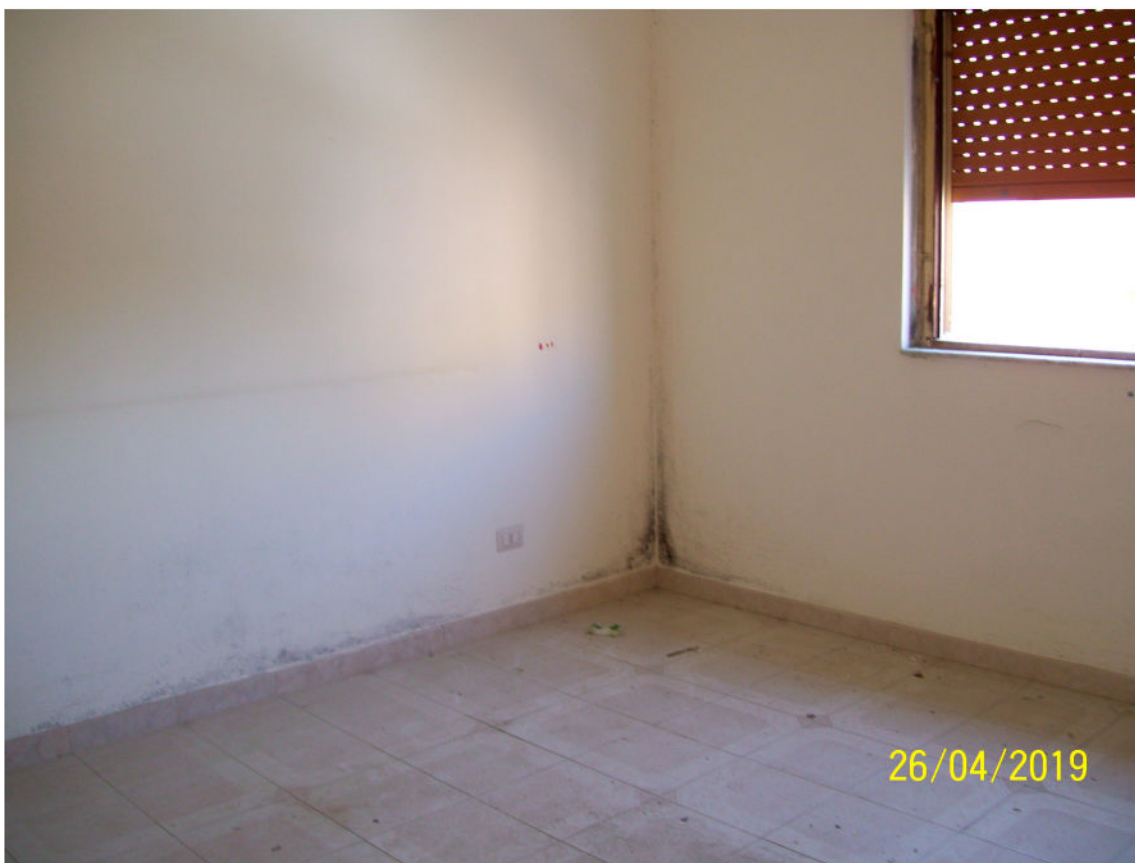
FOTO N. 38 CAMERA