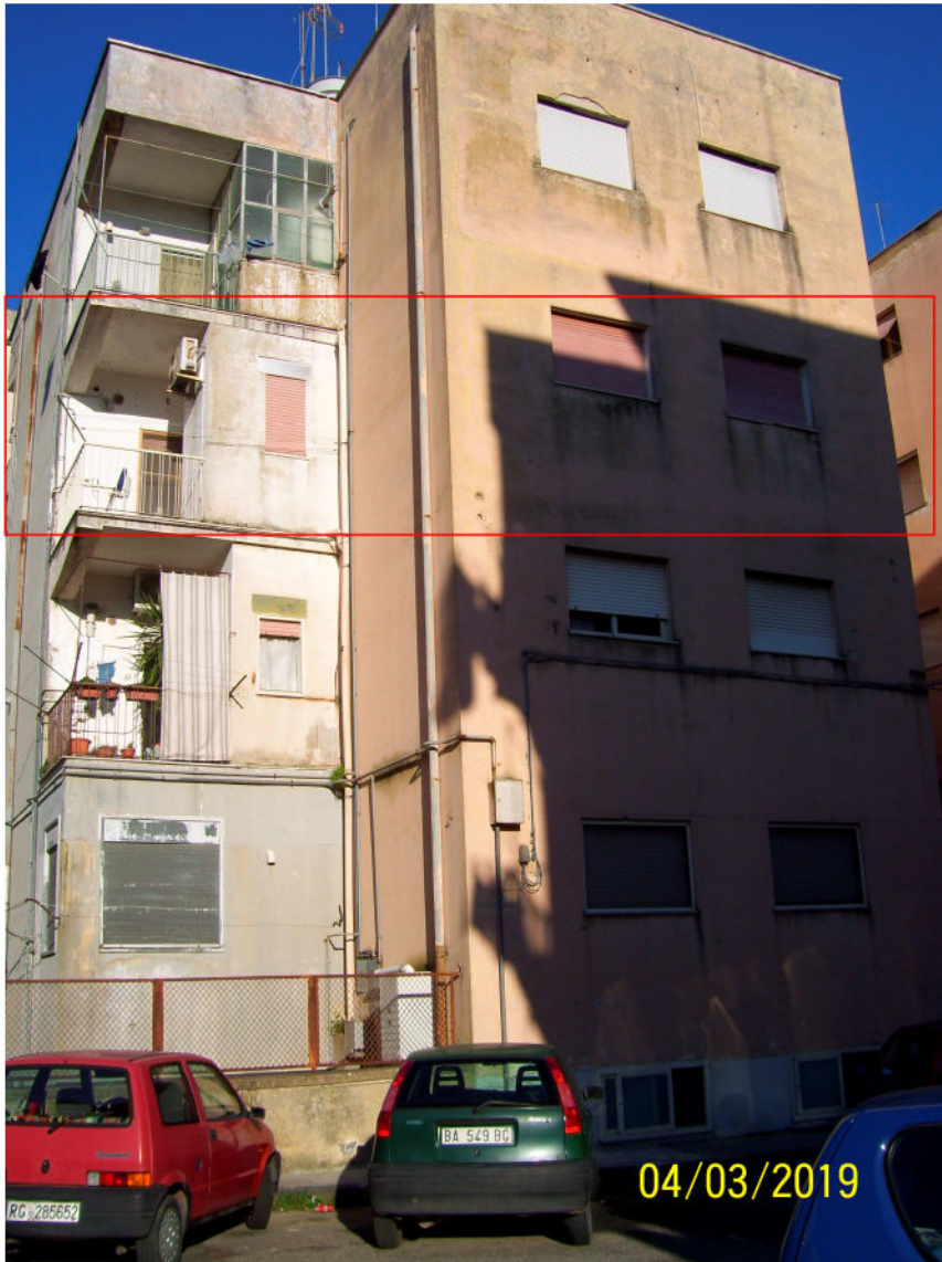
FOTO N. 3 PROSPETTO