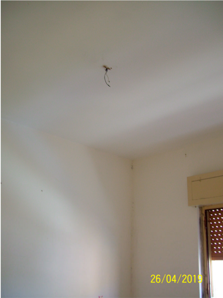
FOTO N. 39 CAMERA SENZA APPLIQUE