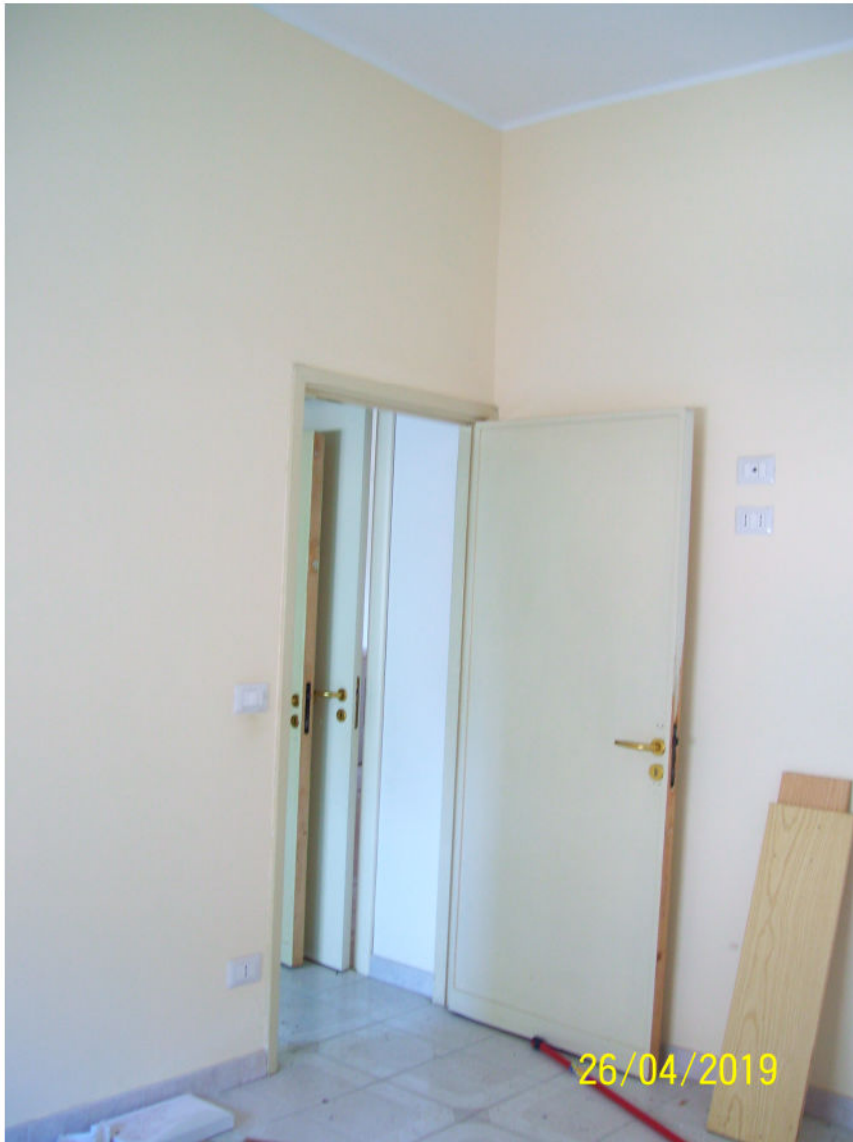
FOTO N. 36 INGRESSO CAMERA