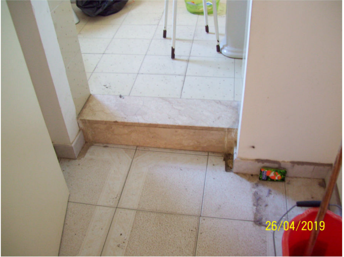
FOTO N. 30 BAGNO SCALINO