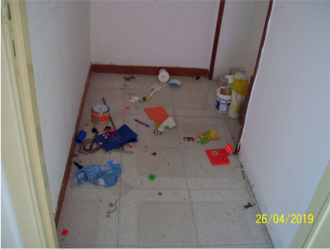
FOTO N. 35 RIPOSTIGLIO