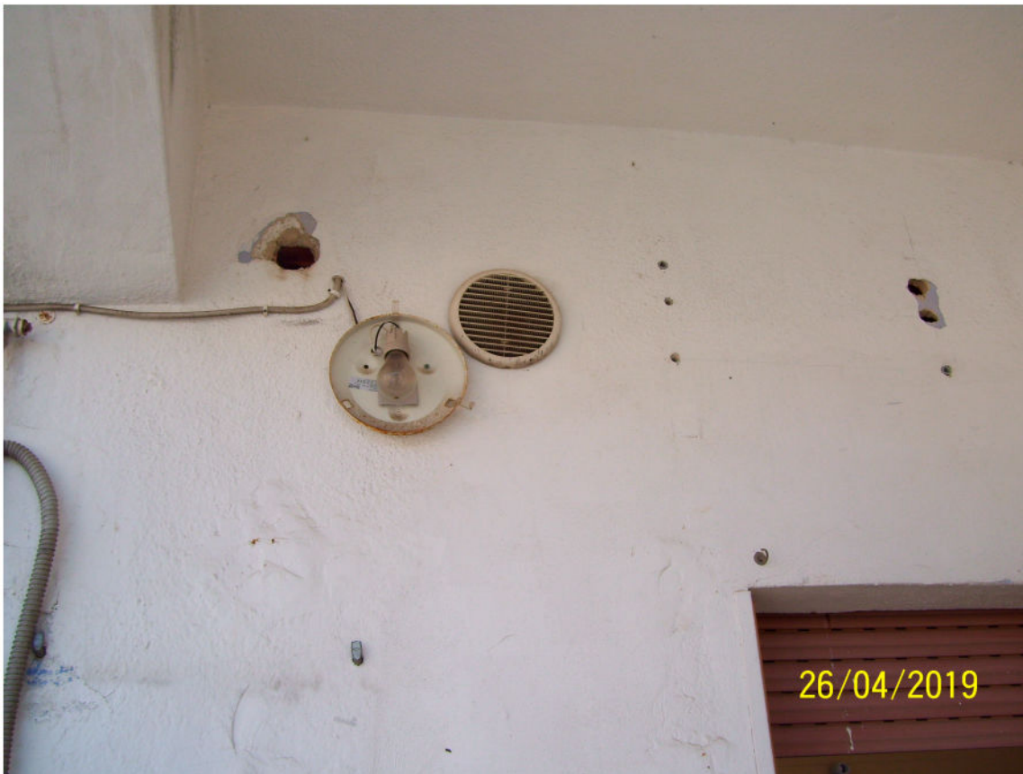
FOTO N. 17 BALCONE