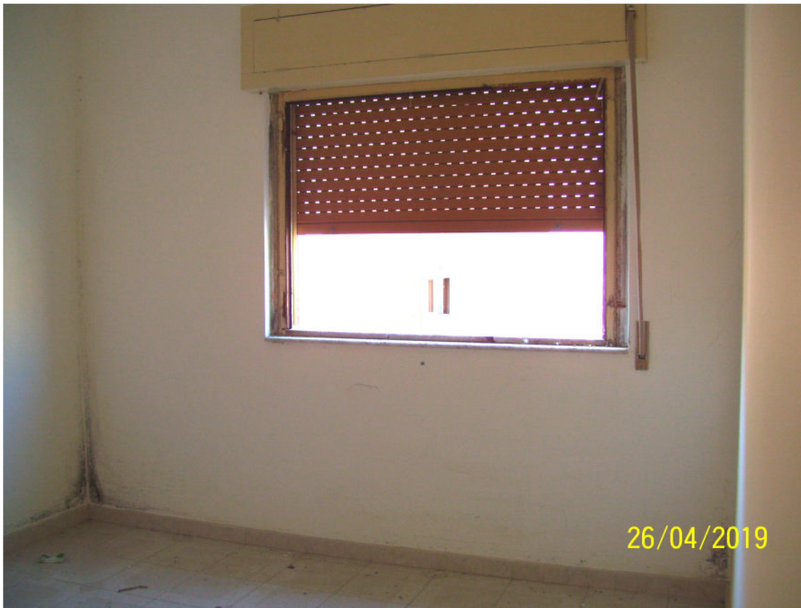
FOTO N. 37 FINESTRA CAMERA SENZA INFISSIO SOLO AVVOGIBILE