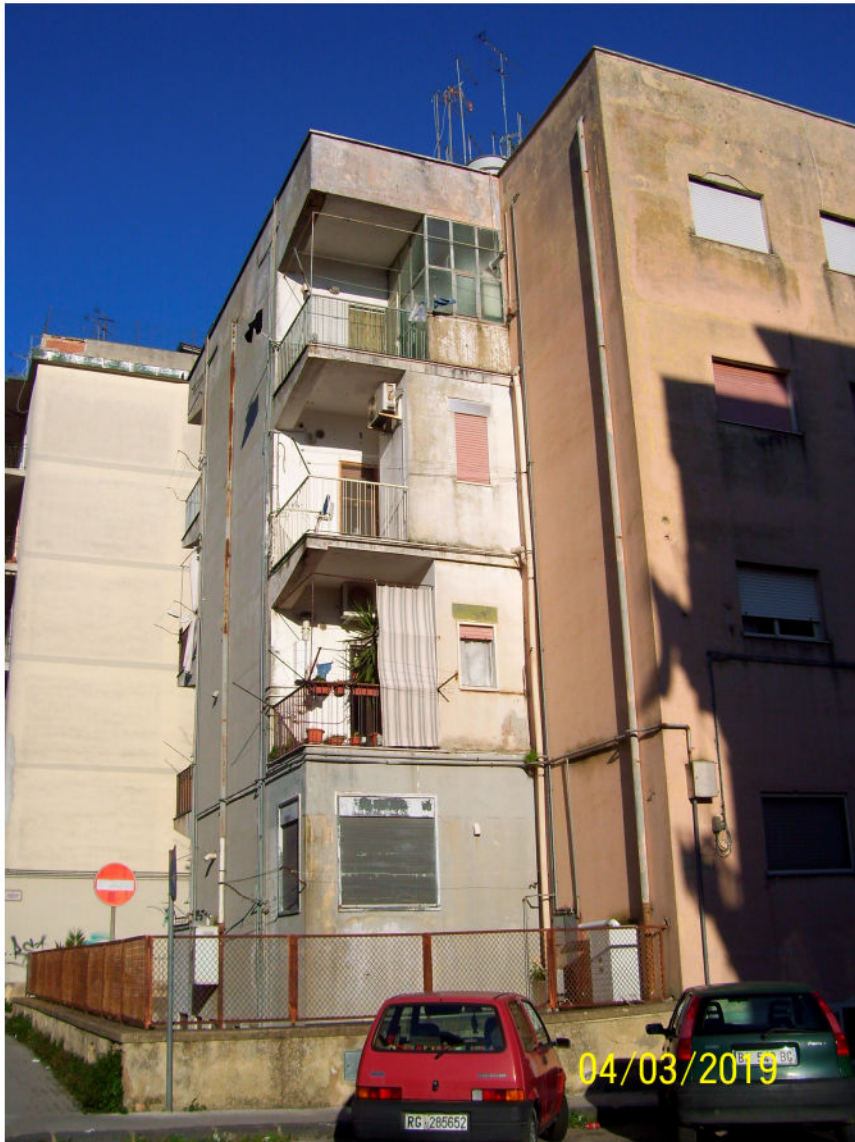
FOTO N. 4 PROSPETTO