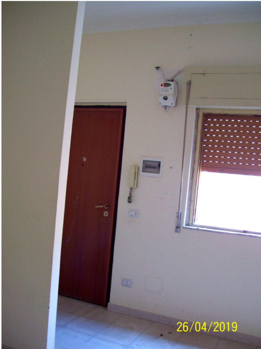
FOTO N. 5 INGRESSO APPARTAMENTO