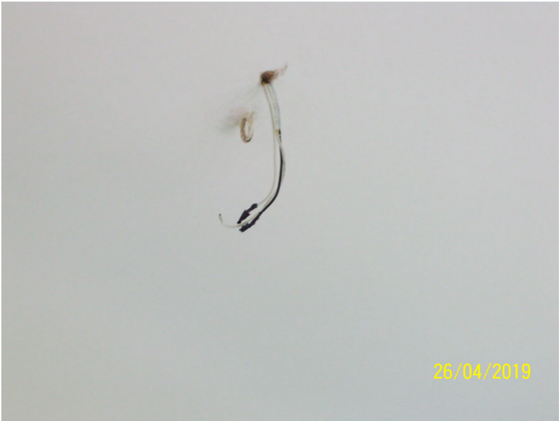
FOTO N. 47 SOFFITTO CAMERA SENZA APPLIQUE