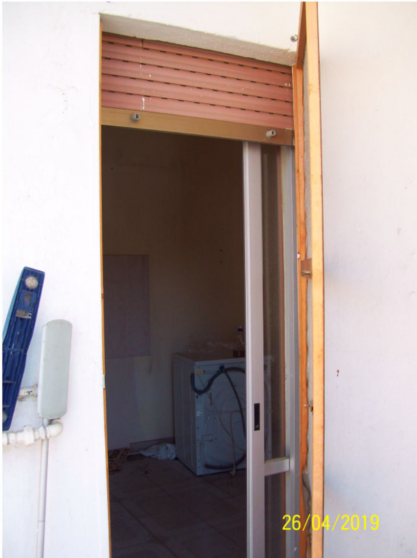
FOTO N. 13 BALCONE CUCINA