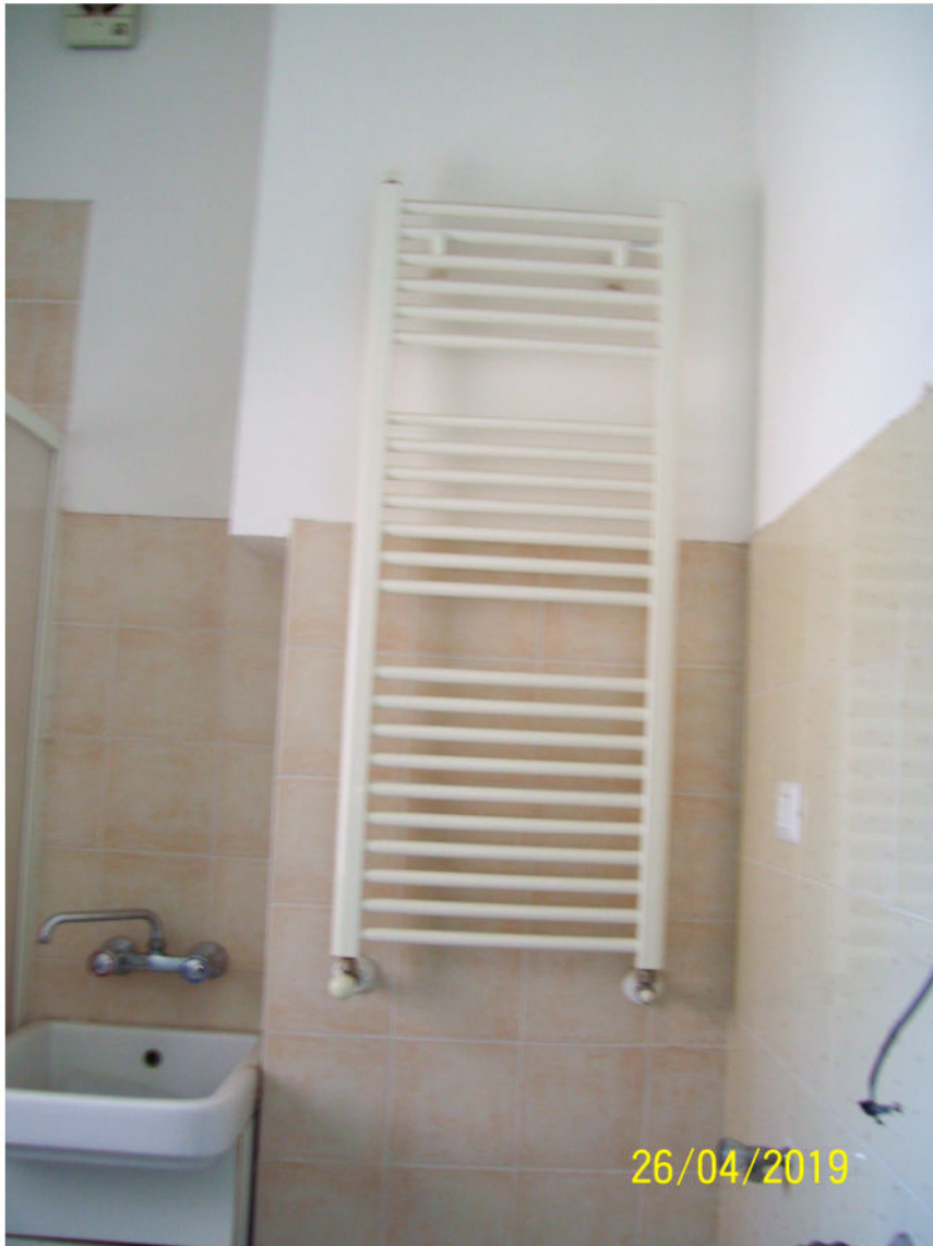
FOTO N. 21 BAGNO