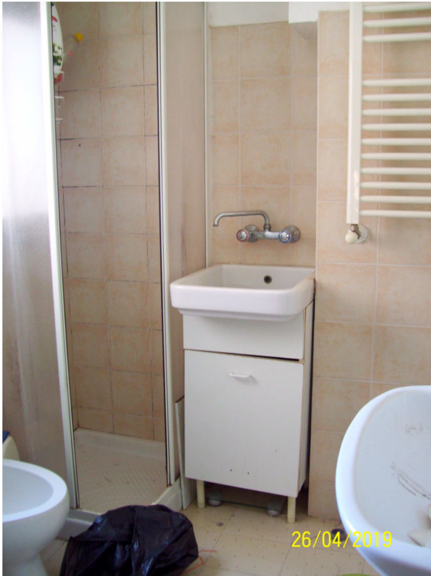
FOTO N. 23 BAGNO