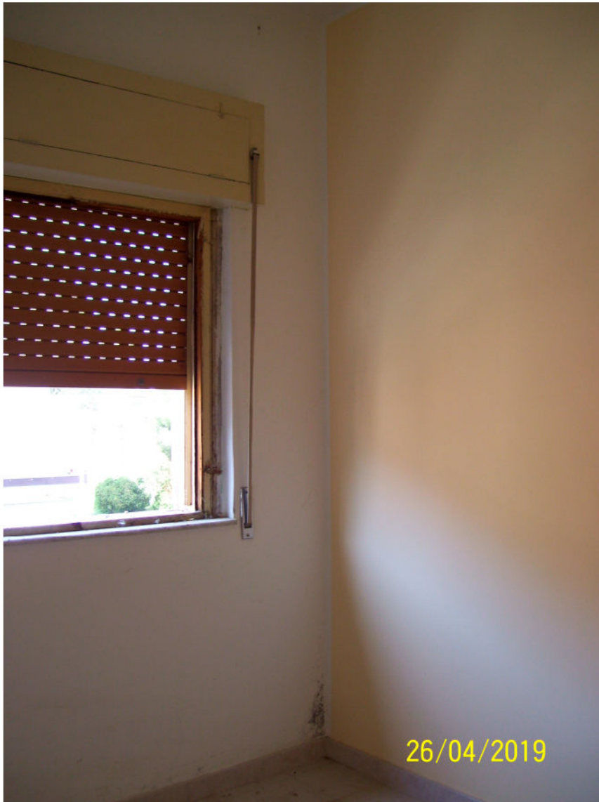
FOTO N. 41 CAMERA