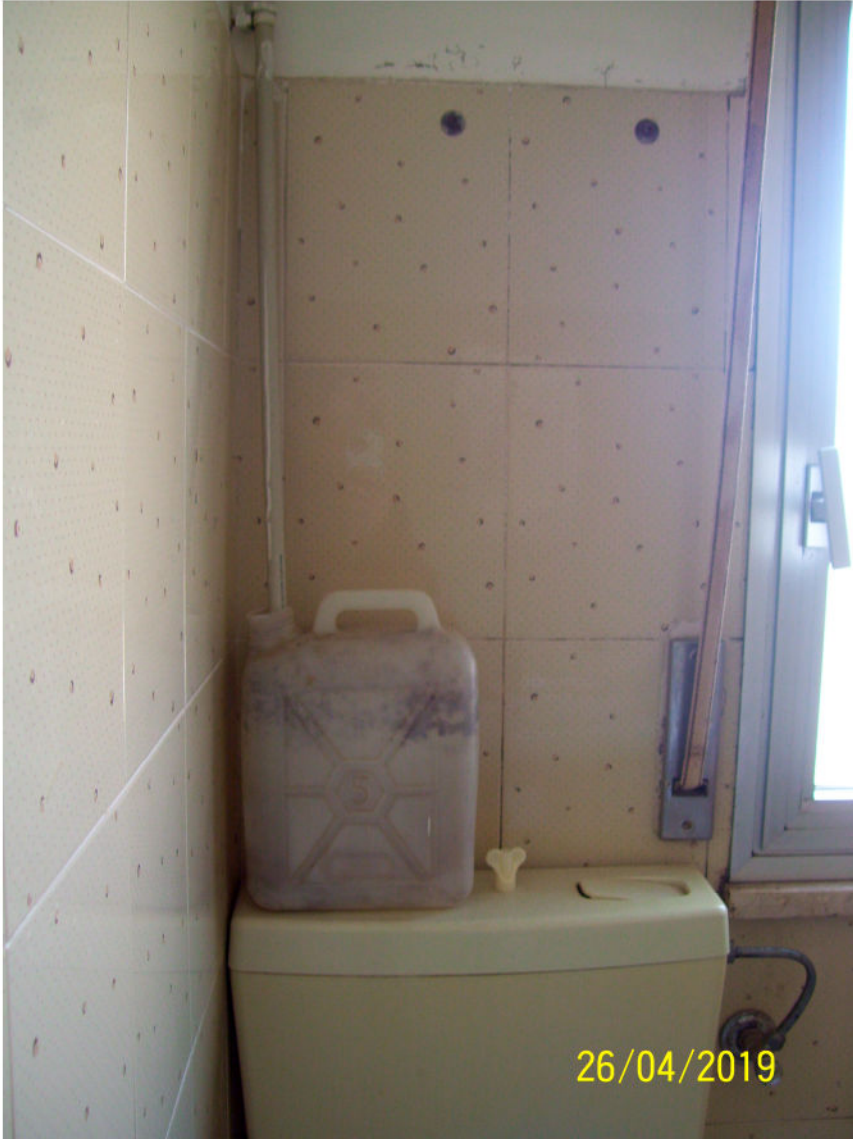
FOTO N. 25 BAGNO