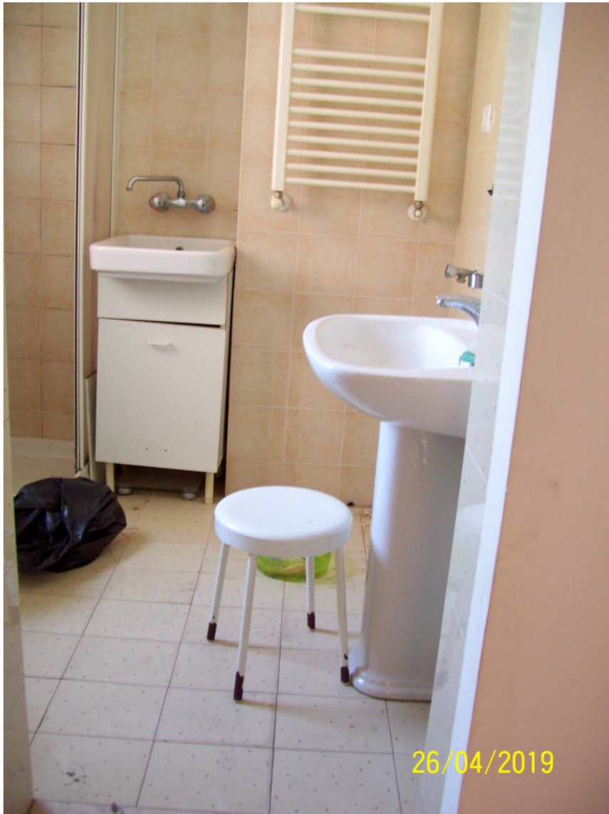
FOTO N. 20 BAGNO