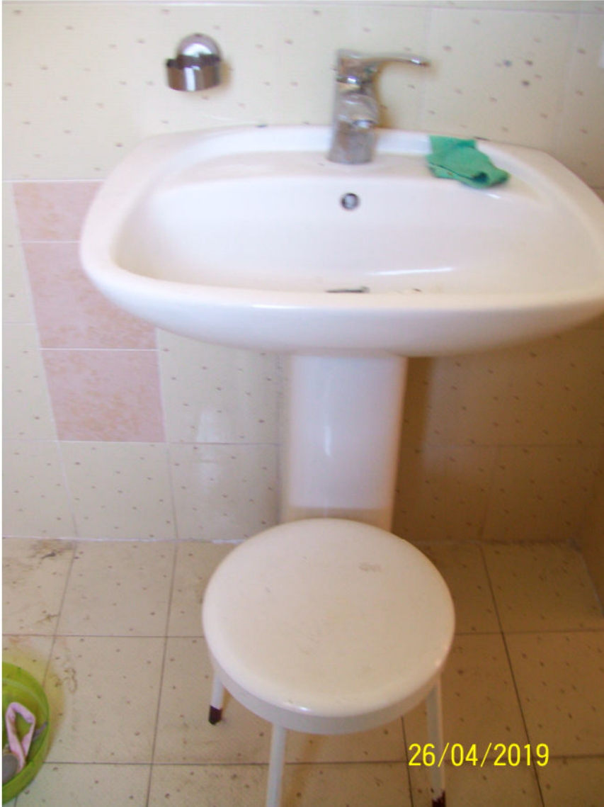
FOTO N. 28 BAGNO