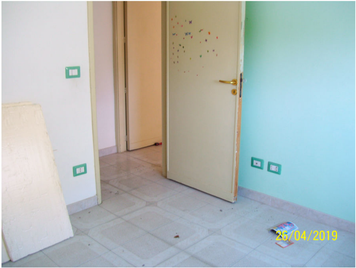
FOTO N. 42 CAMERA