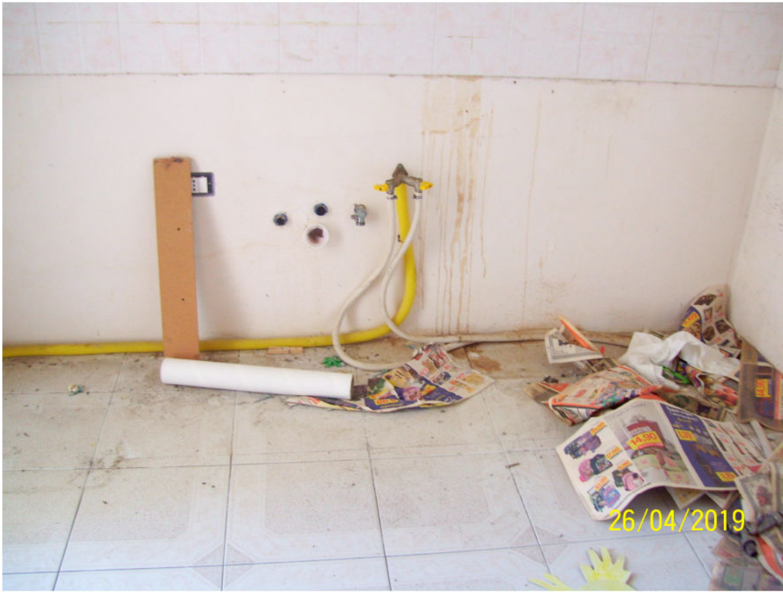
FOTO N. 10 CUCINA