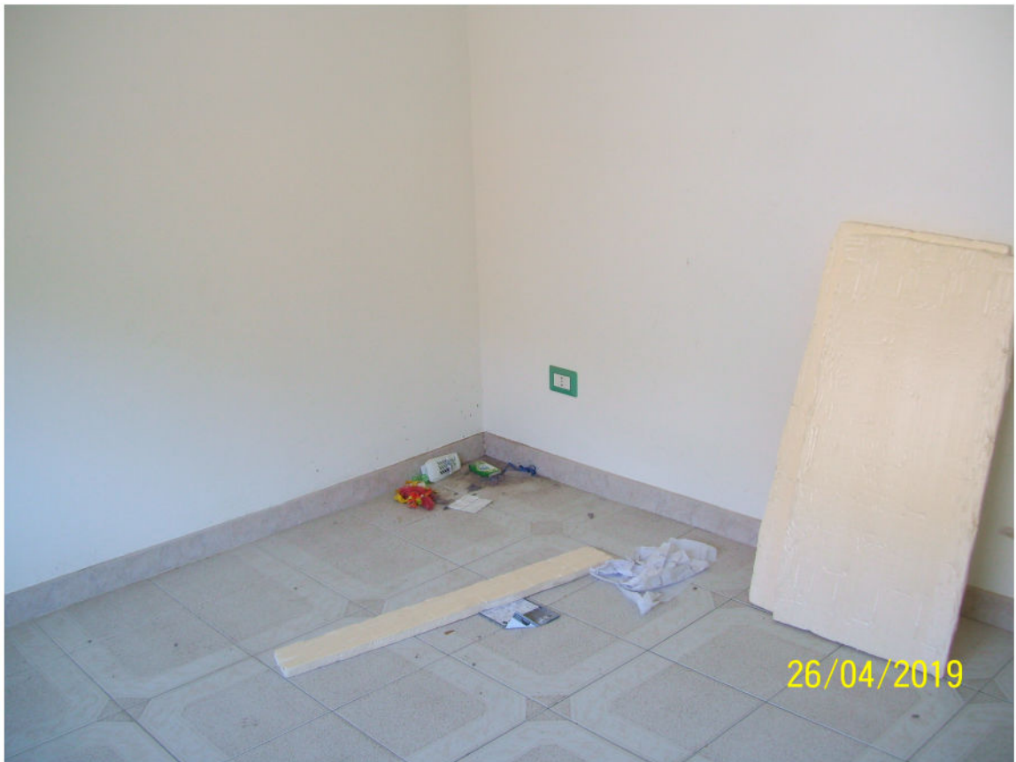
FOTO N. 43 CAMERA