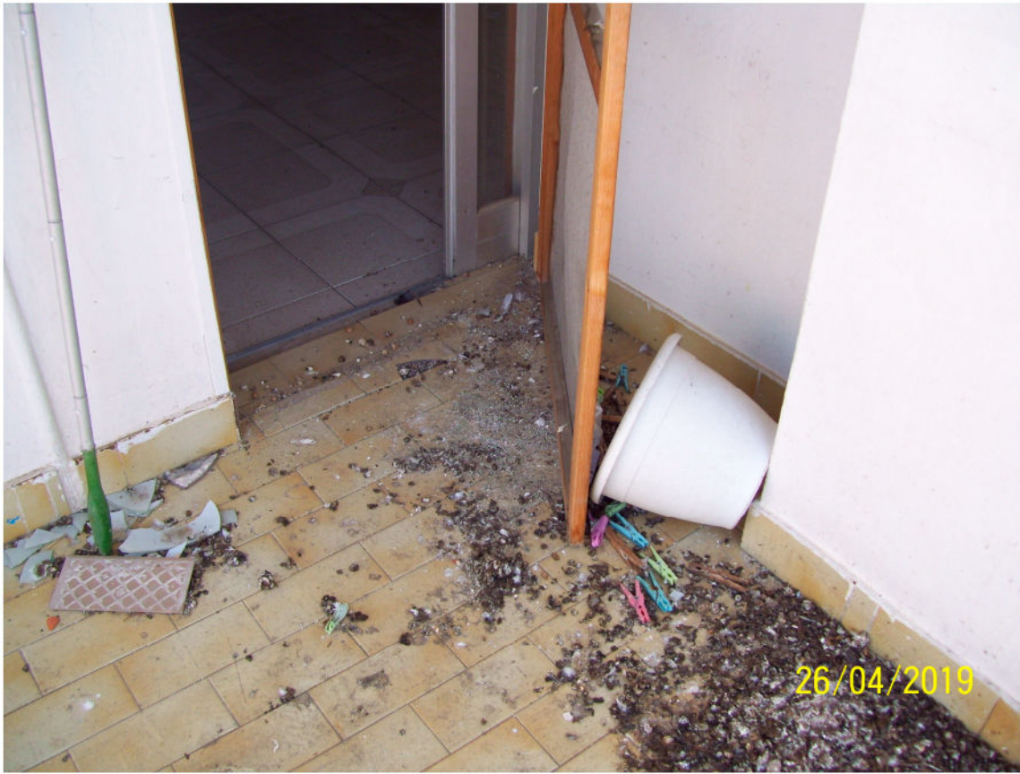
FOTO N. 14 BALCONE CUCINA