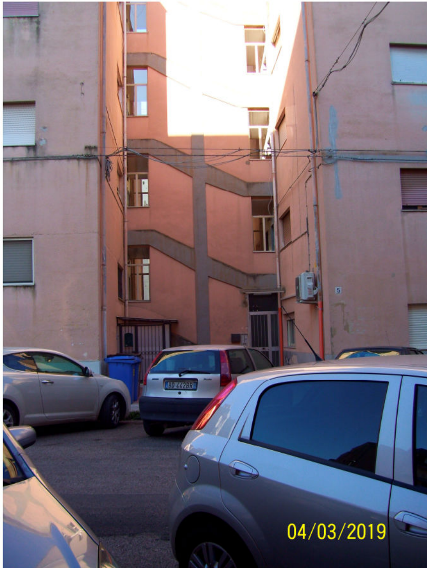
FOTO N. 1 PORTA INGRESSO VIA VOLTURNO N. 5