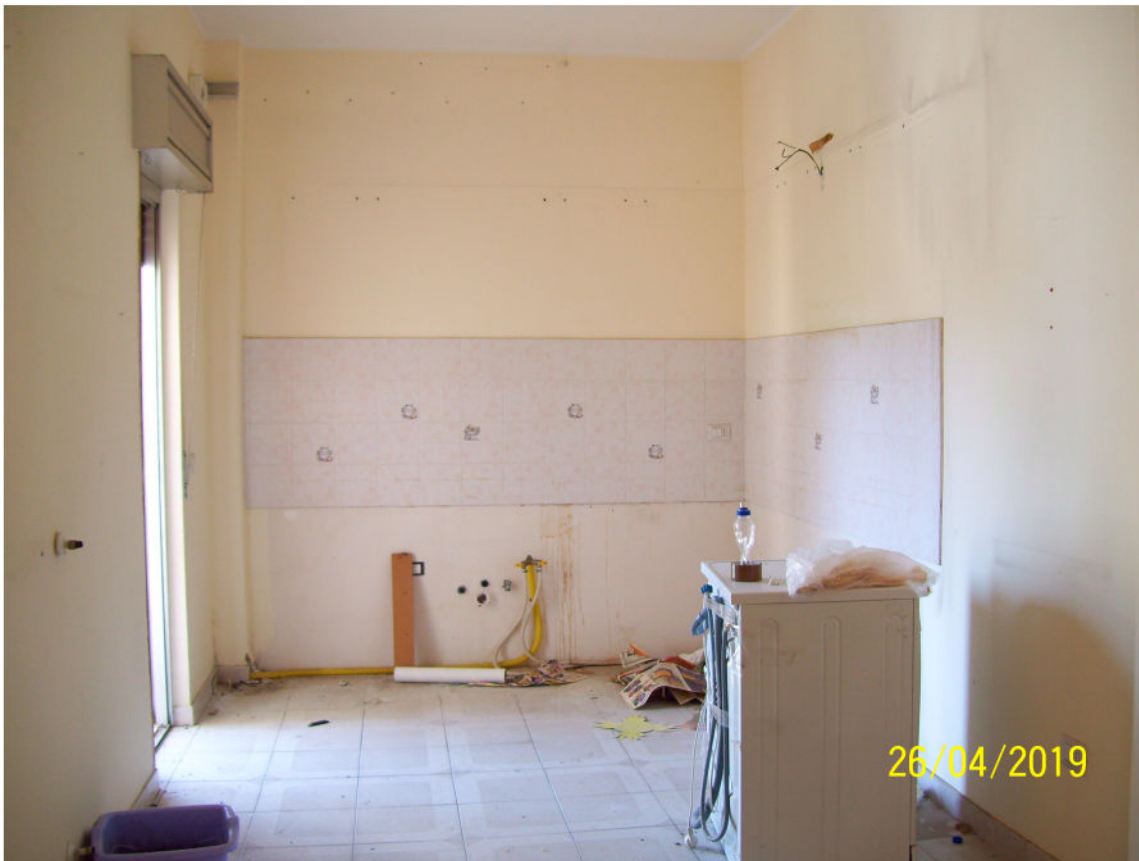
FOTO N. 9 CUCINA