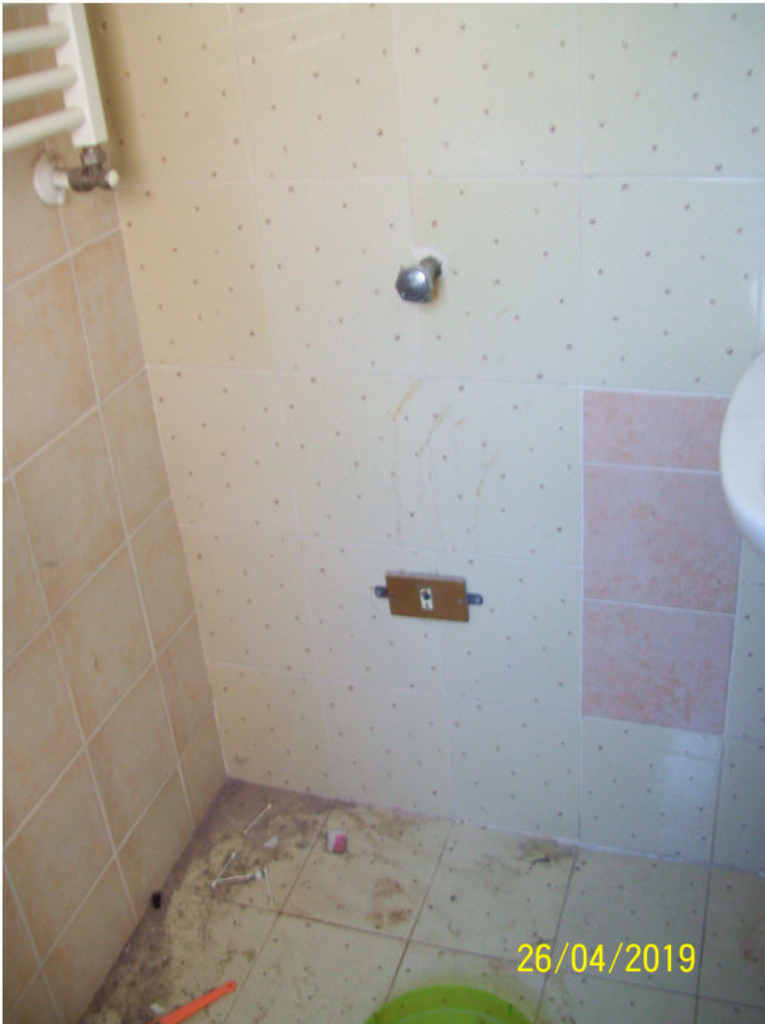
FOTO N. 29 BAGNO