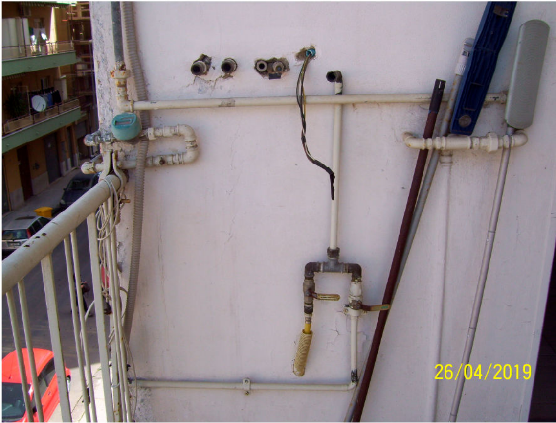
FOTO N. 16 BALCONE