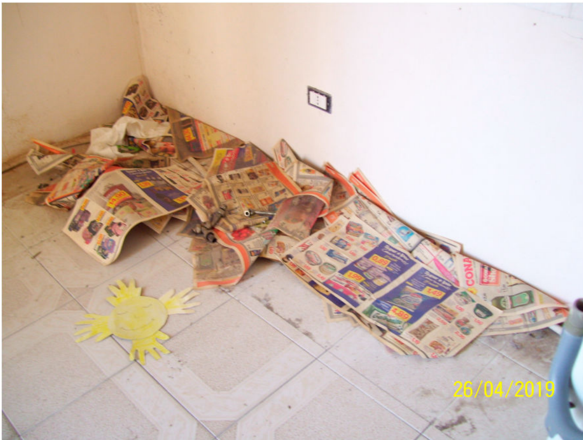
FOTO N. 11 CUCINA