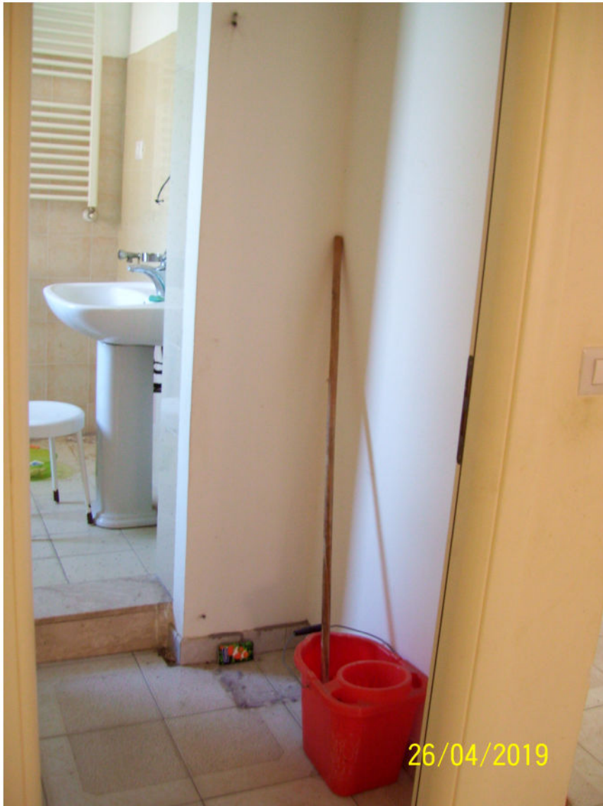
FOTO N. 19 BAGNO