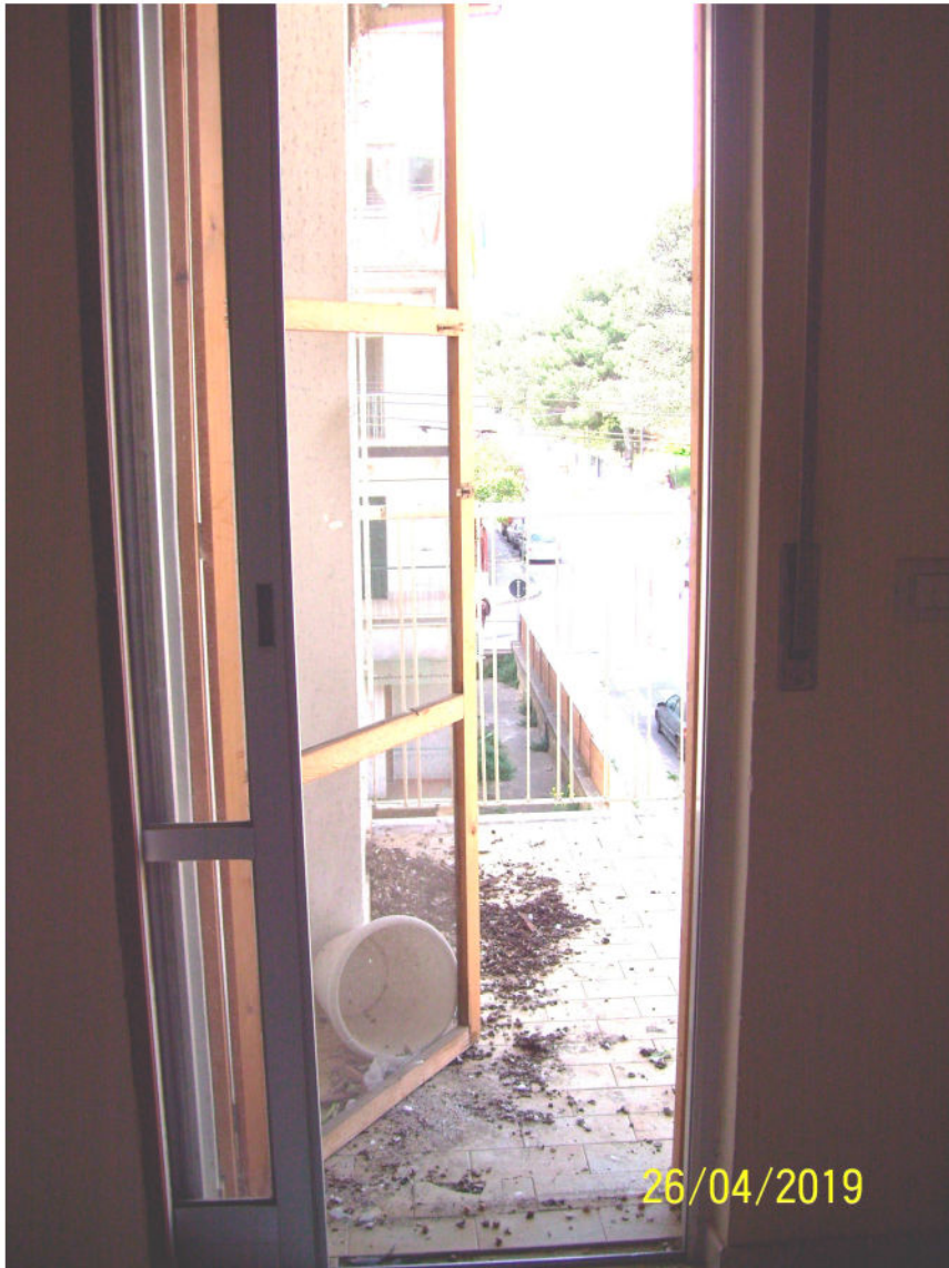
FOTO N. 12 BALCONE CUCINA