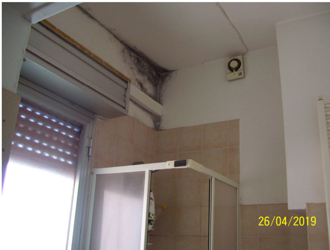
FOTO N. 26 BAGNO