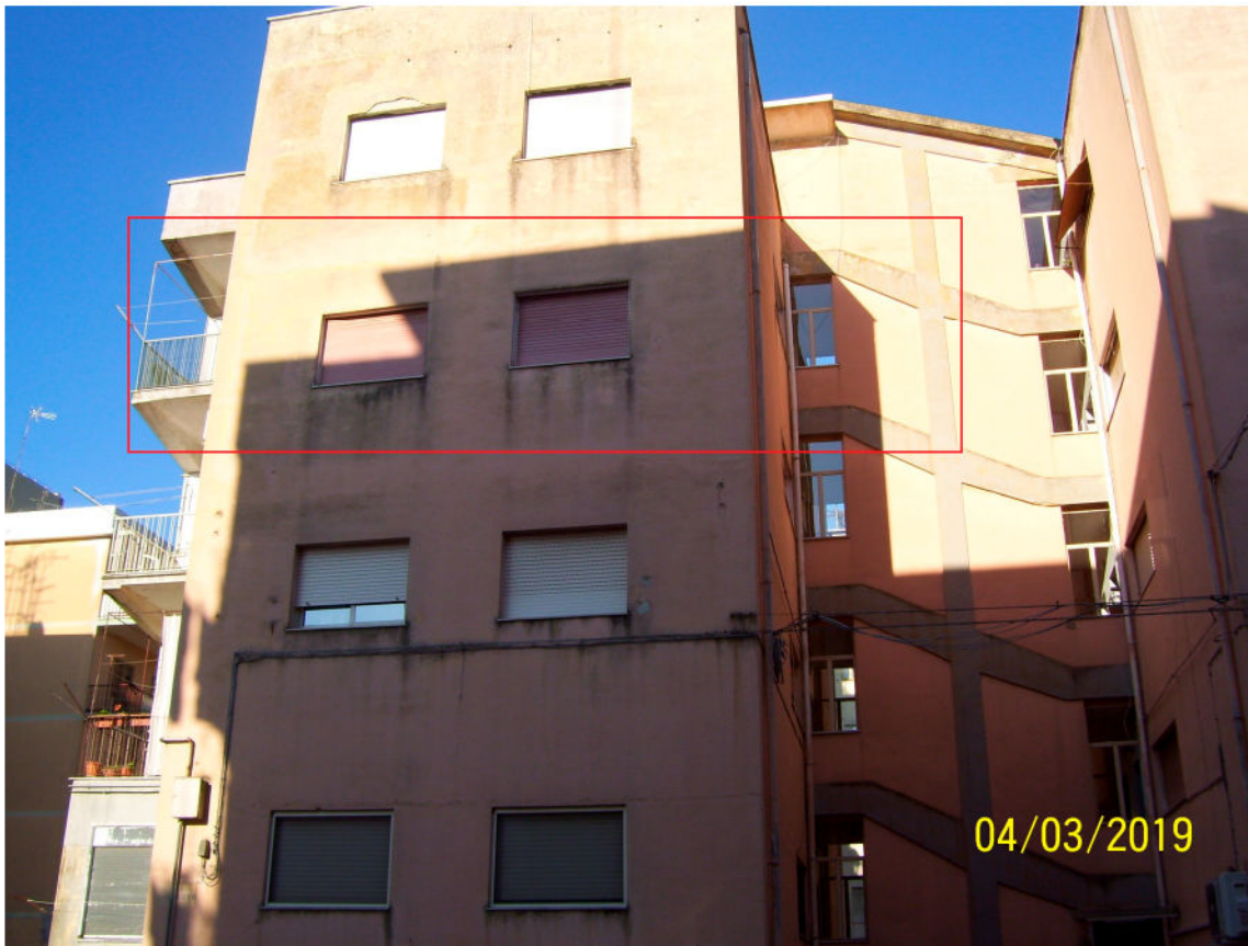
FOTO N. 2 IMMOBILE AL TERZO PIANO