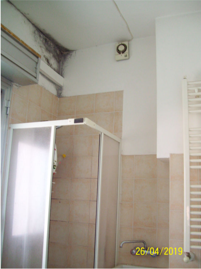
FOTO N. 22 BAGNO