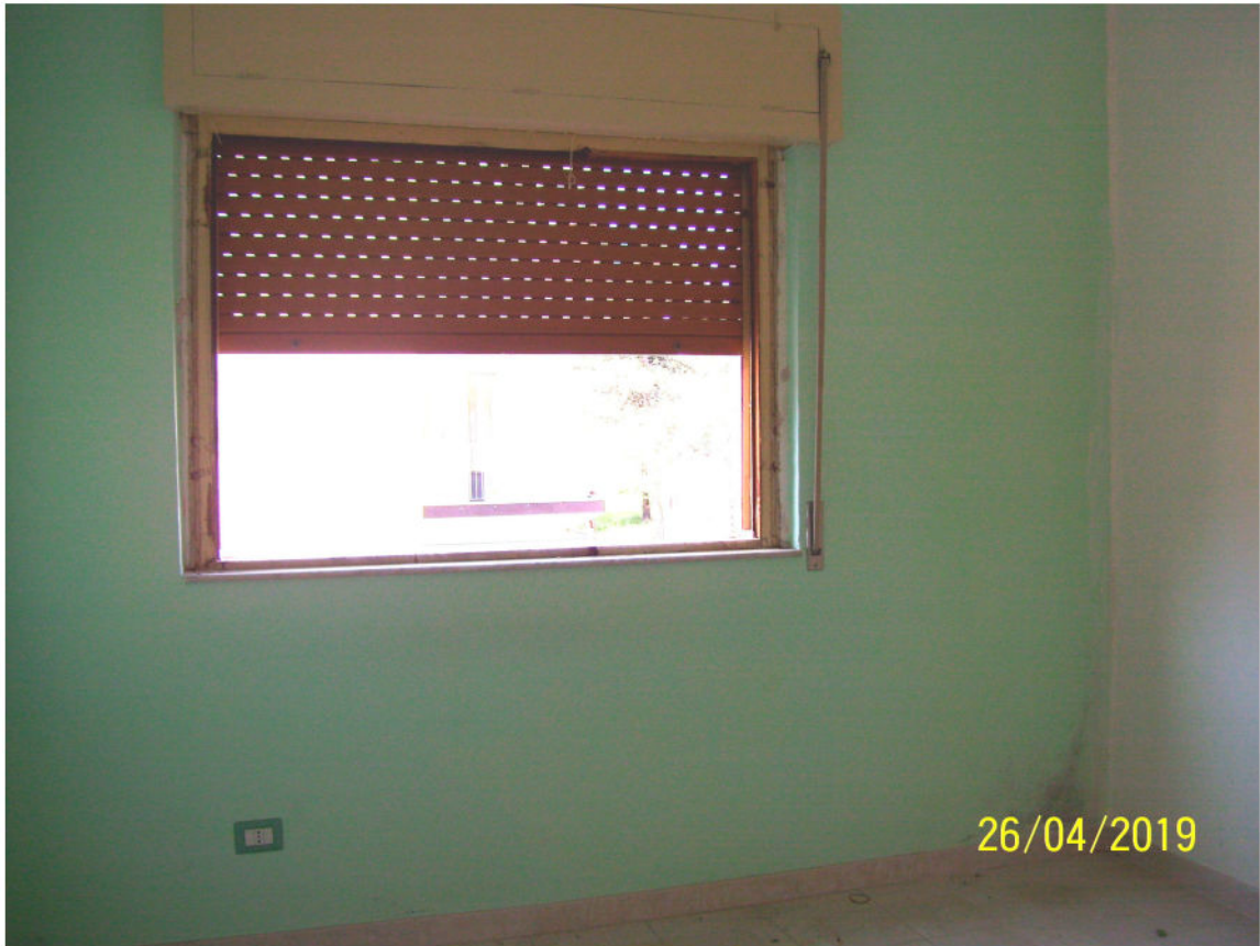
FOTO N. 44 CAMERA CON FINESTRA SENZA INFISSO SOLO AVVOLGIBILE