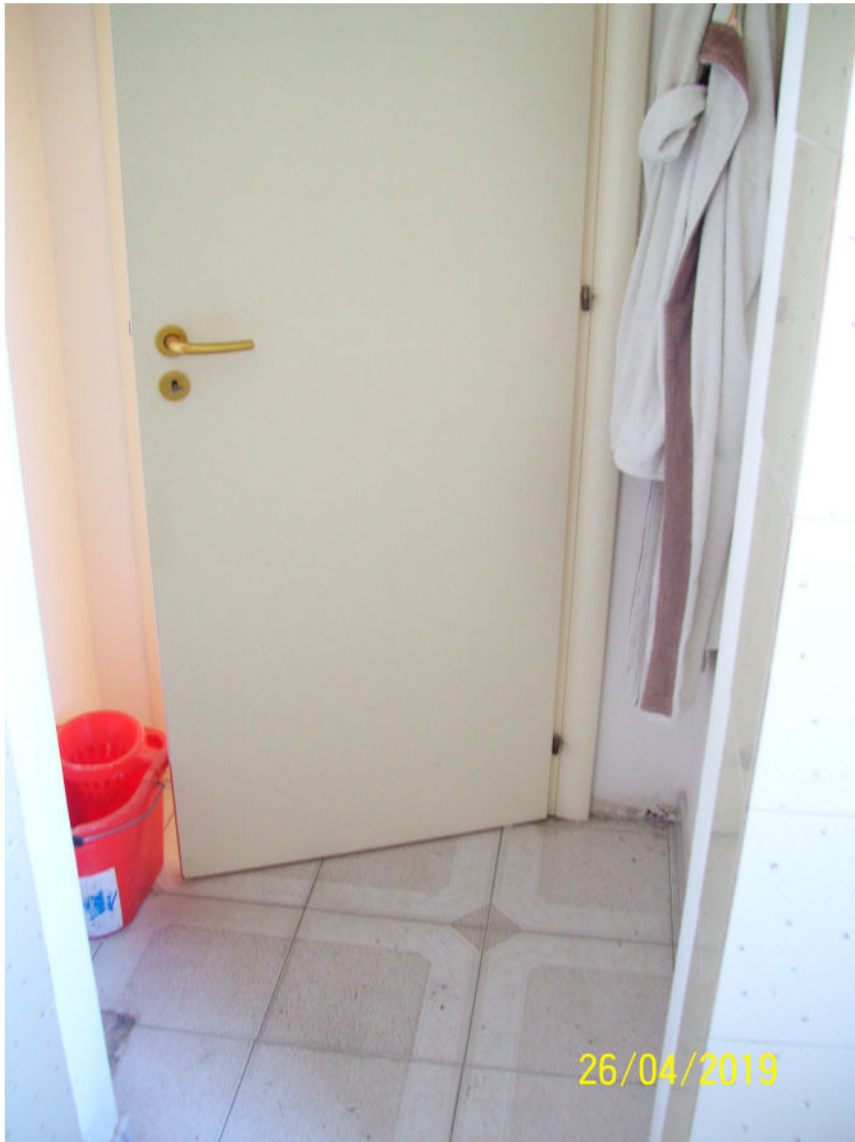
FOTO N. 31 ANTIBAGNO