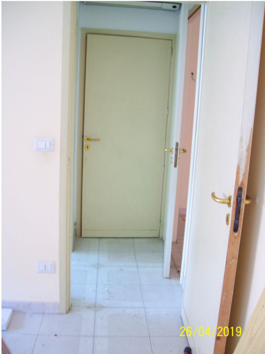
FOTO N. 33 INGRESSO CAMERA VISTA PORTA RIPOSTIGLIO