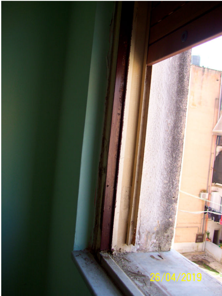
FOTO N. 46 FINESTRA SENZA INFISSO SOLO AVVOLGIBILE