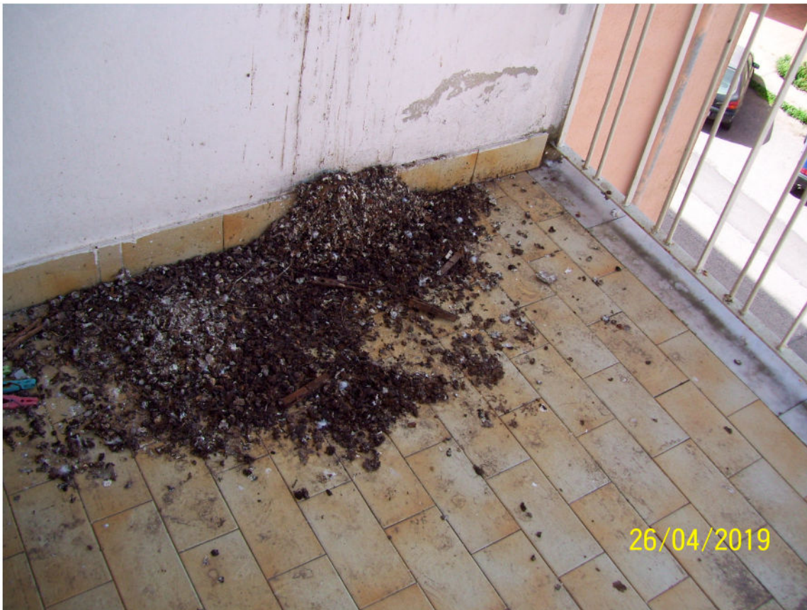
FOTO N. 15 BALCONE