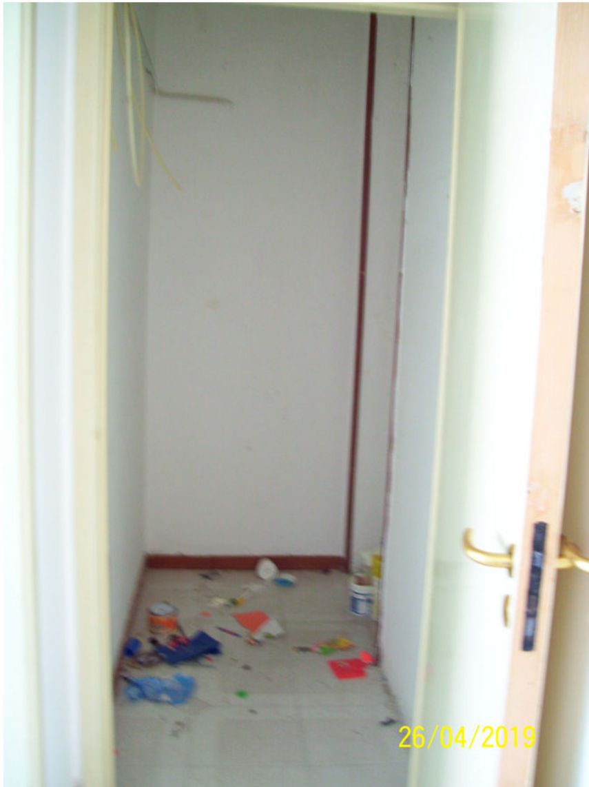
FOTO N. 34 RIPOSTIGLIO