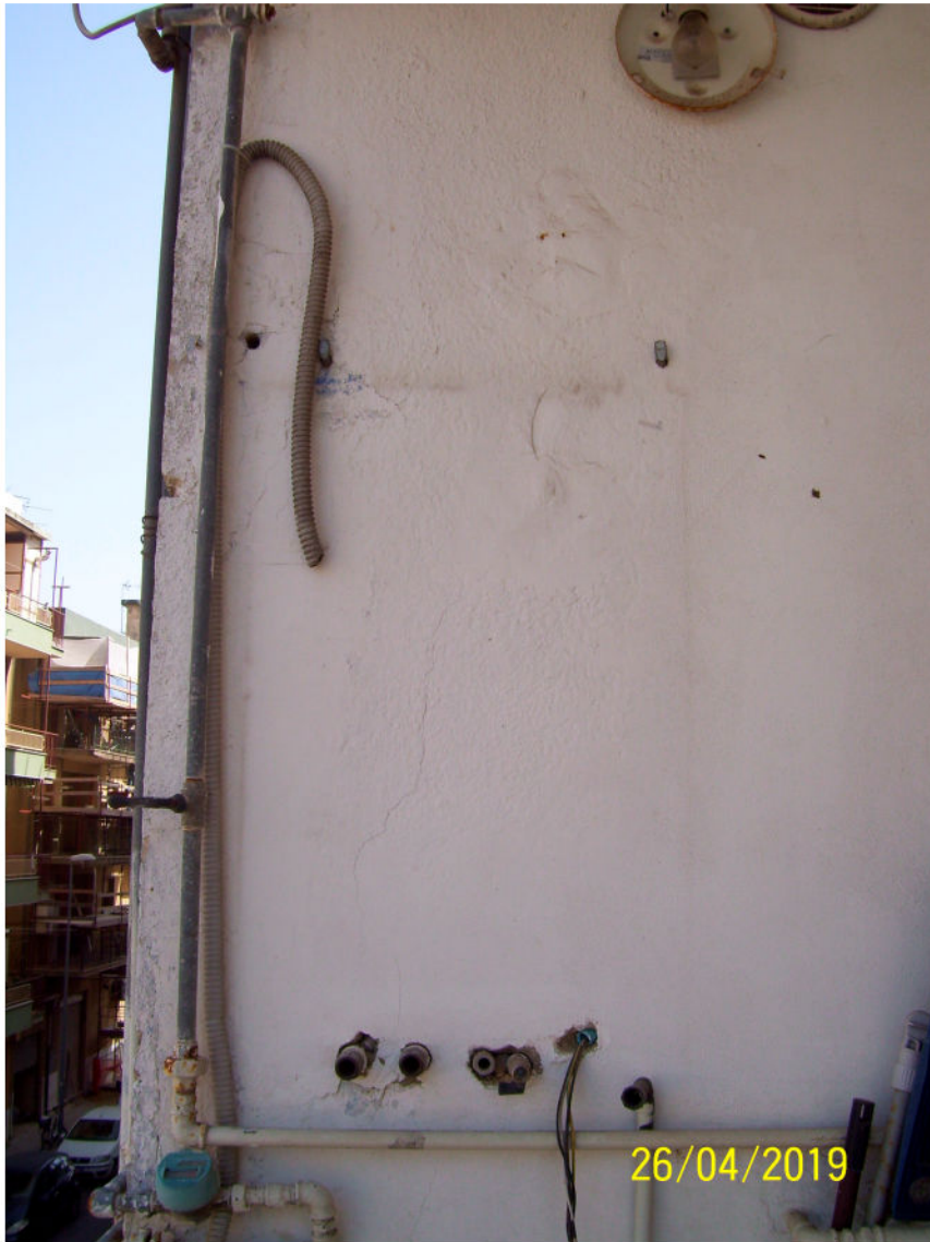
FOTO N. 18 PARETE DOVE ERA UBICATA LA CALDAIA