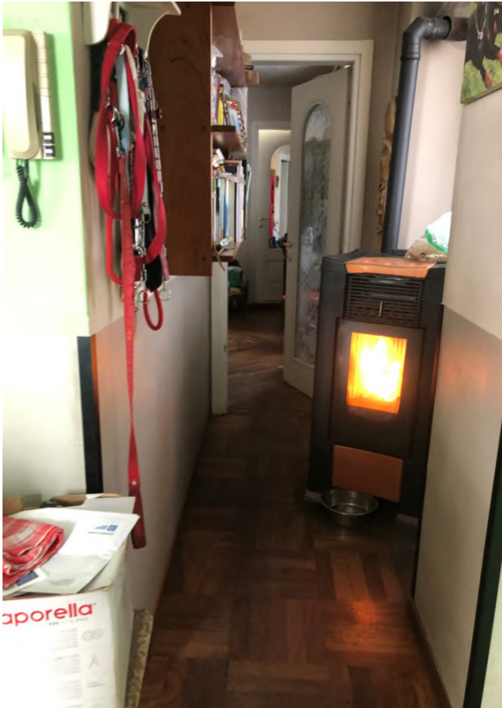
Vista - guardaroba