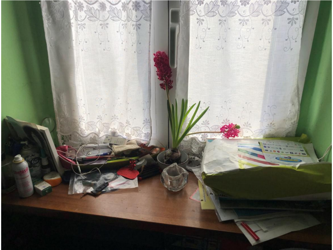
Vista Particolari finestra , davanzali e ventilconvettori