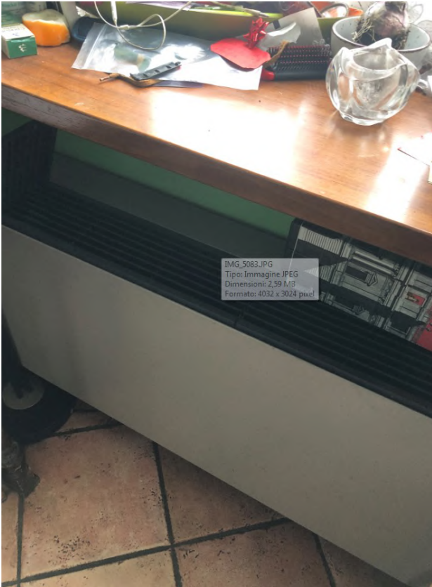
Vista - Corridoio