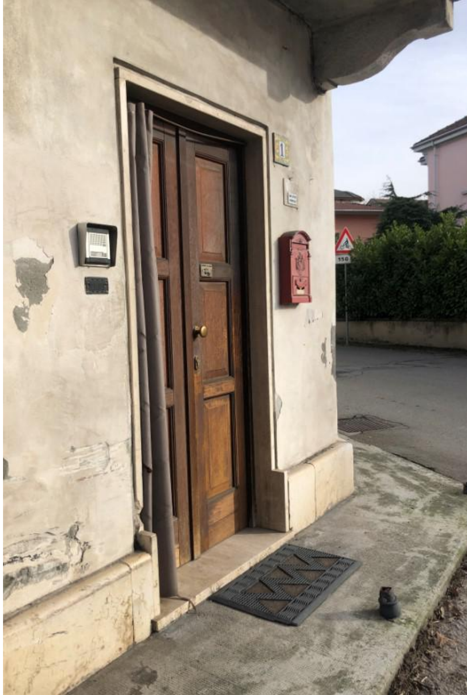
Vista Ingresso crocevia Via Verdi e Via Sn Francesco al Piano Terra, Soggiorno e scala che porta all'immobile periziato, si nota la promiscuità con ambienti abitativi di altra unità immobiliare .