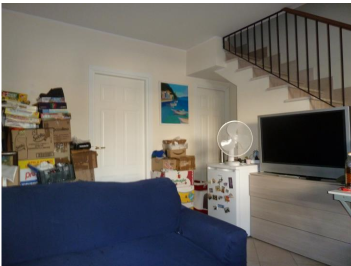
Foto n. 10 – Ancora il soggiorno e sullo sfondo la porta della cucina