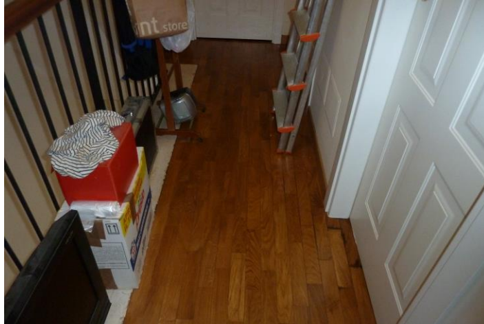
Foto n.11 - Il Corridoio