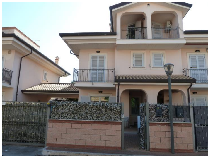
Foto n. 1 – Particolare frontale cancelli carrabile, pedonale e portico