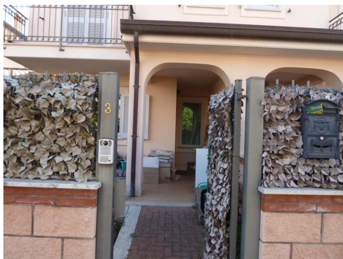
Foto n. 2 – Particolare accesso pedonale con il portico d'ingresso