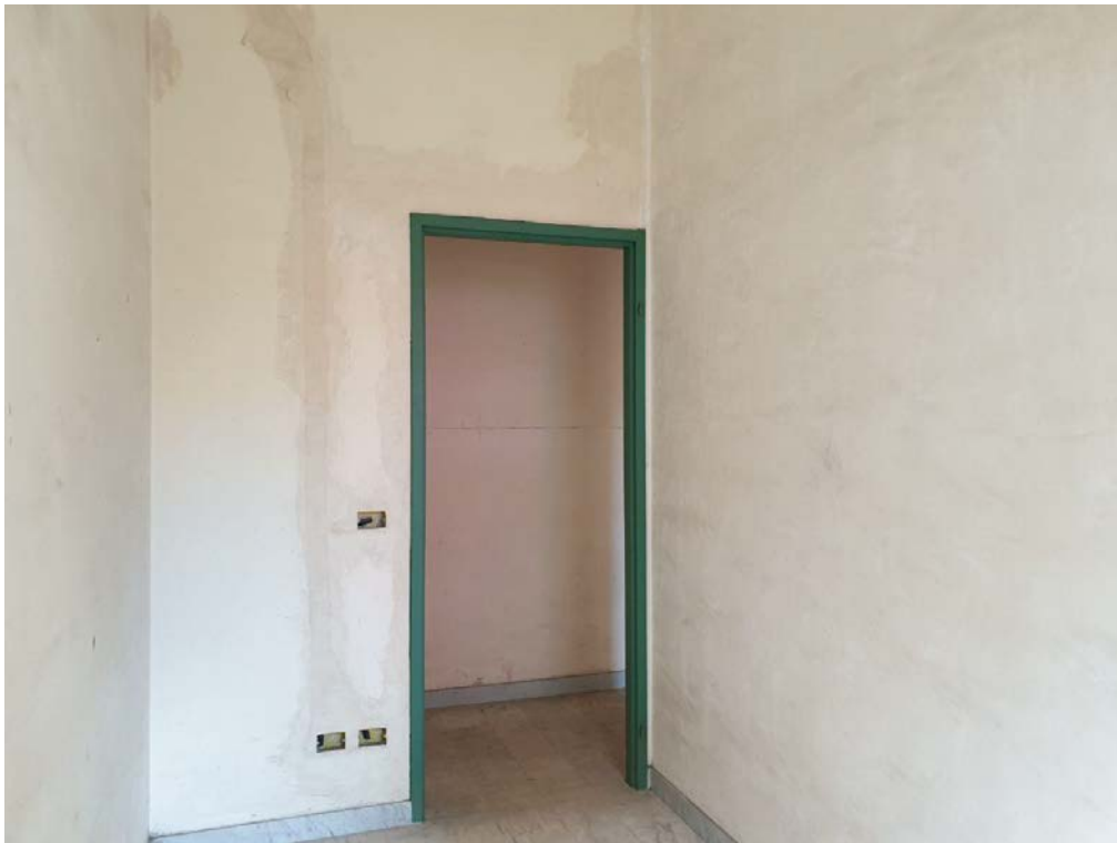
FOTO N. 19 - CAMERETTA 1 - VISTA OPPOSTA