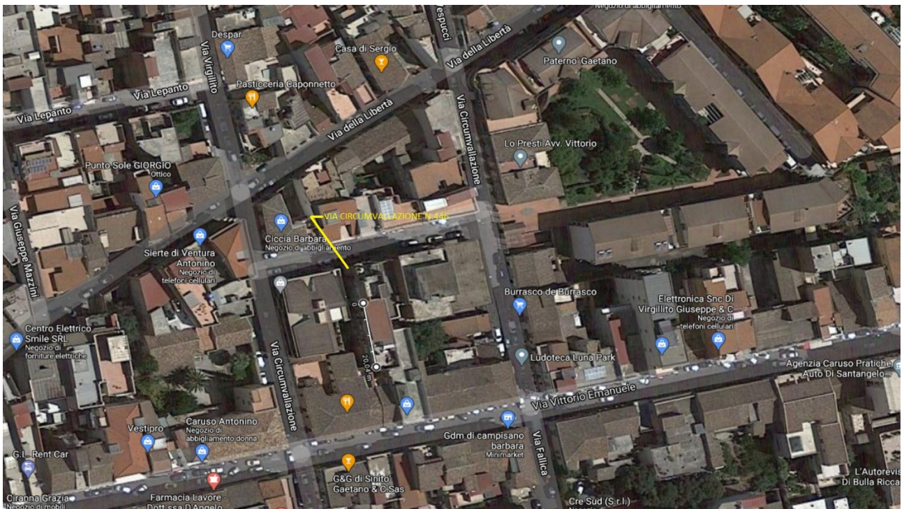
FOTO N. 1- ZONA IMMOBILE