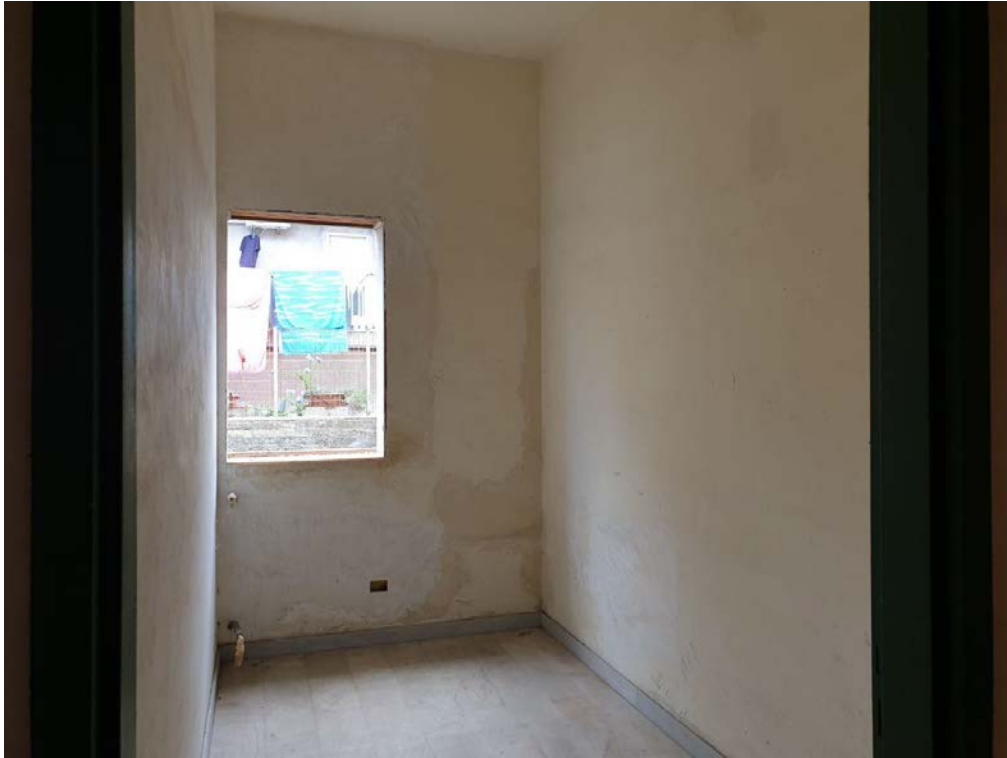
FOTO N. 18 -- CAMERETTA 1