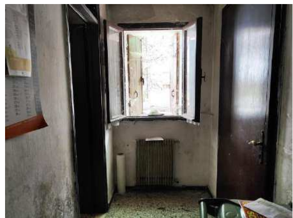
Vista corridoio lato ingresso