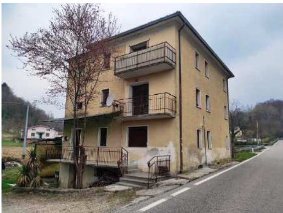
Vista lati sud ed est