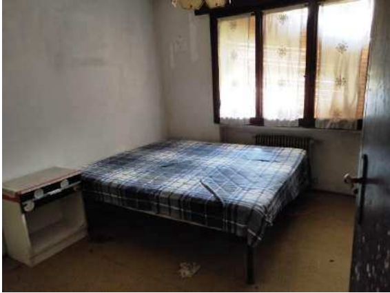
Vista seconda camera