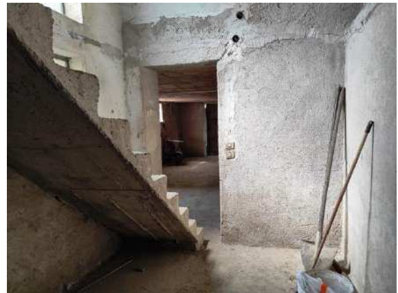
Vista scala di accesso piano seminterrato