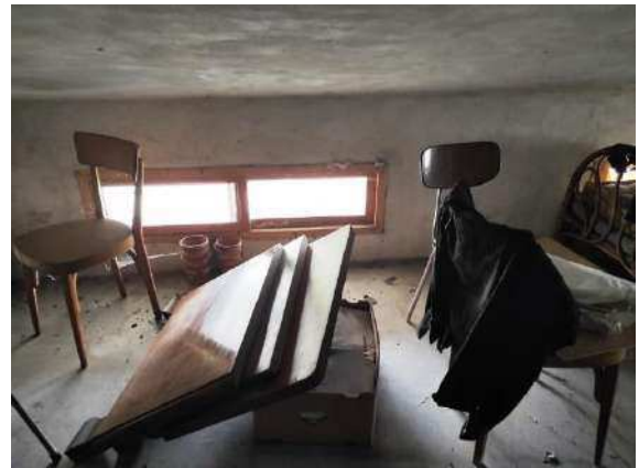
Particolare sottotetto mapp. 688 sub 4