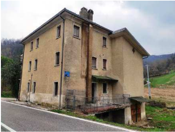
Vista lati nord ed est