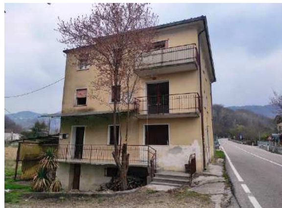
Vista lato sud