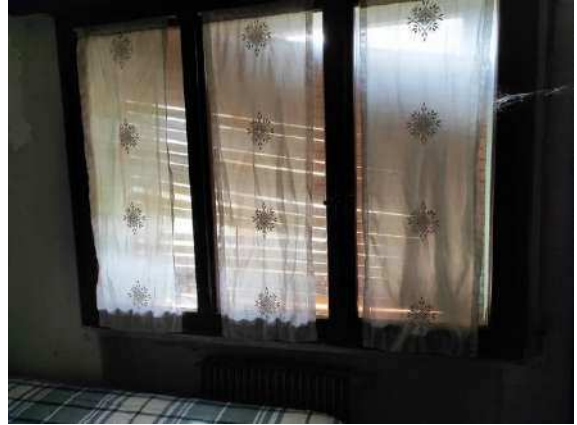
Particolare del serramento