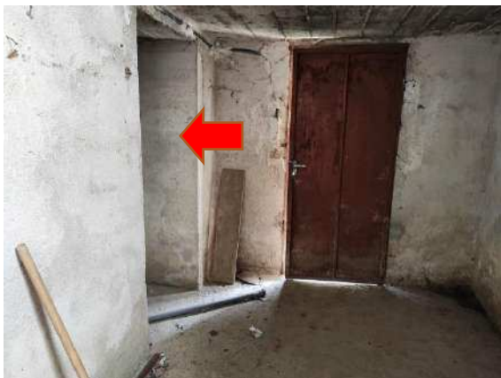
Vista ingresso cantina (sulla sinistra)