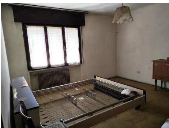
Vista camera matrimoniale