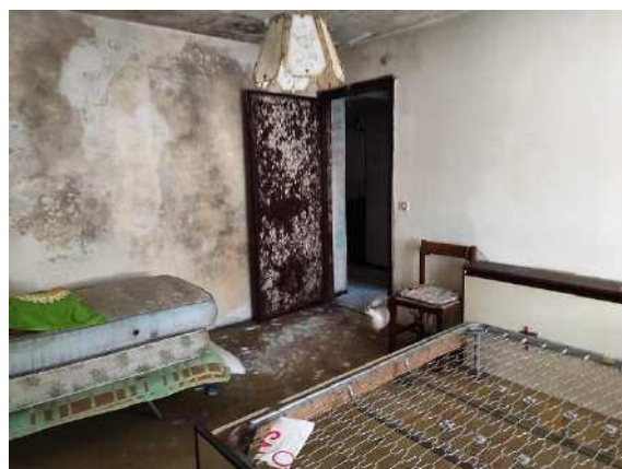
Presenza di muffa su camera matrimoniale