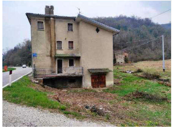
Vista lato nord