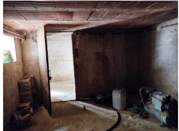
Vista della cantina verso la porta di ingresso