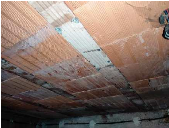
Particolare del soffitto della cantina