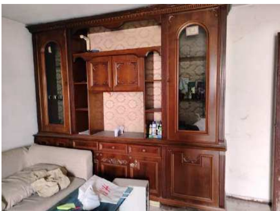
Vista su sala