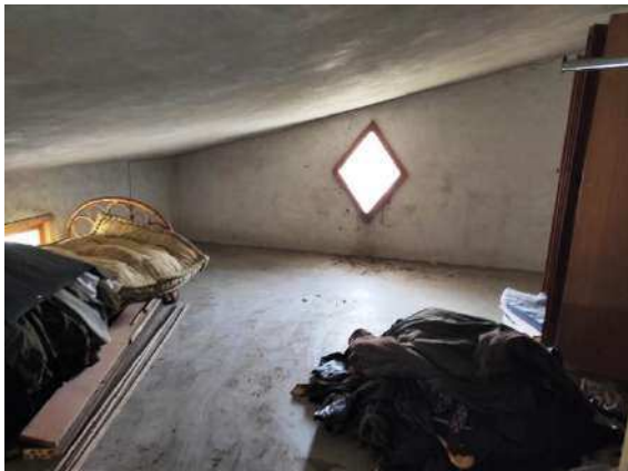
Particolare sottotetto mapp. 688 sub 4