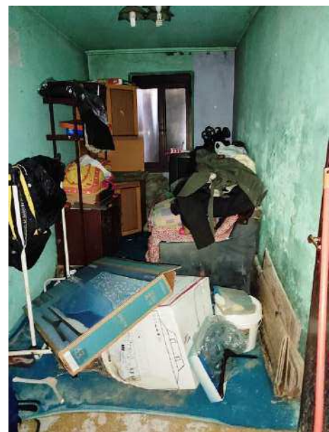
Vista su dispensa