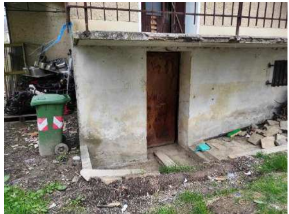
Particolare ingresso magazzini piano interrato