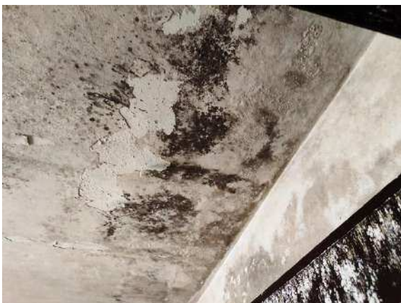
Particolare effetto delle infiltrazioni di acqua