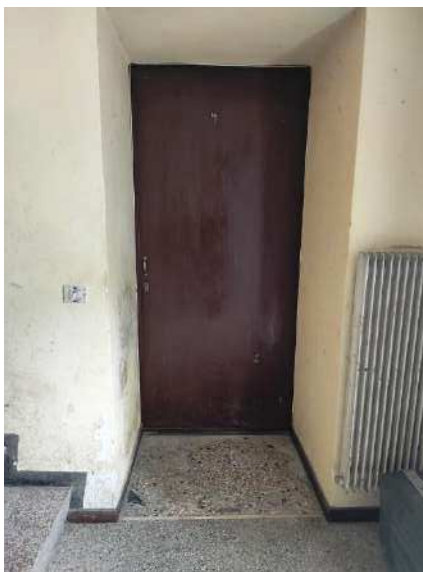
Vista portone ingresso appartamento