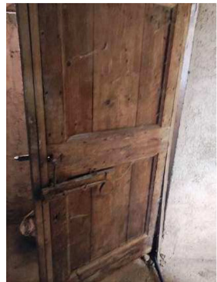
Particolare portone cantina