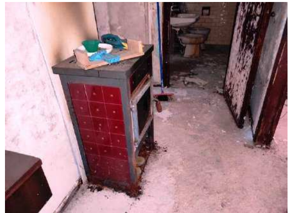
Particolare stufa a legna su corridoio