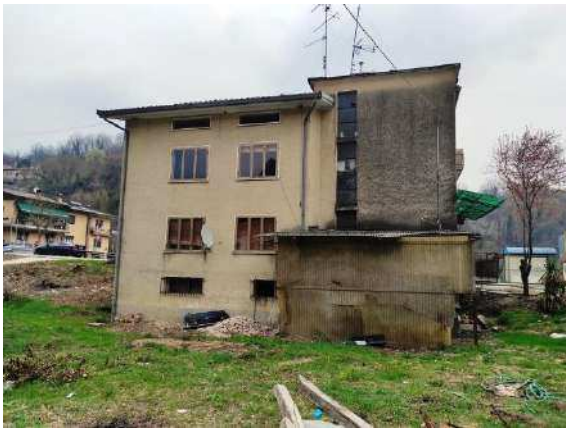
Vista lato ovest