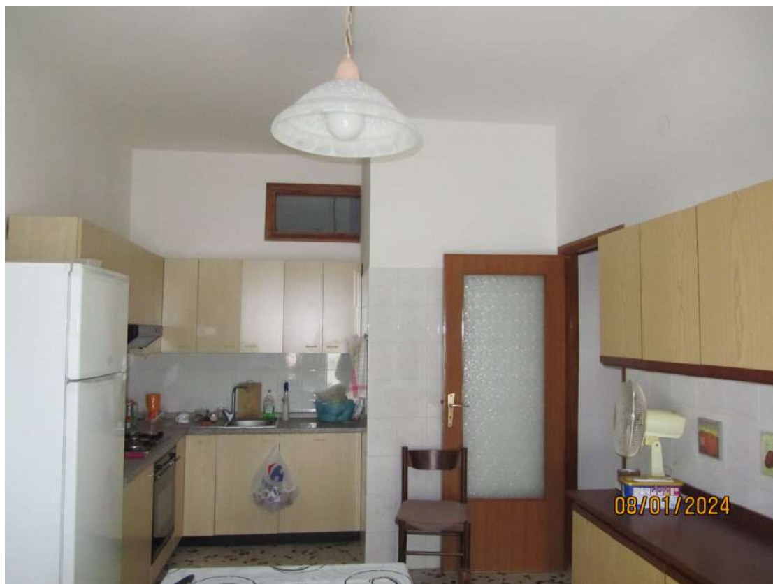
FOTO N.8 - porta-finestra del vano cucina.