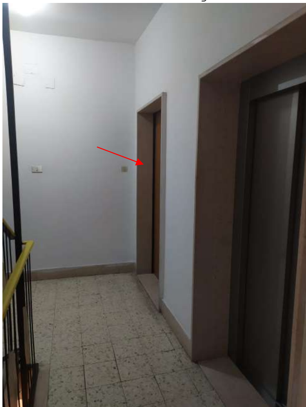
FOTO N.4 - Vista interna ingresso.