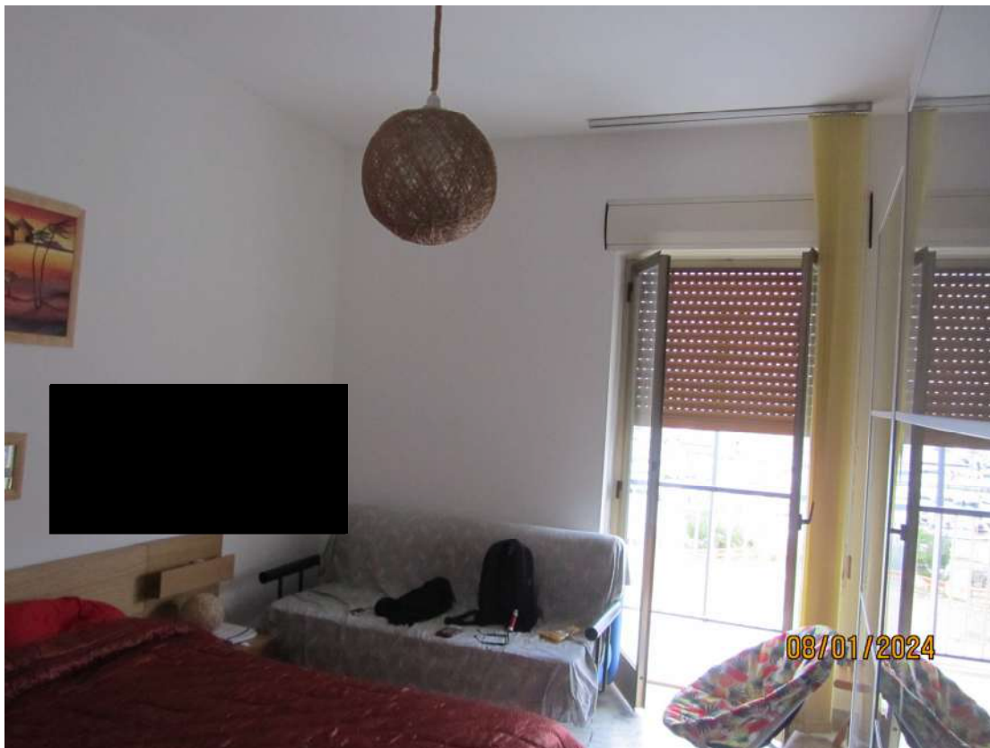
FOTO N.10 - Camera 2.