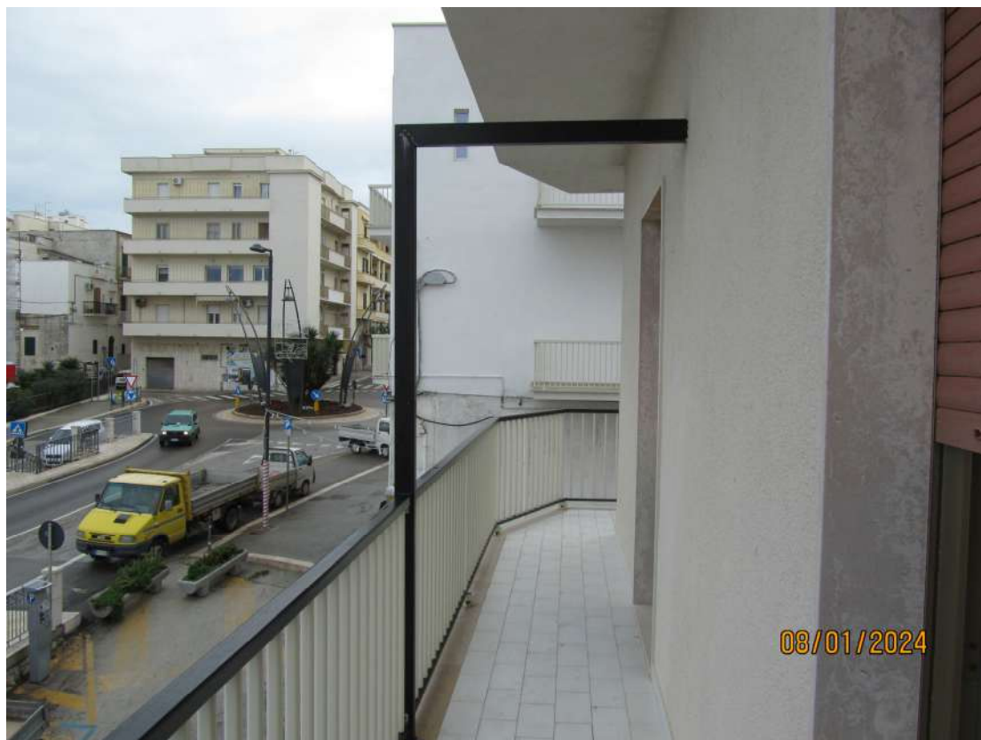
FOTO N.14 - Balcone su via Brindisi.