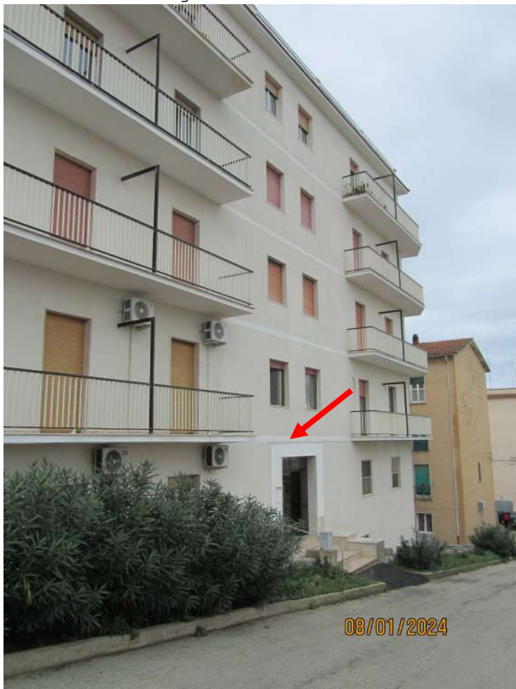
FOTO N.2 - Prospetto ad angolo tra via Brindisi e via Dalmazia.