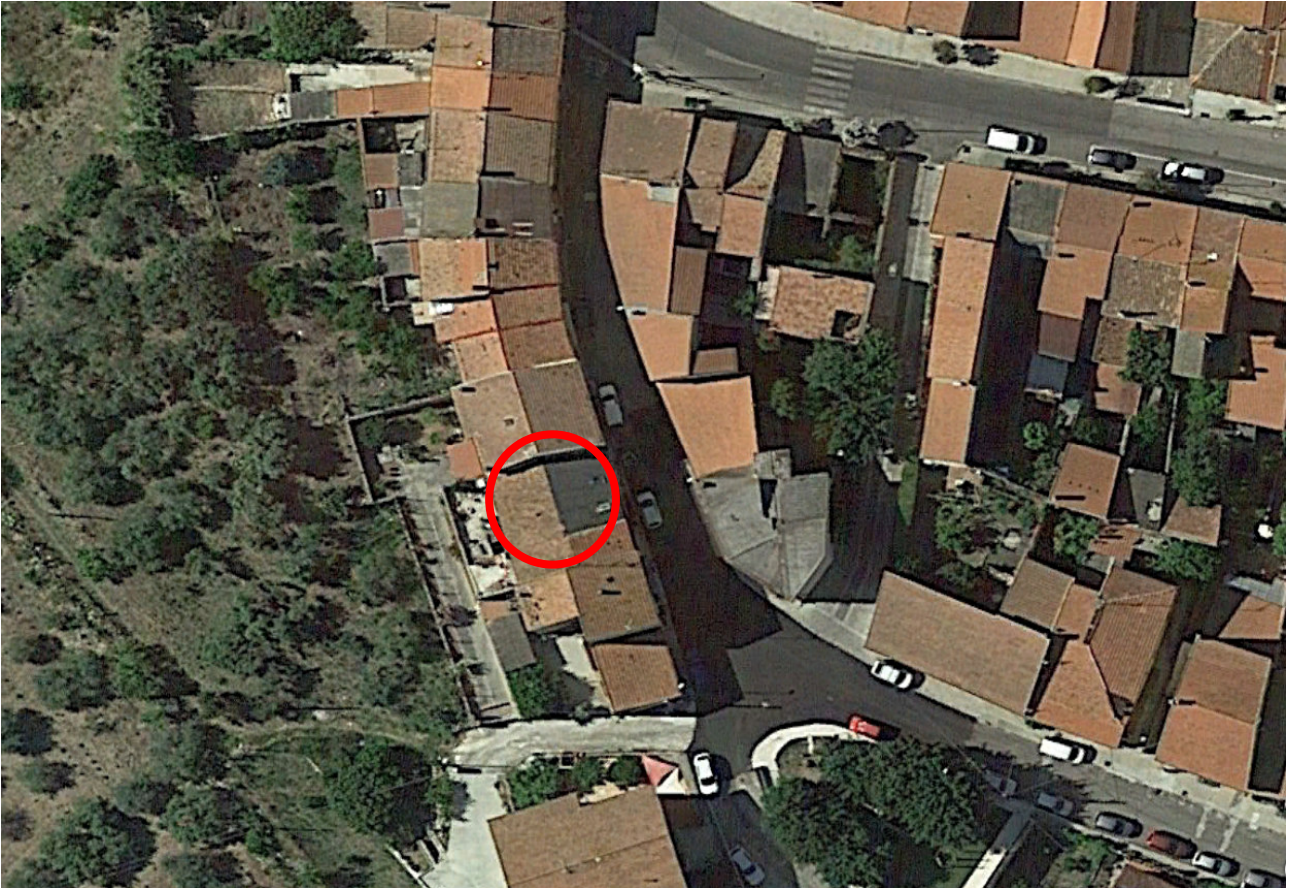
Individuazione del bene