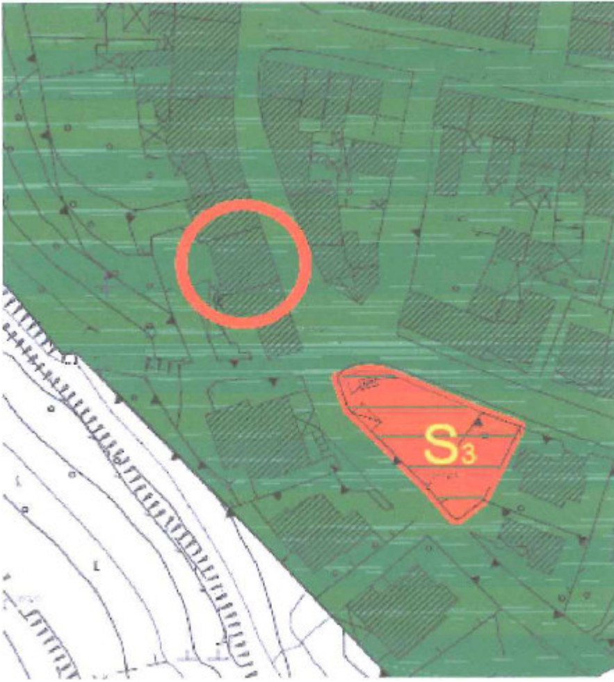
Stralcio Piano Urbanistico Comunale