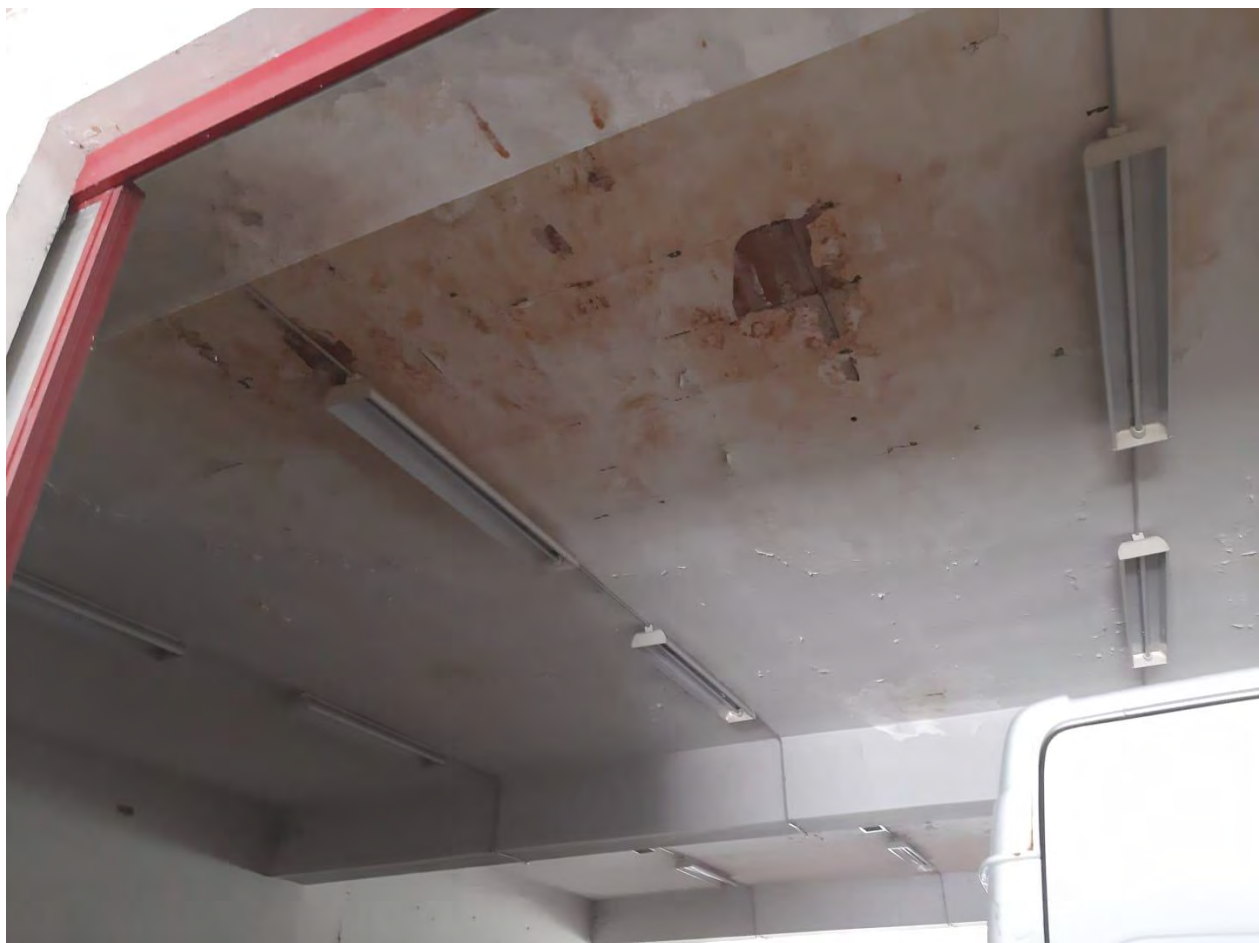
Foto 6 – Particolare del soffitto degradato per infiltrazioni di acqua