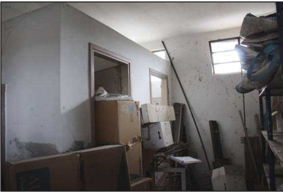
57. Servizi igienici