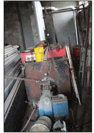
64. Generatore calore