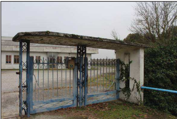
3. Cancello pedonale