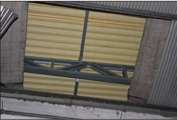
51. Struttura vista attraverso il controsoffitto