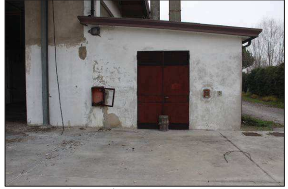
62. Centrale termica