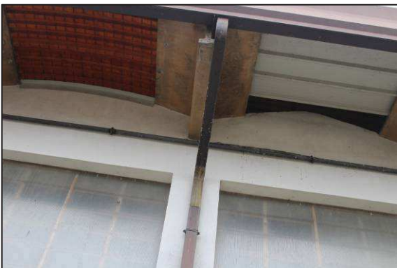
17. Cupolini lato Ovest