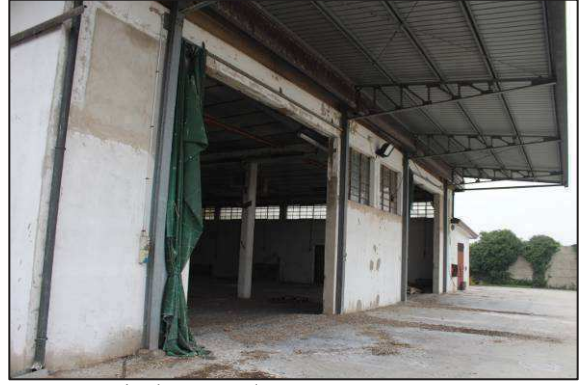
14. Tettoia lato Sud