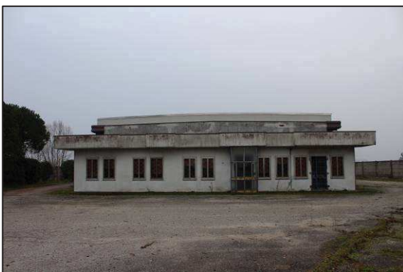
5. Prospetto Nord