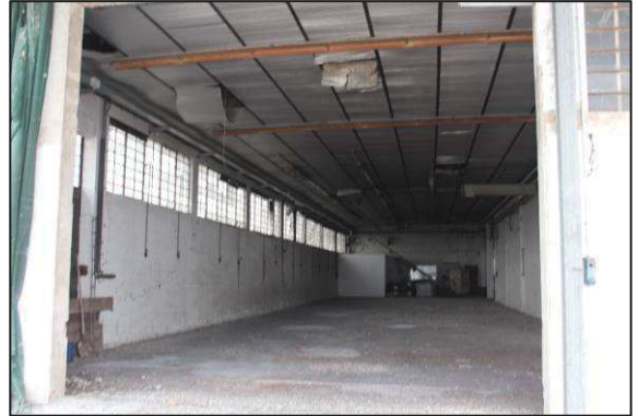
20. Interno ex laboratorio