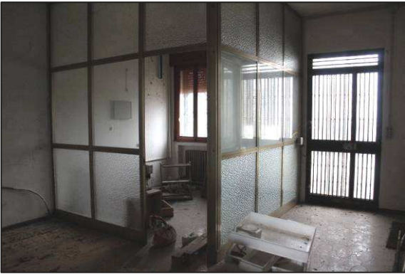
33. Interni uffici