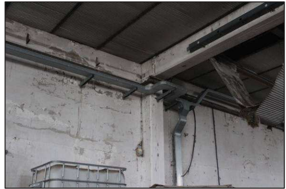
52. Parti strutturali in prefabbricato