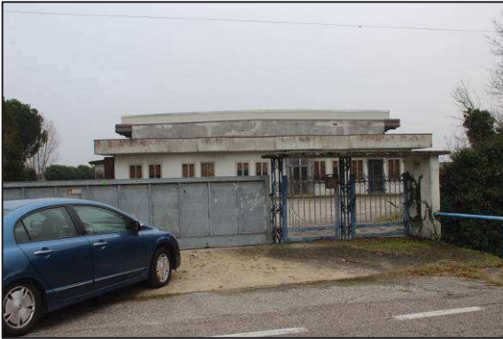
1. Accesso sulla via Frassine (S.P. 23)