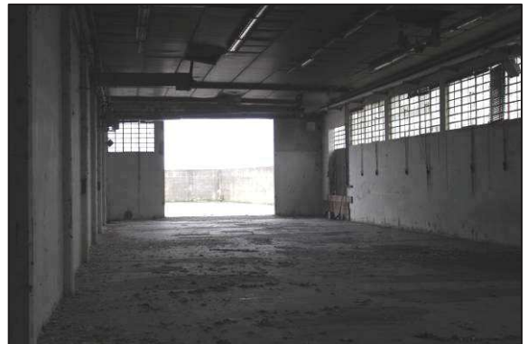
22. Interni ex laboratorio