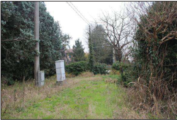
9. Verde sull'angolo Nord-Est