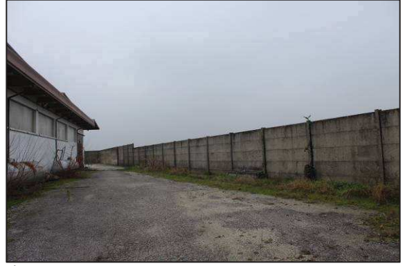
7-8. Prospetto e recinzione Ovest