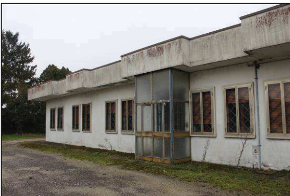
11. Prospetto Ovest