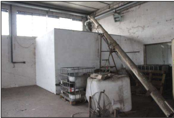
27. Alloggiamento inverter impianto fotovoltaico