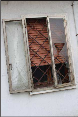
19. Finestra degli uffici