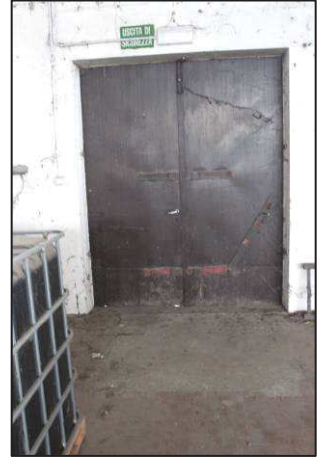
32. Portone magazzino