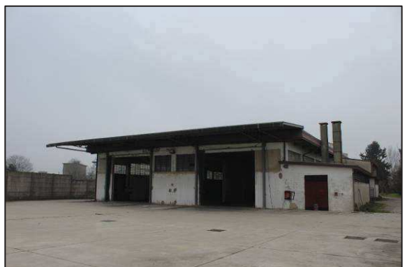
6. Prospetto Sud