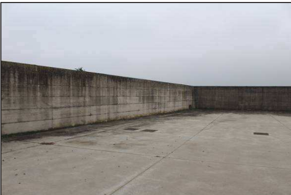
21. Spiazzo e recinzione sul lato Sud