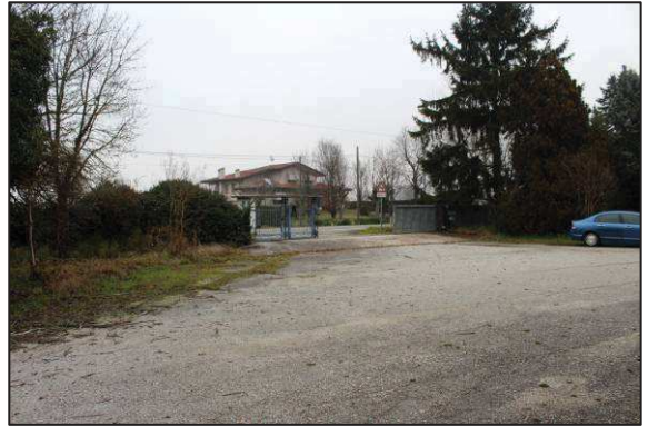
2. Spiazzo davanti al fabbricato