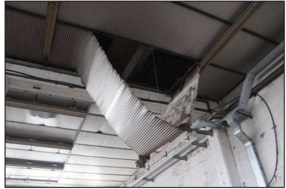
50. Lesione del controsoffitto