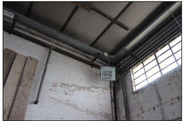
46. Impianti nel capannone