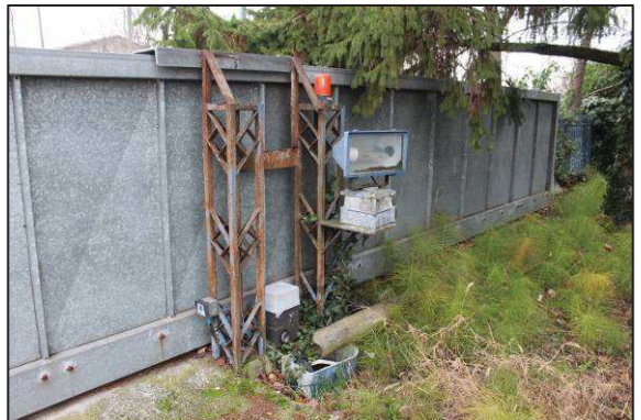
4. Ingresso carraio