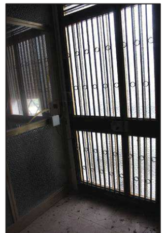
36. Portoncino uffici