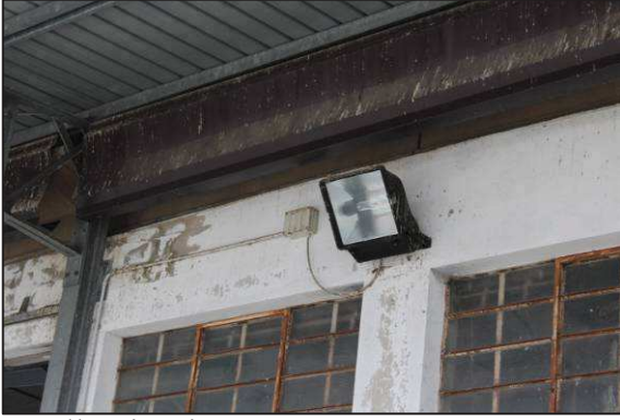
61. Illuminazione notturna