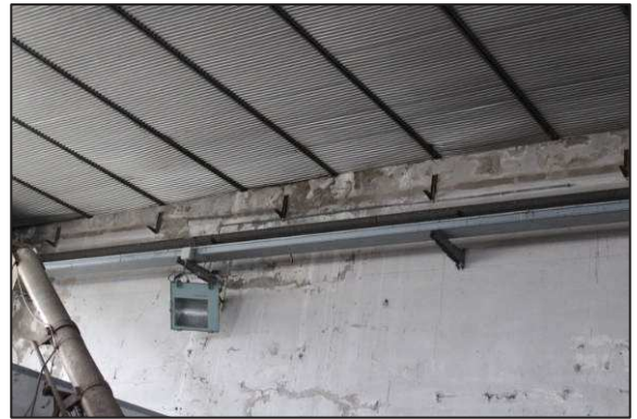
28. Particolare controsoffitto