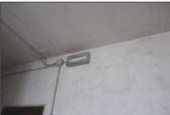
35. Illuminazione di emergenza