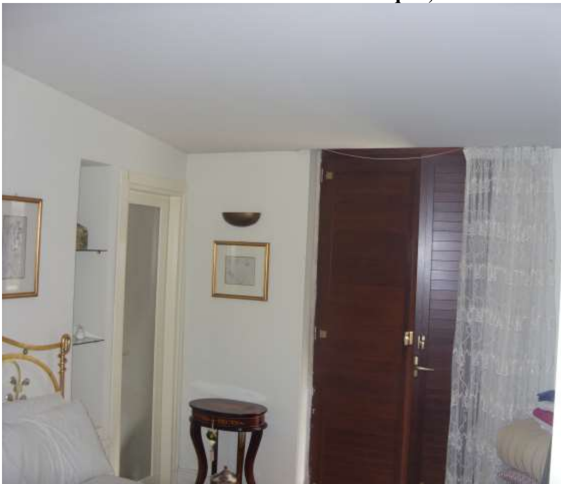
Guardaroba da mq 4,20