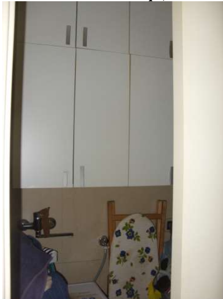
Disimpegno da mq 7,00