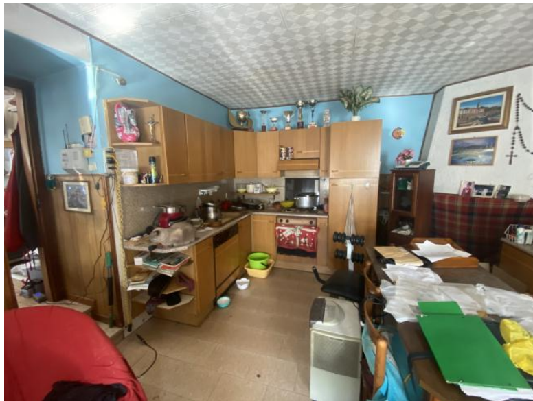
Retro / Taverna