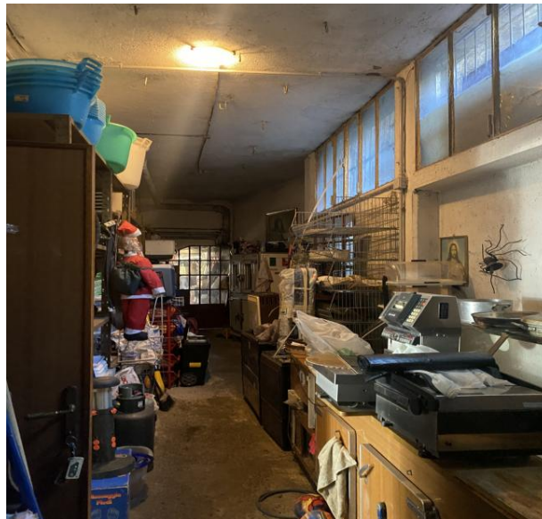
Retro / Magazzino