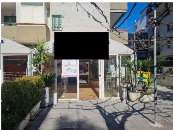
Ingresso dalla veranda esterna