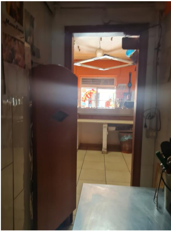
Veduta dalla cucina