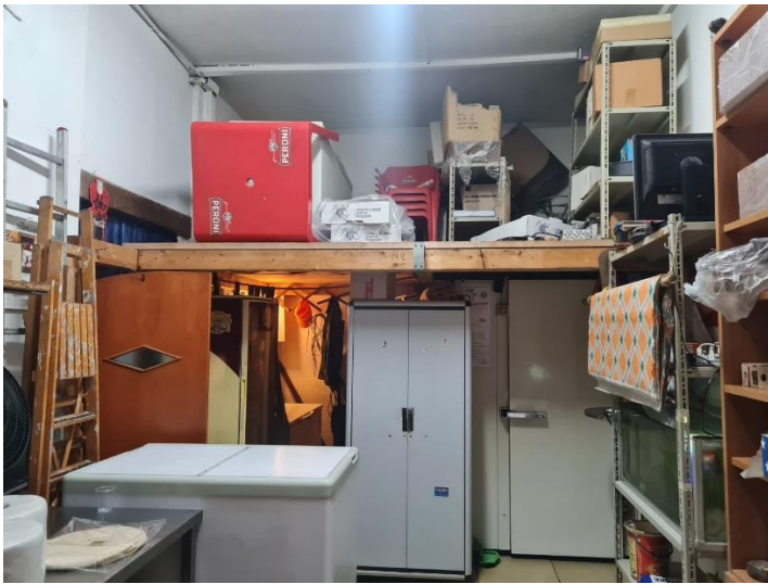
dispensa – area sopracata