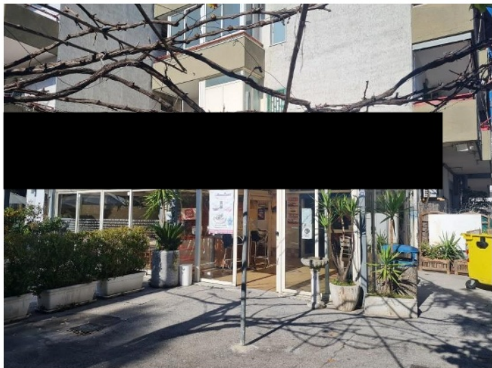
Prospetto adiacente la strada di accesso

LOTTO 3: locale commerciale adibito a ristorante/pizzeria sito in Villaricca via G. Amendola 12