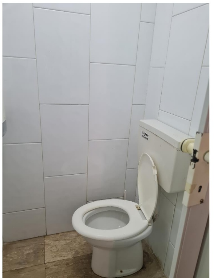
Antibagno, bagno (WC1) e Bagno (WC2)