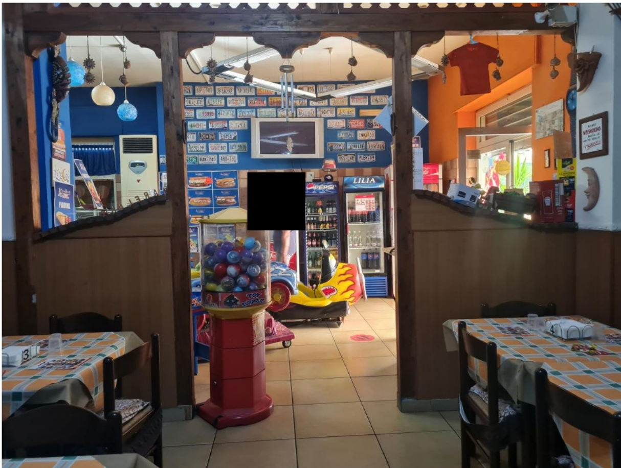
Veduta dell'ingresso dalla sala ristorante