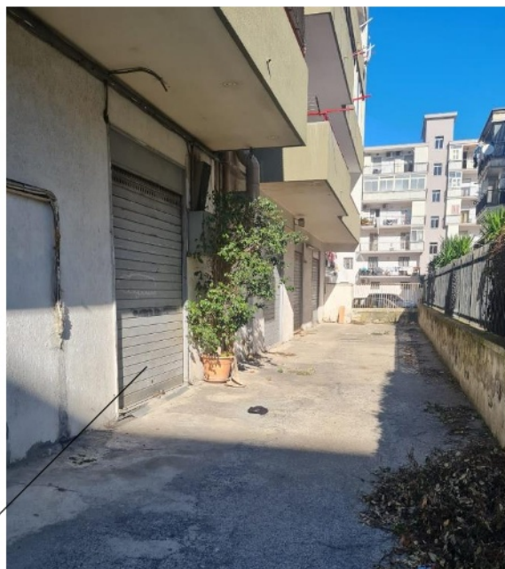
porta di accesso secondaria sul prospetto laterale