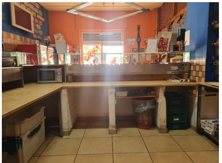
office - bancone