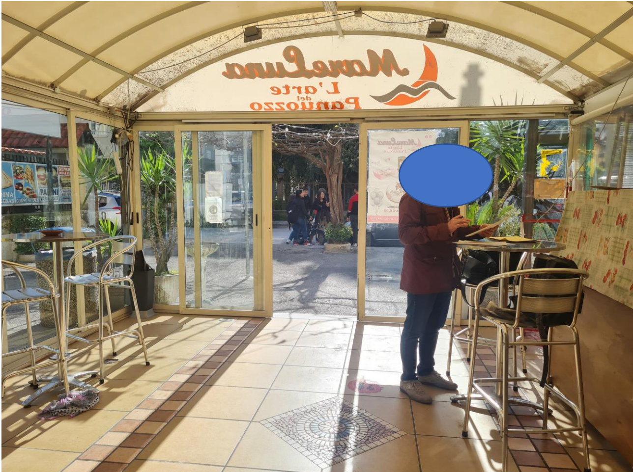
Veranda non oggetto di pignoramento, essa ricade su area condominiale per cui non verrà considerata Nella valutazione dell'immobile.