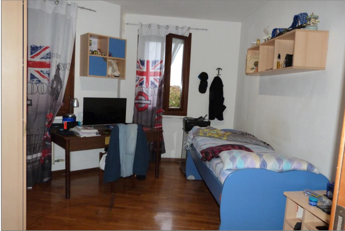
11 Cameretta centrale.