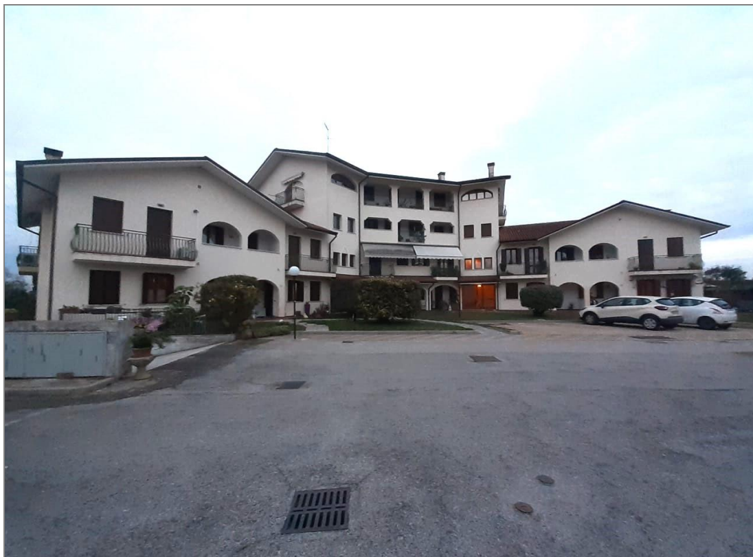
1 Vista, dall'area scoperta comune, del Fabbricato "D" di cui fanno parte i beni oggetto di stima; l'appartamento è al piano terra del corpo centrale.