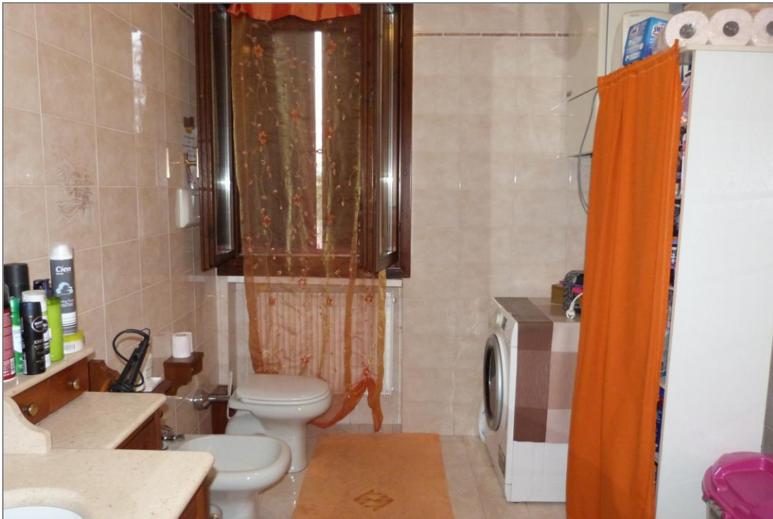
14 Altra parte del bagno.