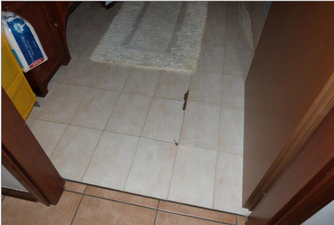
16 Piastrelle fessurate nel pavimento del bagno.