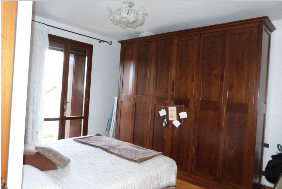
10 Camera grande.