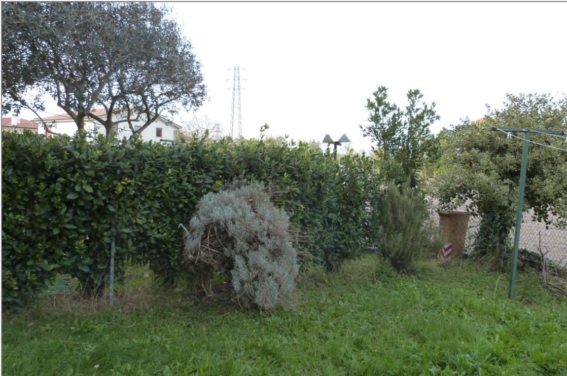
20 Altra parte dell'area scoperta in uso esclusivo.