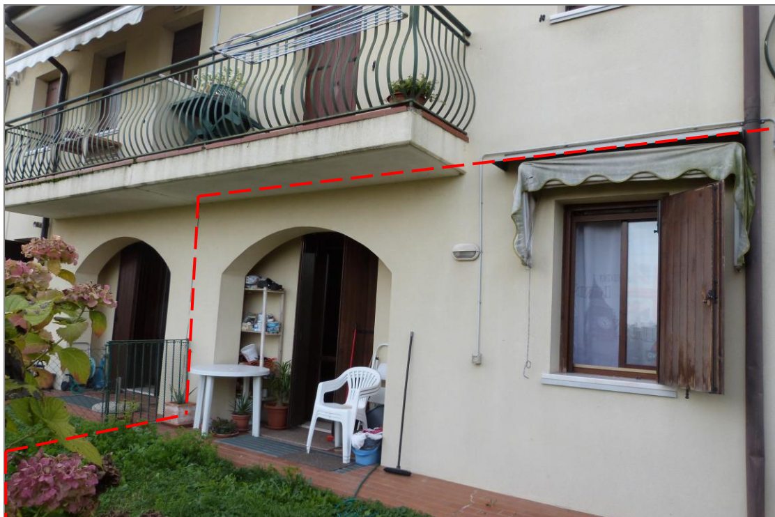
5 Vista di parte del prospetto retrostante dell'appartamento oggetto di stima, evidenziato nel riquadro tratteggiato; dal portico si accede alla camera grande.