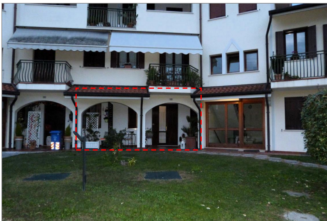
2 Vista del portico e del portoncino d'ingresso all'appartamento oggetto di stima, evidenziato nel riquadro tratteggiato. A destra si vede il portone in legno e vetro per l'accesso ai piani superiori ed al piano interrato.