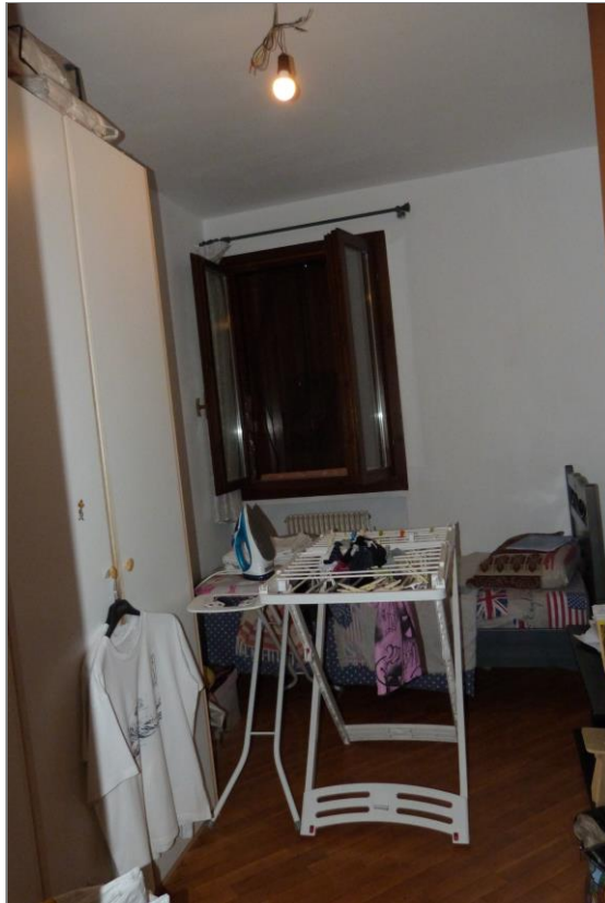
12 Cameretta laterale.