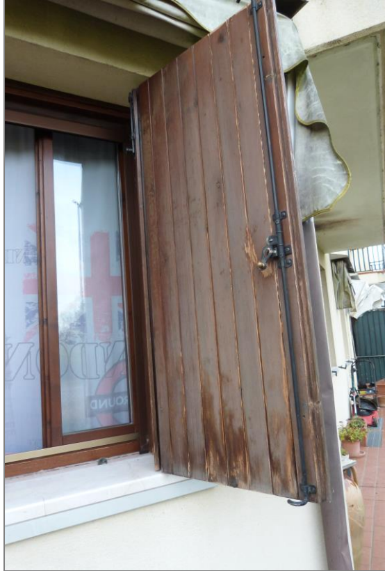
15 Infissi esterni che evidenziano carenza di manutenzione.