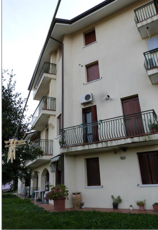
3 Vista di parte del prospetto retrostante del corpo centrale del Fabbricato “D”.