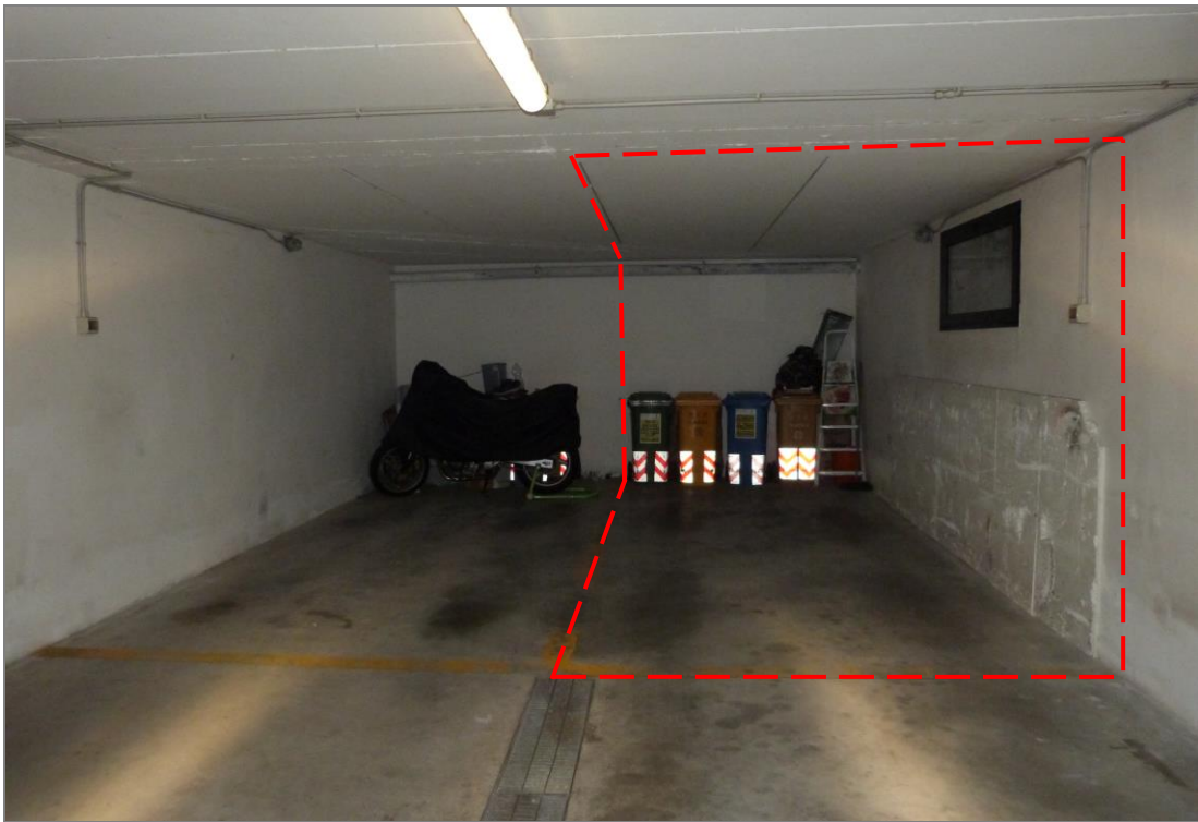
24 Posto auto coperto oggetto di stima, evidenziato nel riquadro tratteggiato.