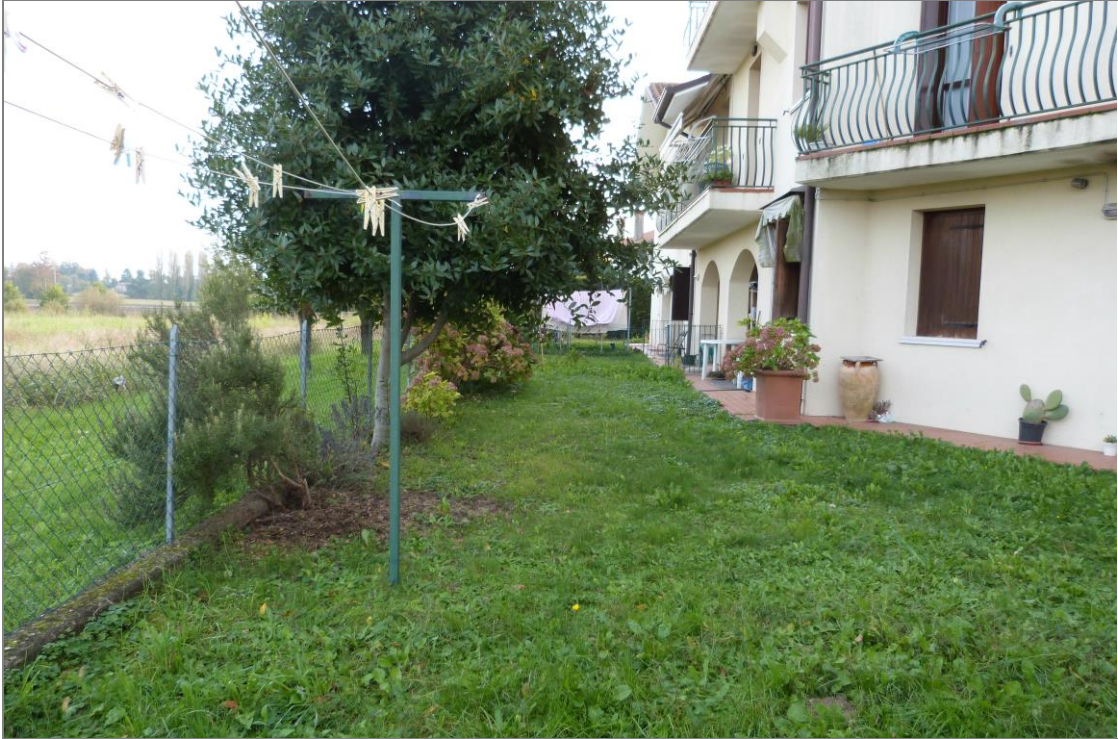
19 Parte dell'area scoperta in uso esclusivo.