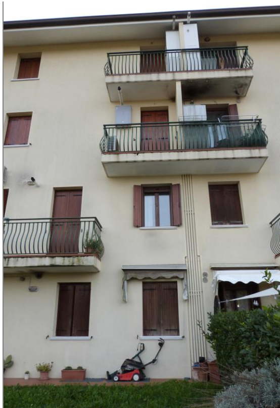
4 Vista di altra parte del prospetto retrostante del corpo centrale del Fabbricato “D”.