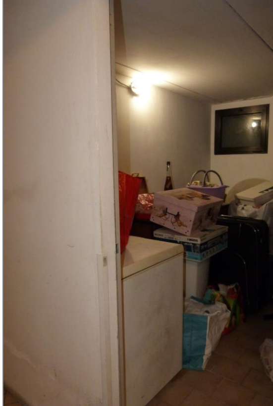
21 Magazzino al piano interrato.