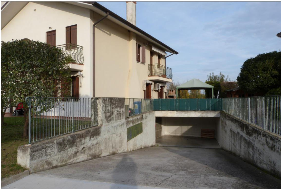
22 Rampa di accesso al piano interrato.