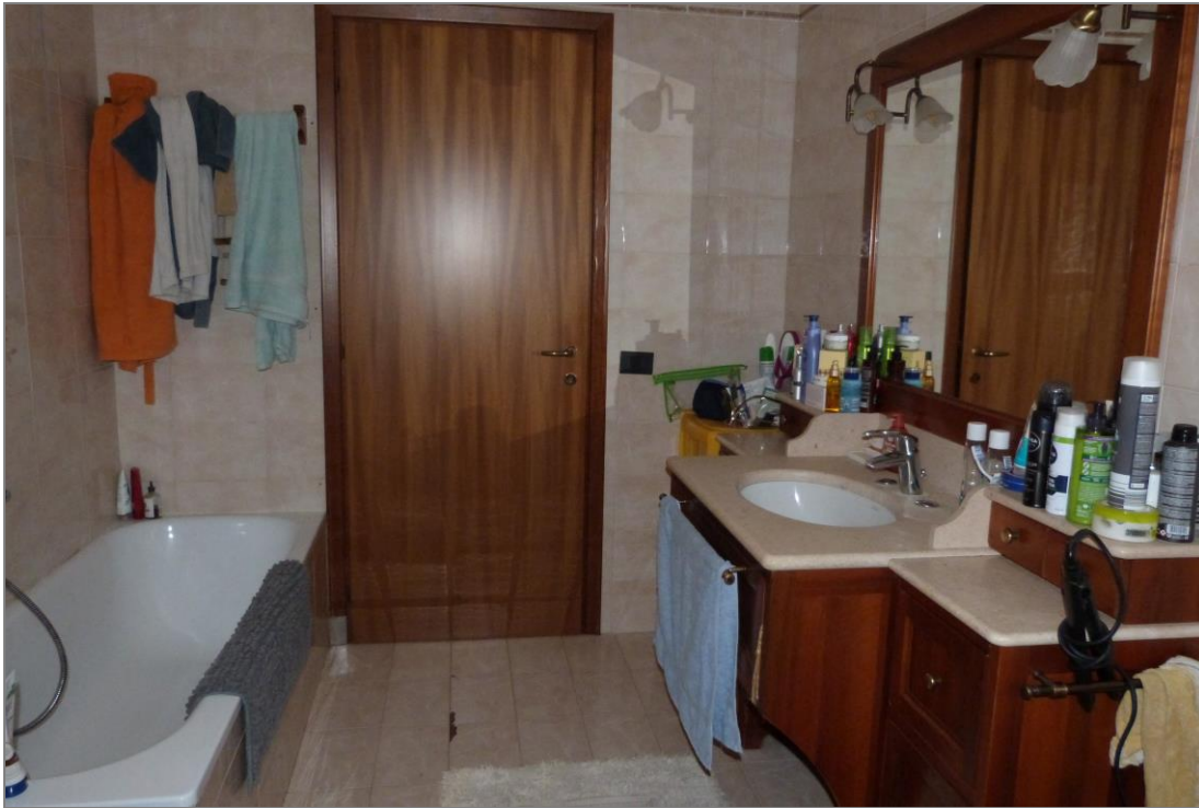
13 Parte del bagno.