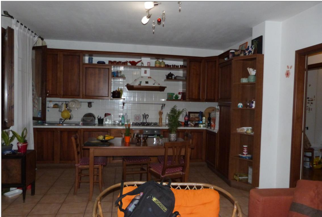
7 Parte del vano ad uso atrio-soggiorno-cottura dell'appartamento.