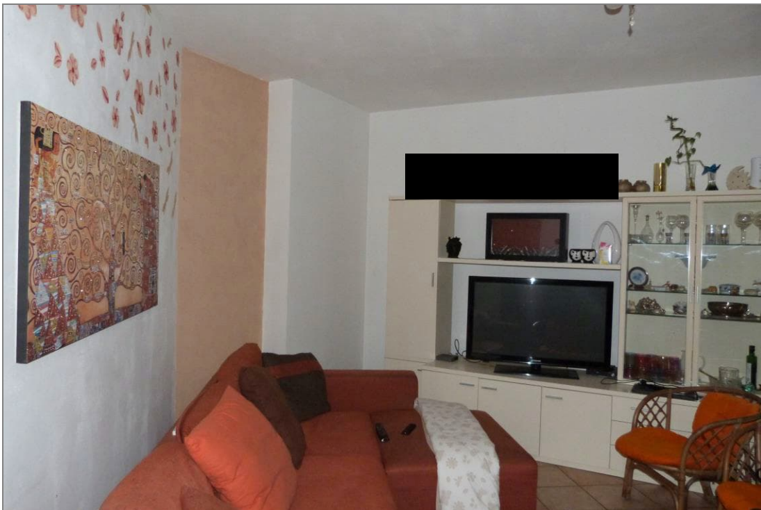
8 Altra parte del vano ad uso atrio-soggiorno-cottura.