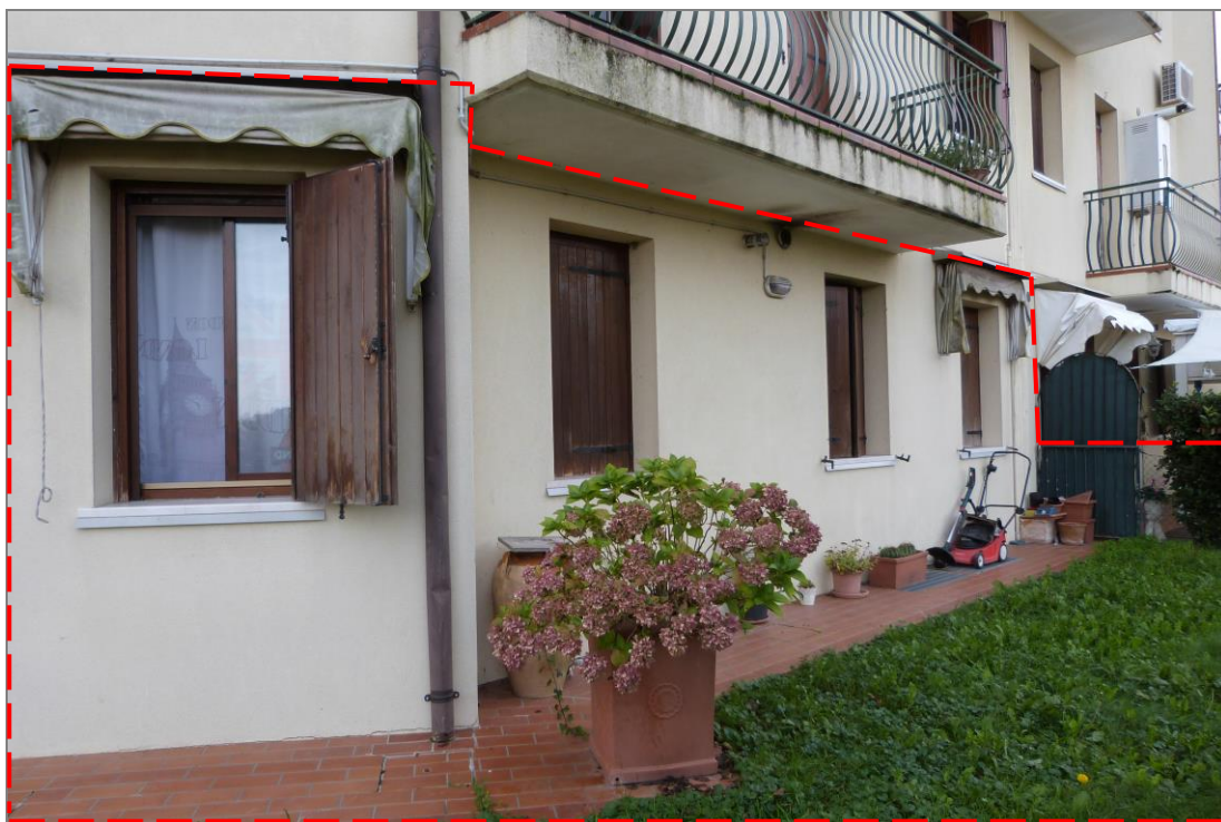
6 Vista dell'altra parte del prospetto retrostante dell'appartamento oggetto di stima, evidenziato nel riquadro tratteggiato.