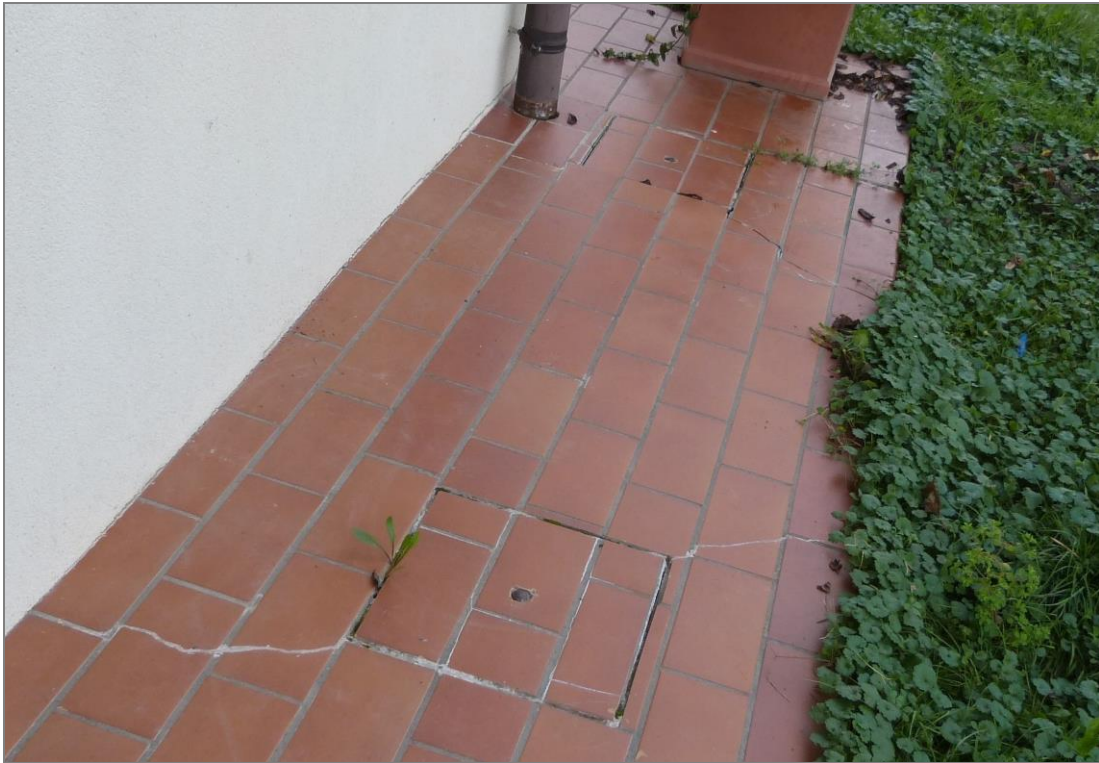
17 Piastrelle fessurate nella pavimentazione del marciapiede.