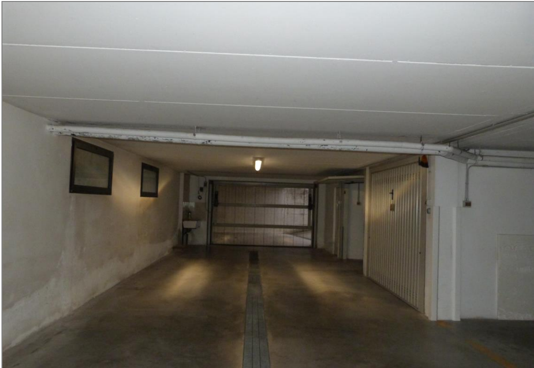
23 Area di manovra del piano interrato adibito a garage e posti auto coperti. In fondo è visibile il cancello motorizzato.