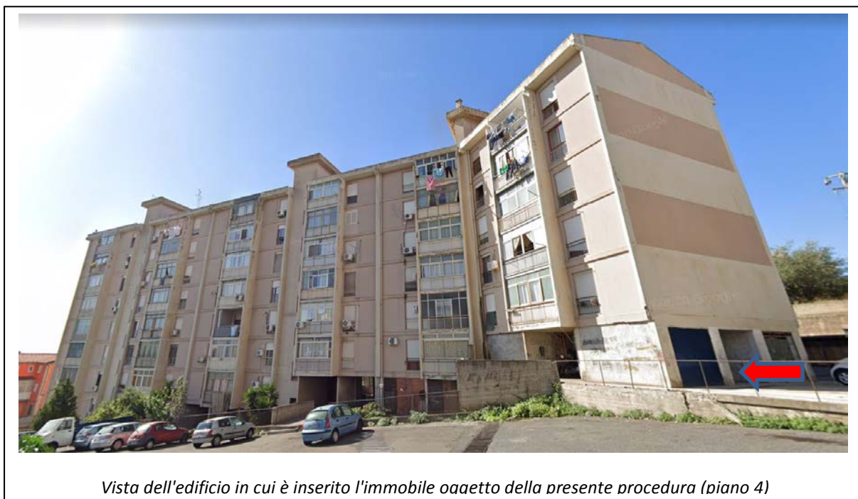
Vista dell'edificio in cui è inserito l'immobile oggetto della presente procedura (piano 4)

L'immobile oggetto di stima è sito al piano quarto di tale struttura edilizia, all'interno n.6.