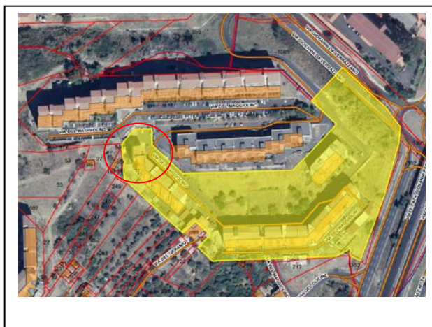
Individuazione immobile su ripresa satellitare e su mappa catastale

L'immobile oggetto di stima è sito al piano quarto di tale struttura edilizia, all'interno n.6.