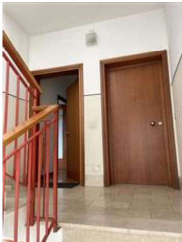
Pianerottolo di accesso all'appartamento sub. 12.