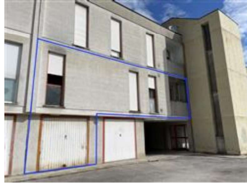
Vista esterna del condominio sa sud (contorni indicativi sull'unità in oggetto).