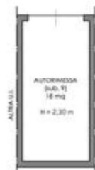
Schema distributivo dello stato di fatto - Piano terra.