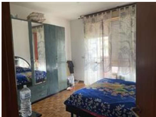
Camera da letto.