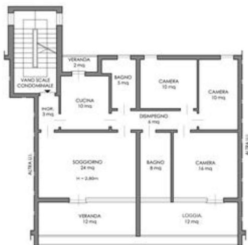
Schema distributivo dello stato di fatto - Piano primo.