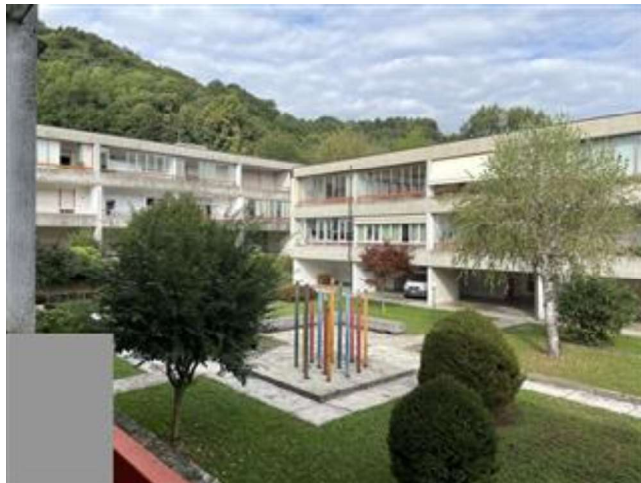
Vista sull'area verde comune.