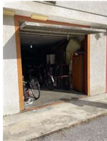
Vista esterna dell'autorimessa sub. 9.