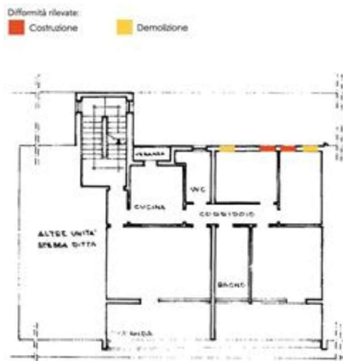
Sovrapposizione stato di fatto-planimetrie catastali.

Si segnala inoltre un disallineamento della mappa catastale, la quale erroneamente riporta il numero 583 anzichè 589 in relazione al fabbricato in oggetto; non si rilevano incertezze nell'individuazione dell'immobile pignorato.