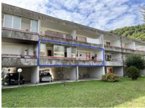
Vista esterna del complesso da nord (contorni indicativi sull'unità in oggetto).

proprietà di terzi, mentre è libero sui restanti due lati. Il garage confina a nord est e sud ovest con proprietà di terzi, mentre sui restanti lati con l'area comune esterna.