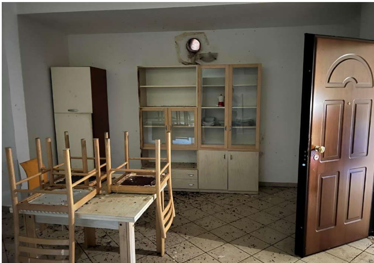
FOTO 15: Veduta interna vano soggiorno/angolo cottura Lotto 2, Corpo A-piano terra