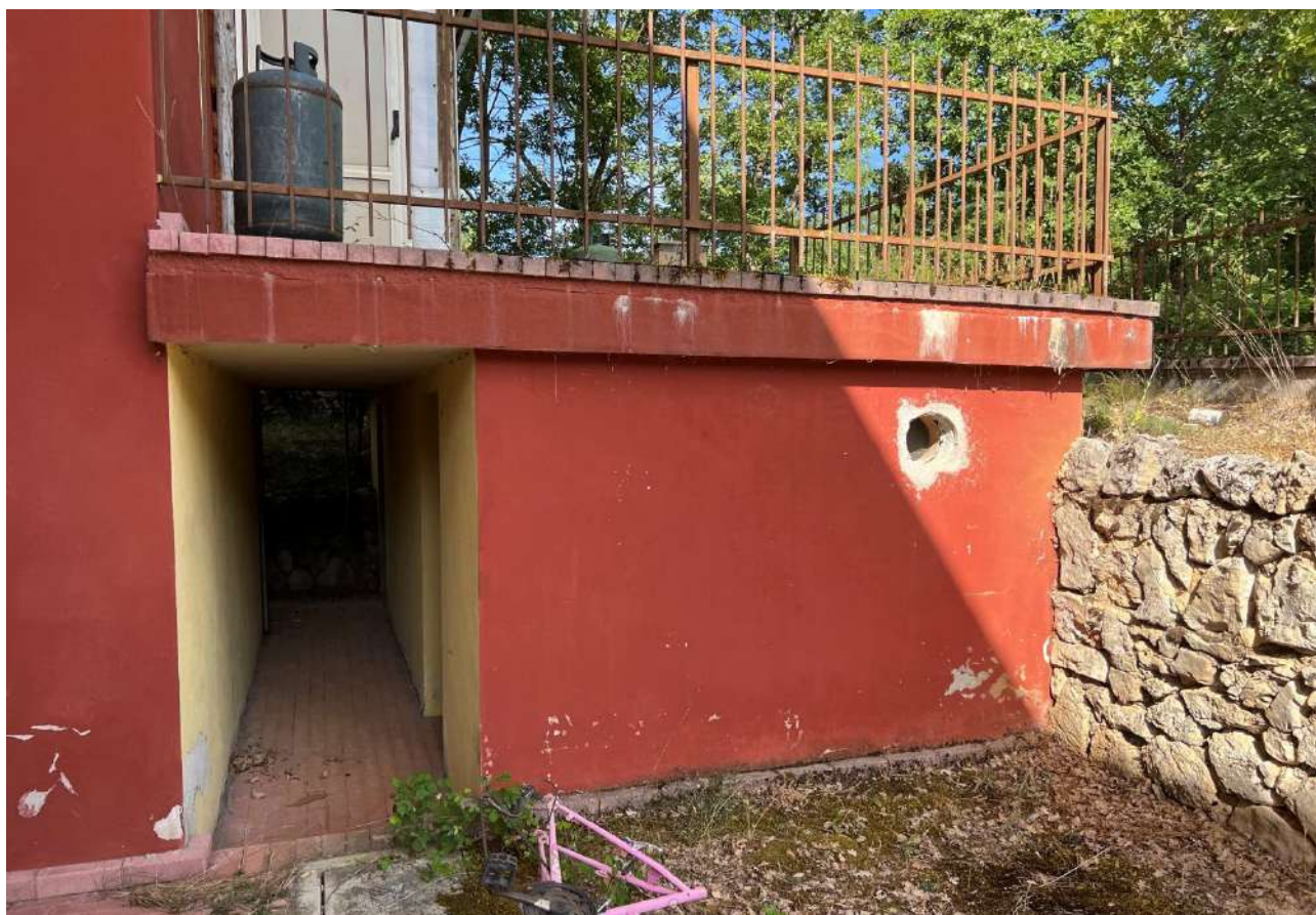
FOTO 14: Veduta esterna vano cantina di pertinenza Lotto 3, Corpo A-piano terra