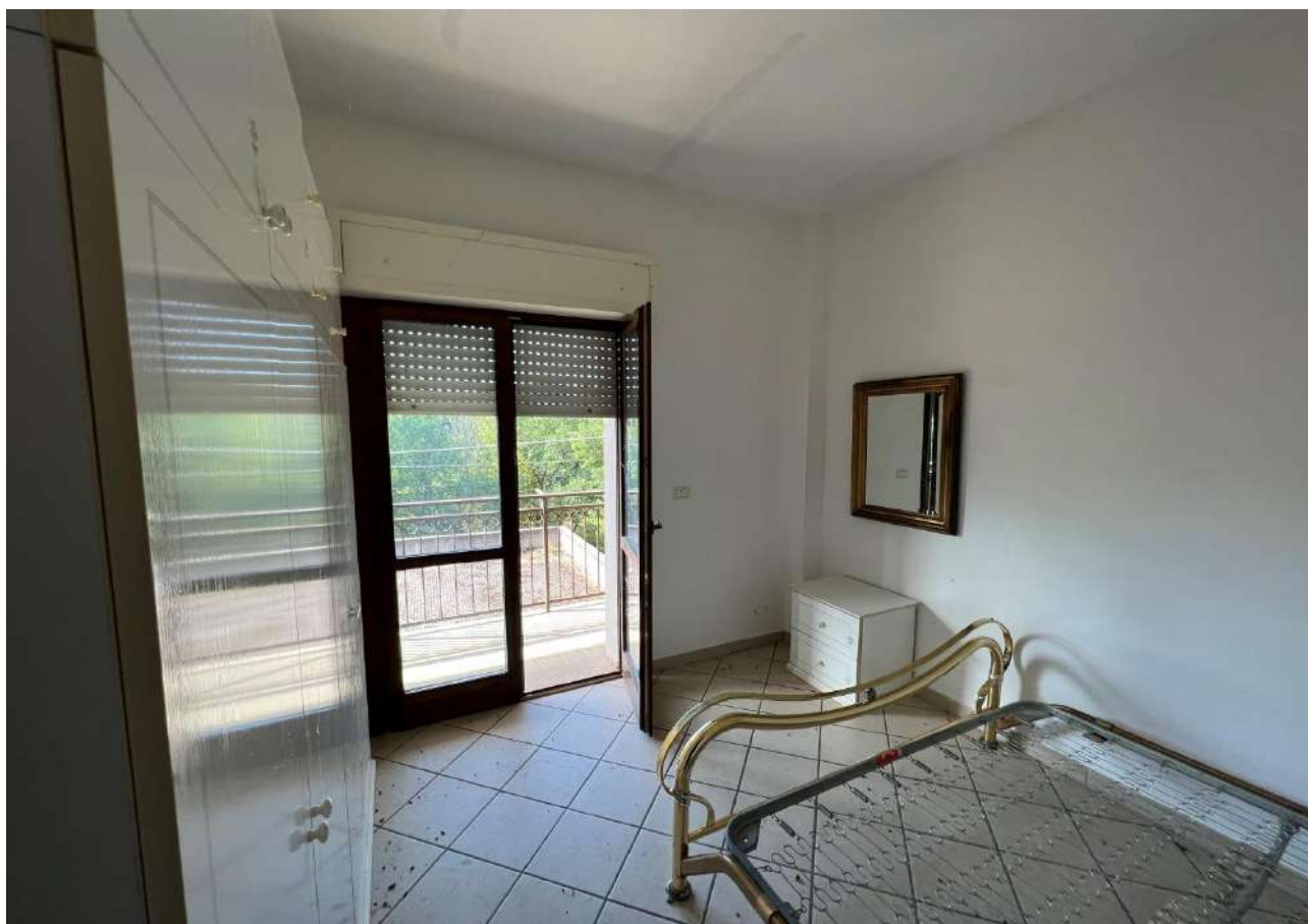
FOTO 10: Veduta interna vano camera da letto Lotto 1, Corpo A-piano primo