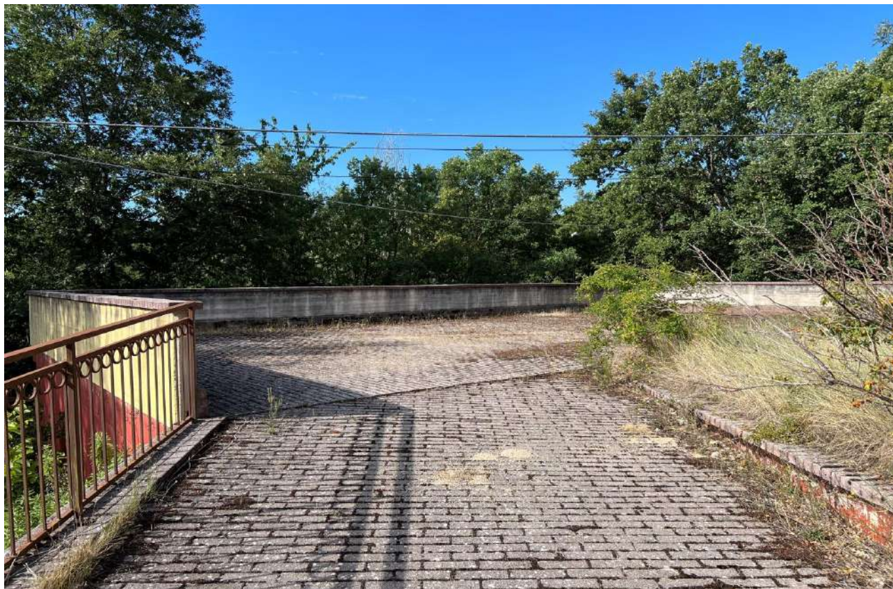
FOTO 5: Veduta esterna corte comune soprastante i garage interrati