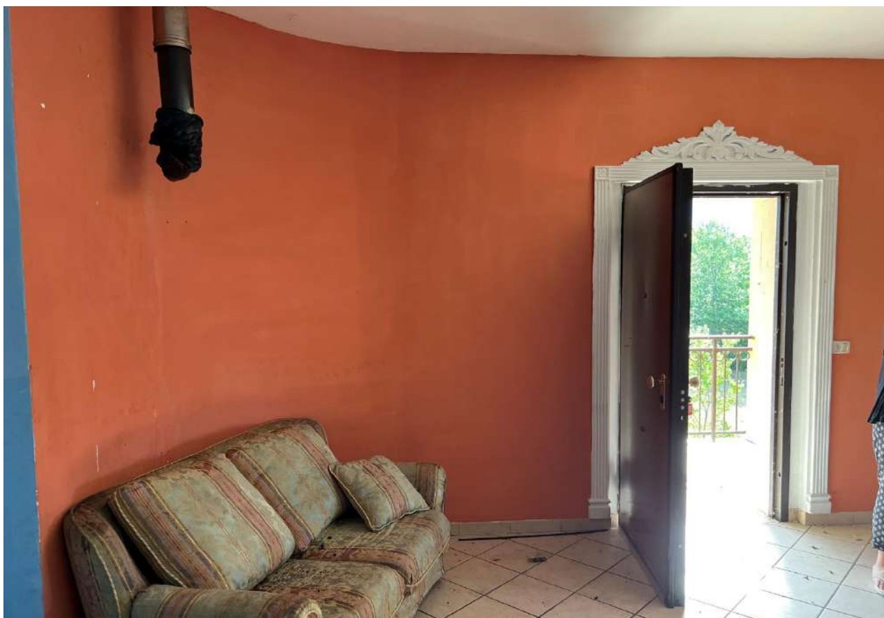
FOTO 8: Veduta interna vano soggiorno angolo cottura Lotto 1, Corpo A-piano primo