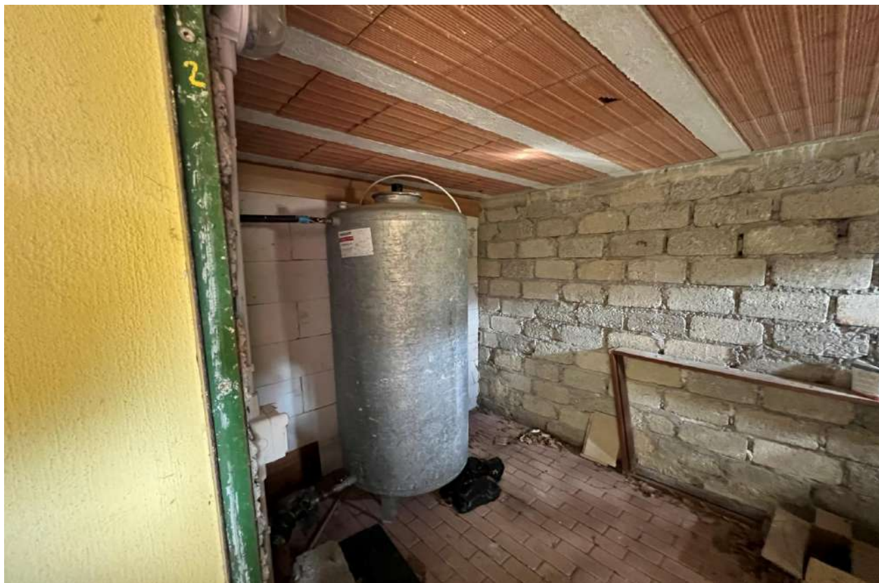
FOTO 13: Veduta interna vano cantina di pertinenza Lotto 3, Corpo A-piano terra