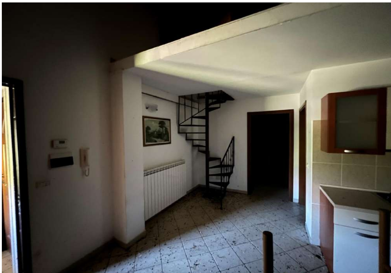
FOTO 16: Veduta interna vano soggiorno/angolo cottura Lotto 2, Corpo A-piano terra