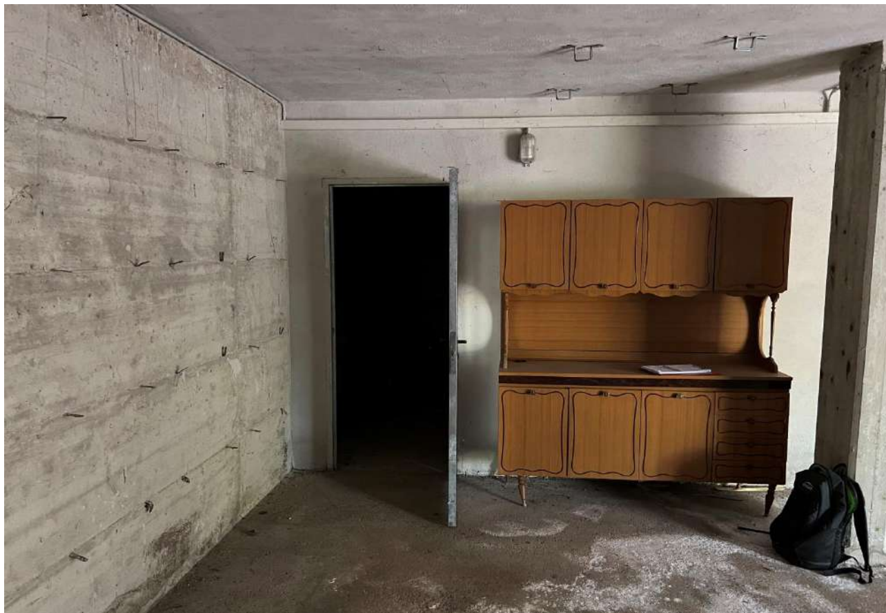
FOTO 21: Veduta interna garage censito al sub. 14 Lotto 1 corpo B piano terra