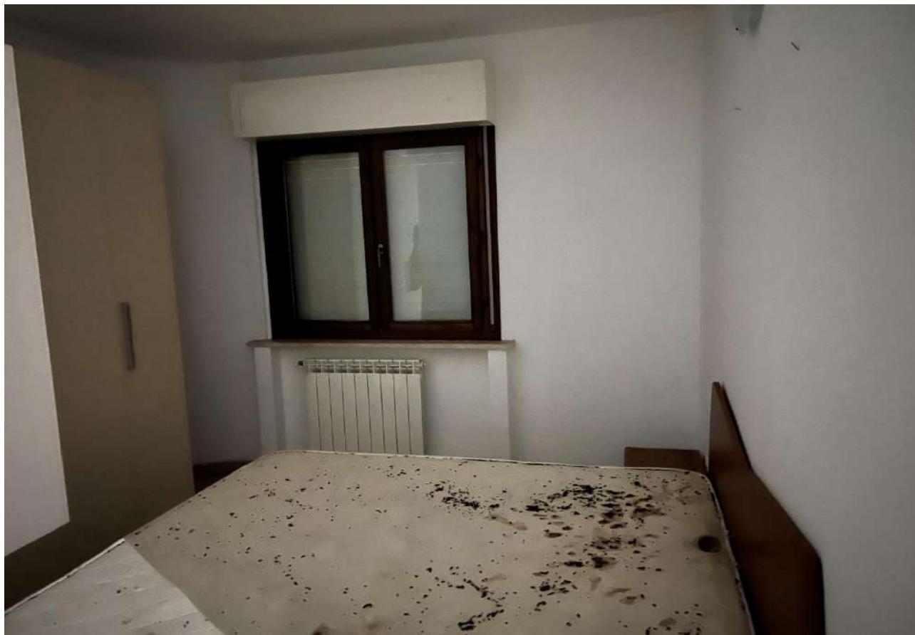
FOTO 17: Veduta interna vano camera da letto Lotto 2, Corpo A-piano terra