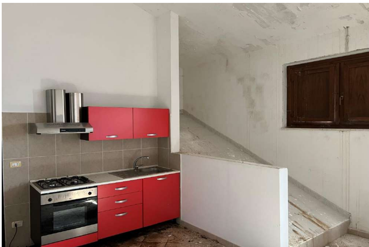
FOTO 12: Veduta interna vano soggiorno/angolo cottura Lotto 3, Corpo A-piano secondo