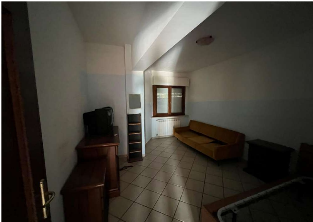
FOTO 11: Veduta interna vano camera da letto Lotto 3, Corpo A-piano secondo