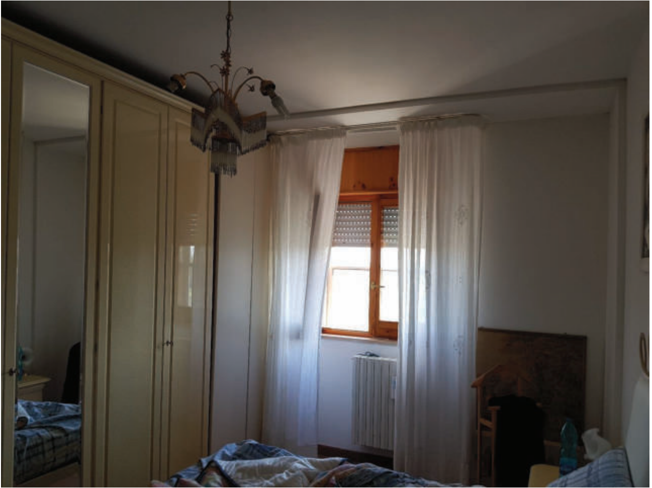
Fg 43 particella 503 sub 33 Interno