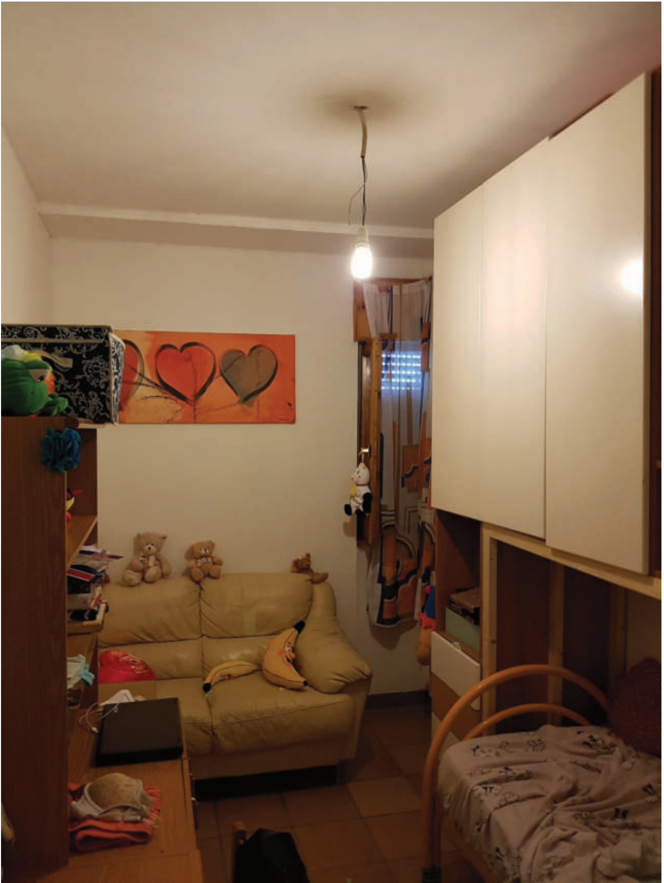
Fg 43 particella 503 sub 33 Interno