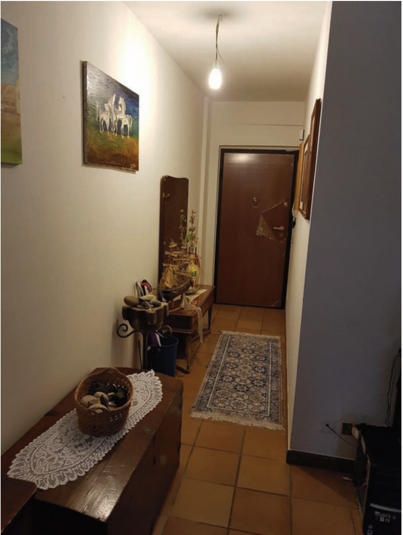
Fg 43 particella 503 sub 33 Interno