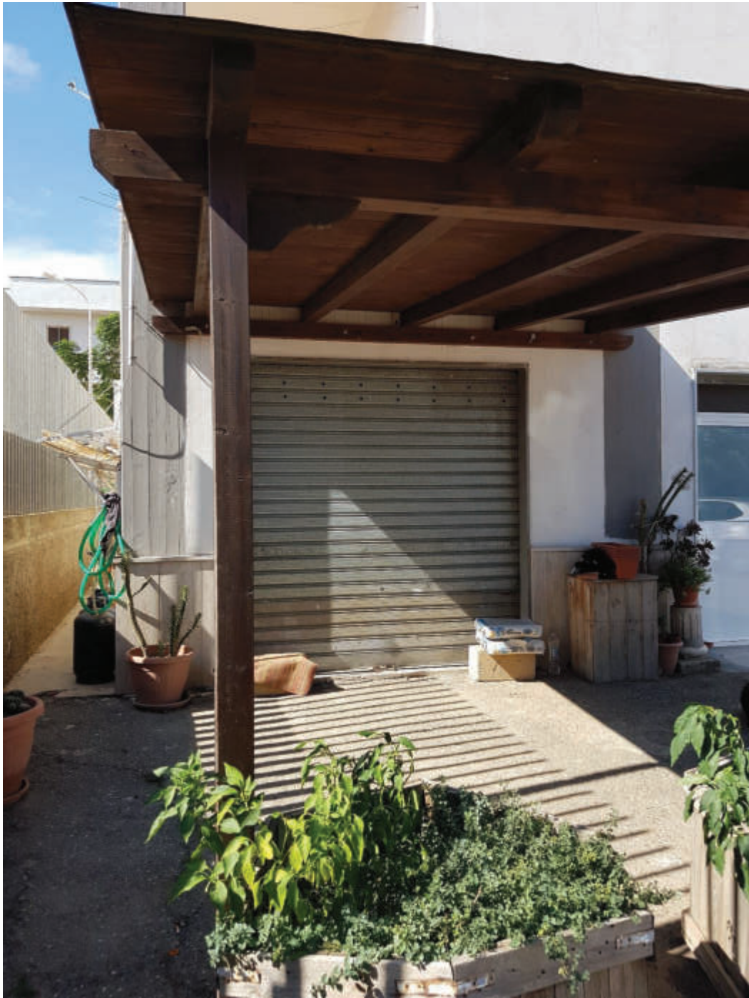
Autorimessa Fg 43 particella 503 sub 34