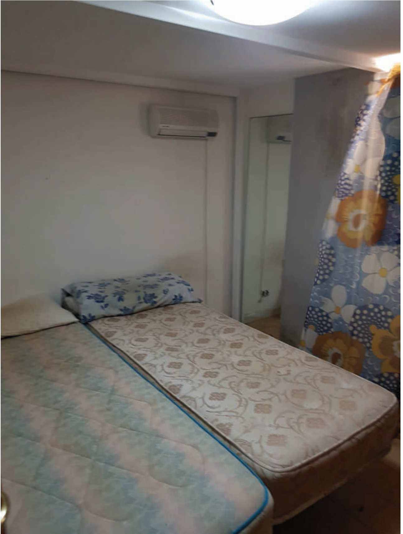
Fg 43 particella 503 sub 34 Autorimessa – interno