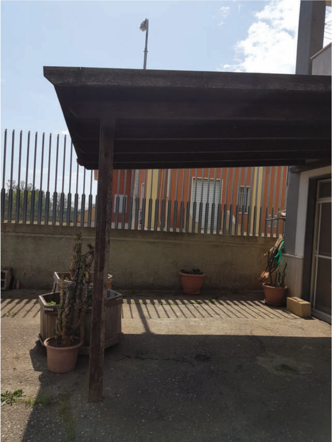
Fig 43 particella 503 sub 34 Autorimessa – tettoia