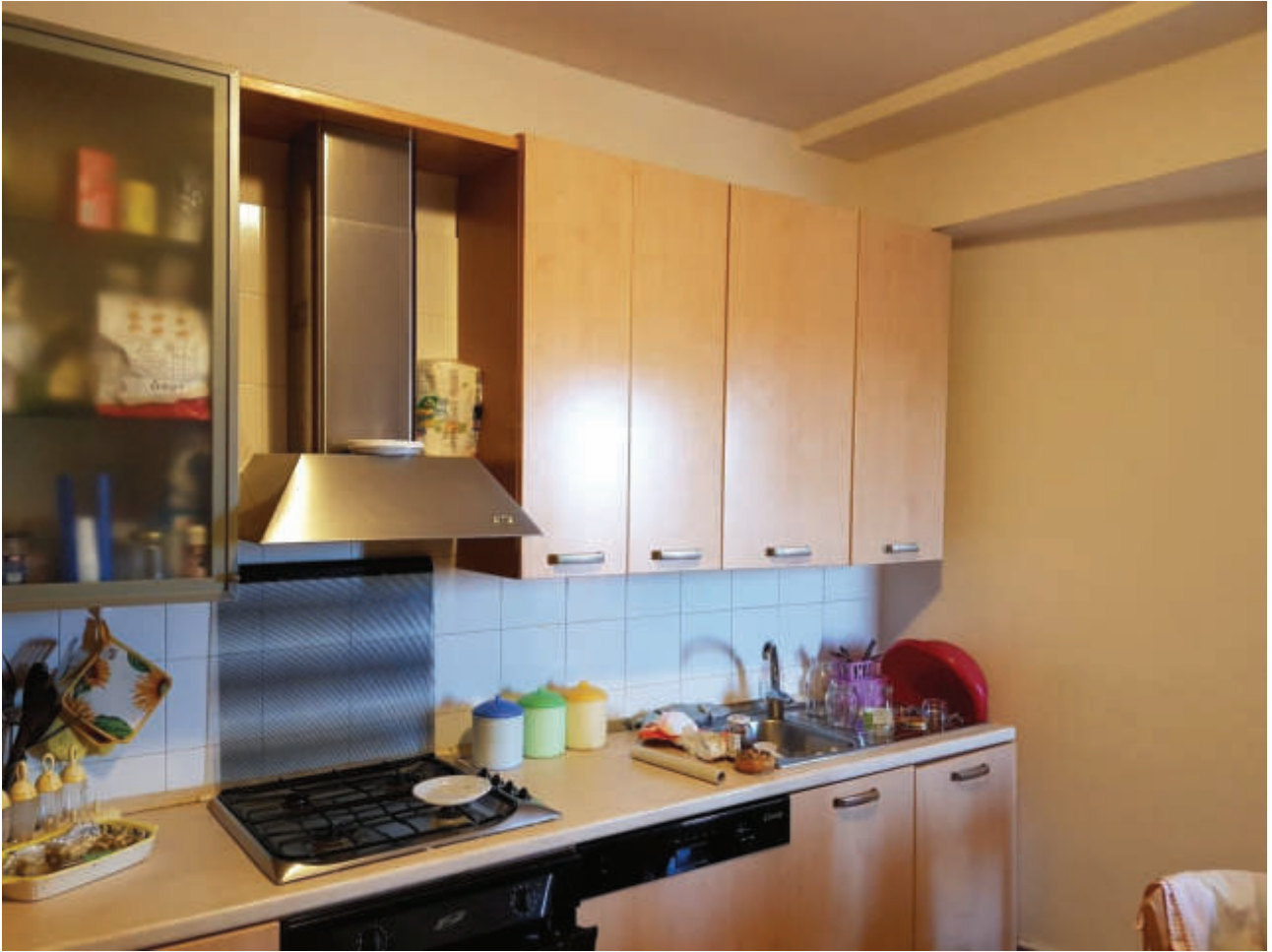
Fg 43 particella 503 sub 33 Interno