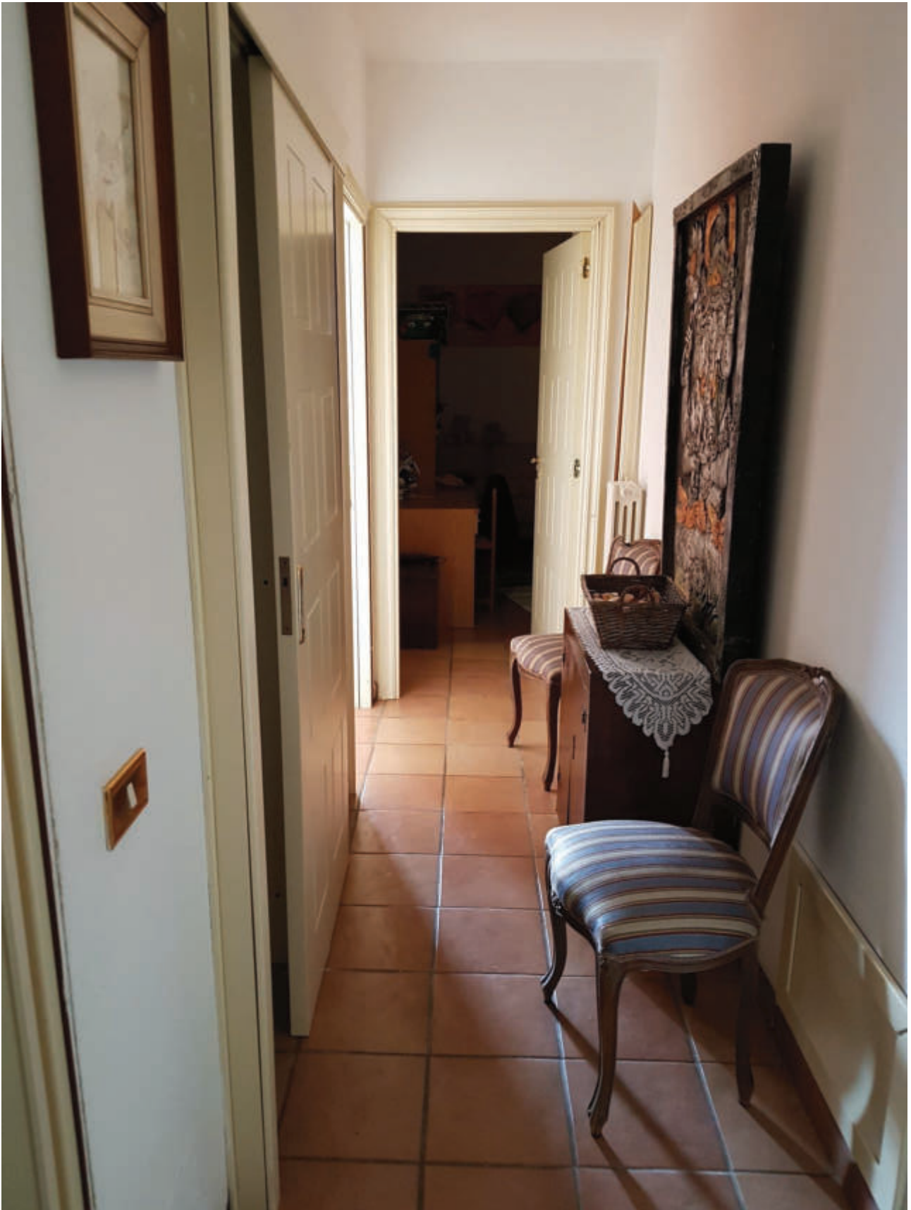
Fg 43 particella 503 sub 33 Interno