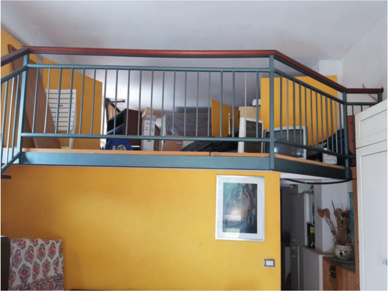
Fg 43 particella 503 sub 34 Autorimessa – soppalco interno