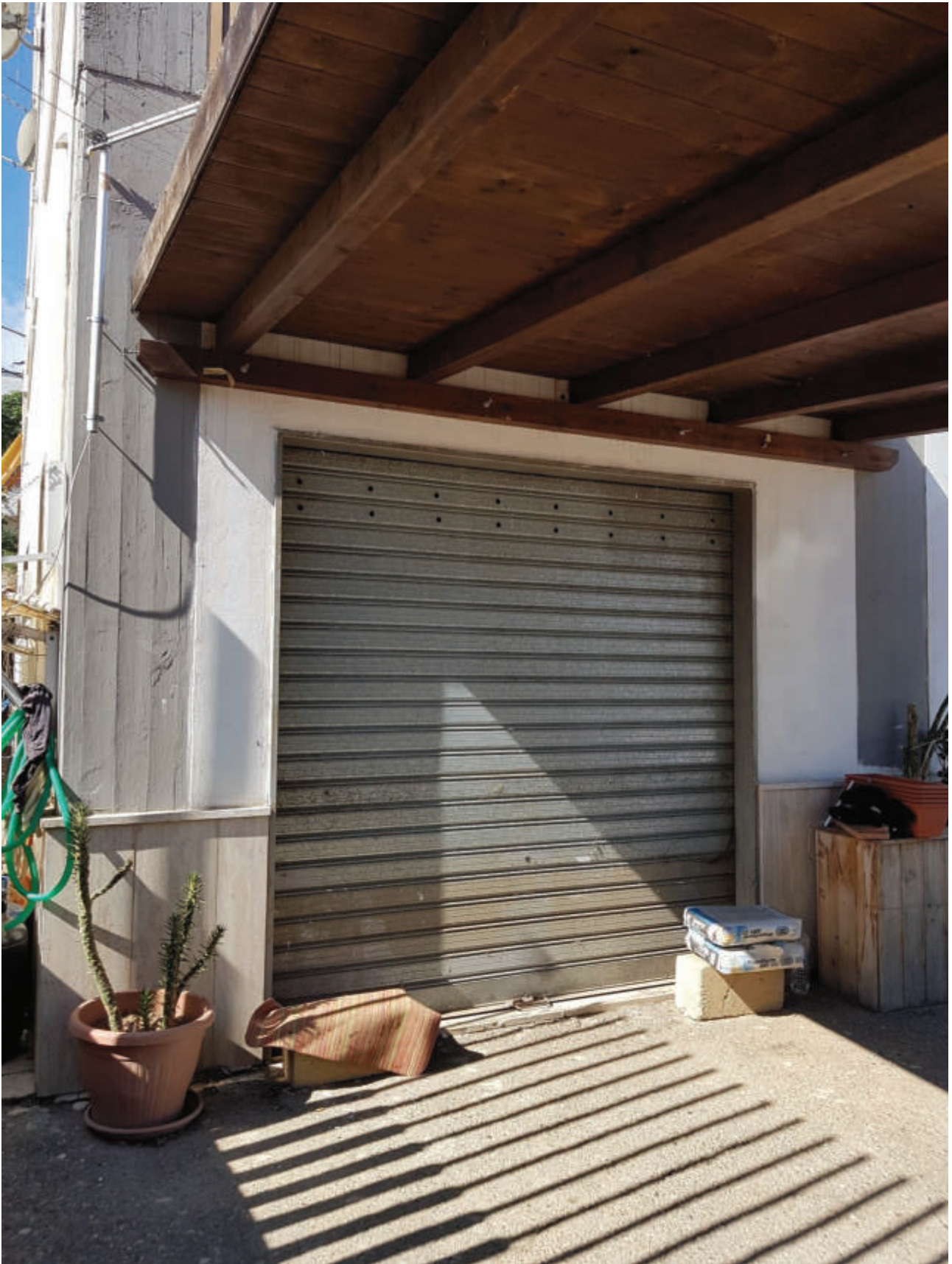
Fg 43 particella 503 sub 34 Autorimessa