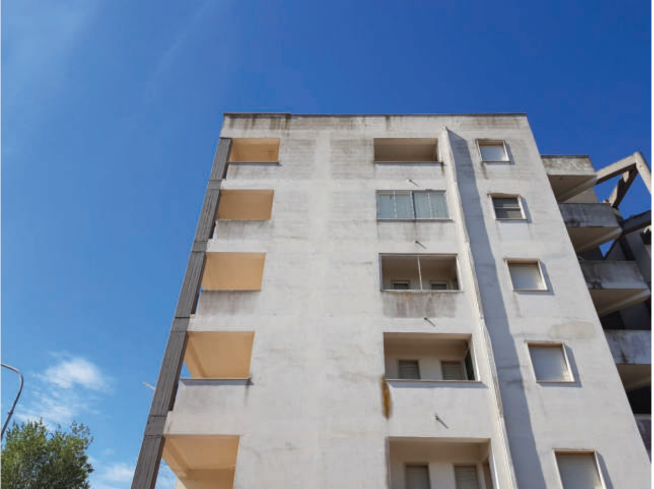
Fg 43 particella 503 sub 33 Prospetto esterno

Comune di Bernalda Fg 43 Particella 503 sub 33 e 34