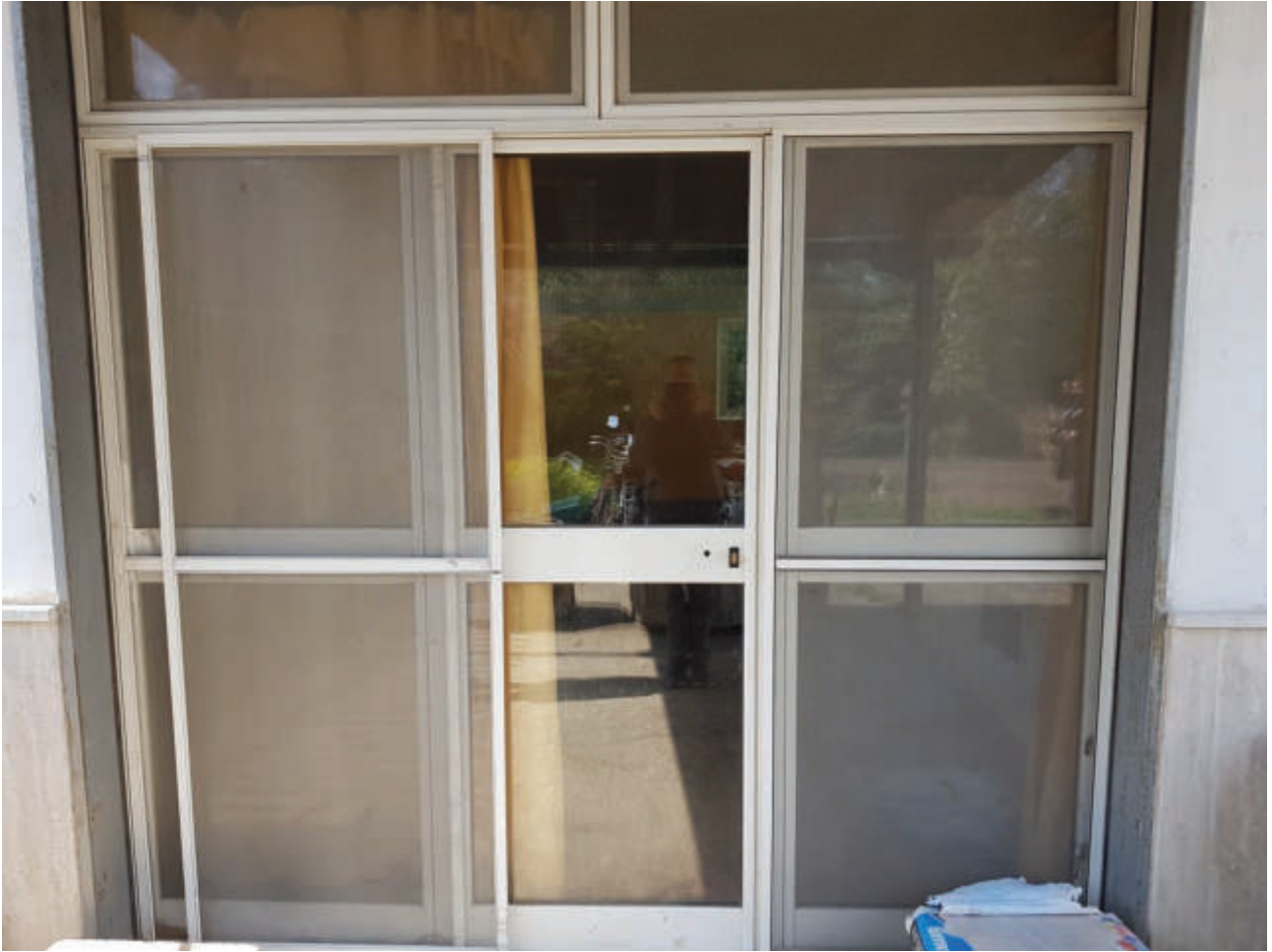
Fg 43 particella 503 sub 34 Autorimessa – ingresso