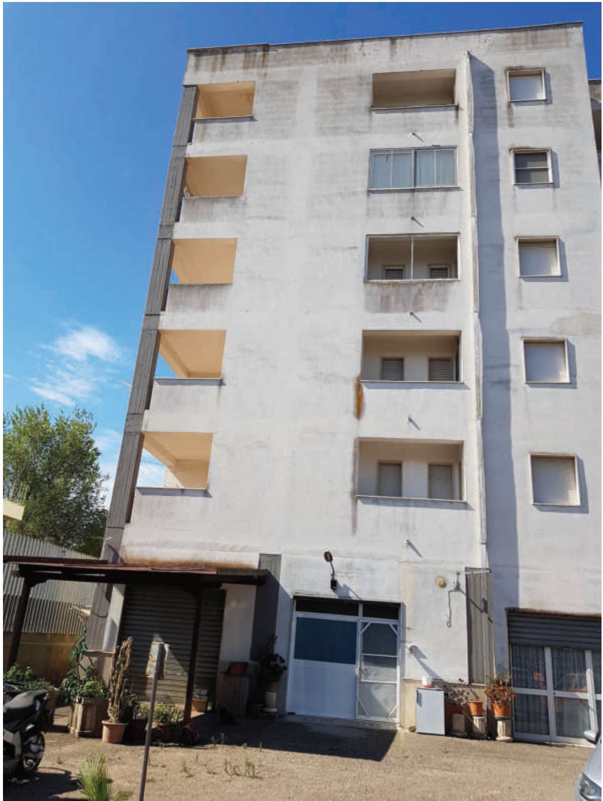
Fg 43 particella 503 sub 33 - 34 Prospetto esterno