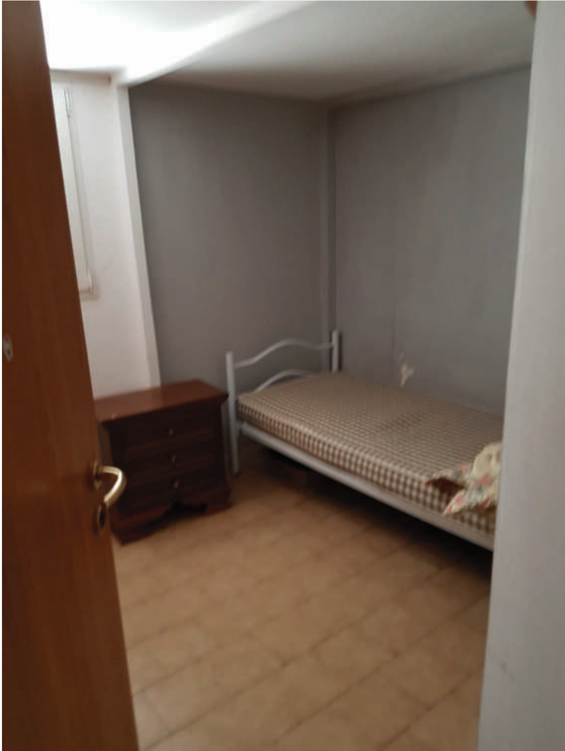
Fg 43 particella 503 sub 34 Autorimessa – interno