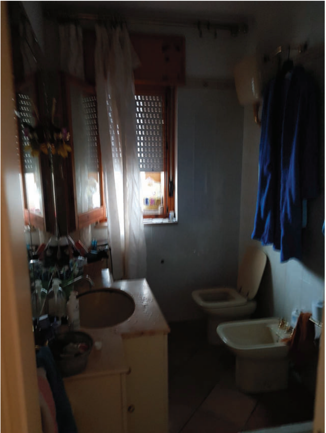
Fg 43 particella 503 sub 33 Interno