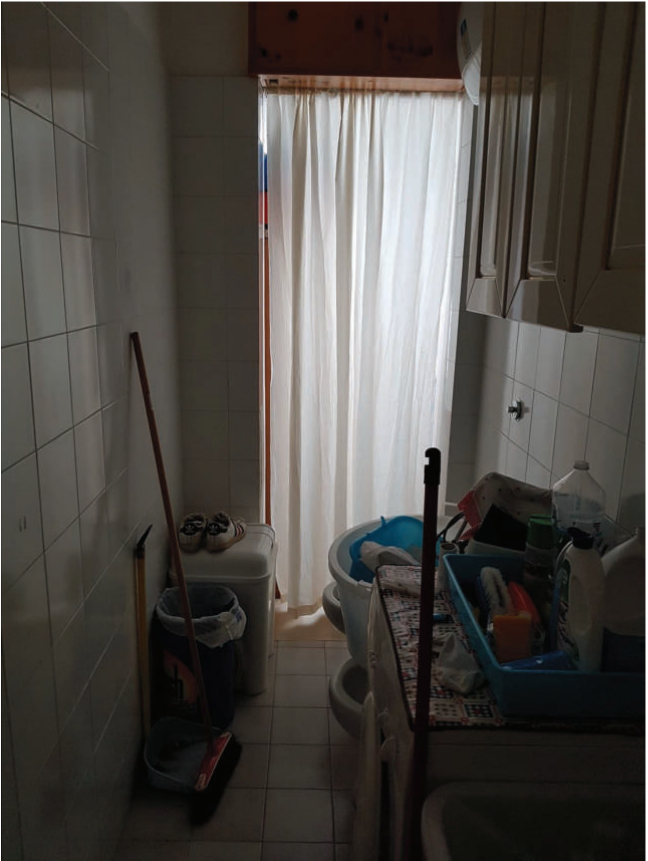
Fg 43 particella 503 sub 33 Interno