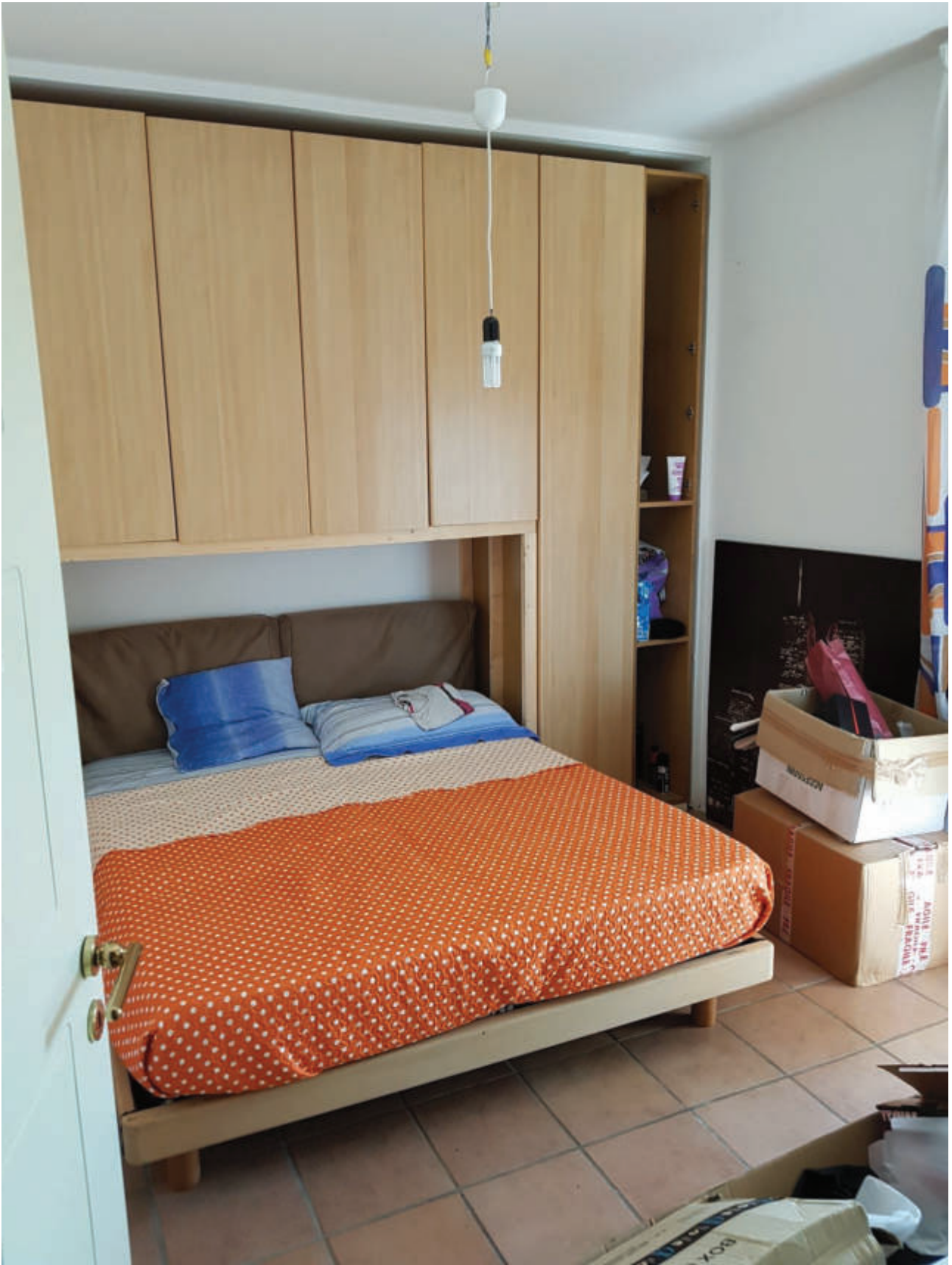
Fg 43 particella 503 sub 33 Interno