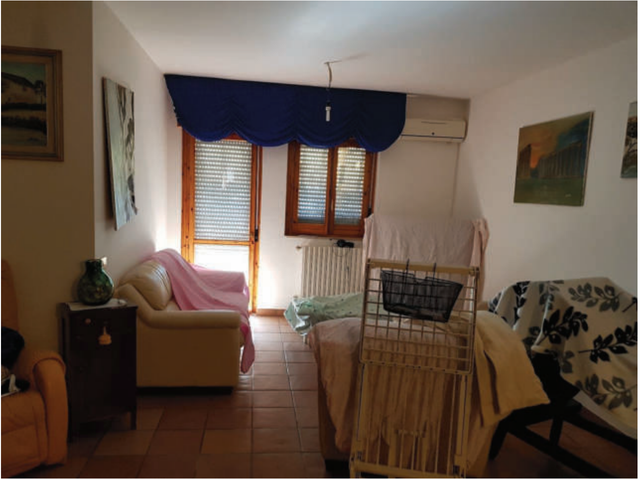
Fg 43 particella 503 sub 33 Interno