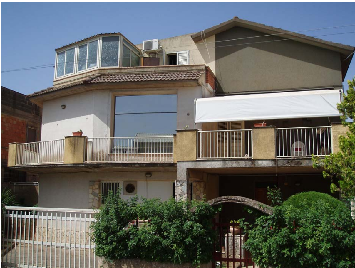
Foto n. 1 - Vista esterna del fabbricato sito a Caltagirone in via Tito Livio n. 22, di cui fa parte l'appartamento oggetto di pignoramento censito al Catasto Fabbr. al foglio 109, part. 712, sub 2, piano 1