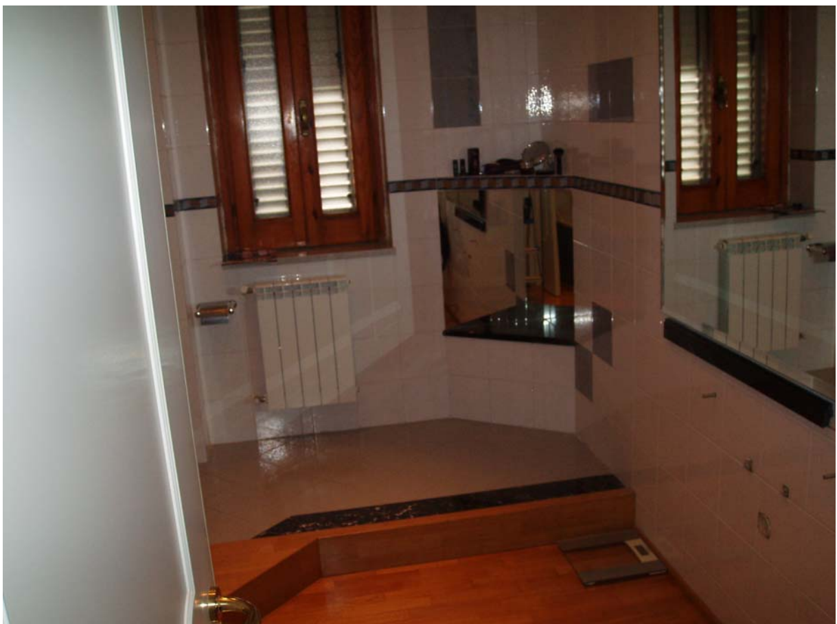
Foto n. 14 - Vista interna dell'appartamento oggetto di pignoramento censito al Catasto Fabbricati al foglio 109, part. 712, sub 2