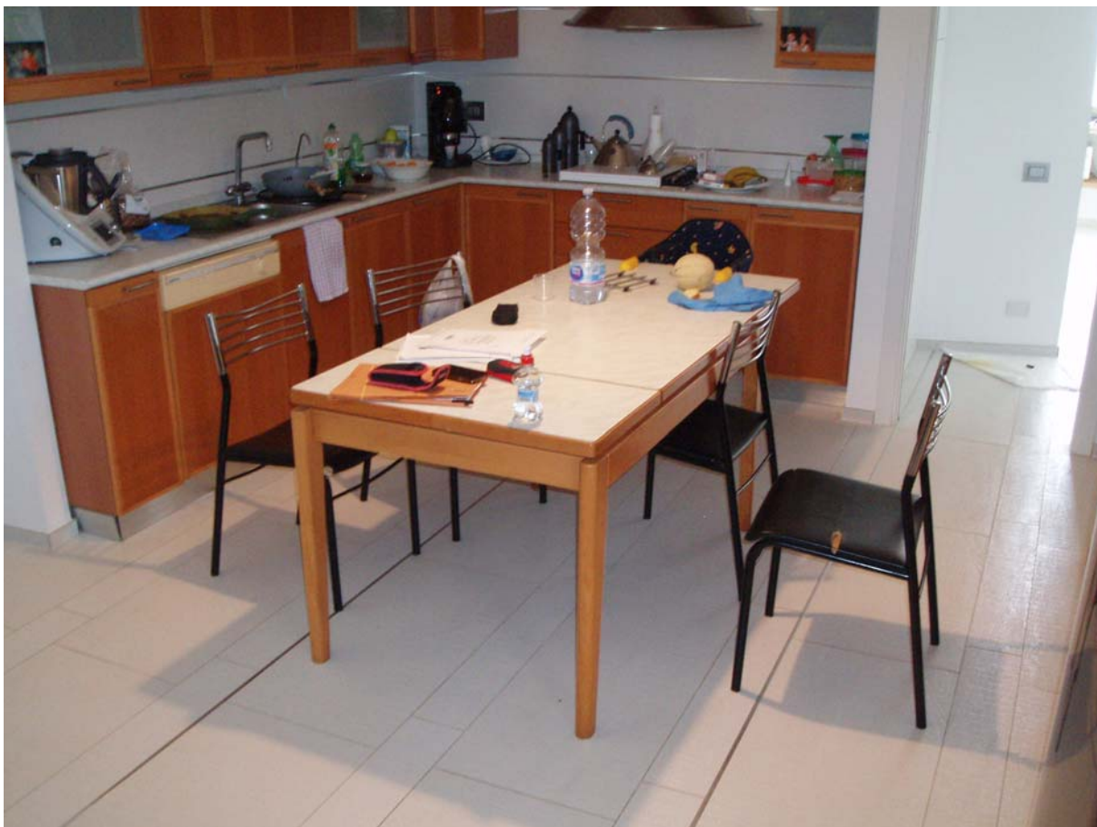
Foto n. 7 - Vista interna dell'appartamento oggetto di pignoramento censito al Catasto Fabbricati al foglio 109, part. 712, sub 2