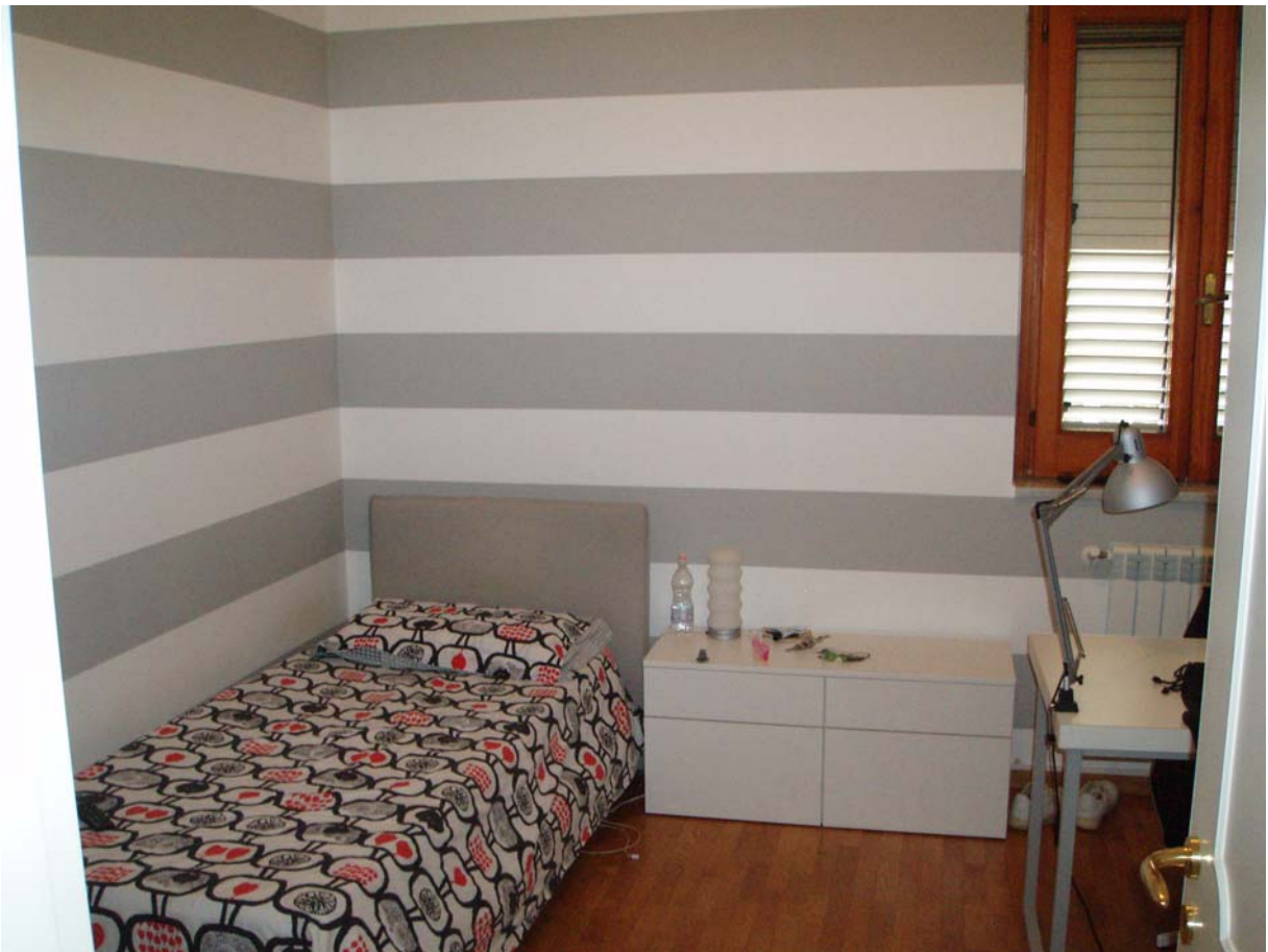
Foto n. 9 - Vista interna dell'appartamento oggetto di pignoramento censito al Catasto Fabbricati al foglio 109, part. 712, sub 2