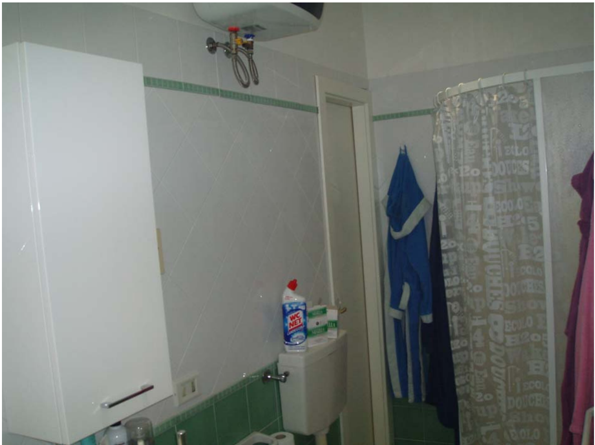
Foto n. 13 - Vista interna dell'appartamento oggetto di pignoramento censito al Catasto Fabbricati al foglio 109, part. 712, sub 2