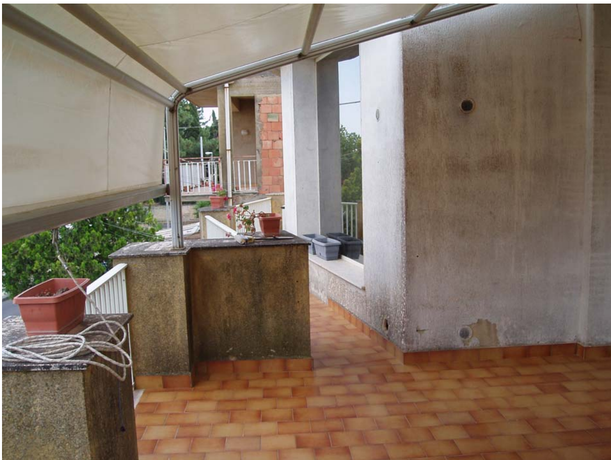
Foto n. 19 - Vista dell'appartamento oggetto di pignoramento censito al Catasto Fabbricati al foglio 109, part. 712, sub 2