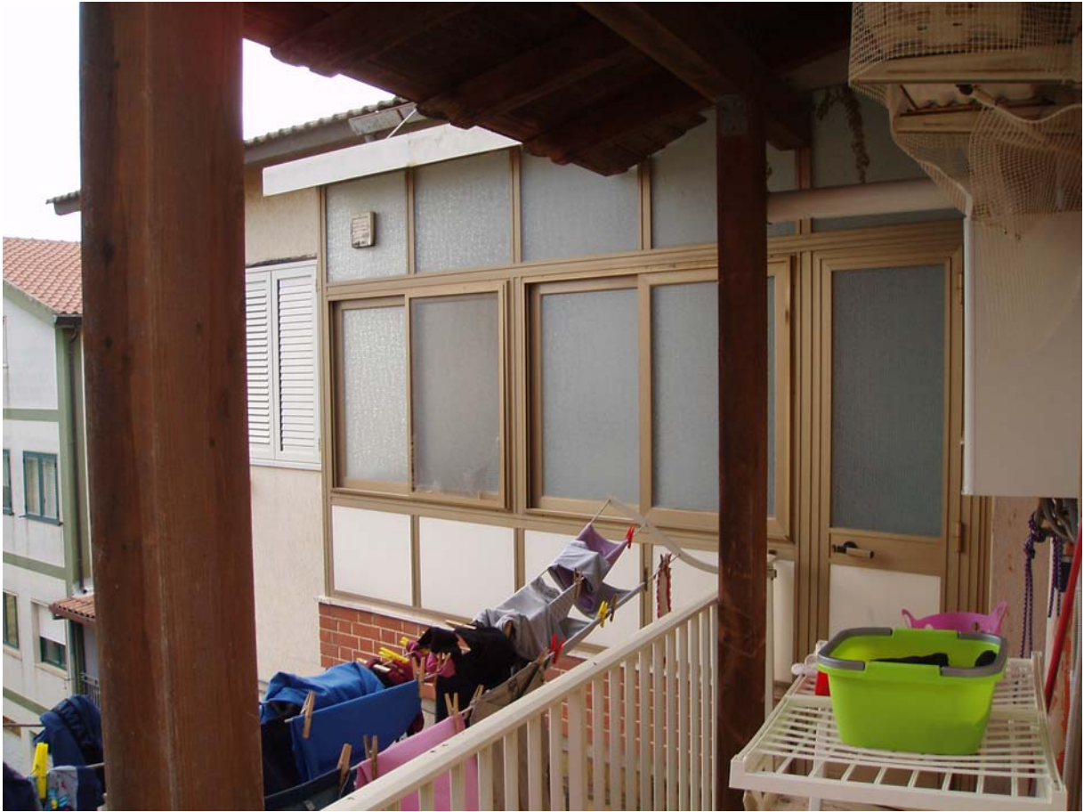
Foto n. 17 - Vista dell'appartamento oggetto di pignoramento censito al Catasto Fabbricati al foglio 109, part. 712, sub 2