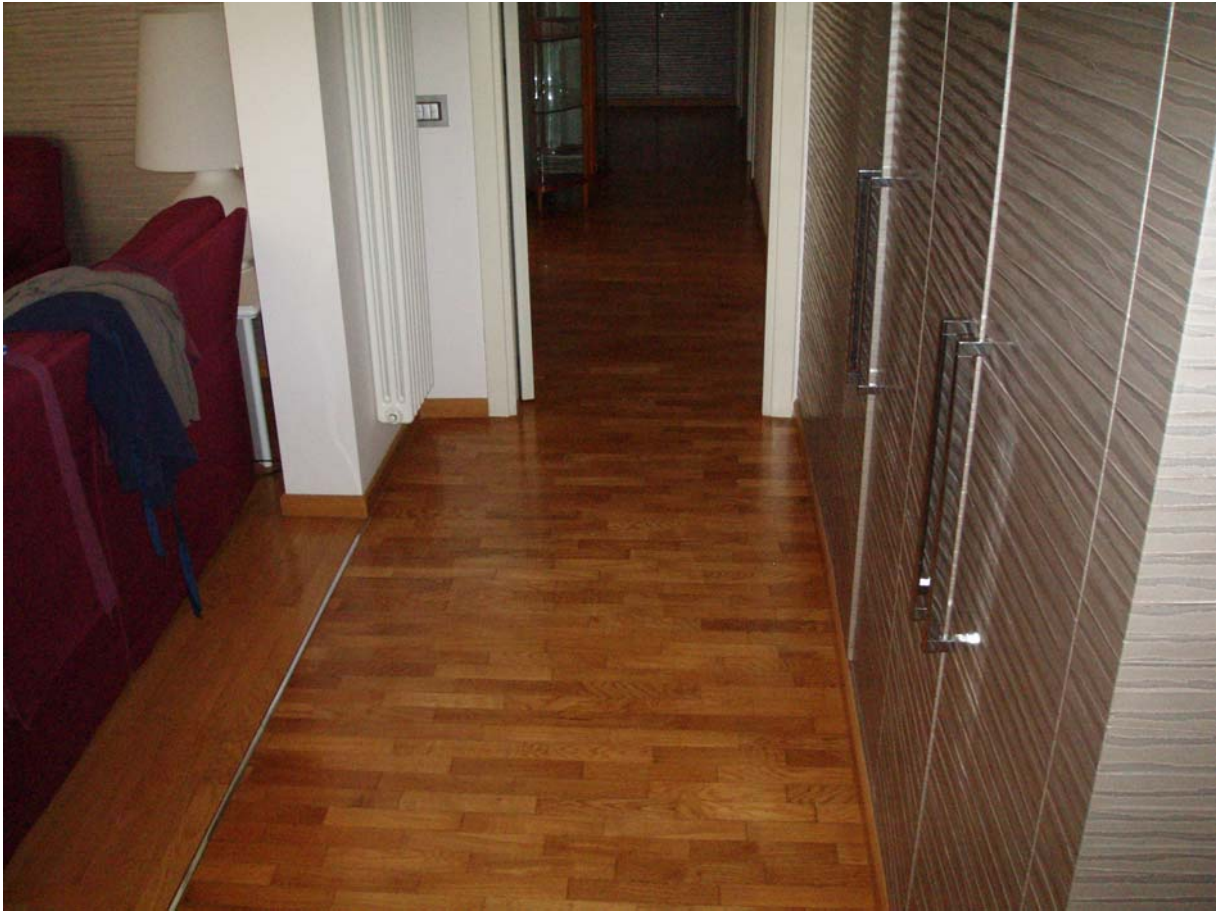
Foto n. 5 - Vista interna dell'appartamento oggetto di pignoramento censito al Catasto Fabbricati al foglio 109, part. 712, sub 2