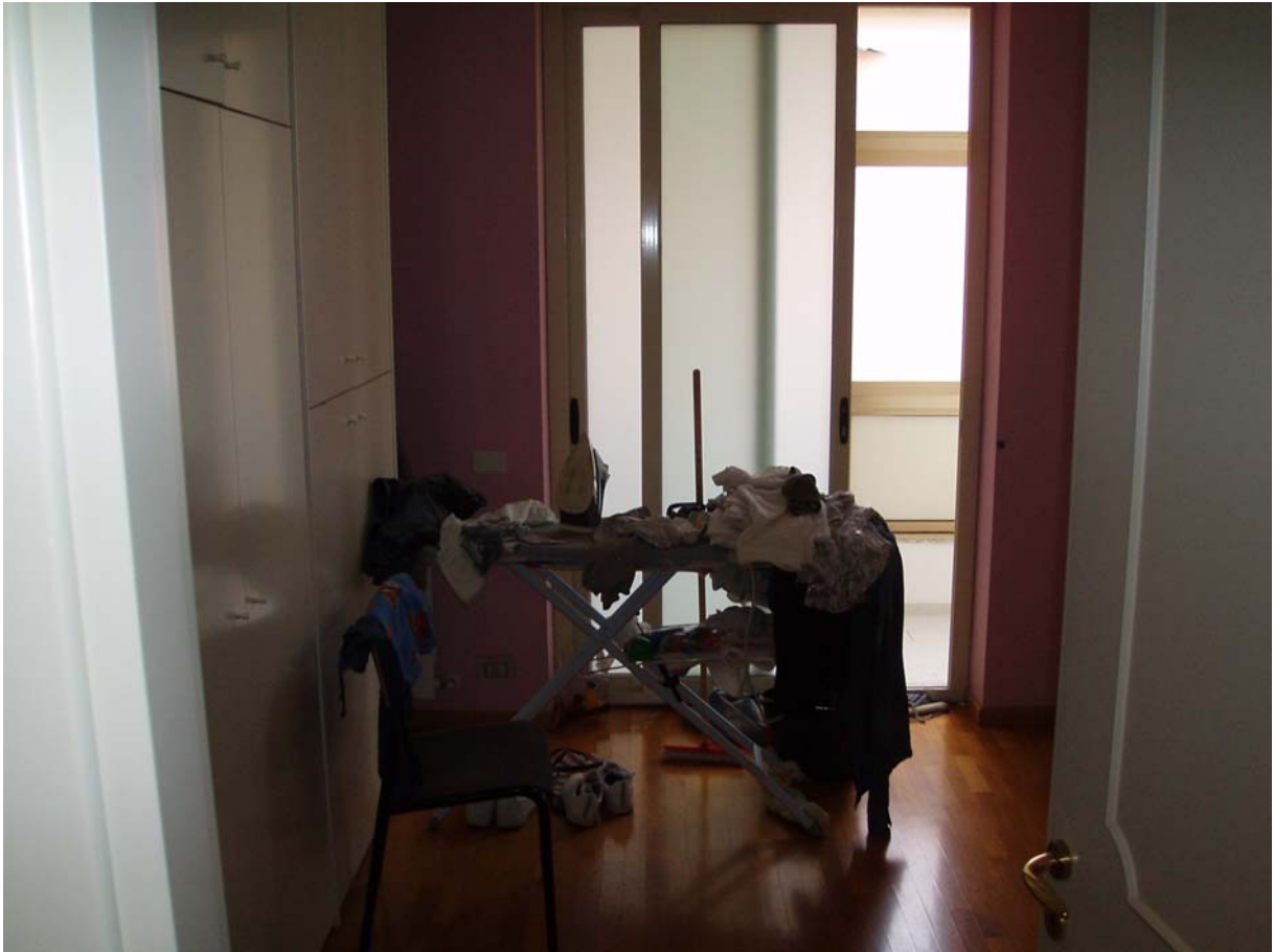
Foto n. 15 - Vista interna dell'appartamento oggetto di pignoramento censito al Catasto Fabbricati al foglio 109, part. 712, sub 2