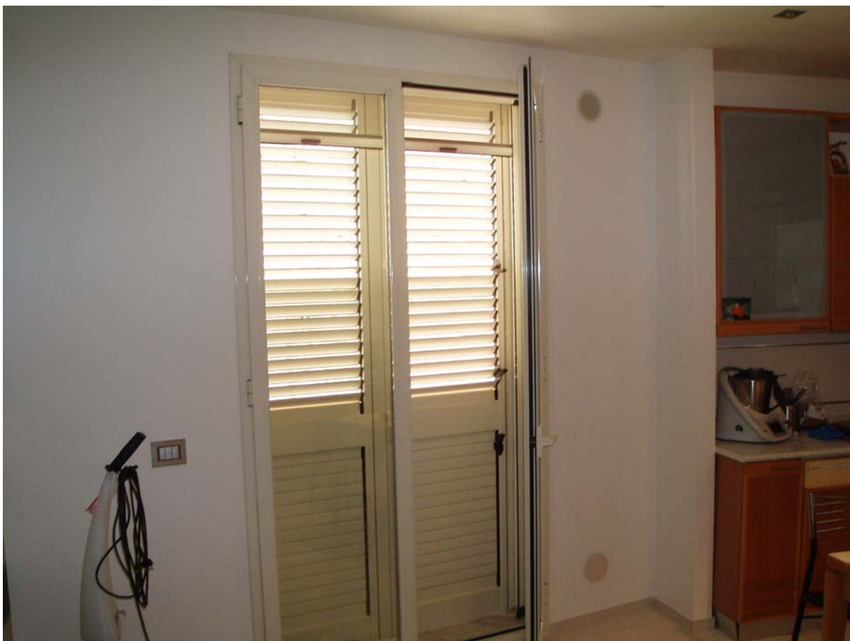
Foto n. 8 - Vista interna dell'appartamento oggetto di pignoramento censito al Catasto Fabbricati al foglio 109, part. 712, sub 2