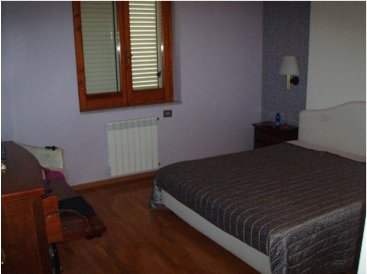
Foto n. 11 - Vista interna dell'appartamento oggetto di pignoramento censito al Catasto Fabbricati al foglio 109, part. 712, sub 2