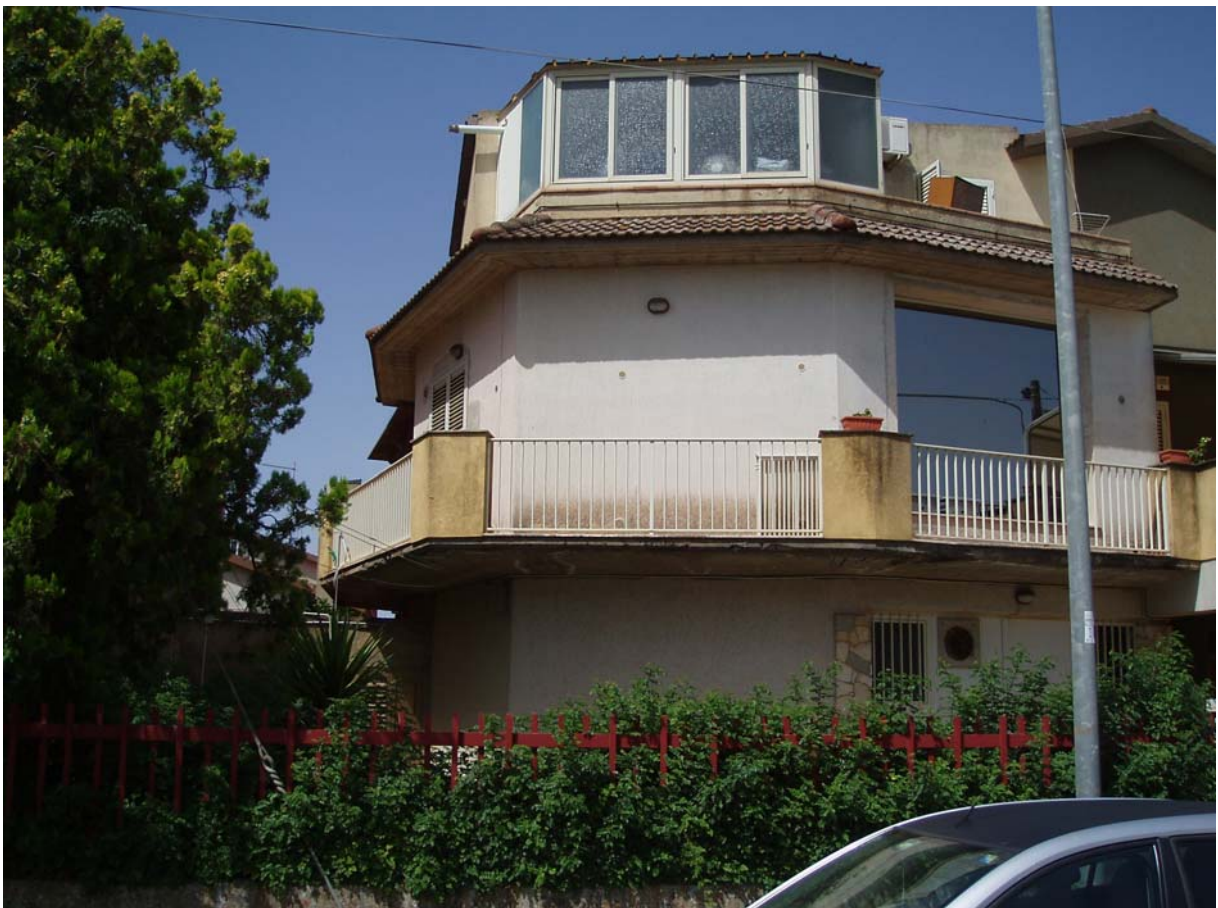
Foto n. 4 - Vista esterna del fabbricato sito a Caltagirone in via Tito Livio n. 22, di cui fa parte l'appartamento oggetto di pignoramento censito al Catasto Fabbr. al foglio 109, part. 712, sub 2, piano 1