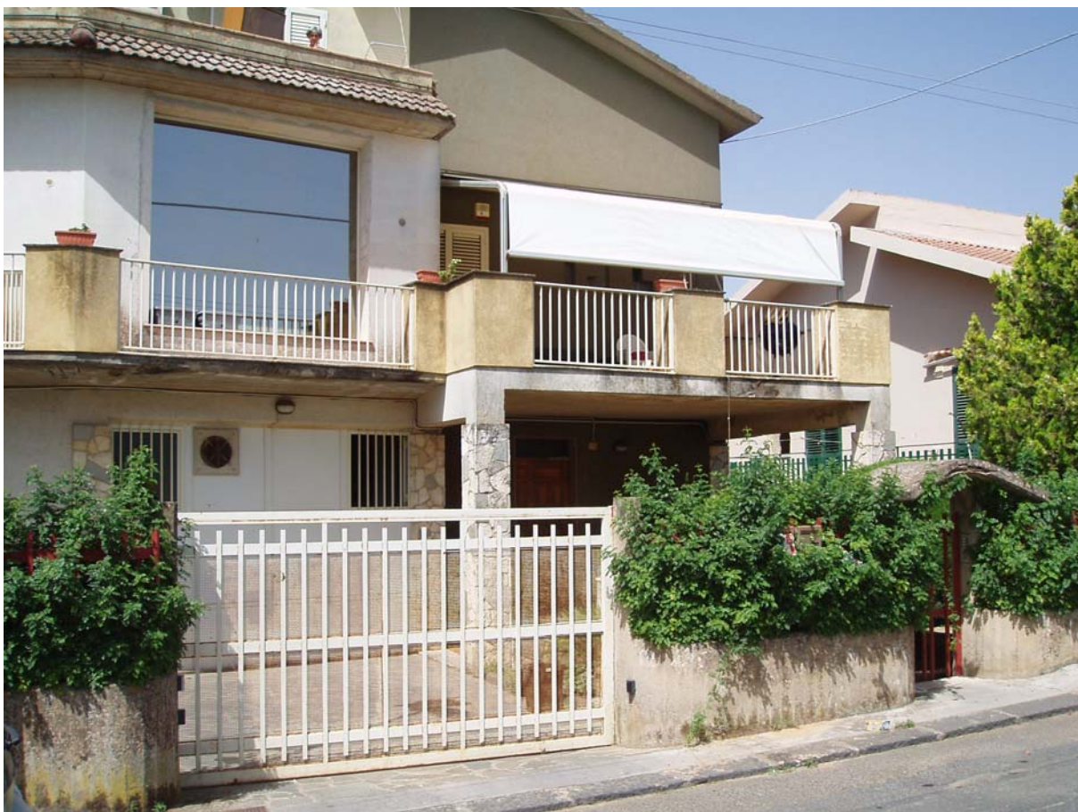
Foto n. 2 - Vista esterna del fabbricato sito a Caltagirone in via Tito Livio n. 22, di cui fa parte l'appartamento oggetto di pignoramento censito al Catasto Fabbr. al foglio 109, part. 712, sub 2, piano 1