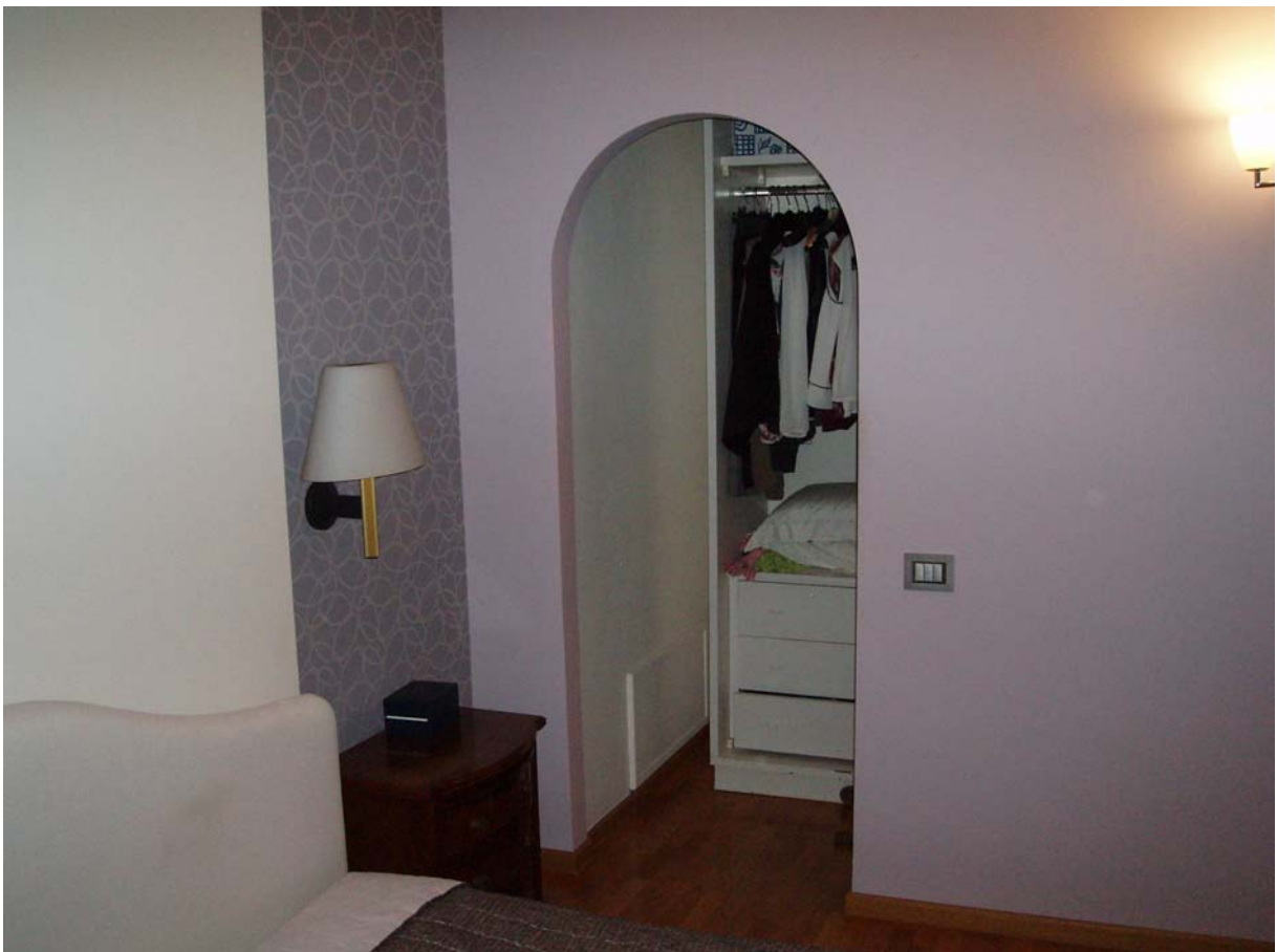
Foto n. 12 - Vista interna dell'appartamento oggetto di pignoramento censito al Catasto Fabbricati al foglio 109, part. 712, sub 2