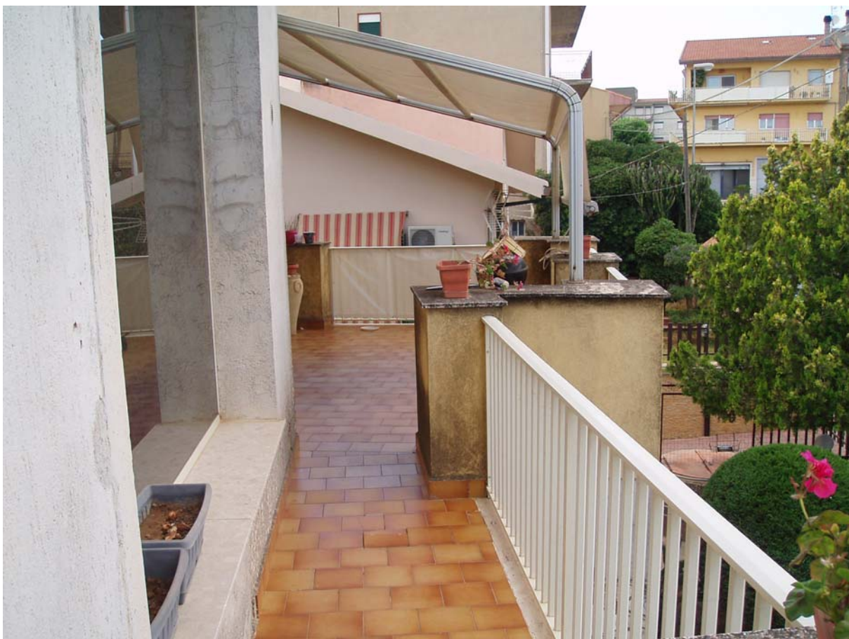
Foto n. 20 - Vista dell'appartamento oggetto di pignoramento censito al Catasto Fabbricati al foglio 109, part. 712, sub 2