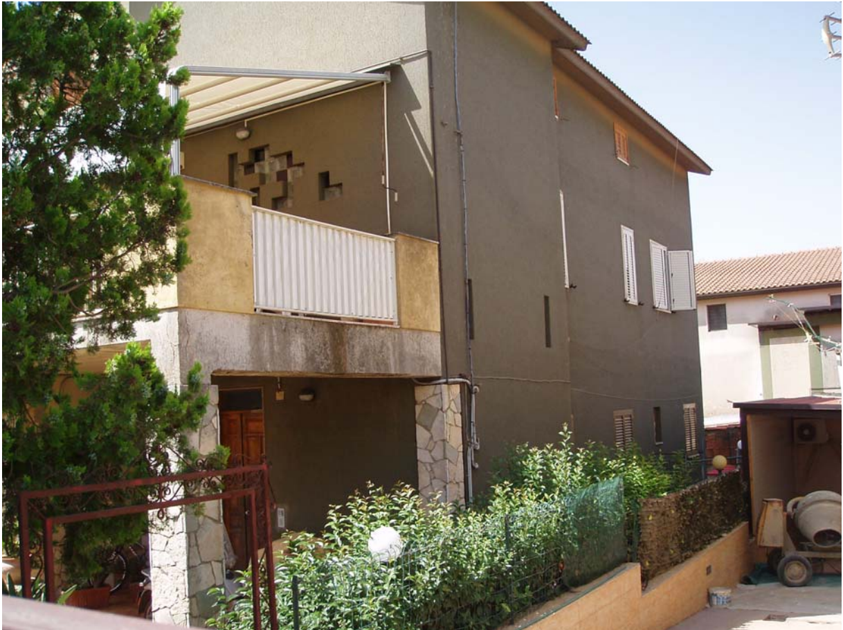
Foto n. 3 - Vista esterna del fabbricato sito a Caltagirone in via Tito Livio n. 22, di cui fa parte l'appartamento oggetto di pignoramento censito al Catasto Fabbr. al foglio 109, part. 712, sub 2, piano 1