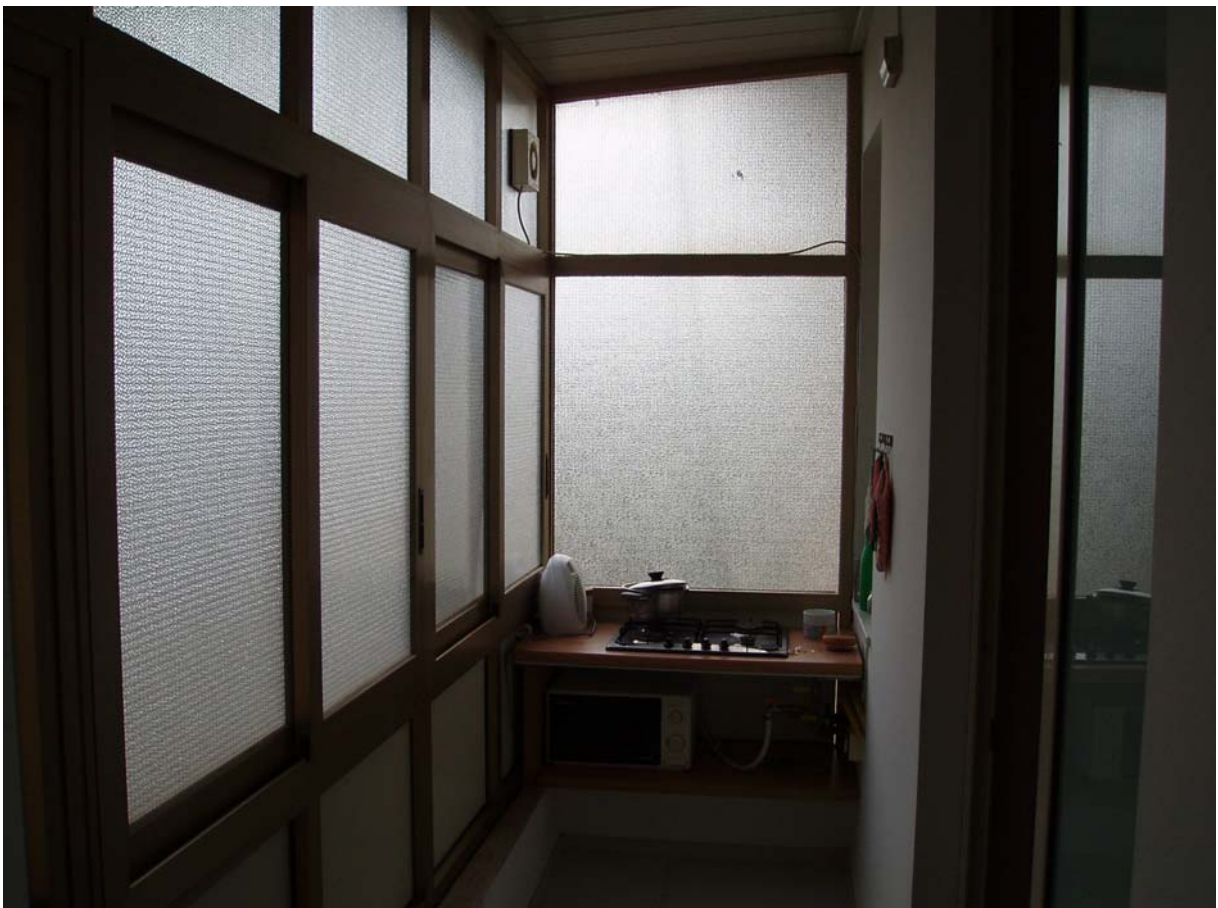
Foto n. 16 - Vista interna dell'appartamento oggetto di pignoramento censito al Catasto Fabbricati al foglio 109, part. 712, sub 2