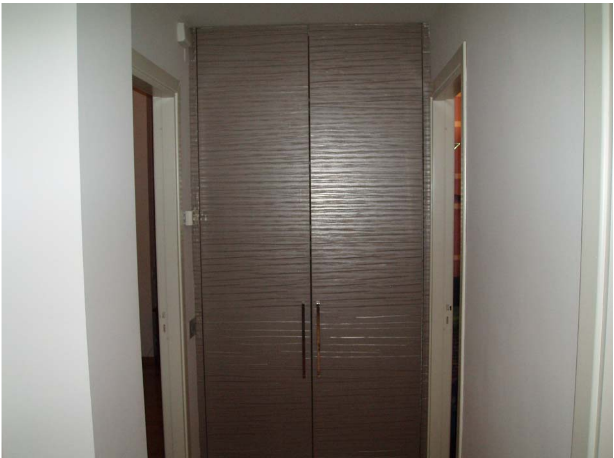
Foto n. 18 - Vista interna dell'appartamento oggetto di pignoramento censito al Catasto Fabbricati al foglio 109, part. 712, sub 2