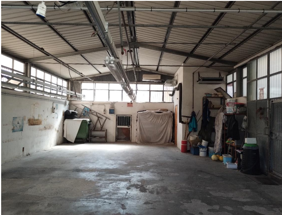
PIANO T. : LABORATORIO S U B. 22 ( VISTA INTERNA LATO SUD )