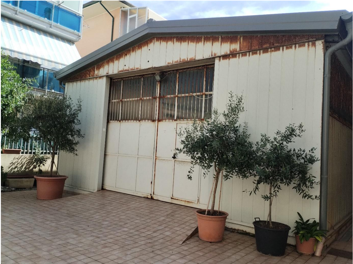
PIANO T. : LABORATORIO S U B . 2 2 ( accesso tramite corte comune da via Ancona )

Fig. 24 part 468 sub 22 consistenza 113 metri quadri Piano T