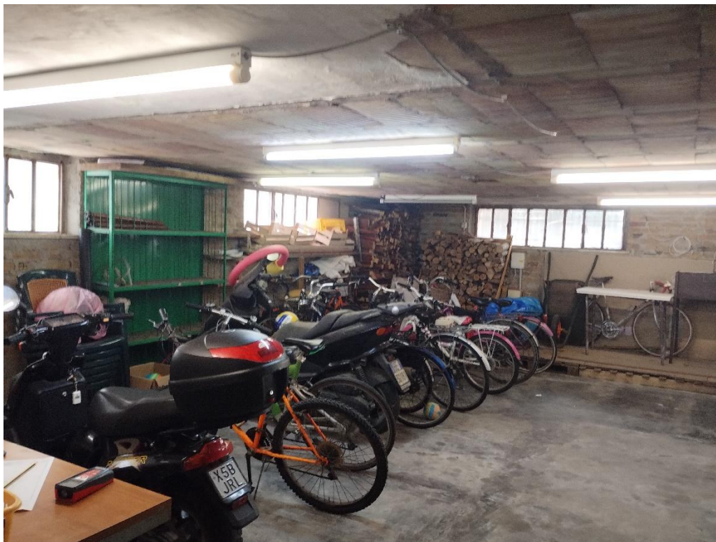
- PIANO S1. : MAGAZZINO/DEPOSITO- SUB.21 – LOTTO 2