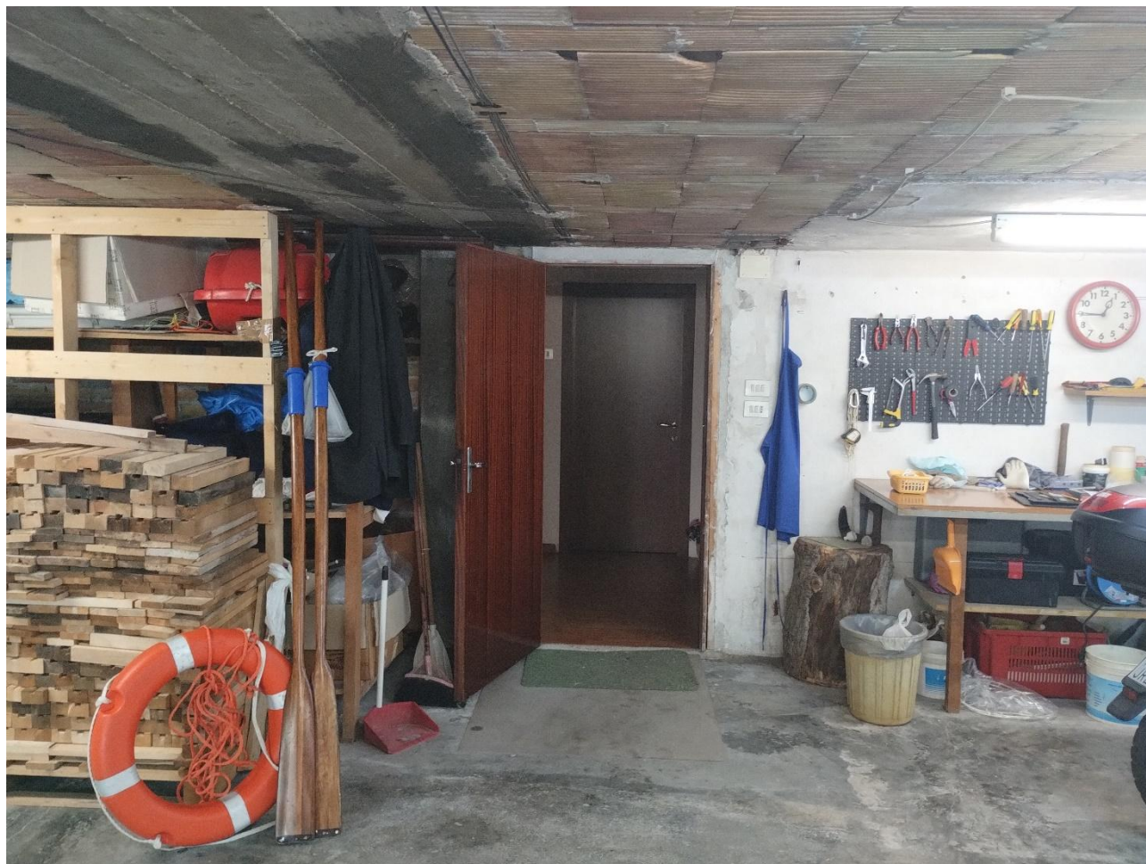
- PIANO S1 : MAGAZZINO /DEPOSITO - SUB.21 – LOTTO 2 VISIBILE ACCESSO DAL VANO SCALA CONDOMINIALE