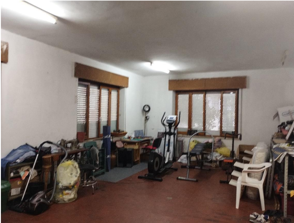
- PIANO TERRA (RIALZATO) : LABORATORIO – SUB.13 – LOTTO 1