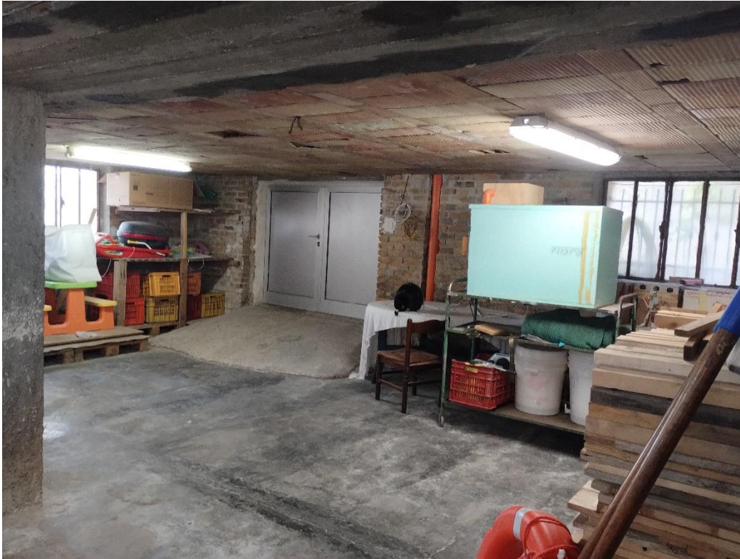
- PIANO S1. : MAGAZZINO/DEPOSITO- SUB.21 – LOTTO 2 VISIBILE ACCESSO SUL LATO EST DALLA CORTE COMUNE