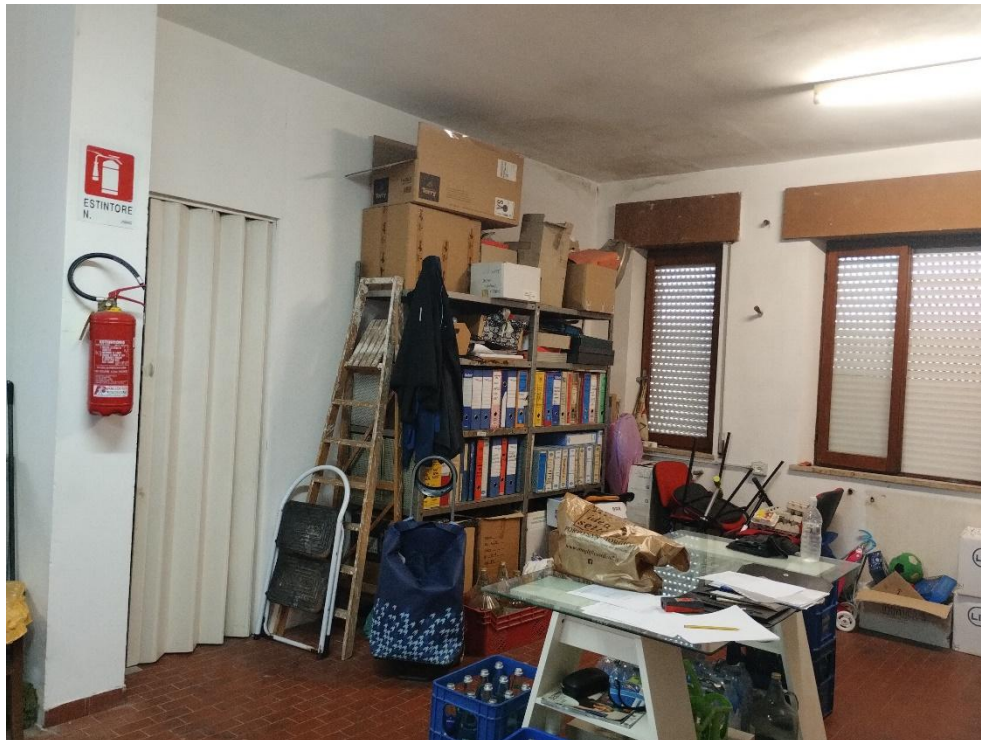
PIANO TERRA ( RIALZATO) : LABORATORIO – SUB. 13 – LOTTO 1