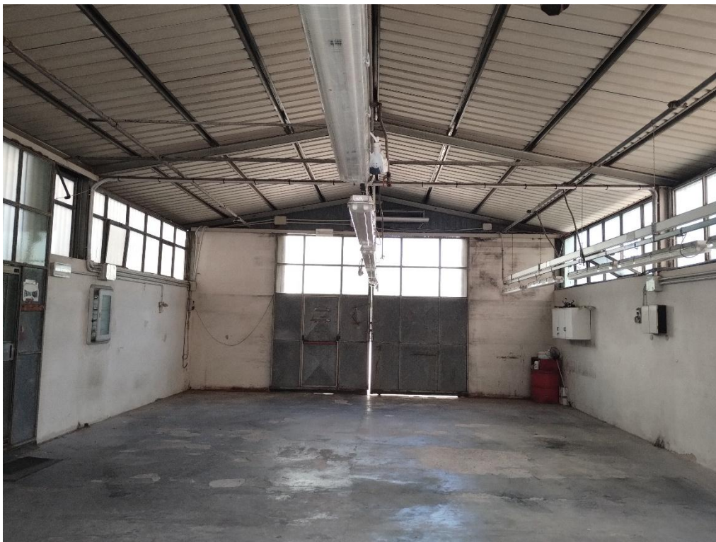
PIANO T. : LABORATORIO S U B. 22 ( VISTA INTERNA LATO NORD )