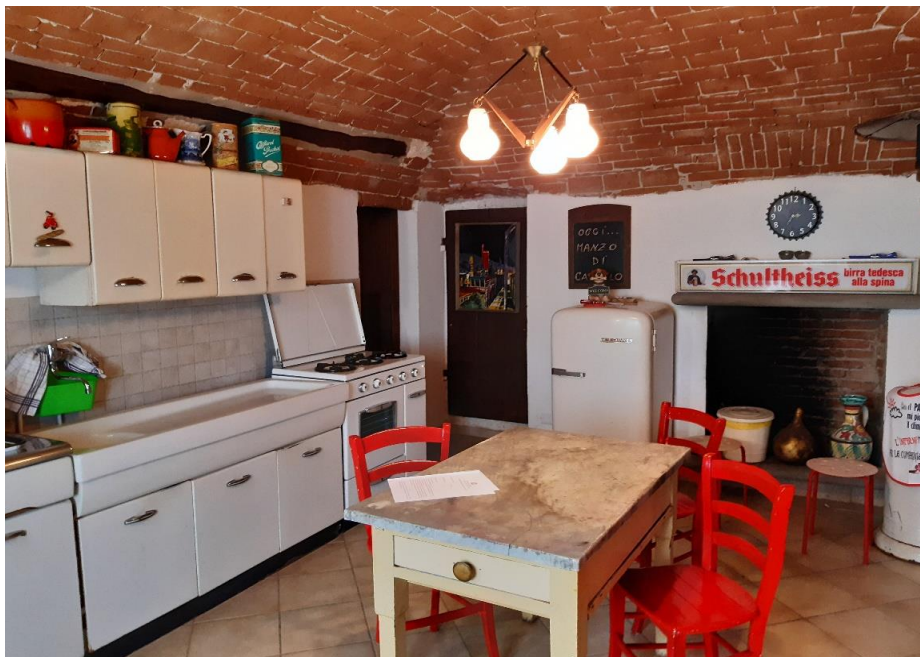
Cucina/pranzo - PT