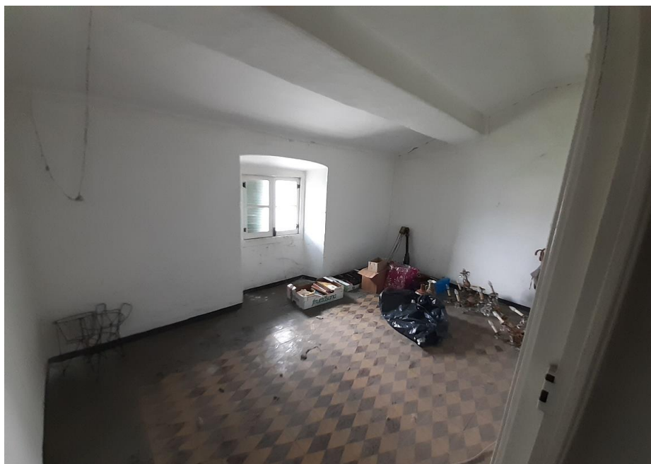
Locali al piano secondo