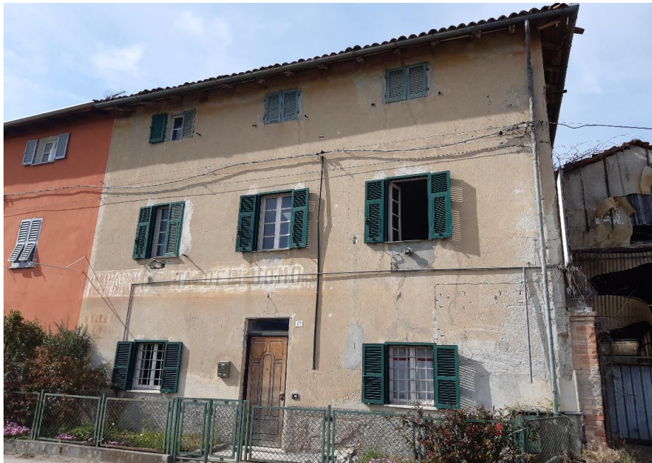
Vista generale dell'abitazione dal fronte strada