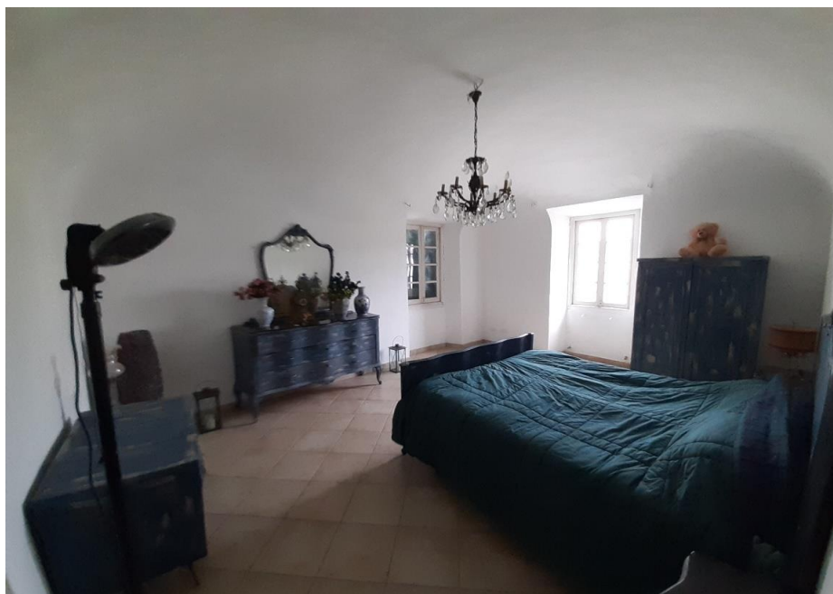
Camere al Piano primo