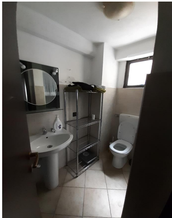
Servizio igienico - P1