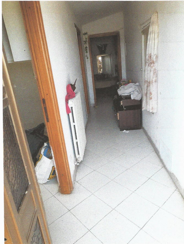
Foto 21. Fabbricato Rif.2 disimpegno