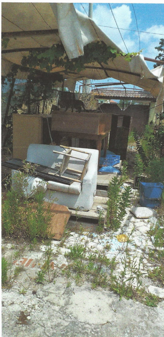
Foto 15. Ingresso area cortilizia Fabbricato Rif.2