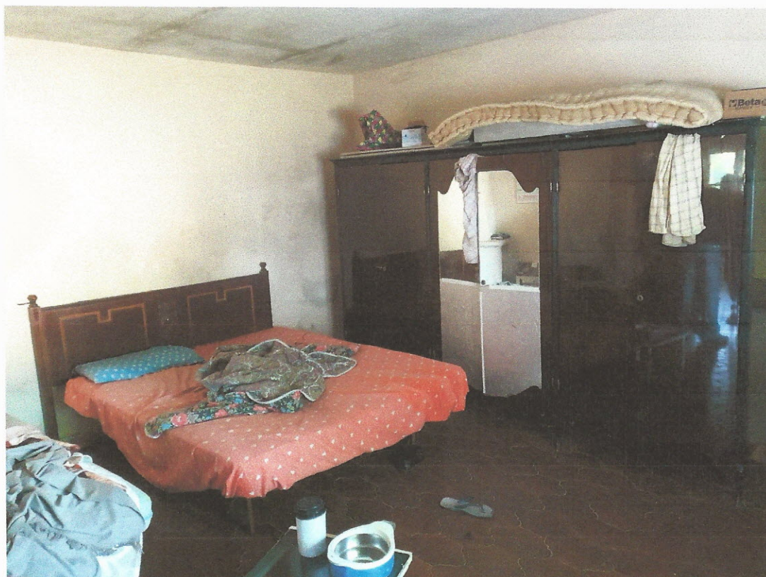
Foto 11. Fabbricato Rif.1- CAMERA DA LETTO