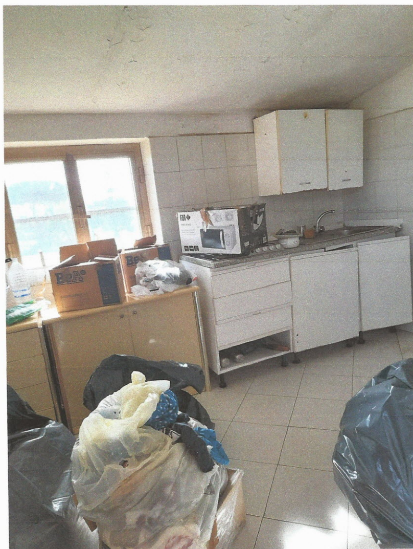
Foto 17. Fabbricato Rif.2 Cucina