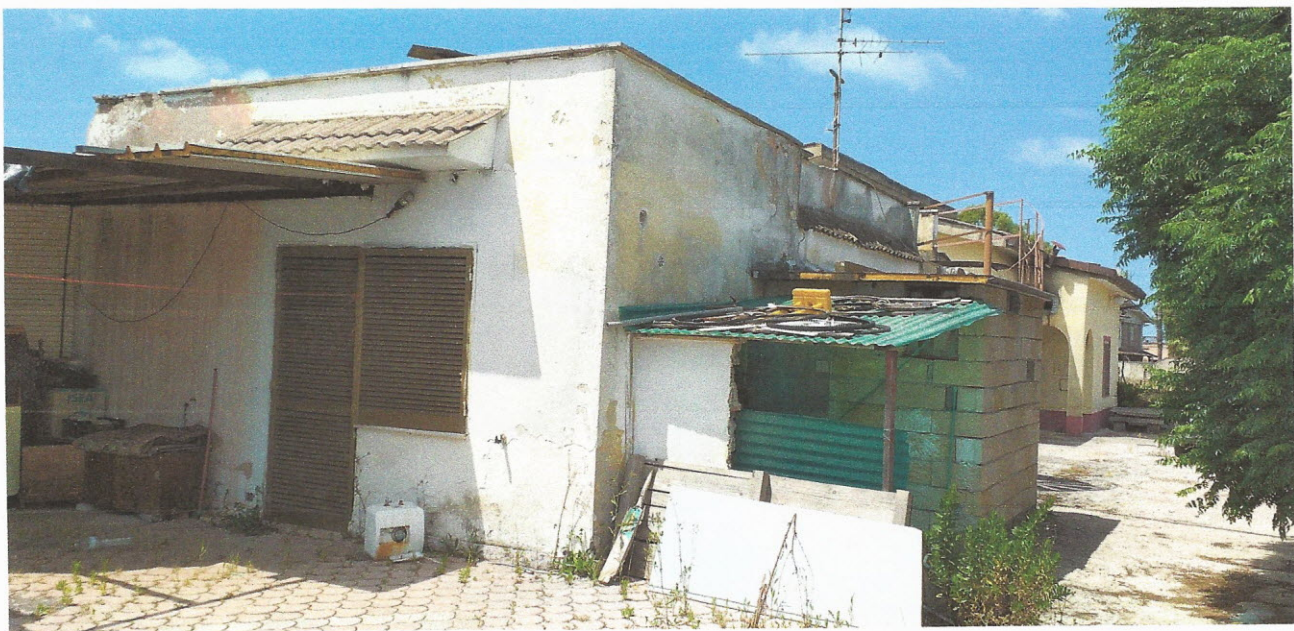
Foto 4. Ingresso fabbricato Rif.1