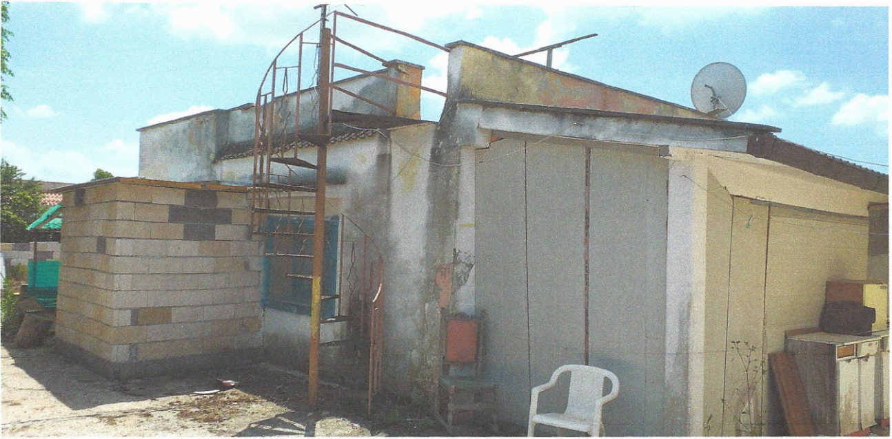
Foto 5. Prospetto frontale fabbricato Rif.1