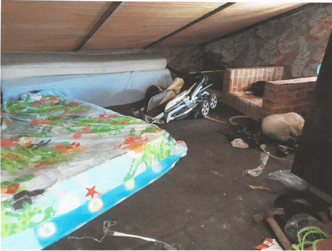
Foto 20. Fabbricato Rif.2 Sottotetto