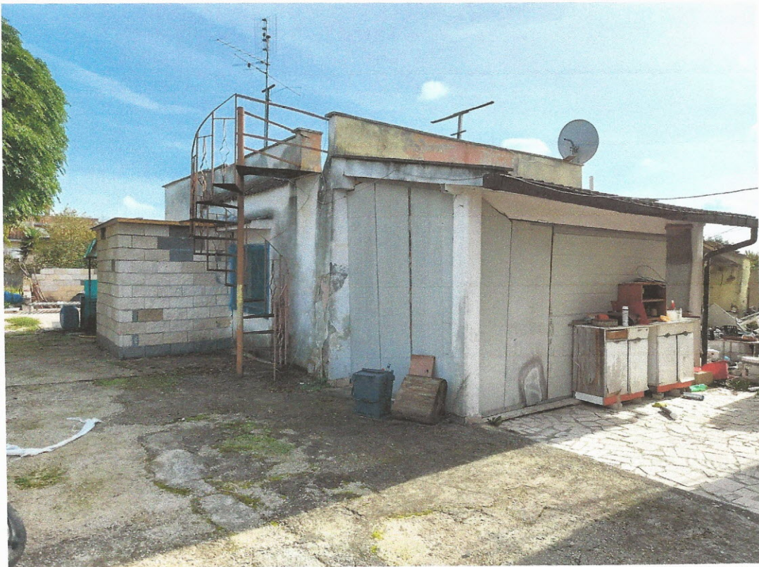
Foto 6. Fabbricato Rif.1