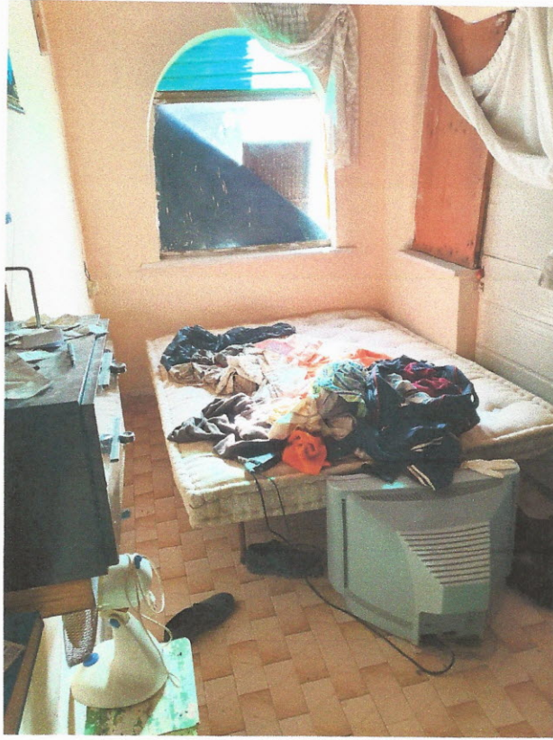
Foto 12. Fabbricato Rif.1- CAMERA DA LETTO