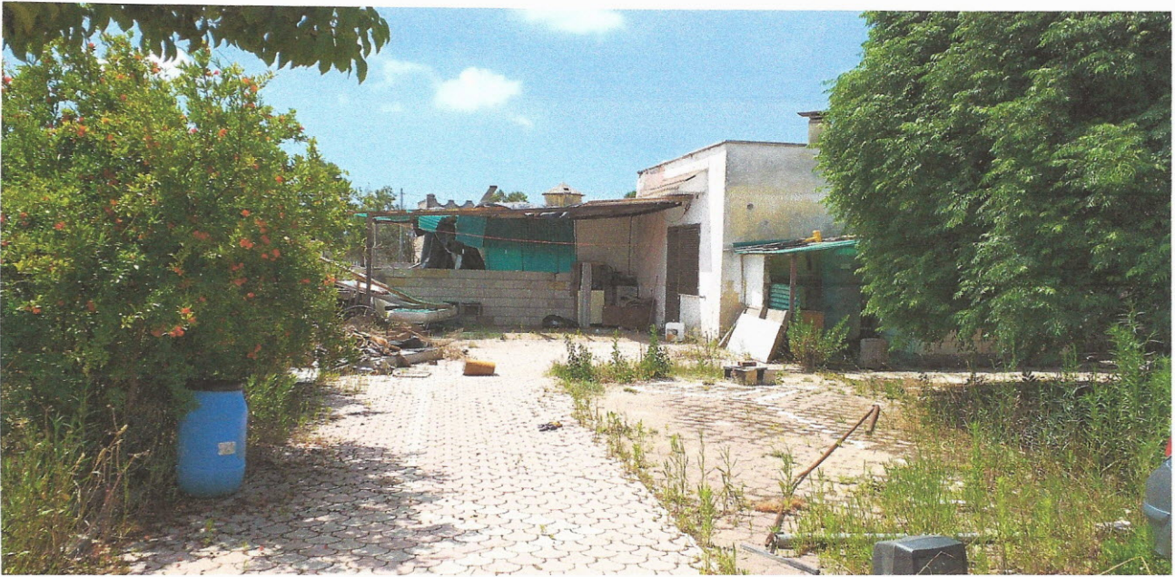
Foto 3. Ingresso area cortilizia Fabbricato Rif.1