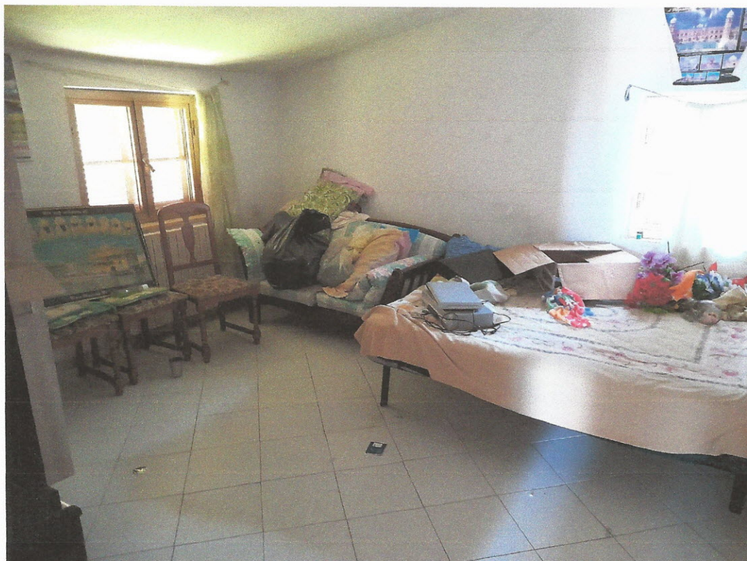
Foto 19. Fabbricato Rif.2 Camera letto