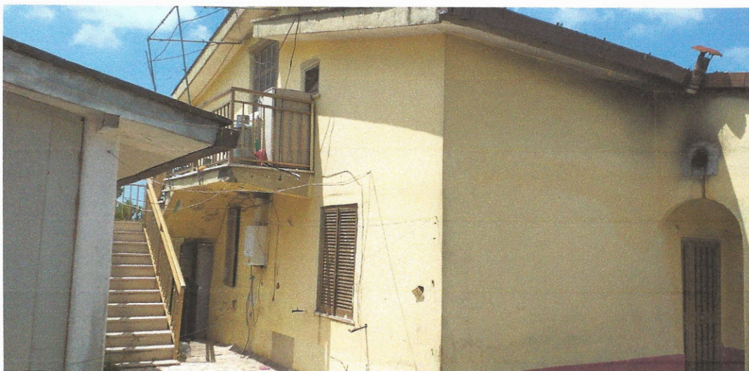
Foto 16. Fabbricato Rif.2 Scala di accesso