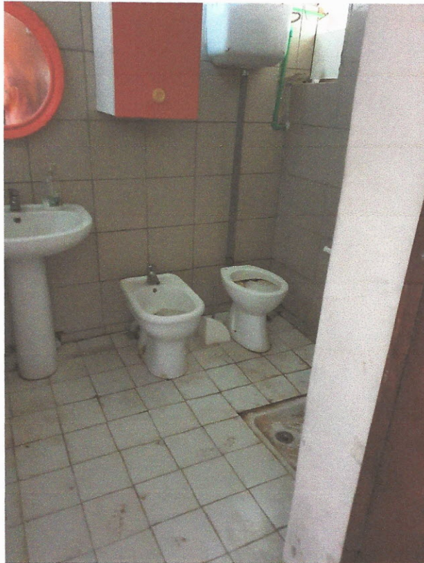
Foto 13. Fabbricato Rif.1- SERVIZIO IGIENICO