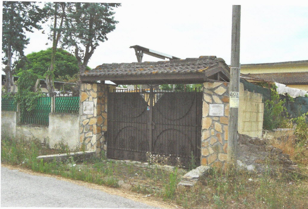
Foto 14. Ingresso Fabbricato Rif.2