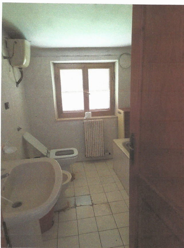
Foto 18. Fabbricato Rif.2 Servizio Igienico