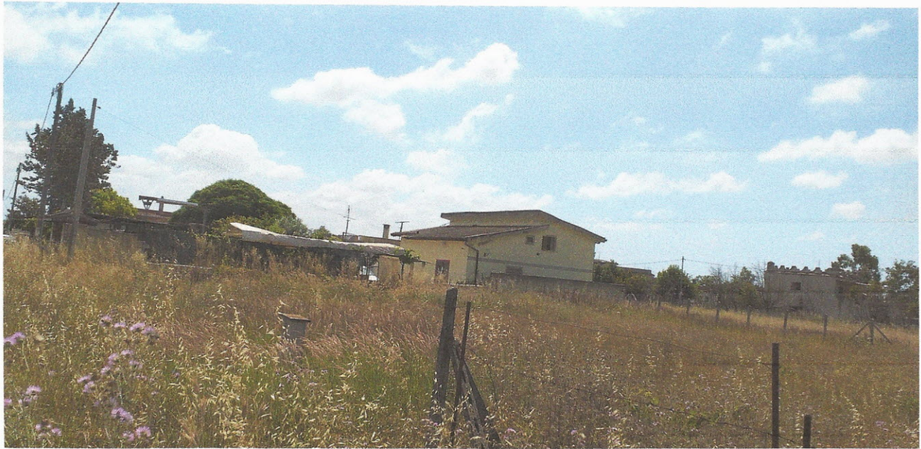
Foto 1. Retro fabbricato