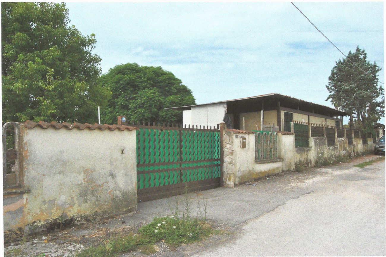
Foto 2. Ingresso Fabbricato Rif.1