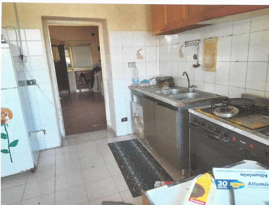
Foto 10. Fabbricato Rif.1- CUCINA