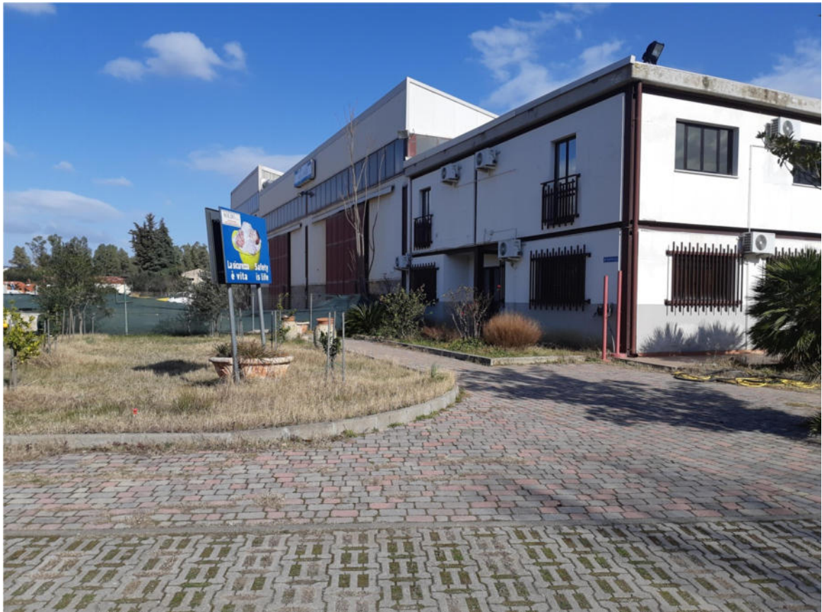
Figura 3: Capannone e Corpo Uffici