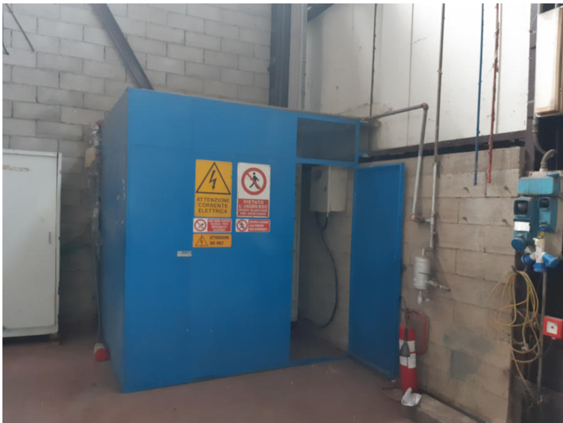
Figura 25: Cabina interna Quadro Elettrico