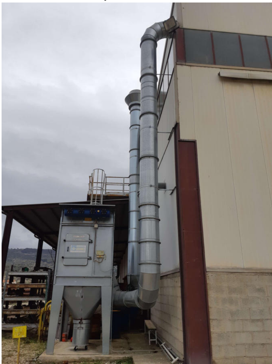
Figura 23: Macchina esterna sul fronte N-O