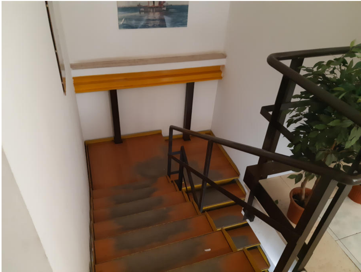
Figura 11: Scala di collegamento Corpo Uffici