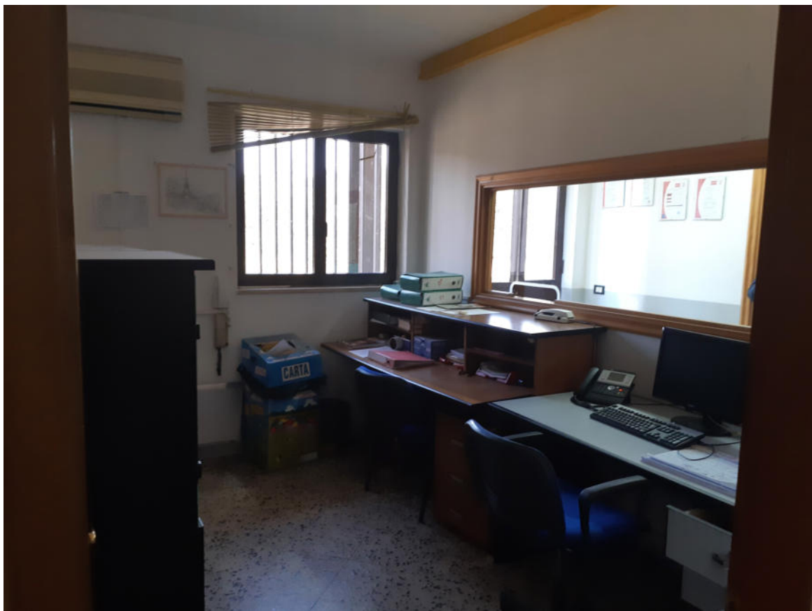
Figura 16: Ingresso Corpo Uffici