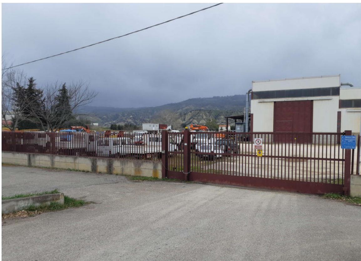
Figura 2: Accesso allo stabilimento. Area parcheggio mezzi