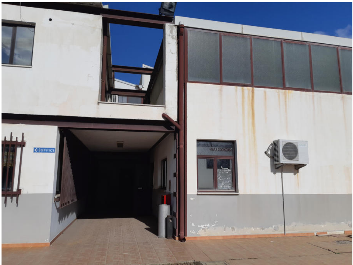
Figura 4: Accesso sud Corpo Uffici e Zona Ristoro- Magazzino