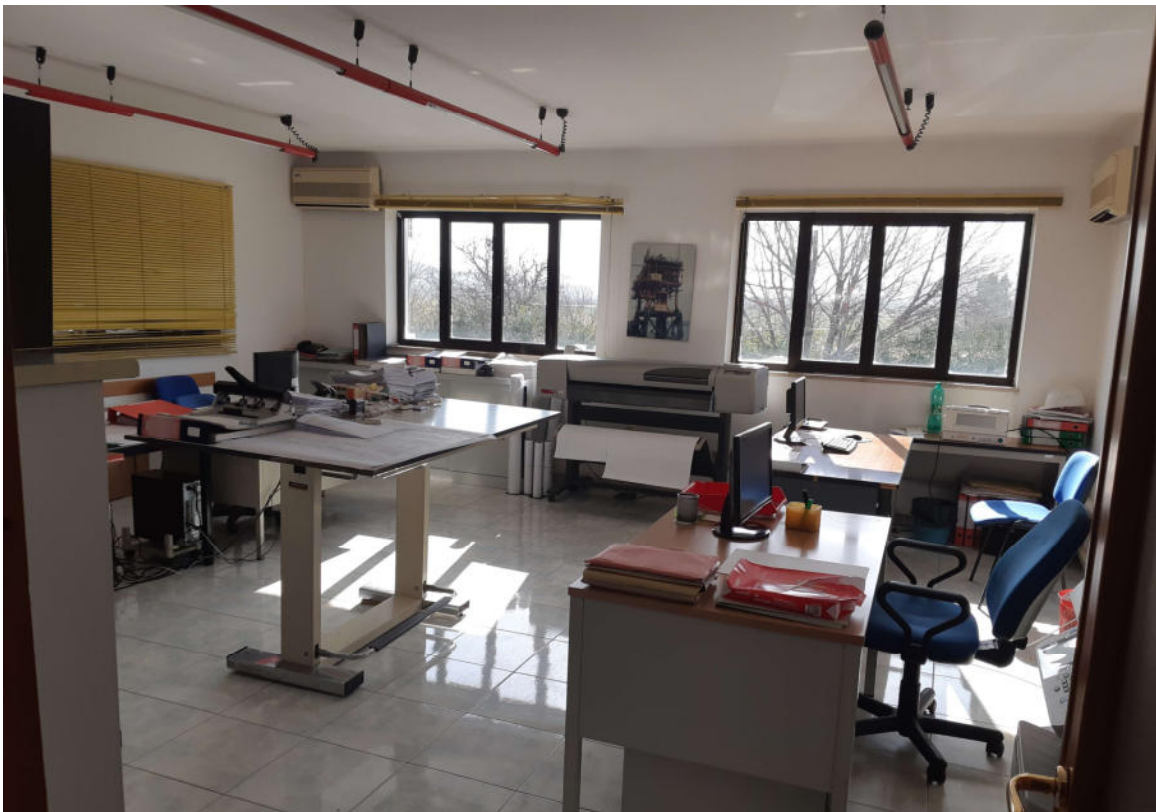
Figura 10: Interno Corpo Uffici