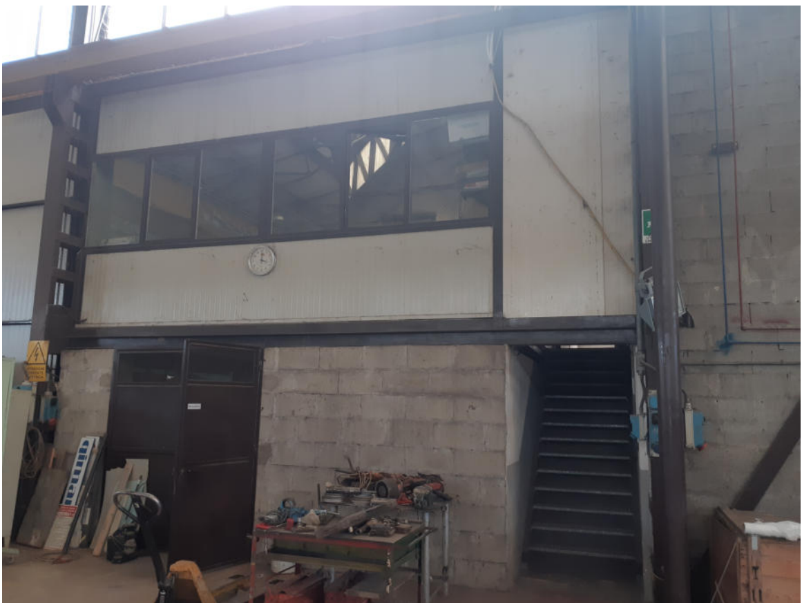
Figura 20: Interno Capannone