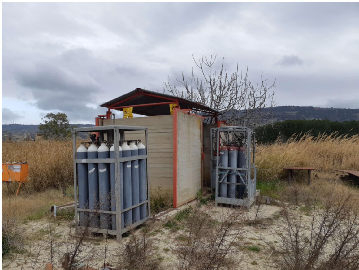
Figura 6; Deposito Gas Tecnici