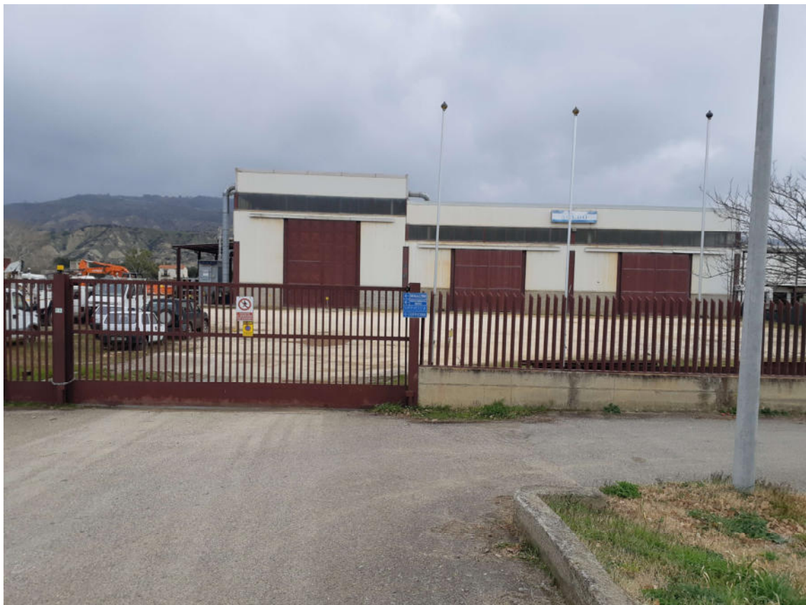
Figura 1. Accesso allo stabilimento