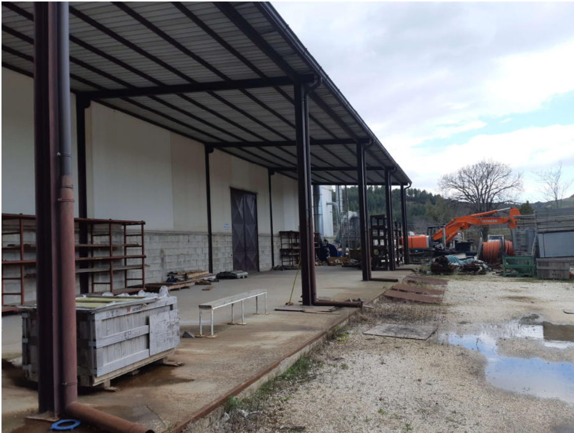
Figura 7: Tettoia afferente al capannone ubicata sul fronte N-O