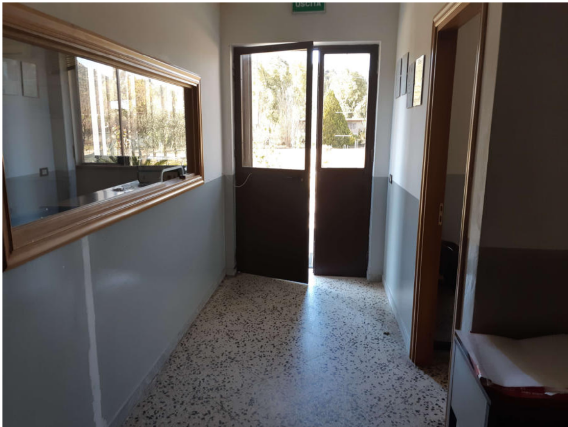
Figura 12: Ingresso Corpo Uffici