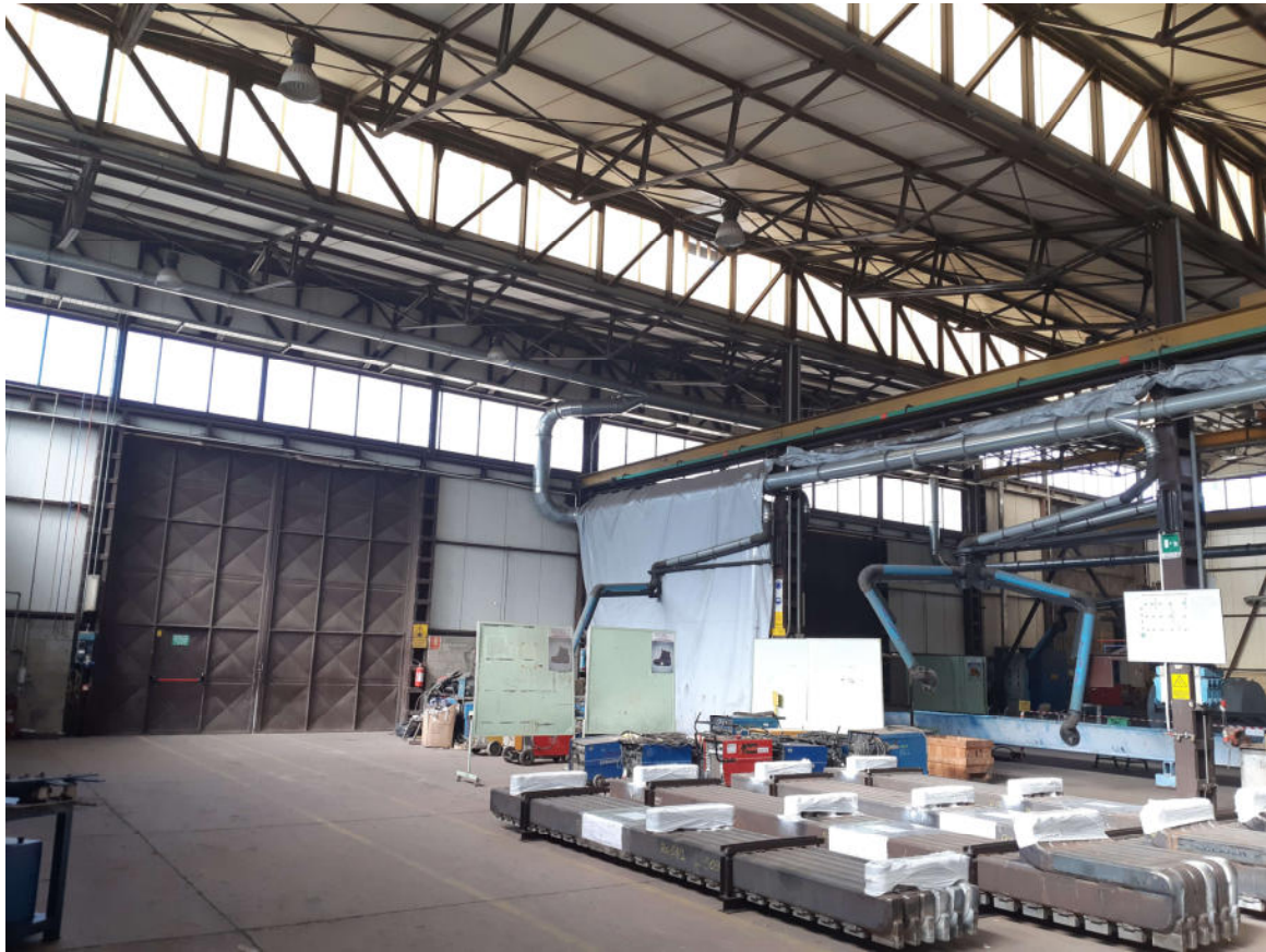
Figura 17: Interno Capannone