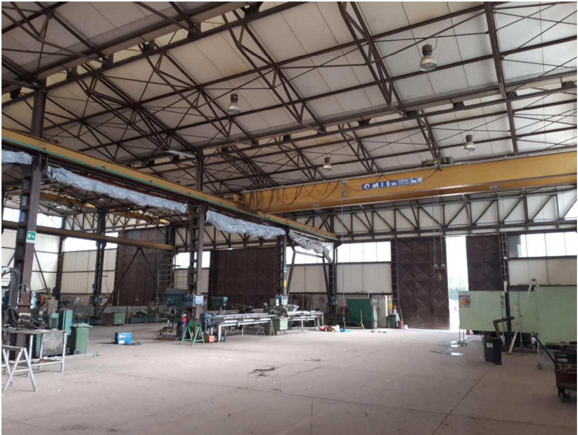
Figura 19: Interno Capannone