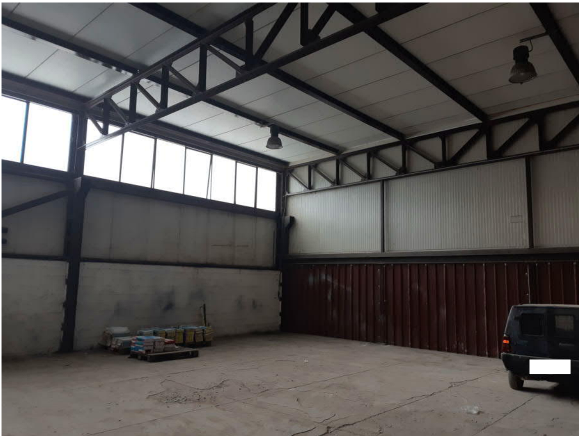
Figura 22: Interno Capannone