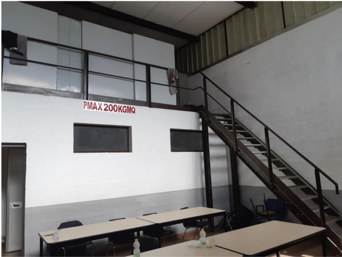
Figura 15: Interno Zona Ristoro a doppia altezza