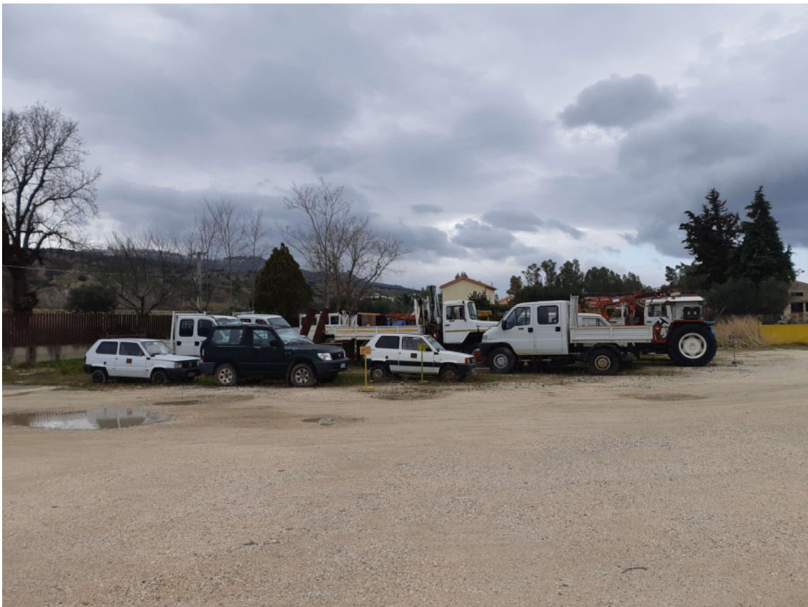
Figura 8: Area Parcheggio mezzi