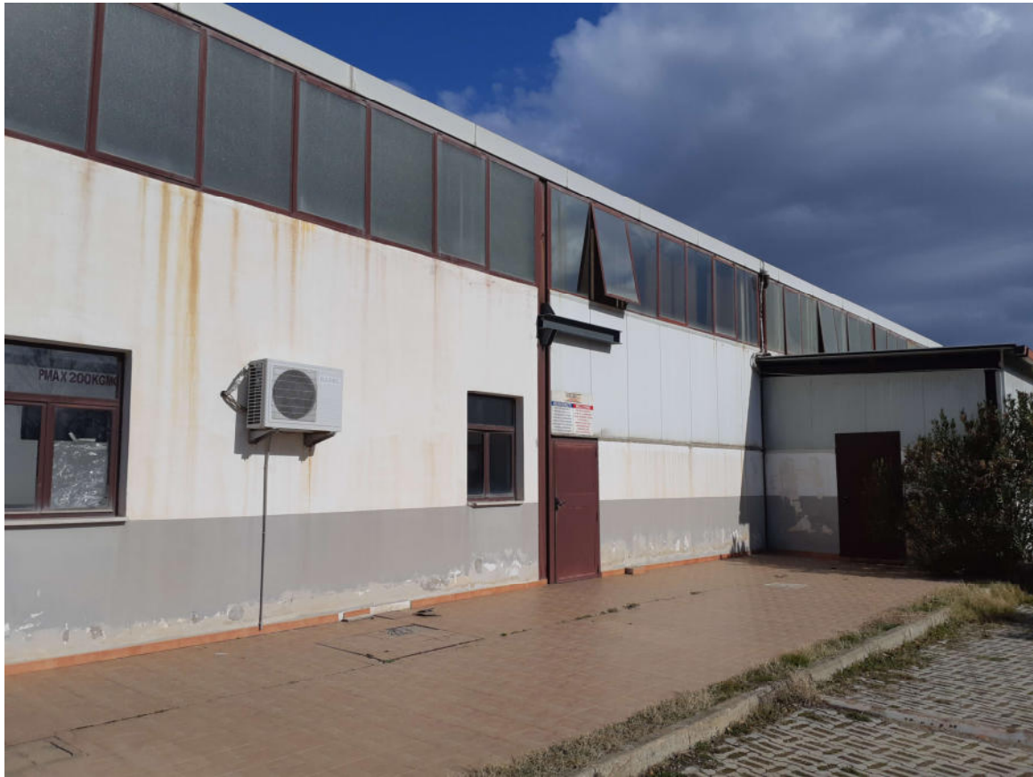
Figura 5: Corpo Magazzino e Blocco Archivio