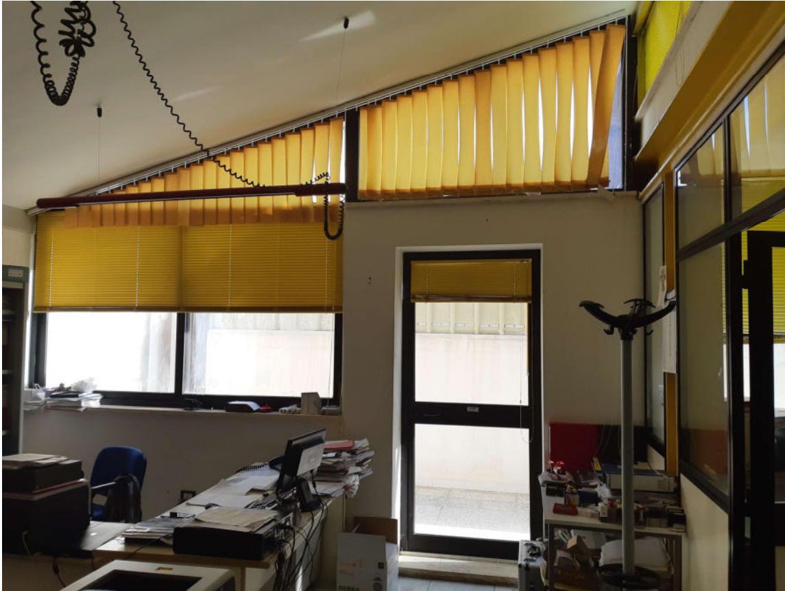
Figura 9: Interno Corpo Uffici