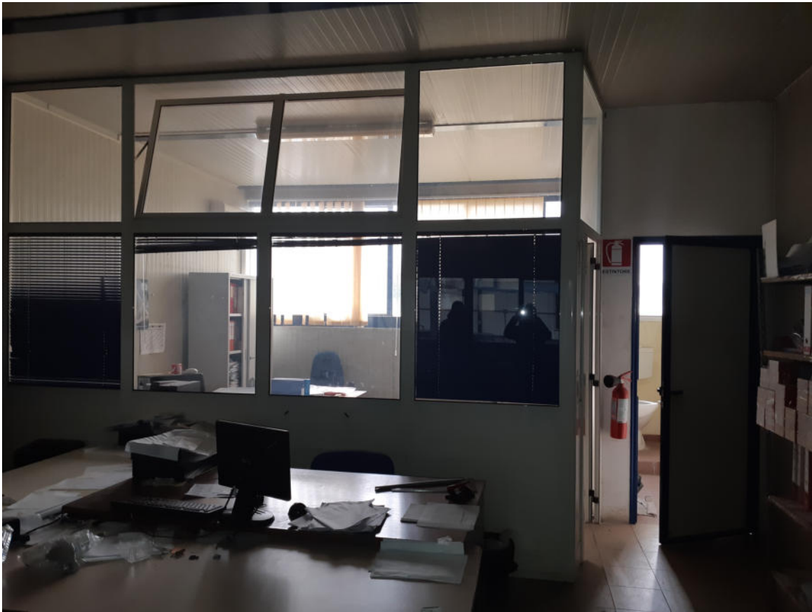
Figura 21: Interno Uffici