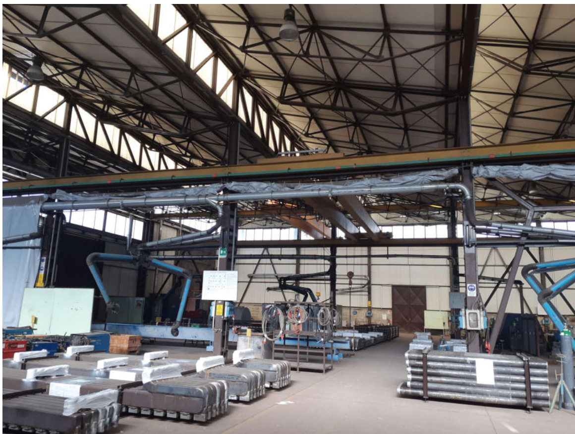
Figura 18: Interno Capannone