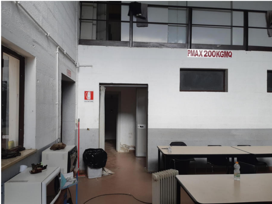
Figura 13: Interno Zona Ristoro a doppia altezza