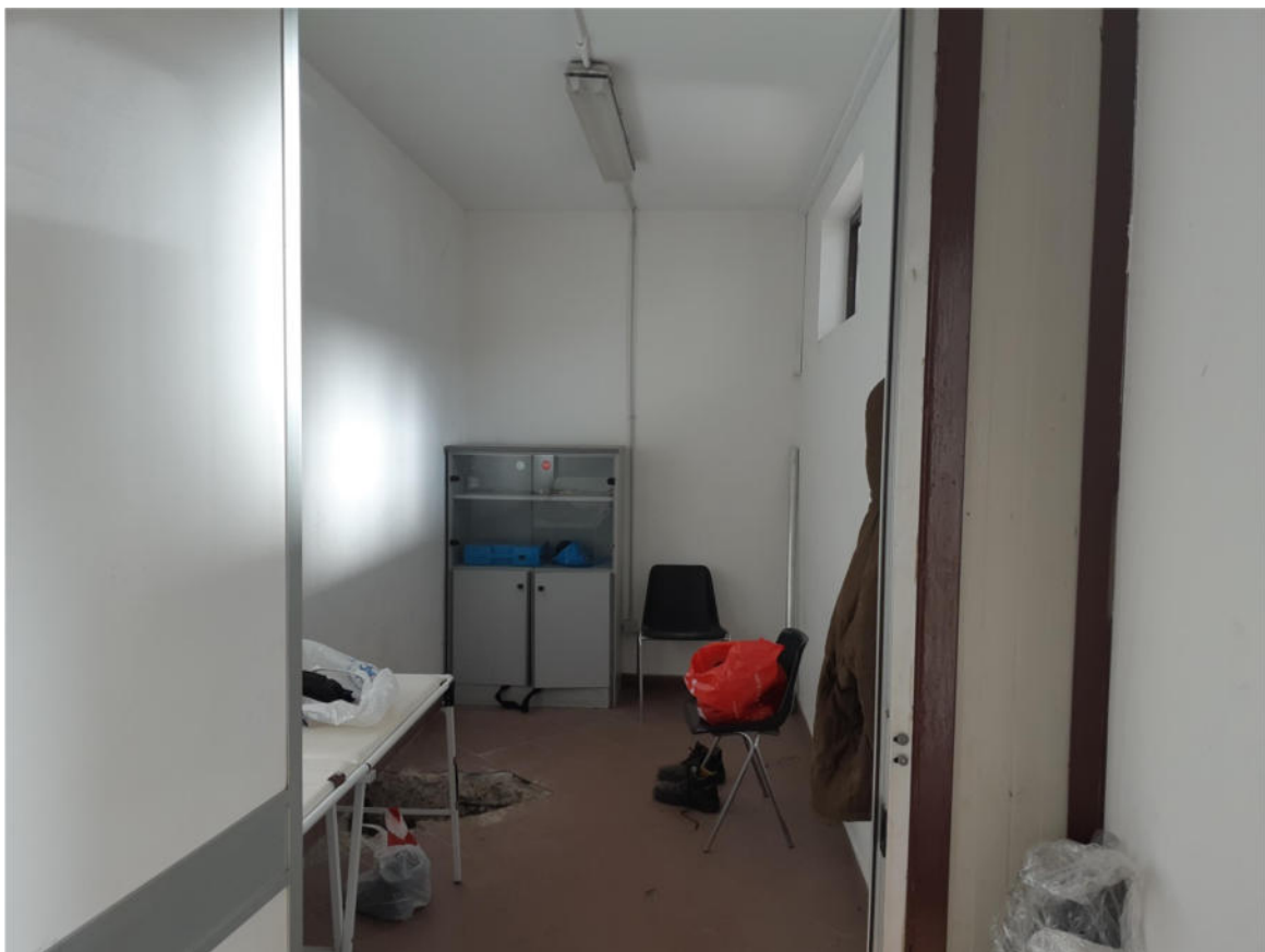
Figura 14: Interno Corpo Ristoro- Magazzino