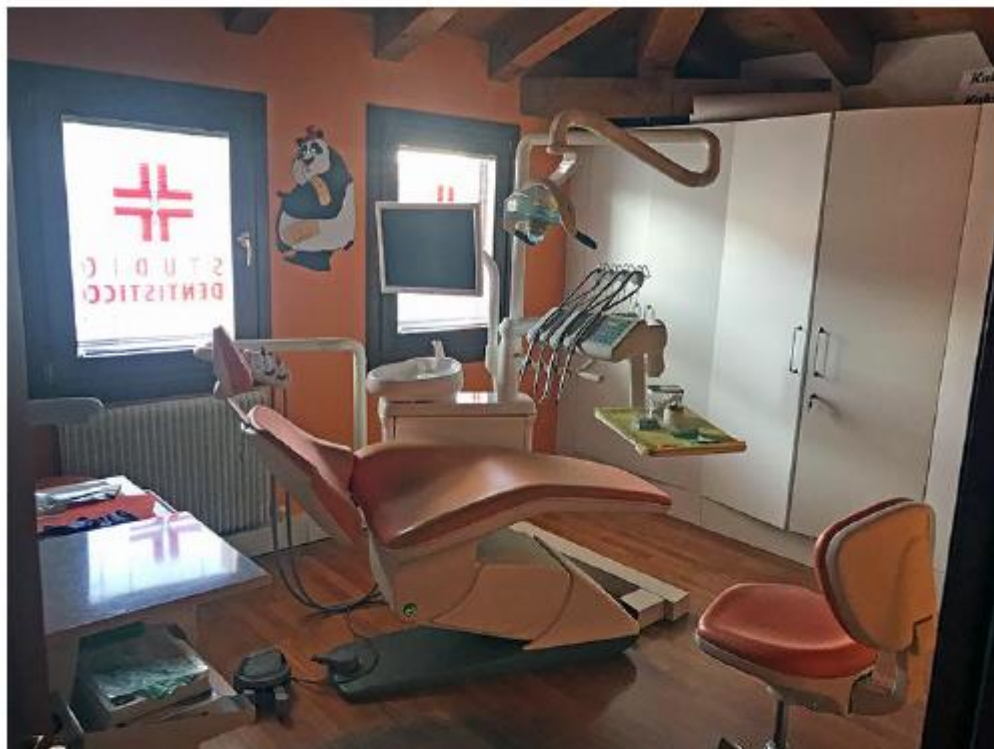
Studio dentistico Sub 59,60 – La prima sala operativa.