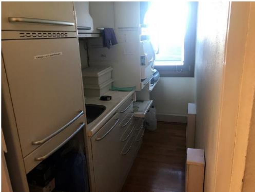
Studio dentistico Sub 59,60 – La sala sterile.