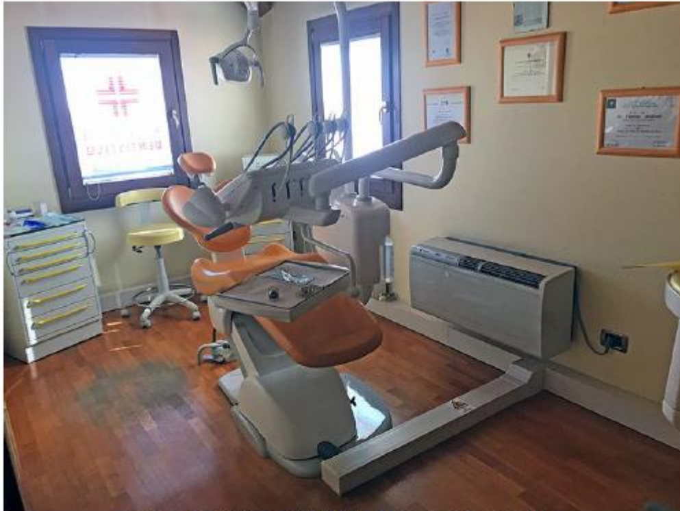
Studio dentistico Sub 59,60 – La terza sala operativa.