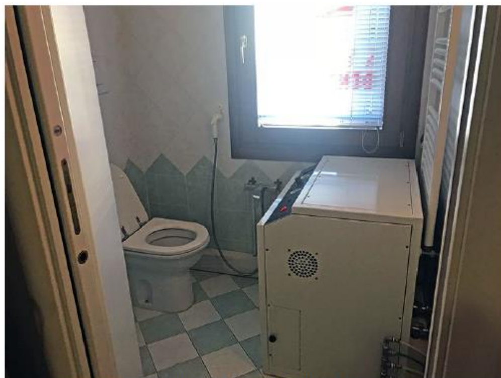
Studio dentistico Sub 59,60 – Il bagno del personale.