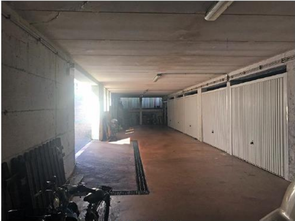
I box auto interrati.