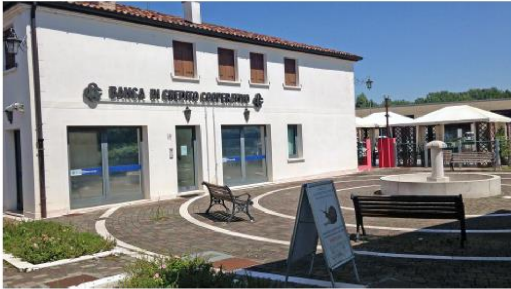
Fabbricato Ex Sildomus – Foto 01 esterno lato sud