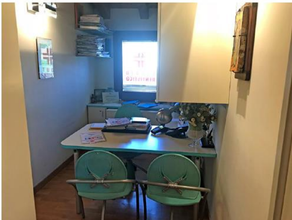
Studio dentistico Sub 59,60 – La sala adibita ad amministrazione.