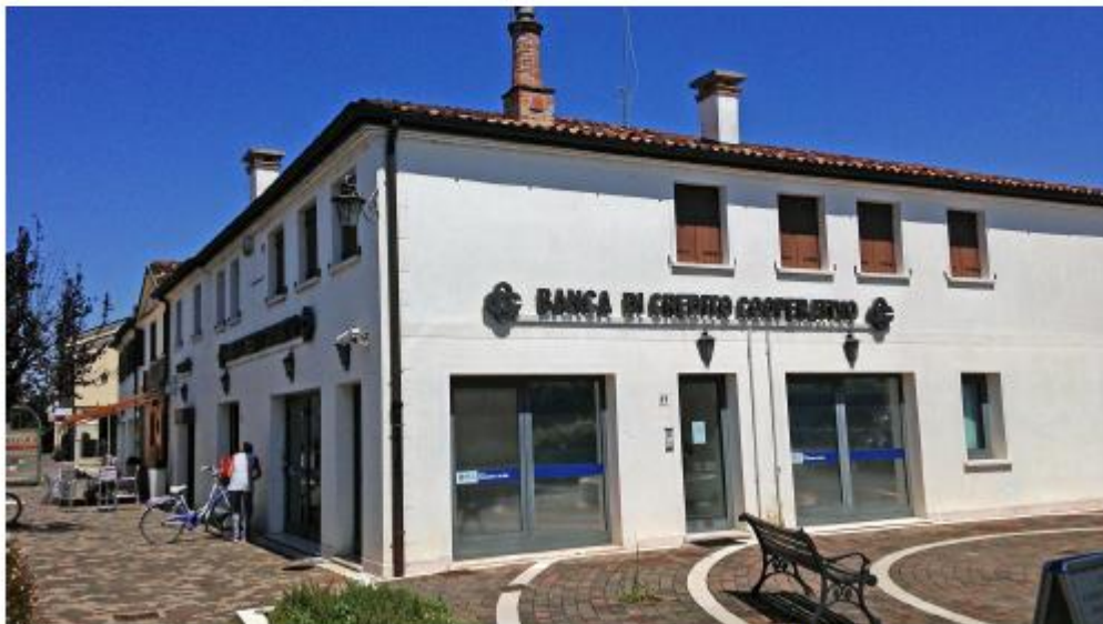
Fabbricato Ex Sildomus – Foto 02 esterno angolo sud-ovest