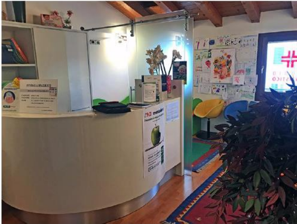
Studio dentistico Sub 59,60 – La sala d'attesa ed ingresso.