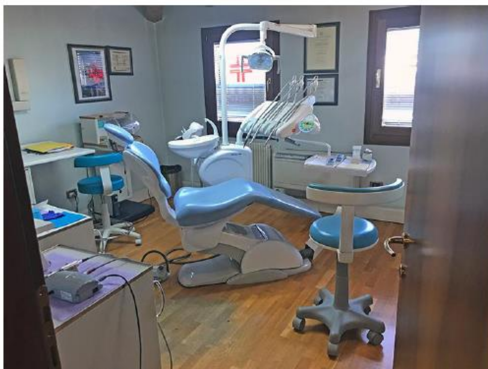
Studio dentistico Sub 59,60 – La seconda sala operativa.