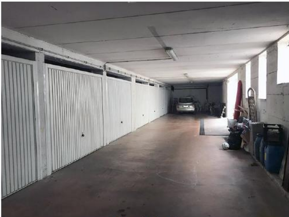
I box auto interrati.