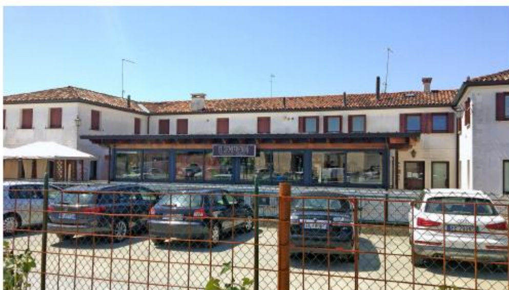
Fabbricato Ex Sildomus – Foto 04 esterno lato est