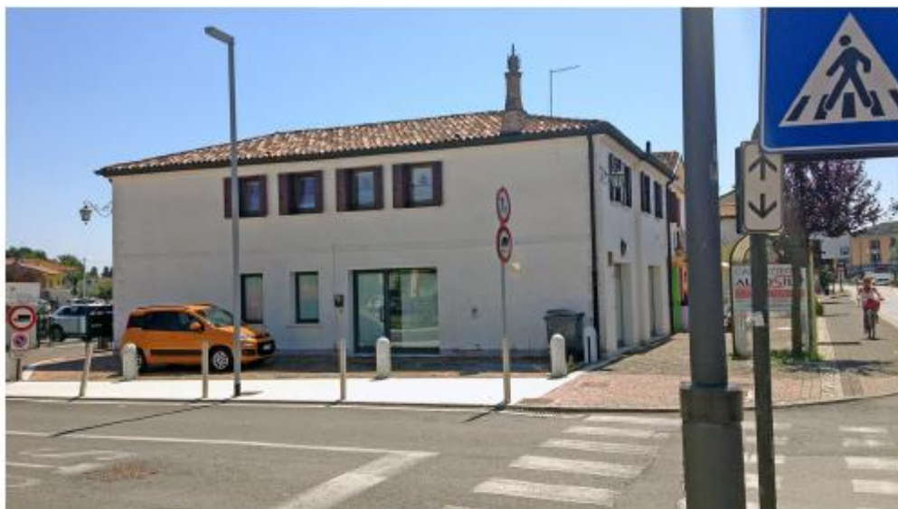
Fabbricato Ex Sildomus – Foto 03 angolo nord-ovest