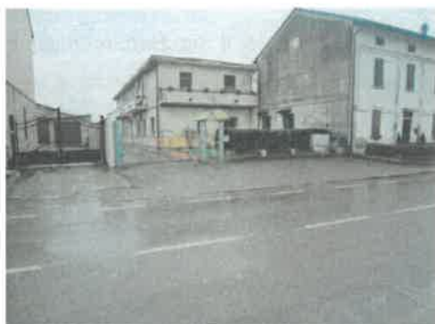
Vista fabbricato dalla Via Piave

Il fabbricato ha un accesso pedonale e carrale al civ 14 dalla Via Piave e attraversando un cortile comune si raggiunge il vano scala comune che consente di accedere all'appartamento oggetto della procedura posto al piano terra. Il lotto in cui è collocato l'edificio è delimitato dalla viabilità pubblica e dalle altre proprietà da recinzioni/edifici in aderenza.