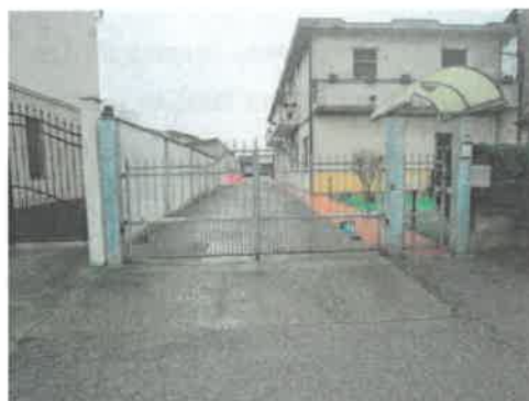
Vista ingresso carrale/pedonale e cortile comune dalla Via Piave