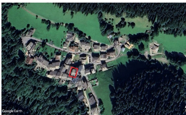
LOTTO 1 – Appartamento trilocale a Vilminore