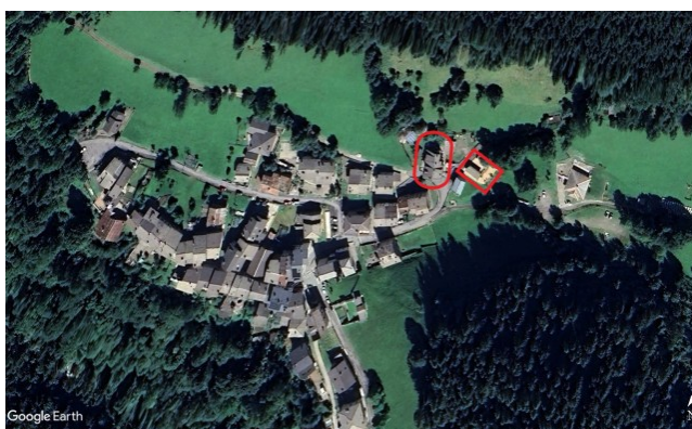
LOTTO 3 – Appartamento con quote di 1/3 di terreni e autorimesse indivise a Vilminore