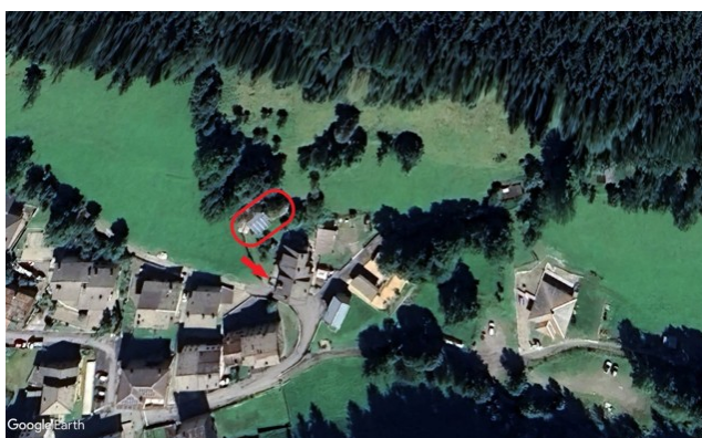
LOTTO 4 – Quote di 1/3 di magazzino/deposito e box doppio a Vilminore, fraz. Nona